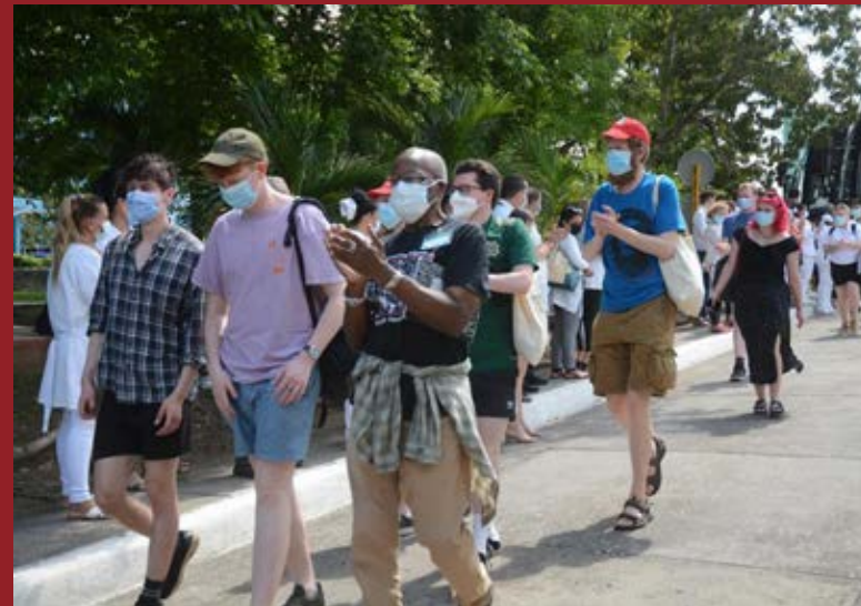
La visita de la brigada a Sancti Spíritus incluyó una donación de insumos y material gastable al Hospital General Provincial Camilo Cienfuegos.

Algunas sumaron el sábado a la convocatoria, para materializar varias iniciativas, como las donaciones de sangre masivas en Guantánamo, donde también tuvo lugar la esperada Carrera caminata Primero de Mayo–Girón, en tanto los bayameses realizaron la caminata Por la Victoria.