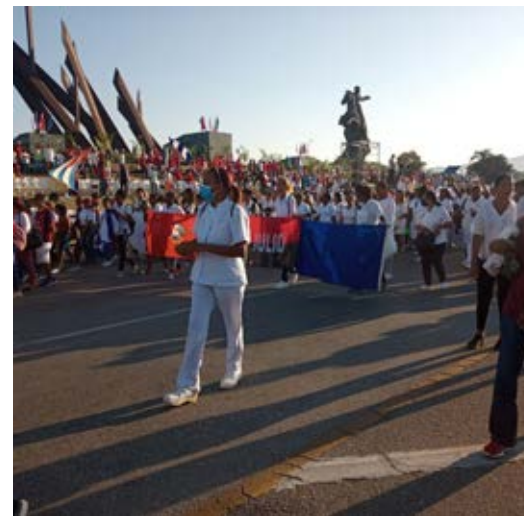
Santiago de Cuba recordó el Día del Proletariado Mundial y el aniversario 70 de los asaltos a los cuarteles Moncada y Carlos Manuel de Céspedes.