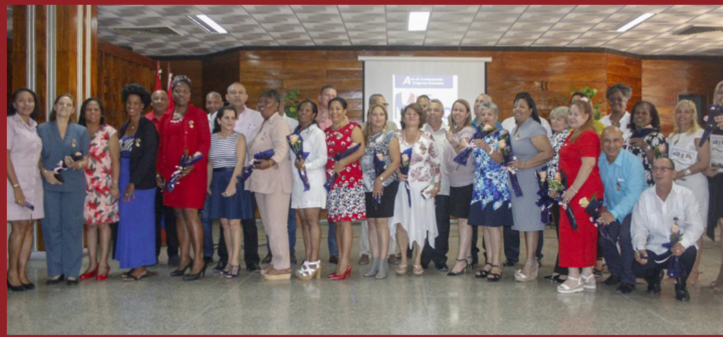
Treinta y cuatro dirigentes sindicales recibieron el reconocimiento del Secretariado Nacional de la Central de Trabajadores de Cuba.