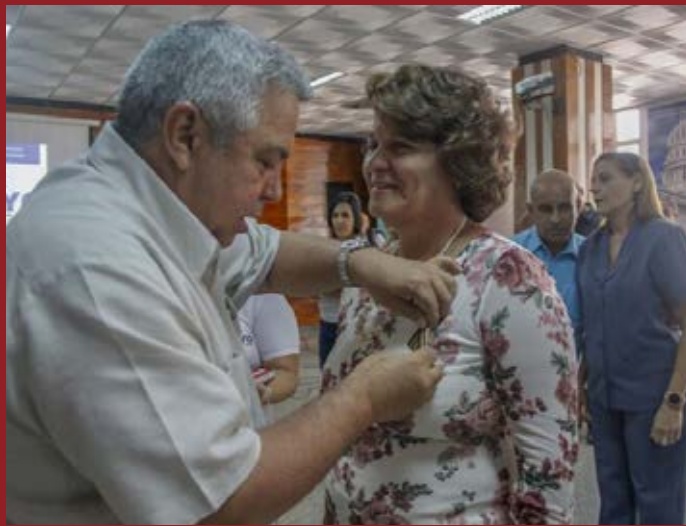
El reconocimiento a la entrega y a la ejemplaridad.