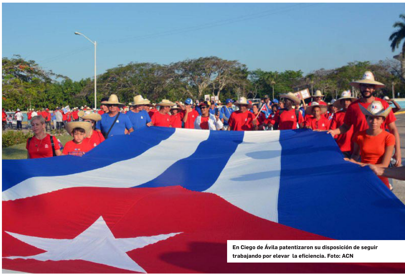
En Ciego de Ávila patentizaron su disposición de seguir trabajando por elevar la eficiencia.