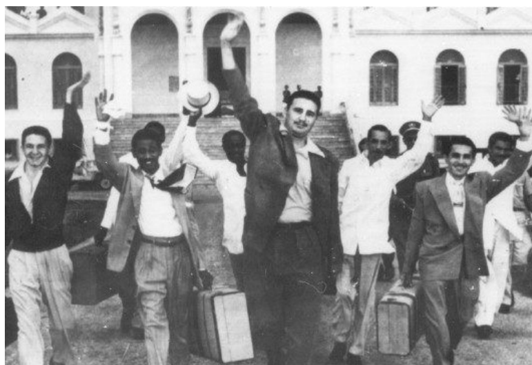
El 15 de mayo de 1955 Fidel Castro y otros 29 prisioneros en el Reclusorio Nacional para Hombres de Isla de Pinos fueron puestos en libertad gracias a la presión popular. Una foto recoge el histórico momento en que descenden los escalones de la dirección del penal, saludando con los brazos en alto, y en los rostros, sonrisas de triunfo.

*Alina Martínez Triay, periódico Trabajadores, 25/07/2019.