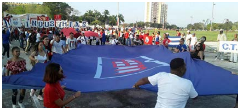
Las organizaciones estudiantiles también fueron protagonistas en la fiesta del proletariado en Holguín.