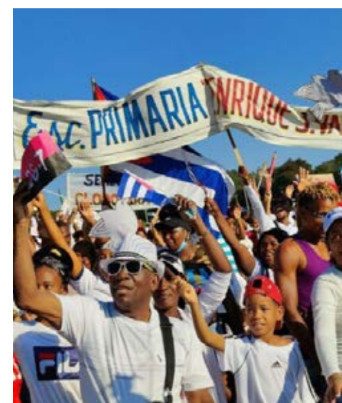
Los guantanameros dieron su Sí por la Revolución.