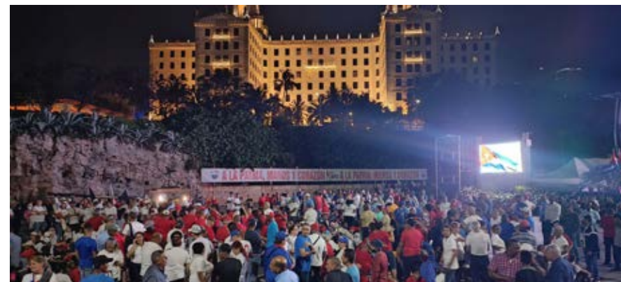
De madrugada, miles de capitalinos se concentraron en el litoral habanero.