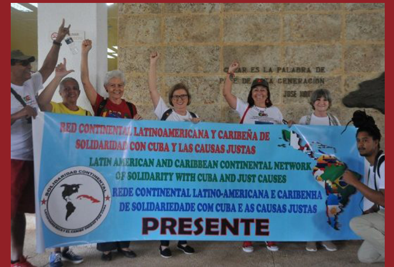
Más de 300 representantes de 29 países tuvo la XVI Brigada Internacional Primero de Mayo de Trabajo Voluntario.