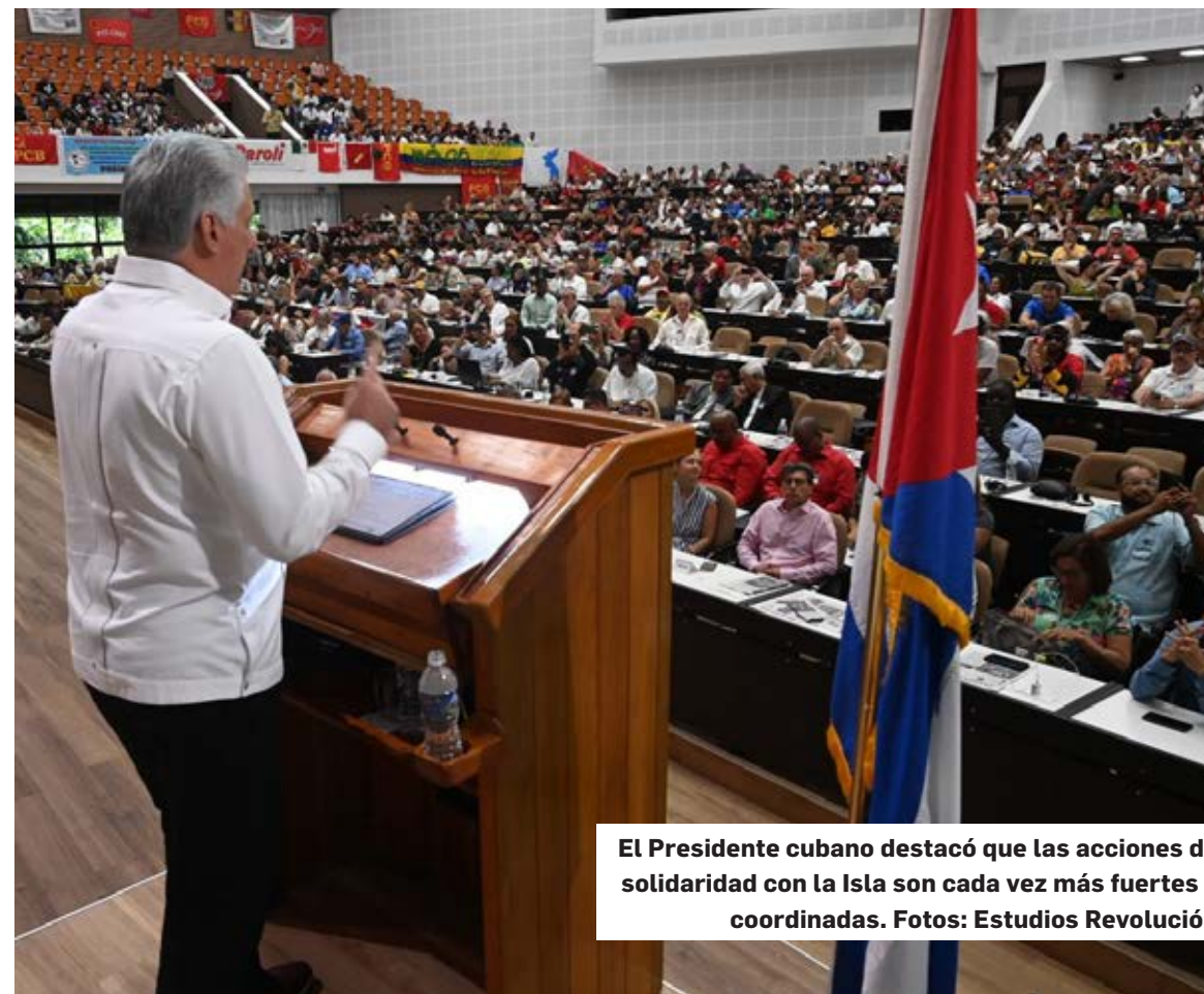
El Presidente cubano destacó que las acciones de solidaridad con la Isla son cada vez más fuertes y coordinadas.