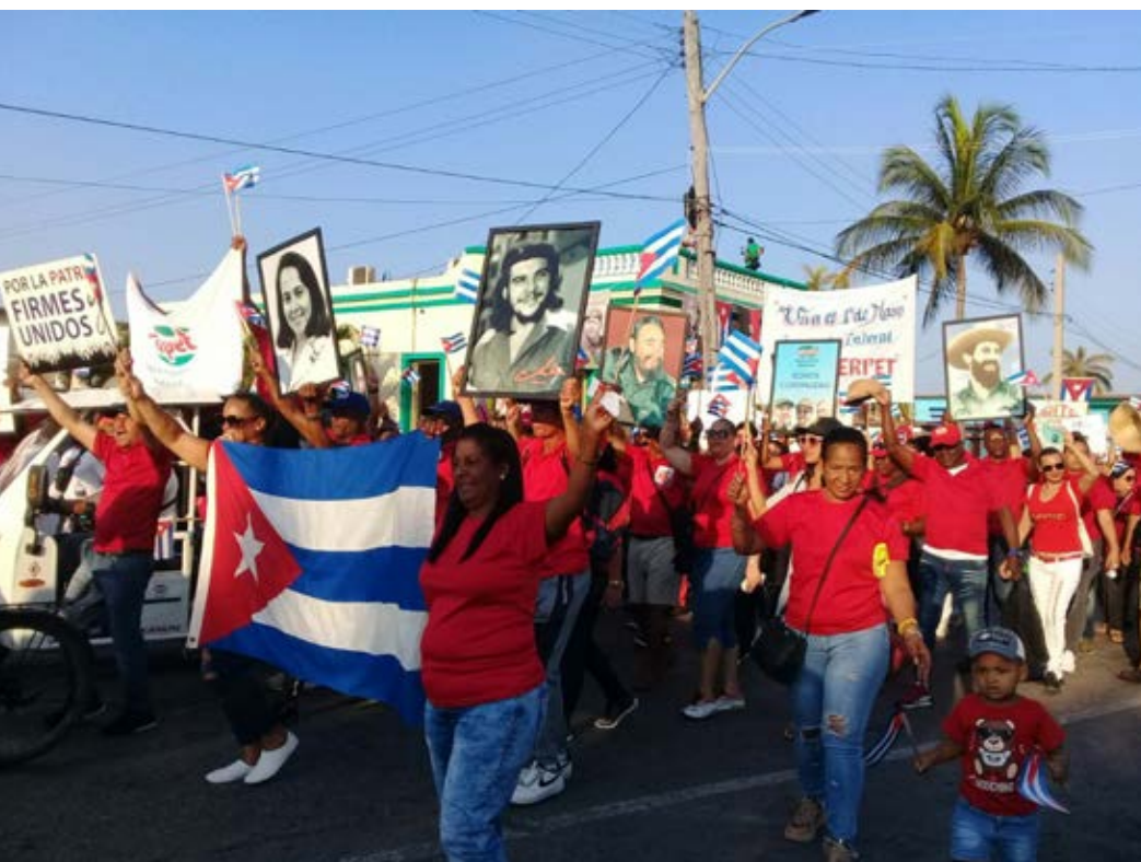
En Matanzas desfilaron más de mil 200 trabajadores, encabezados por el estratégico sector de Energía y Minas.