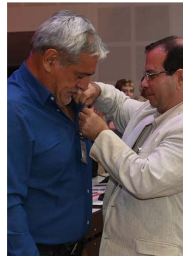
La Medalla de la Amistad fue conferida por el presidente del Instituto Cubano de Amistad con los Pueblos a varios dirigentes sindicales extranjeros.