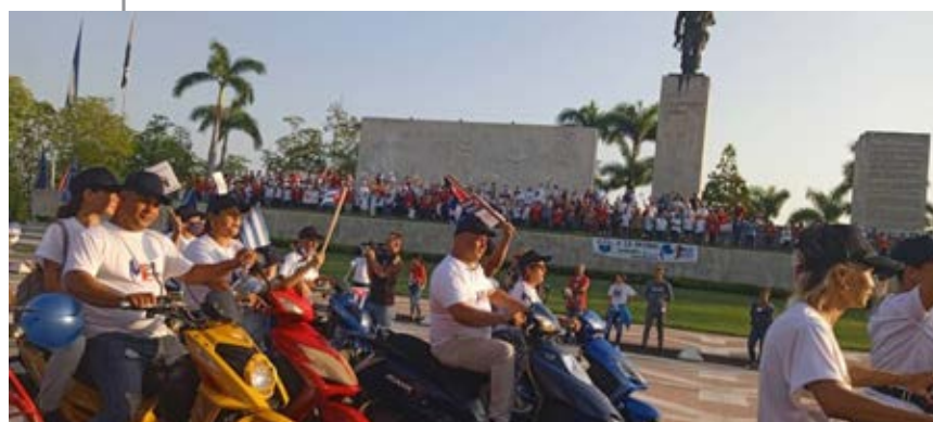
No faltaron las iniciativas en la Plaza del Che.