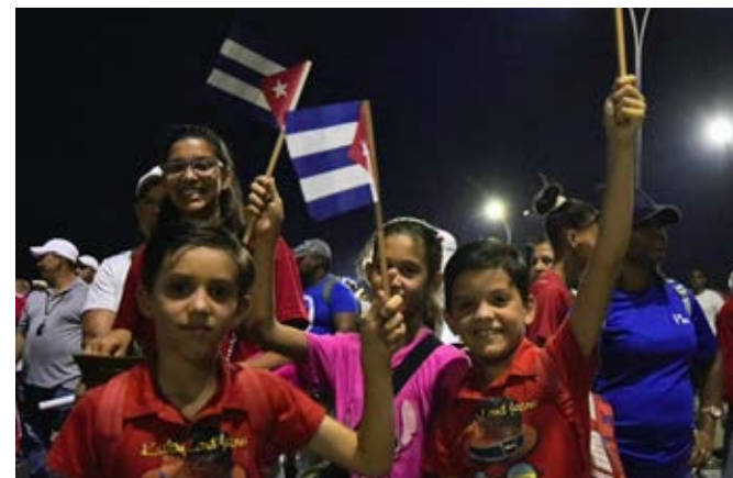
Mujeres, jóvenes y niños de cinco municipios habaneros asistieron a la fiesta del proletariado.