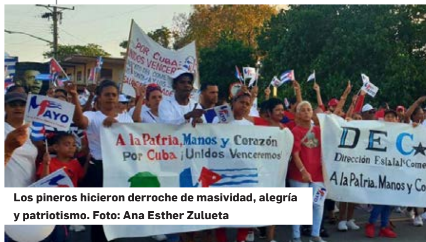
Los pineros hicieron derroche de masividad, alegría y patriotismo.