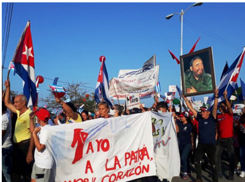
Organizados y alegres marcharon los tuneros por la plaza Mayor General Vicente García.