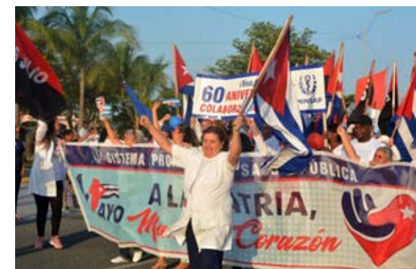
Con pancartas, lemas y coros los cienfuegueros llenaron sus calles principales.