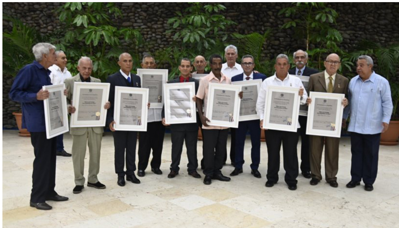
El Presidente cubano, Miguel Díaz-Canel Bermúdez y Ulises Guilarte de Nacimiento, secretario general de la CTC, junto a los condecorados con el título de Héroes del Trabajo de la República de Cuba.

Por sus extraordinarios méritos laborales, once cubanos merecieron el Título Honorífico de Héroe del Trabajo de la República de Cuba: