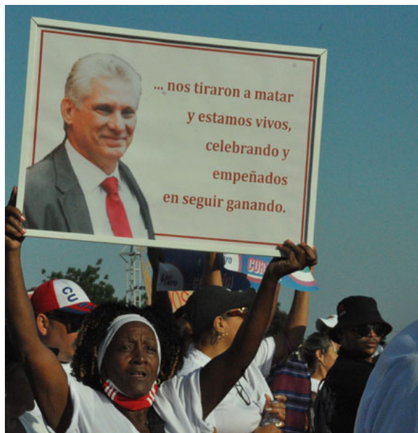
Los granmenses expusieron su fidelidad y compromiso.