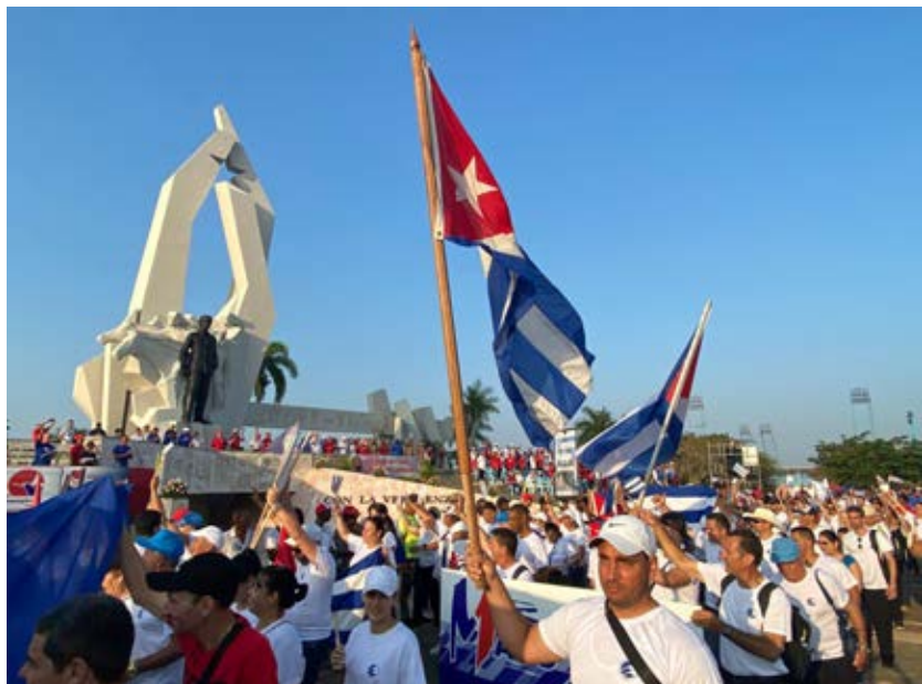
Masiva movilización de los camagüeyanos en otro momento histórico.