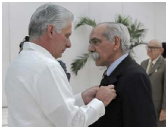
Por sus extraordinarios méritos laborales, once cubanos merecieron tan alto reconocimiento.