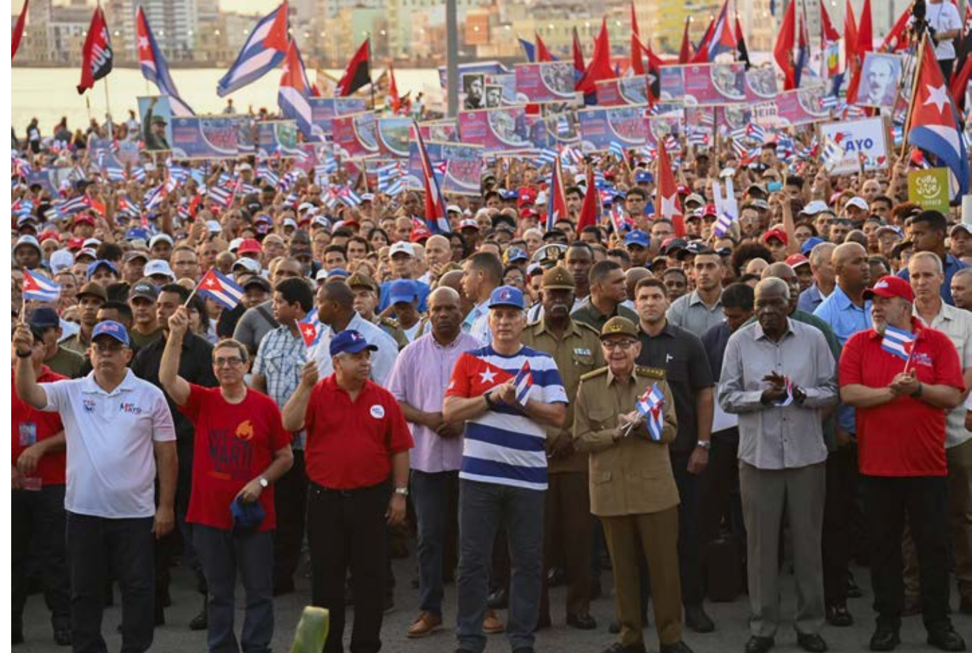
El General de Ejército Raúl Castro Ruz y el Presidente cubano Miguel Díaz-Canel Bermúdez encabezaron el acto en la capital, junto a otros dirigentes del Partido y el Gobierno.