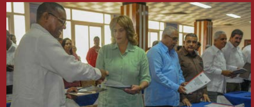
Ante la presencia de Manuel Marrero Cruz, Primer Ministro de la República, y del secretario general de la CTC, Ulises Guilarte de Nacimiento, ambos miembros del Buró Político del PCC, los máximos dirigentes de los sindicatos nacionales y los titulares de los organismos de la Administración Central del Estado, firmaron los Lineamientos Generales para los convenios colectivos de trabajo, base normativa para desencadenar la negociación hasta cada centro laboral.

El aporte sin límites de hombres y mujeres como ustedes, sus méritos y conducta ejemplar, han mantenido vivas las tradiciones, la esencia clasista, solidaria, martiana, fidelista y revolucionaria de nuestra gloriosa central obrera y sus sindicatos junto a la inmensa obra de heroísmo de los trabajadores cubanos, afirmó Ismael Drullet Pérez, integrante del Secretariado Nacional de la CTC, al pronunciar las palabras centrales del acto.