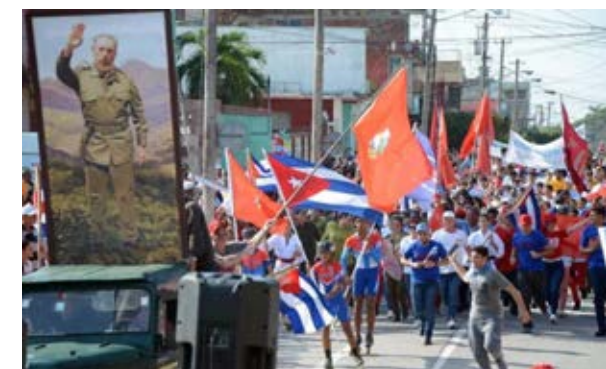
La juventud espirituana cerró el desfile en la plaza Mayor General Serafín Sánchez Valdivia.