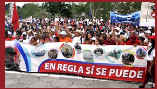
La Habana inició las celebraciones provinciales por el 1º de Mayo, con la realización en la histórica Colina Lenin, en el municipio de Regla, del acto conmemorativo por el aniversario 153 del natalicio del guía y conductor de la Gran Revolución Socialista de Octubre.