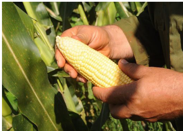
Resulta vital para el país incrementar la producción de alimentos.

– Combatir todo tipo de discriminación y corrupción: Hay que enfrentar cualquier tipo de discriminación (sexual, racial, etc), pero también