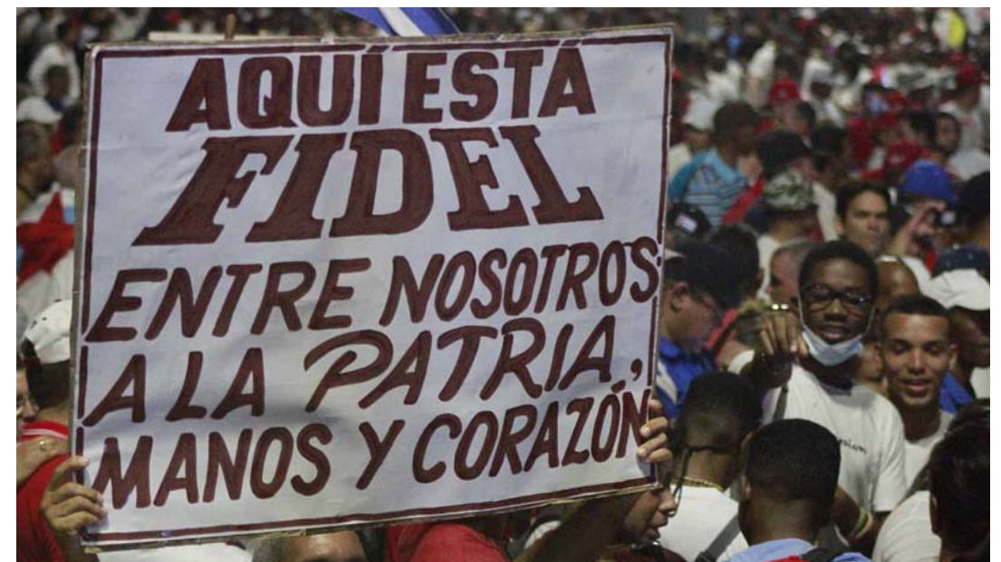
Los cubanos, como lo ha reconocido nuestra historia a lo largo de tantos años, jamás nos rendiremos en nuestro firme propósito de seguir conquistando nuevas victorias.

No sé qué podrán decir cuando las imágenes palpables y visibles de miles y de millones de cubanos a lo largo y ancho de nuestro país hoy desfilan o se concentran en plazas y avenidas para celebrar el Día Internacional de los Trabajadores y demostrar, tal vez