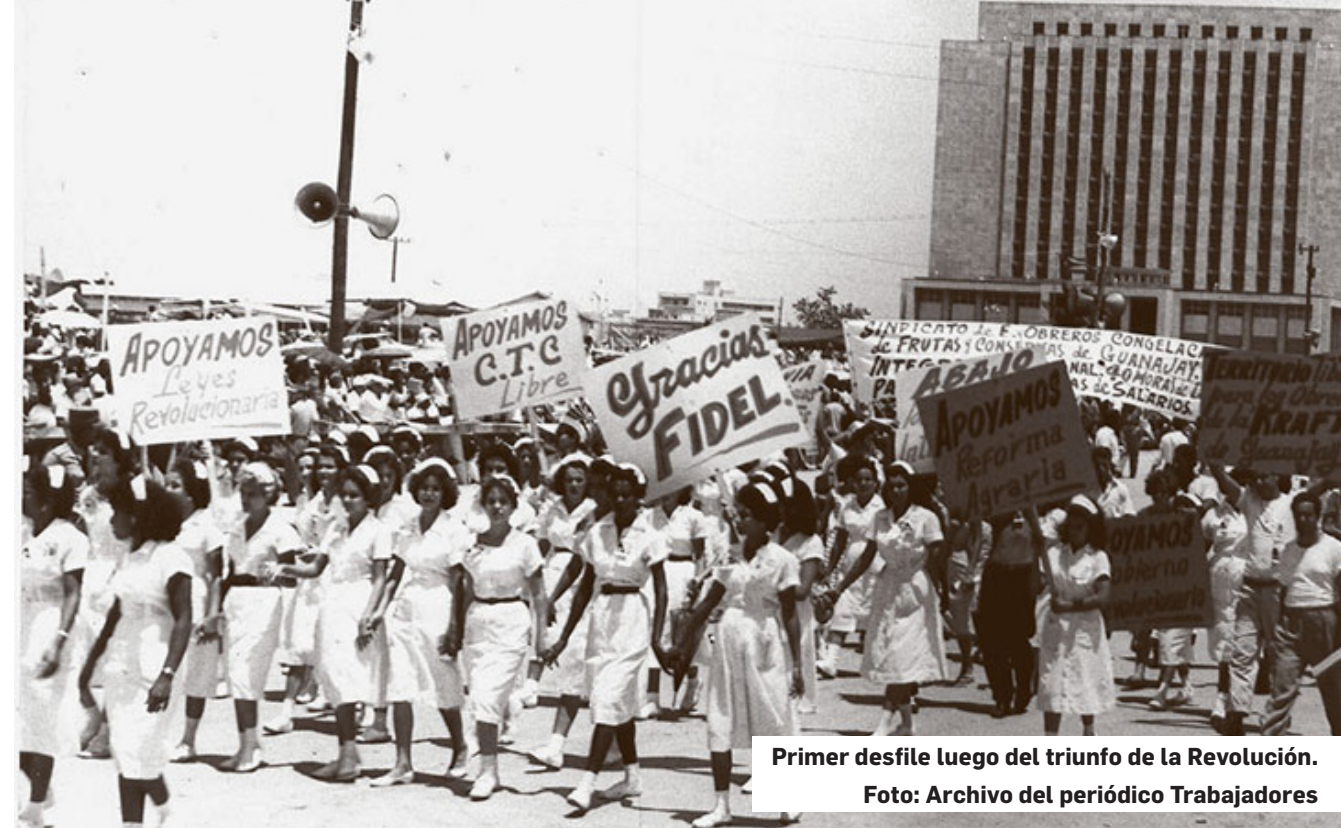
Primer desfile luego del triunfo de la Revolución.

– Combate los delitos, la indisciplina social y la corrupción a todos los niveles.