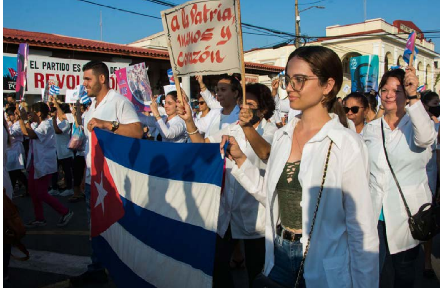
Cientos de jóvenes pinareños demostraron su lealtad a la Revolución.