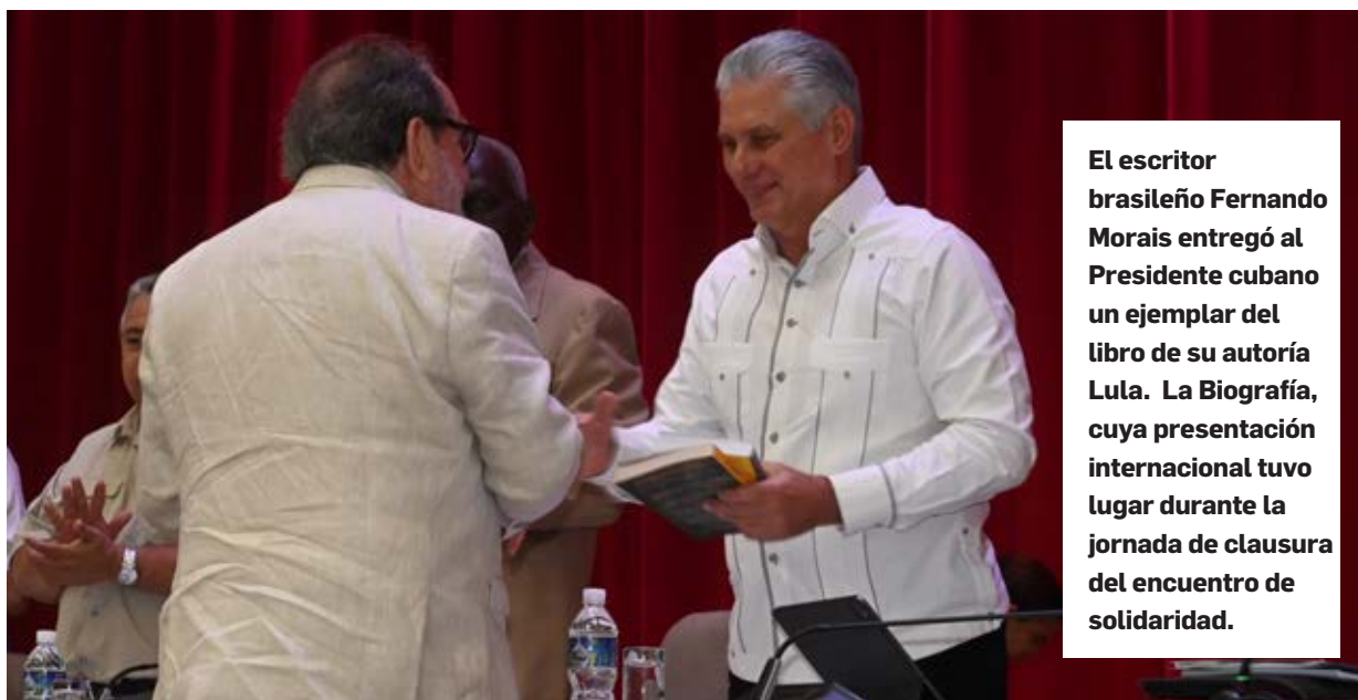
El escritor brasileño Fernando Morais entregó al Presidente cubano un ejemplar del libro de su autoría Lula. La Biografía, cuya presentación internacional tuvo lugar durante la jornada de clausura del encuentro de solidaridad.

de personas y organizaciones solidarias de todo el mundo, incluso dentro de los Estados Unidos, “que han expresado sostenidamente su rechazo a esta política ilegal e inhumana y demandado que se le ponga fin”.