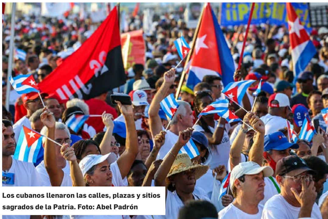
Los cubanos llenaron las calles, plazas y sitios sagrados de la Patria.

En el Mausoleo a los Mártires de Artemisa se patentizó el compromiso con la historia.