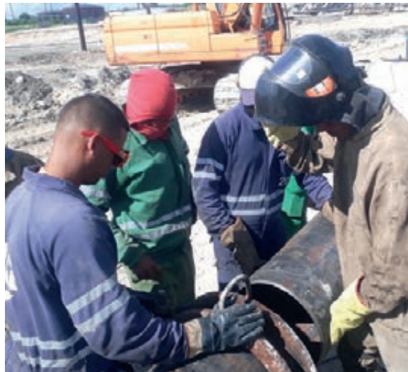
Las nuevas tuberías van desplazando las defectuosas

Haciendo diques o aislando líneas para contener derrames de combustibles, pieza clave resultaron estos Cocodrilos casi desde el mismo inicio del siniestro de Supertanqueros, el 5 de agosto, cuando varias descargas eléctricas