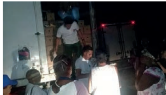
Emprendedores de micros, pequeñas y medianas empresas y proyectos comunitarios entregaron donativos a la población.

Tal iniciativa se sumó a una similar de prominentes personalidades del mundo entre ellos políticos, intelectuales, científicos, clérigos, artistas, músicos, líderes y activistas, quienes exigieron en una carta abierta al mandatario que eliminara el bloqueo en medio de esta excepcional coyuntura.