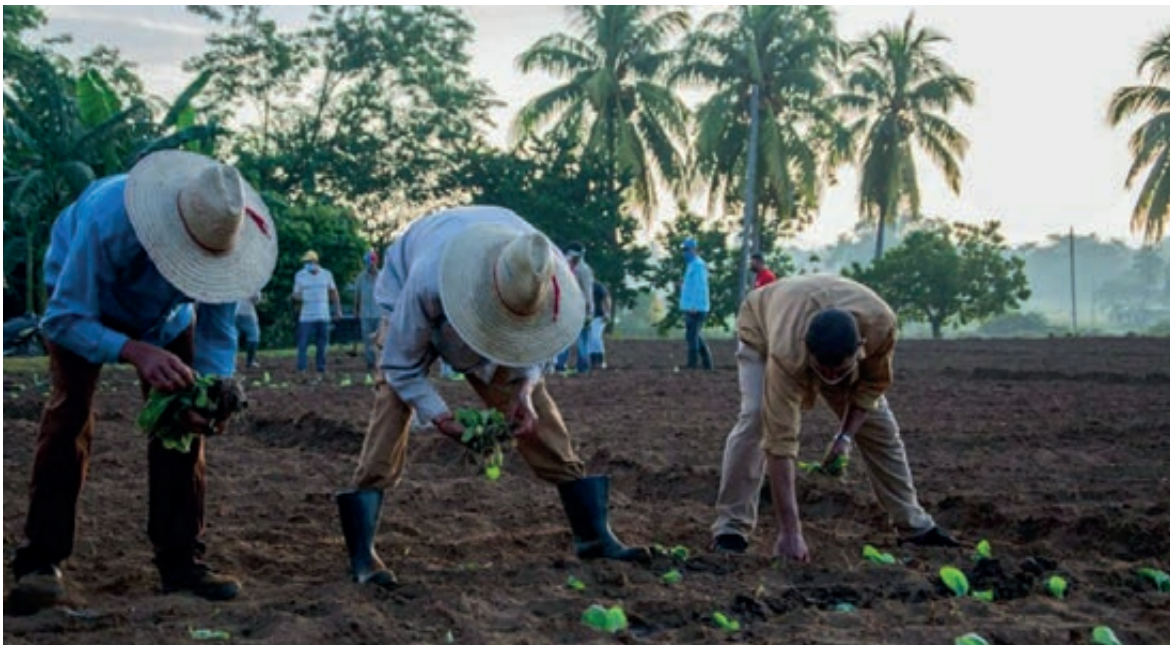
Siembra tabacalera.

“Aquí lo que no podemos hacer es dejarnos derrotar; la situación es difícil, estamos viviendo días difíciles, pero son también días heroicos”, enfatizaba el Primer Secretario del Comité Central del Partido, Miguel Díaz-Canel Bermúdez, el dos de octubre, en su tercera visita a Pinar del Río en seis días.