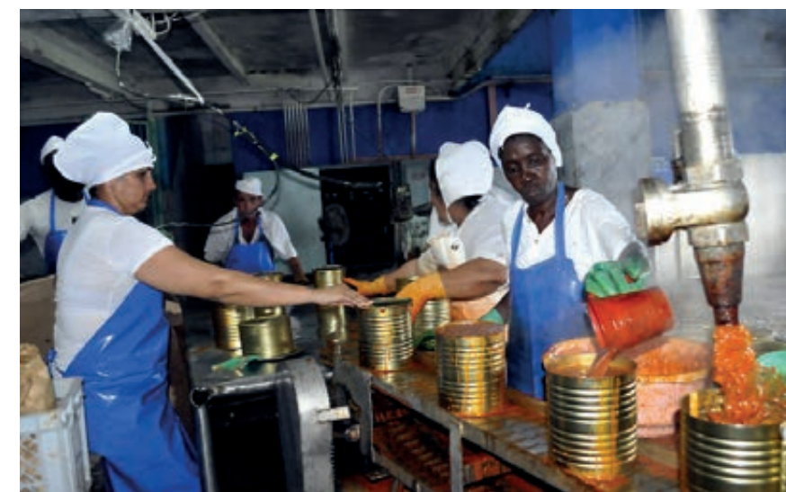
A poco más de una semana del azote de Ian, La Conchita volvió a producir gracias a que sus trabajadores resarcieron los daños, cuantificados en un 90 % de la instalación.