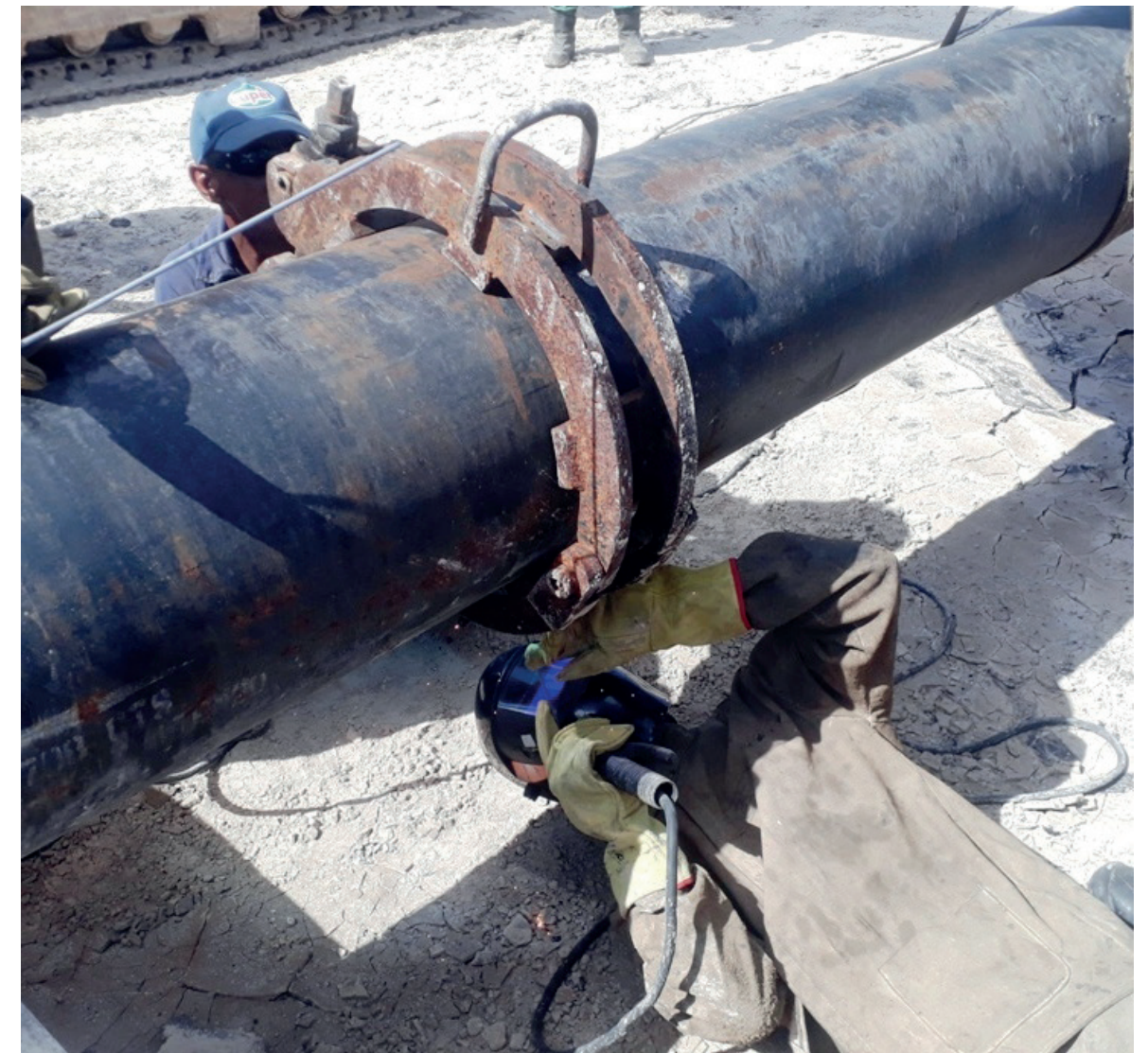
Bien acoplados deben quedar los tubos antes de comenzar a soldar.