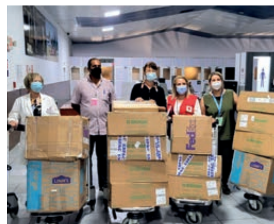
Donativo para Matanzas.