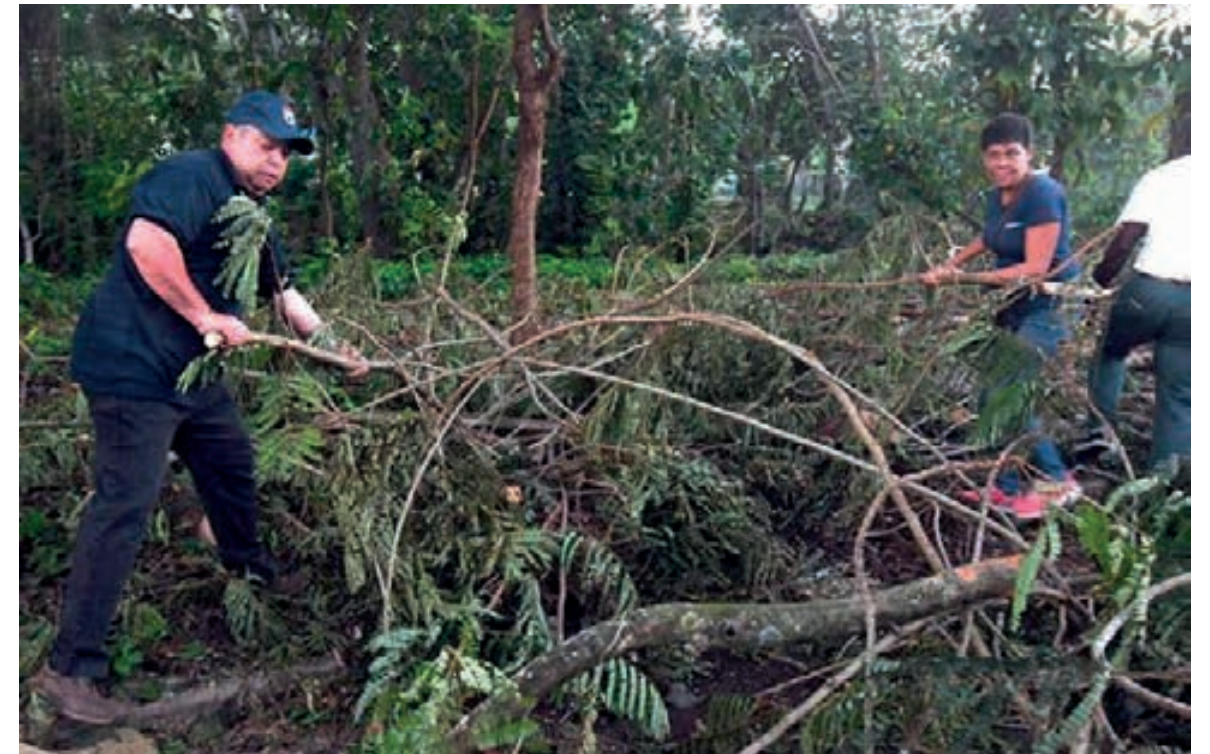
El secretario general de la CTC, Ulises Guilarte, participando en uno de los trabajos voluntarios organizados durante la recuperación.

Muchas son las motivaciones de los trabajadores y el movimiento sindical para responder a esos retos. El aniversario 64 del triunfo de la Revolución y la celebración en este mes de enero de los aniversarios 84 y 170 de la fundación de la CTC y del natalicio del Héroe Nacional, José Martí, respectivamente, son fechas de gran significado histórico y a la vez de compromiso con el perfeccionamiento del modelo económico que defendemos. ■