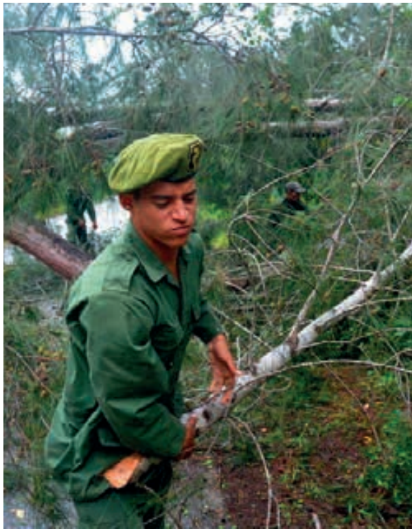
Árboles derribados por el huracán obstaculizaron el paso para llegar a las comunidades.