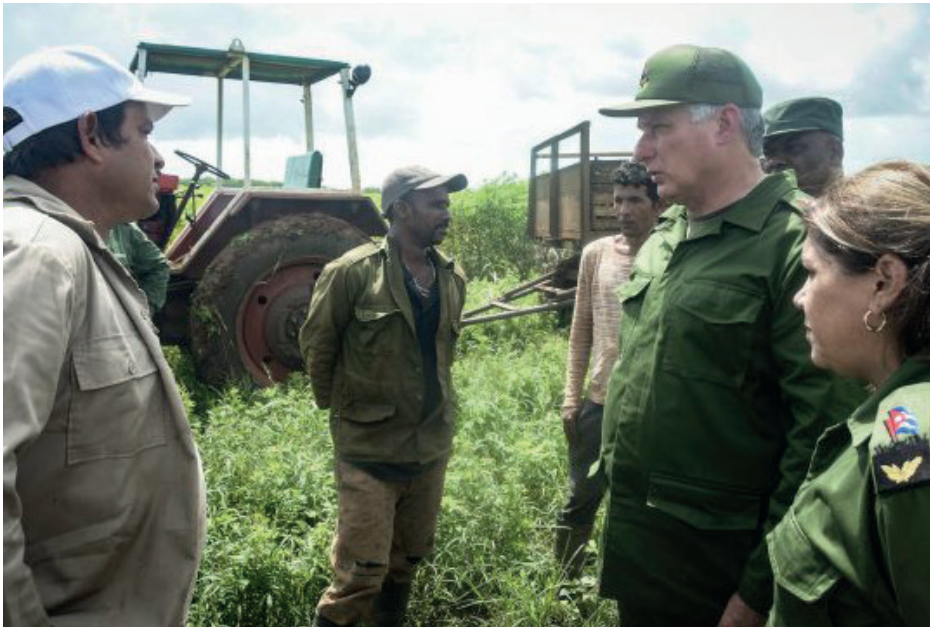
El intercambio del Presidente cubano con los trabajadores fue una constante en sus recorridos por los territorios afectados. En la foto conversa con productores agrícolas en Melena del Sur, Mayabeque.