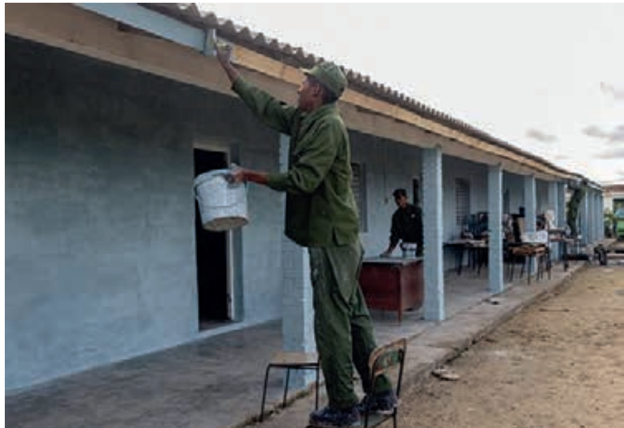
Combatientes de las Fuerzas Armadas Revolucionarias, junto a integrantes de la brigada Martha Machado laboraron en la reparación de escuelas en La Coloma.