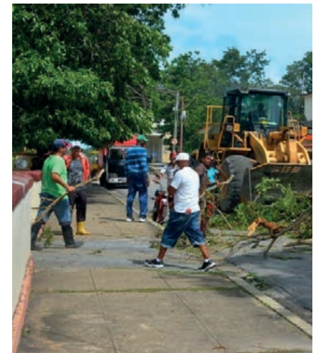
En la Isla de la Juventud, trabajadores y población general se sumó pronto a la recuperación.

“Hay que seguir dando golpes de participación, de compromiso, de solidaridad, con los brazos y los corazones de todos y en la medida que las condiciones lo vayan permitiendo, en alianza con los campesinos