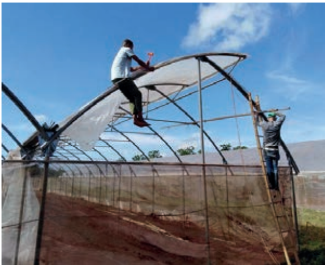
Trabajos de recuperación en Cítricos Ceiba, Artemisa.

mover, convocar a los centros de trabajos para la producción donde más rápido se pueda recuperar y sembrar”, fue el llamado en aquellos momentos difíciles de Ulises Guilarte de Nacimiento, secretario general de la Central de Trabajadores de Cuba (CTC).