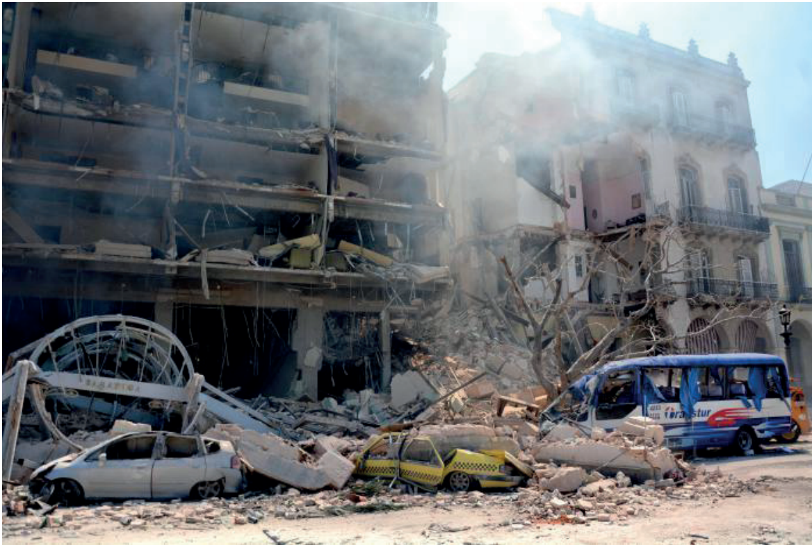
La explosión en el hotel Saratoga removió cimientos estructurales y sentimentales.