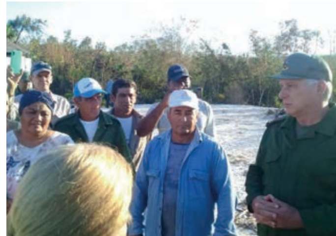
El primer secretario del Comité Central del PCC y presidente de la República, Miguel Díaz-Canel Bermúdez, visitó el pueblo costero de Cocodrilo.

En el poblado subrayó "la recuperación avanza con rapidez. Buena parte de sus servicios eléctrico y de comunicaciones están restablecidos. Ahora hay que trabajar en la reconstrucción de las viviendas" .