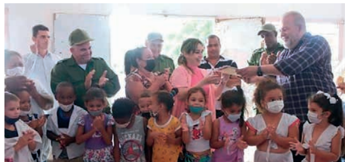
Donación de la Embajada de Francia para niños del municipio pinañero de Consolación del Sur.