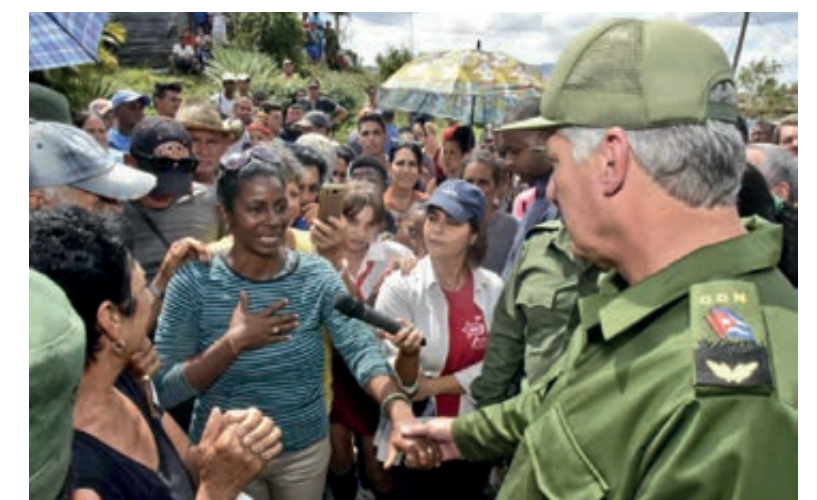
El Presidente cubano recorrió comunidades de Bahía Honda, uno de los municipios más afectados por el huracán.

El 27 de septiembre el huracán Ian hizo volar por los aires techos, bienes y recuerdos, pero no pudo con la esperanza, atada al alma de una nación firme, voluntariosa, perseverante.