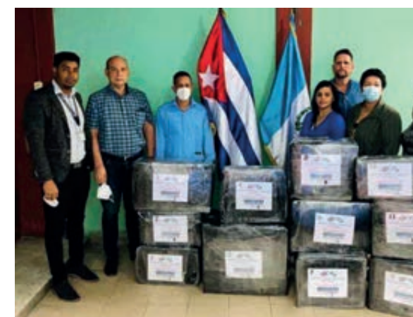
Desde Guatemala.