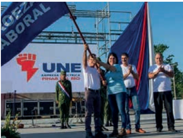
Fueron unos 284 grupos de trabajo, 153 brigadas de líneas y 131 carros, con el apoyo de 14 provincias, los que protagonizaron las faena.