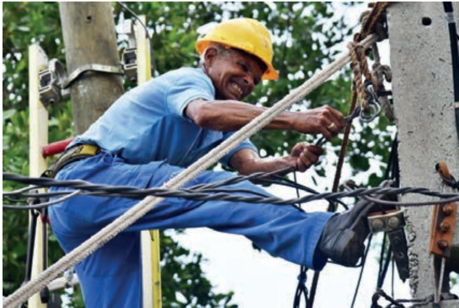
Trabajadores de Etecsa también laboraron sin descanso para restituir las comunicaciones.