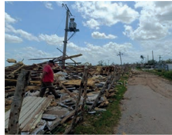
Ian arrasó con las casas de tabaco y miles de viviendas.