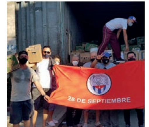
Desde Holguín para Matanzas.