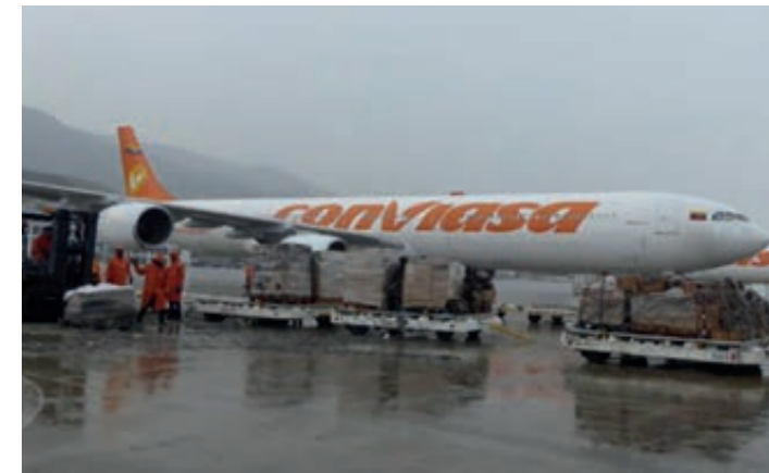
Ayuda solidaria desde Venezuela.