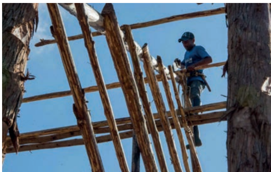
Brigadas de varias provincias trabajaron en la construcción de decenas de casas de tabaco destruidas por el huracán en Pinar del Río.