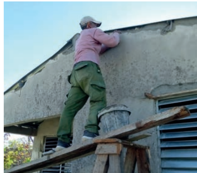
Trabajadores de la mipyme Gran Pino son decisivos en la recuperación de la vivienda.