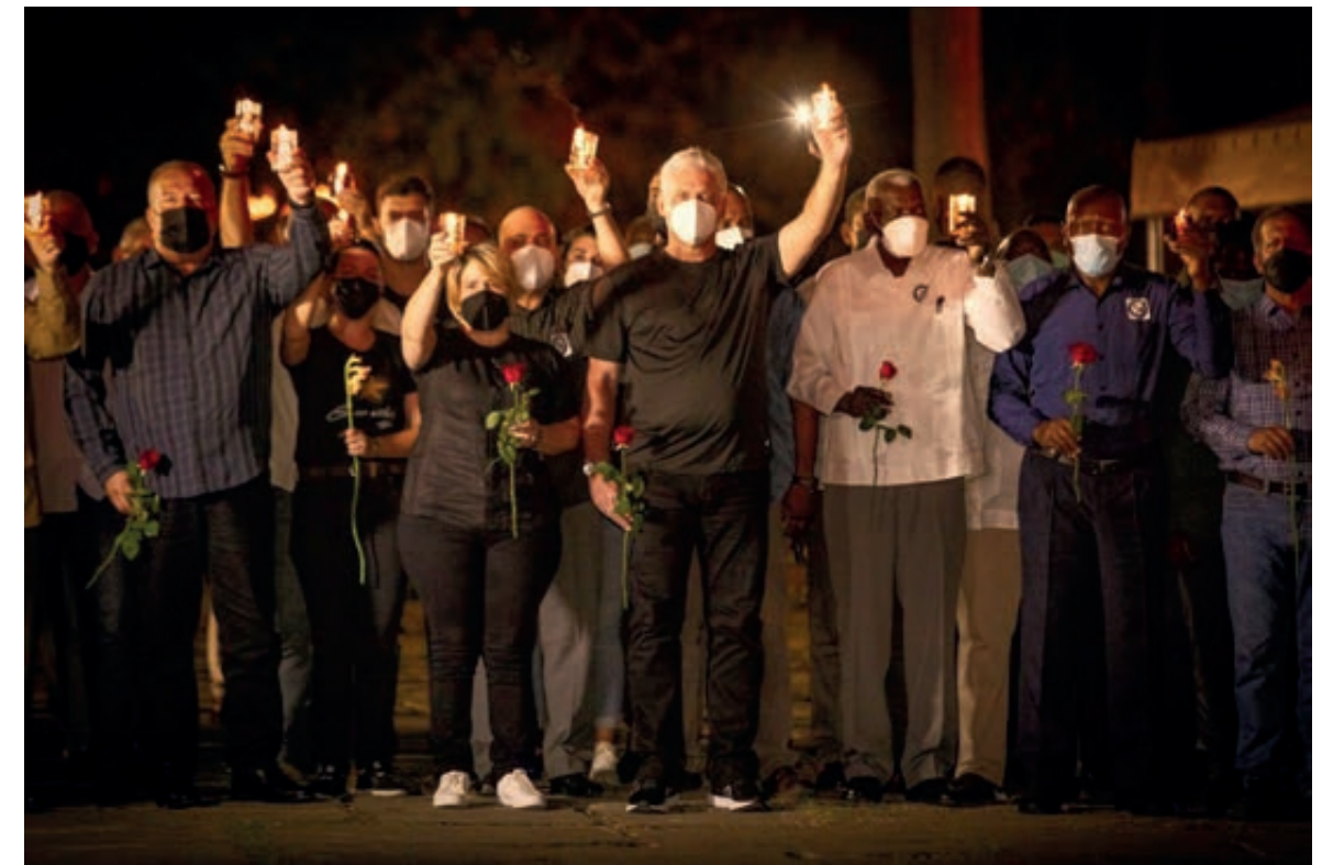
Vigilia por las víctimas fatales. Los máximos dirigentes de la Revolución junto al pueblo.

No se para de trabajar en los restos del hotel a la hora en que los primeros equipos de prensa regresan a sus redacciones. Pareciera que la vida se detiene para concentrarse en ese pedazo de país. El Parque de la Fraternidad vacío confirma lo inusitado del momento. Es una herida abierta el Saratoga. Tras las cintas, se agolpa todavía la multitud, pero ya no frenética como horas antes, sino afligida. La gente apenas conversa. Es un día triste.