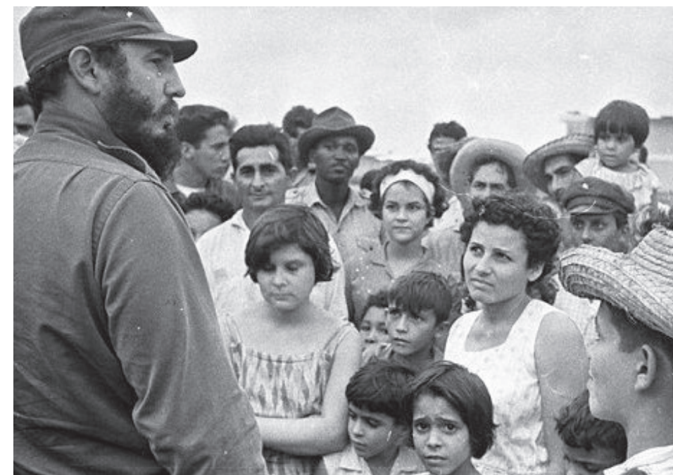
Fidel Castro Visita los poblados afectados por el paso del Huracán Isabel en octubre de 1964.