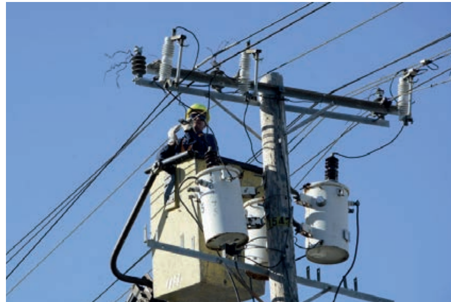
Veintitrés contingentes de varias provincias laboraron de manera incansable para devolver la luz a Vueltabajo: ellos fueron decisivos para levantar más de 6 000 postes, 800 transformadores y rehabilitar más de 3 900 kilómetros de líneas.