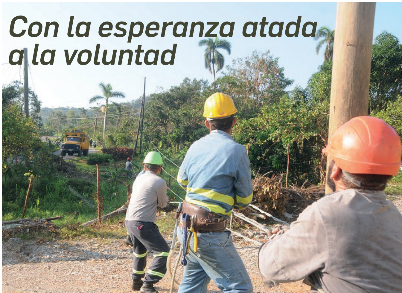
Brigadas de varias provincias levantaron 570 postes, restituyeron 39 kilómetros de conductores y 91 transformadores, en sitios donde suele ser difícil el acceso.

Justo cuando la oscuridad creyó arrebatarse la fe a la gente de