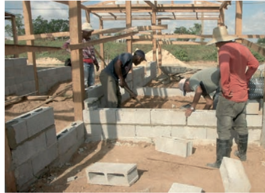
La construcción y rehabilitación de viviendas es el reto mayor en Pinar del Río.

El huracán de la solidaridad no se detuvo: los trabajadores fueron un motor impulsor. Esa misma actitud es vital en estos tiempos, y en todos los tiempos, para seguir restañando las heridas dejadas por catástrofes; para aumentar la producción de alimentos y hacer avanzar la economía. Resulta imperioso trabajar con eficiencia en cada espacio laboral, esa es la única forma de dar la respuesta concreta que necesitan hoy la Patria y la Revolución.