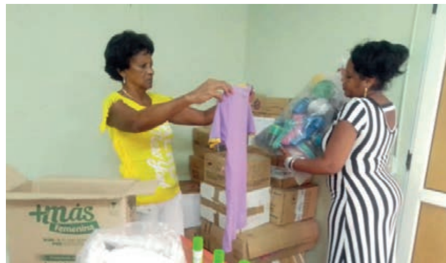
Desde Santiago de Cuba se organizó la donación para los pinareños.