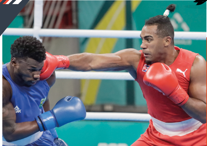
Arlen López se convirtió en tricampeón panamericano y aportó la corona número 100 para el boxeo cubano.