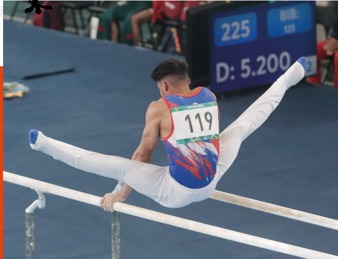
La gimnasia artística cubana se quedó en deuda en cuanto al aporte de preseas.