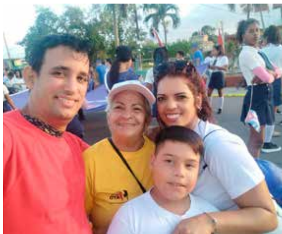
En Mayabeque, la familia estuvo presente en este desfile, como en todo el país.