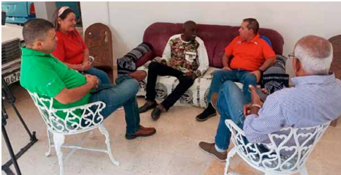
El destacado combatiente revolucionario Víctor Dreke Cruz recibió el homenaje de la CTC.