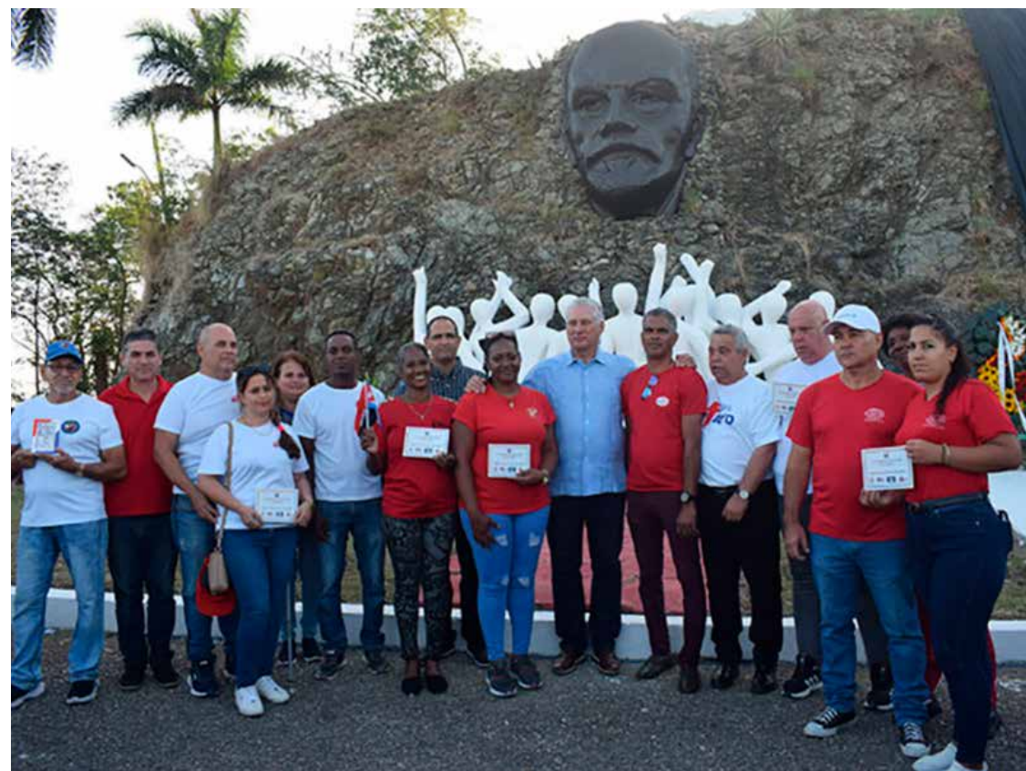
El Primer Secretario del Comité Central del Partido Comunista de Cuba y Presidente de la República Miguel Díaz-Canel Bermúdez asistió al acto en la Colina Lenin, por donde La Habana comenzó su jornada por la efeméride.

Como parte de los festejos por el Primero de Mayo en todo el país se realizó un amplio plan de actividades que incluyó jornadas de trabajo voluntario en sectores priorizados como la zafra azucarera y la agricultura.