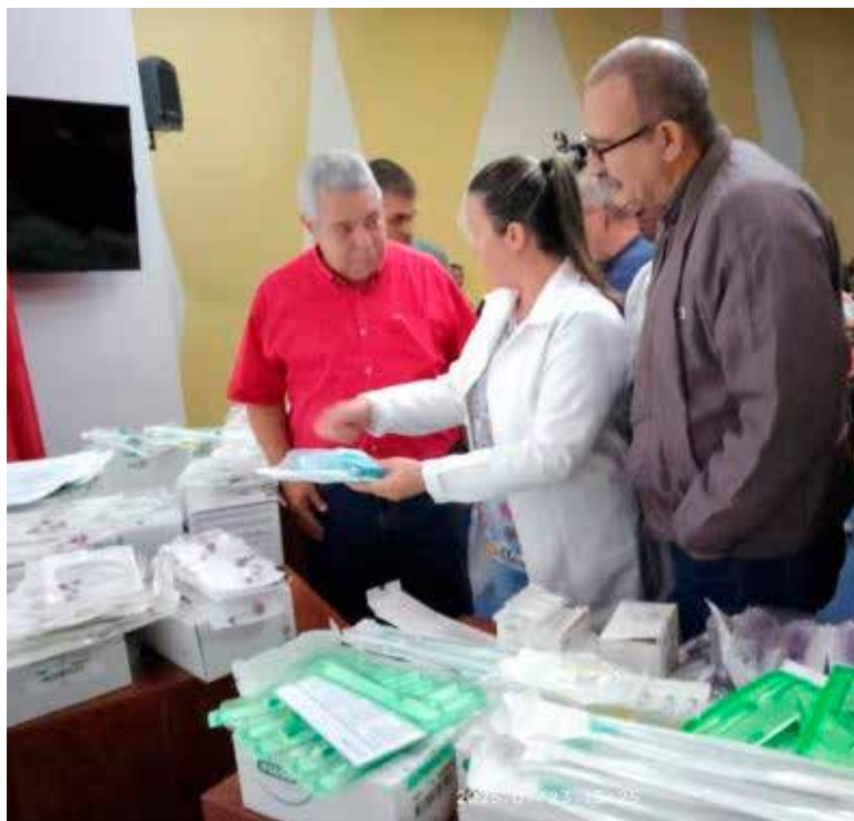
Ulises Guilarte De Nacimiento, integrante del Buró Político del Comité Central del Partido Comunista de Cuba y secretario general de la CTC, asistió a la entrega en el hospital William Soler, de materiales e insumos médicos enviados por la CGT de Francia.

Por ejemplo, la respuesta de los hermanos franceses se materializa a través de la campaña Contenedores para Cuba, en la que participan activamente las federaciones, asociaciones y uniones departamentales de varias regiones de la nación gala. Las contribuciones no han cesado ante el incremento de la agresividad del Gobierno de los Estados