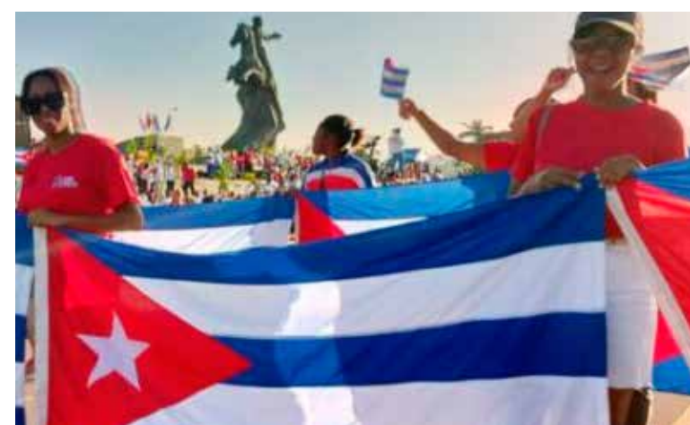
Marcha unida en Santiago de Cuba en la que se ratificó que Por Cuba Juntos Creamos.