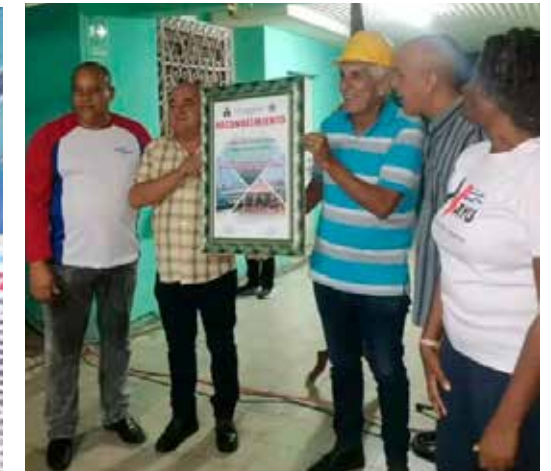
En Camagüey, a propuesta de la CTC, un grupo de dirigentes sindicales y trabajadores recibieron condecoraciones estatales.