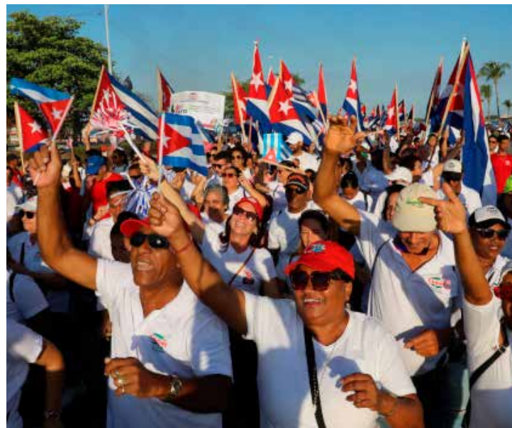
Los cienfuegueros dieron su Sí por Cuba.