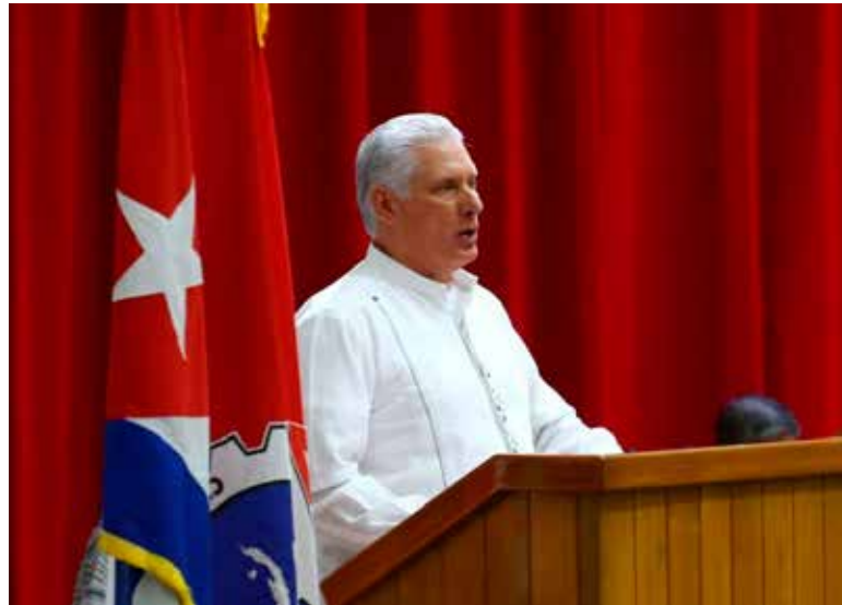
El Presidente cubano calificó a los asistentes como representantes de los que creen, quieren y están dispuestos a construir un mundo mejor.

“No estamos aquí solo por Cuba, sino también por todas las causas justas de los pueblos en el mundo”, significó el Primer Secretario del Comité Central del Partido y Presidente de la República, Miguel Díaz-Canel Bermúdez, en el discurso de clausura del Encuentro Internacional de Solidaridad con Cuba, el Antimperialismo y Contra el Resurgimiento del Fascismo, celebrado en el Palacio de Convenciones de La Habana como digno colofón de las actividades por el Primero de Mayo.