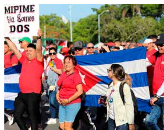
Los guantanameros dieron al mundo un claro mensaje de resistencia, unidad, compromiso y continuidad.