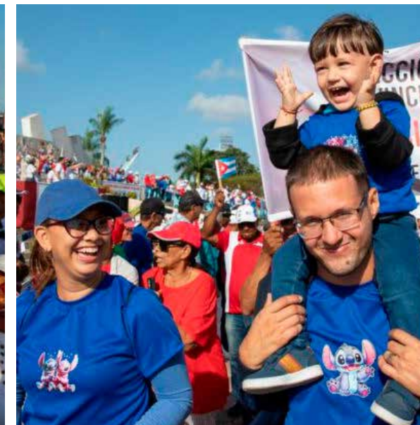
Camagüey, alegría y compromiso.