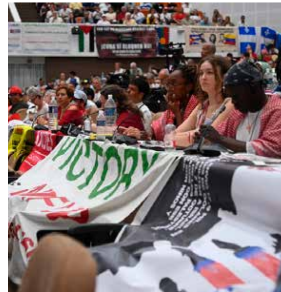
Amigos de todas las latitudes asistieron al encuentro.

En sus palabras al plenario, Ulises Guilarte De Nacimiento, miembro del Buro Político del Partido y secretario general de la Central de Trabajadores de Cuba (CTC), agradeció la presencia de tantos amigos de la Mayor de las Antillas y las campañas organizadas para recaudar fondos destinados a la salud y la educación en el país.