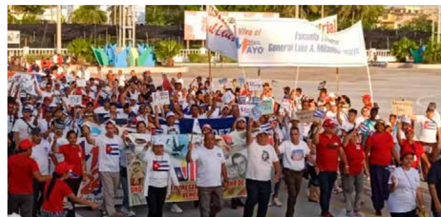
Representantes de todos los sectores laborales en Granma desfilaron con orgullo, destacando los logros de los trabajadores.