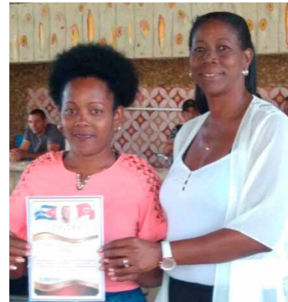
En Artemisa, como en el resto de las provincias, hubo encuentros de dirigentes sindicales jubilados y en activo.