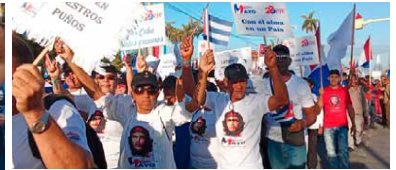
Más de 100 mil trabajadores, estudiantes y sus familiares marcharon en la provincia de Matanzas en respaldo a la Revolución.