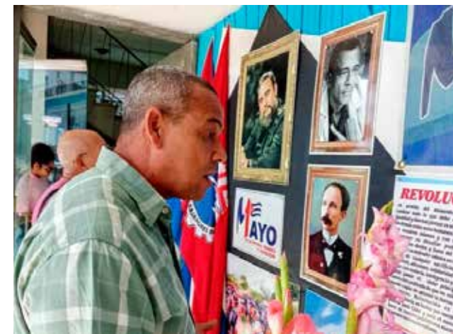
La tradicional exposición fotográfica inaugurada en Matanzas a propósito del Primero de Mayo, volvió a evocar los profundos vínculos de Fidel Castro Ruz y los trabajadores cubanos.