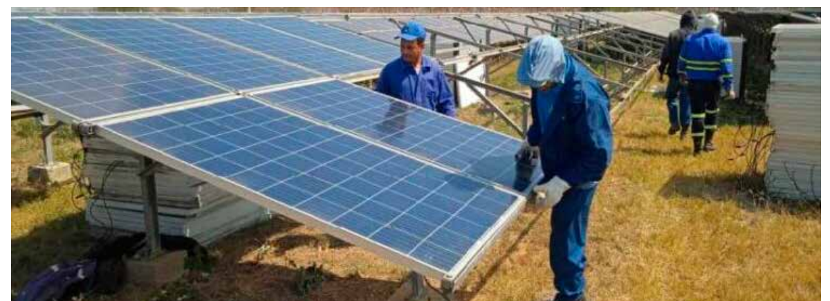
Parque solar fotovoltaico de La Sierpe.

Historias de proezas y confianza en el futuro atesoran cada parque solar fotovoltaico terminado