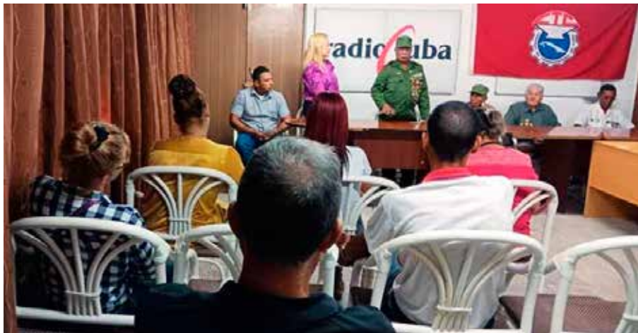
Las historias de los héroes de Playa Girón contribuyen a la educación de las nuevas generaciones.