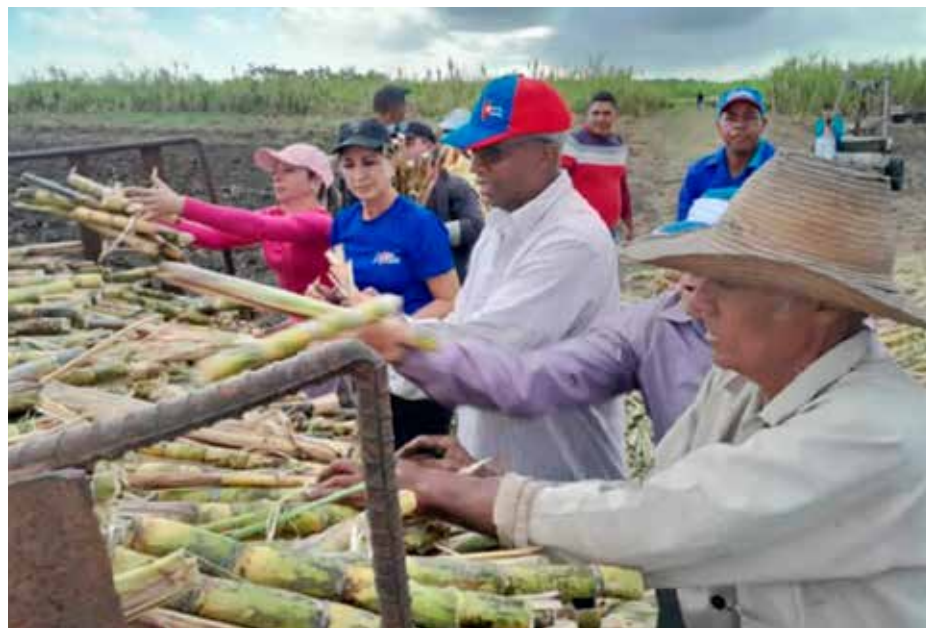
Durante varios domingos se realizaron movilizaciones hacia la agricultura, Foto: Lianne Fonseca