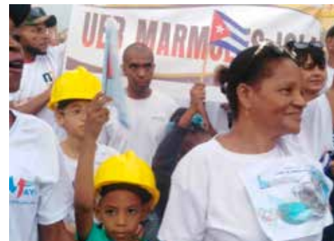
Múltiples iniciativas se apreciaron en el Municipio Especial Isla de la Juventud.