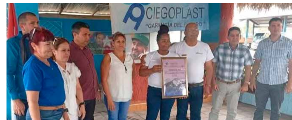
Durante 13 años el colectivo de la Empresa de Tuberías y Accesorios de Polietileno de Alta Densidad (Ciegoplast) se mantienen como Vanguardias Nacionales.