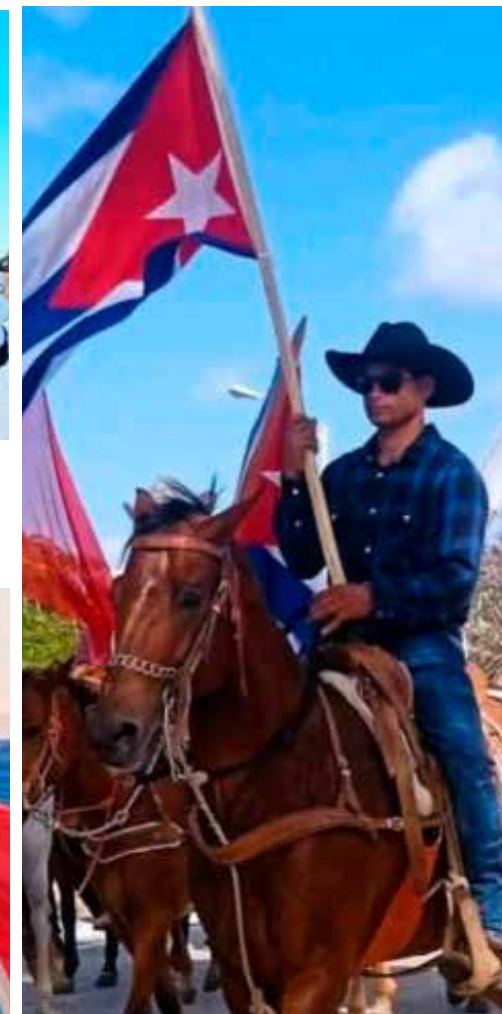
En Ciego de Ávila, los campesinos desfilaron junto al pueblo.