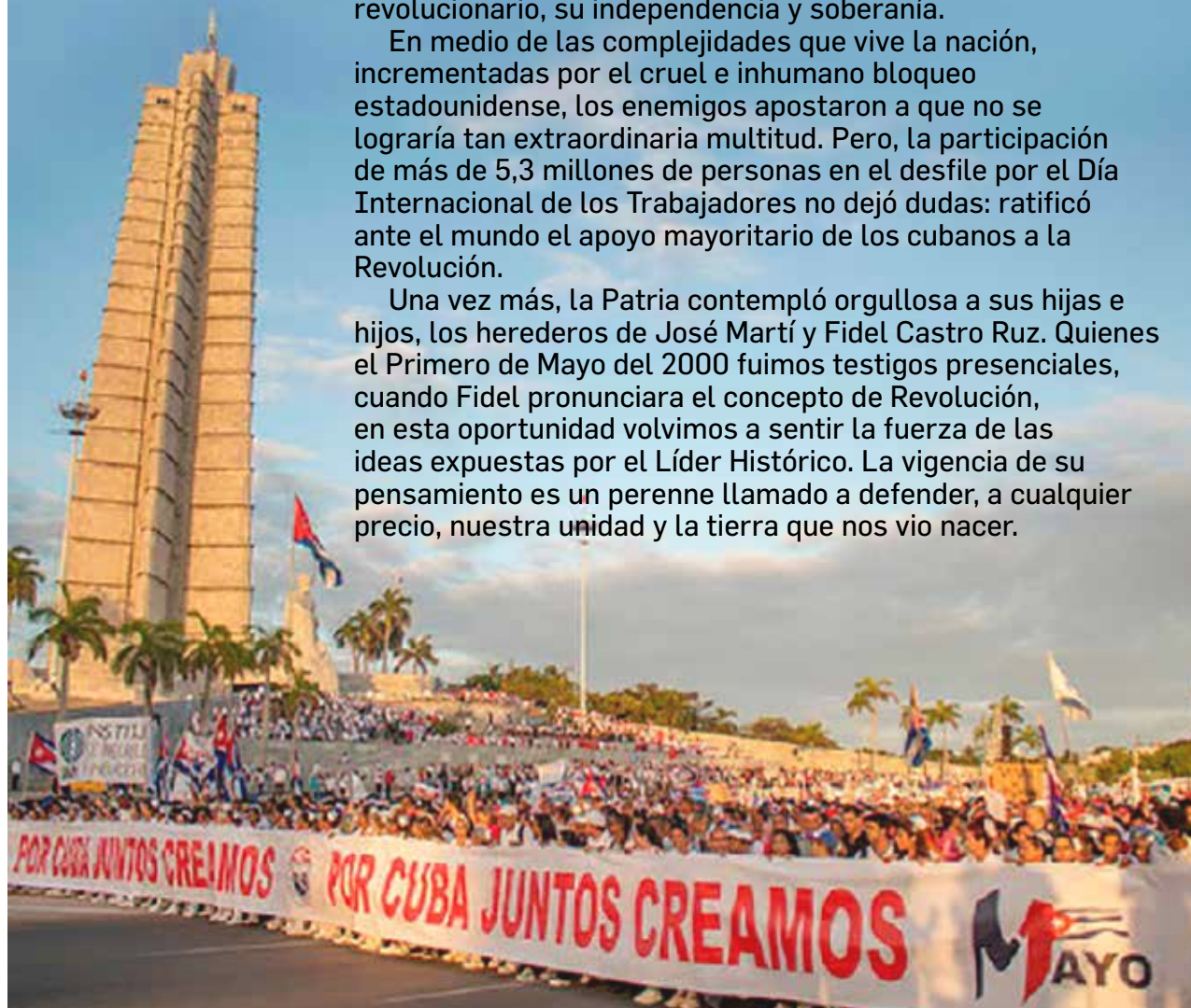
Masiva participación de los capitalinos.

Una vez más, la Patria contempló orgullosa a sus hijas e hijos, los herederos de José Martí y Fidel Castro Ruz. Quienes el Primero de Mayo del 2000 fuimos testigos presenciales, cuando Fidel pronunciara el concepto de Revolución, en esta oportunidad volvimos a sentir la fuerza de las ideas expuestas por el Líder Histórico. La vigencia de su pensamiento es un perenne llamado a defender, a cualquier precio, nuestra unidad y la tierra que nos vio nacer.