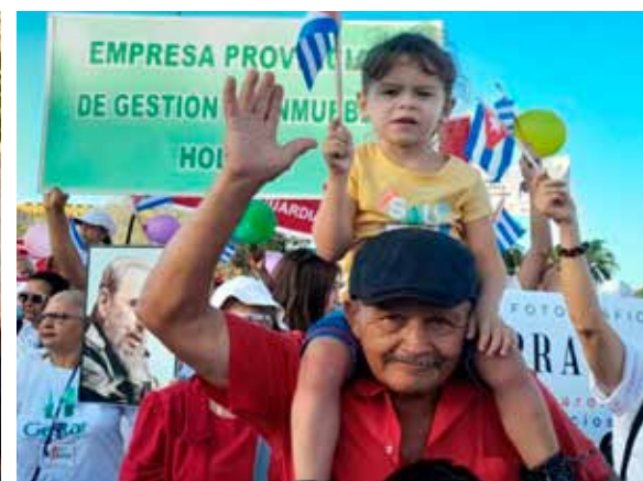
Varias generaciones de holguineros se unieron este Primero de Mayo.