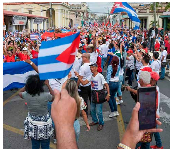
Multitudinaria fue la respuesta de los pinareños.