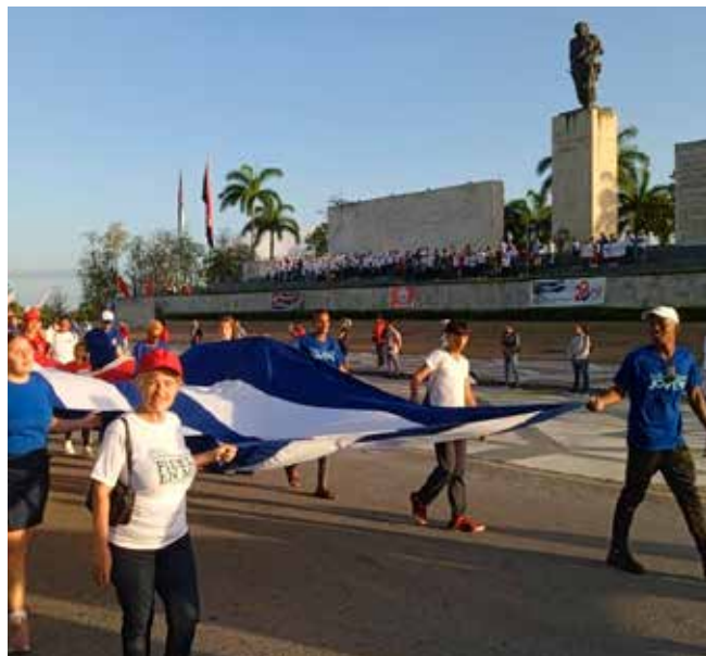
Respaldo al Socialismo y a la Revolución en la Plaza Che Guevara.