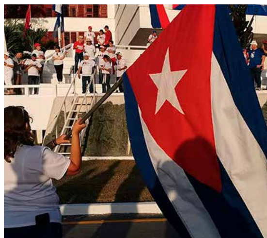
La Plaza Mayor General Serafín Sánchez Valdivia de Sancti Spiritus fue sitio de reafirmación revolucionaria.