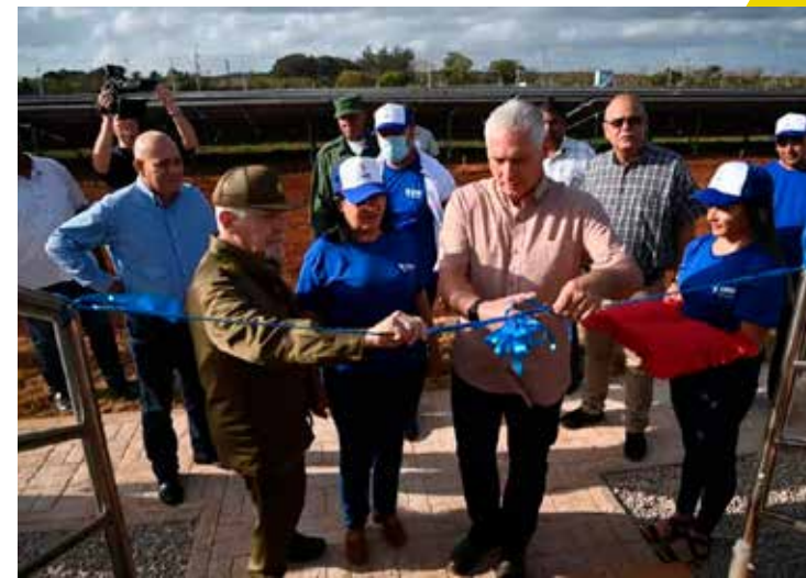
Esta imagen se ha repetido por toda Cuba.

asignaran. "Vas a atender al Sindicato Metalúrgico", me informó y quedé atónito por el notición. En breve tiempo el arduo bregar de los trabajadores de la industria sideromecánica motivó mi interés. Me adentré en el vasto universo de tan importante rama productiva y resulta uno de los motivos por los que el periodismo y Trabajadores forman parte de mi ADN".