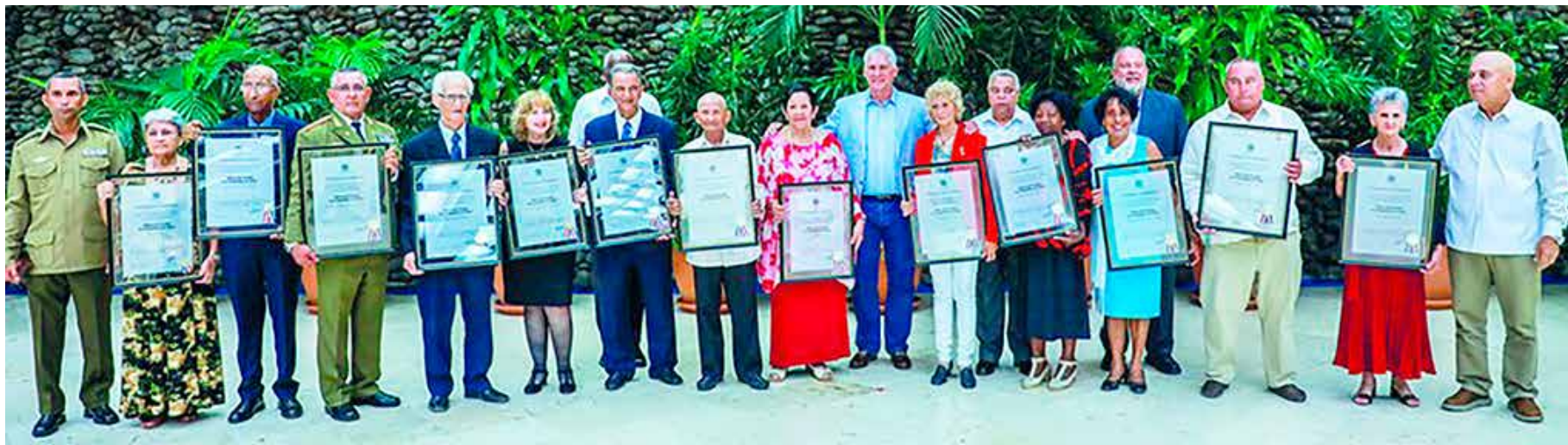
Se otorgó el título honorífico de Héroes y Heroínas del Trabajo de la República de Cuba (uno de ellos con carácter póstumo) a 13 trabajadores con importantes aportes a la producción, los servicios, la docencia, la investigación y la defensa del país.