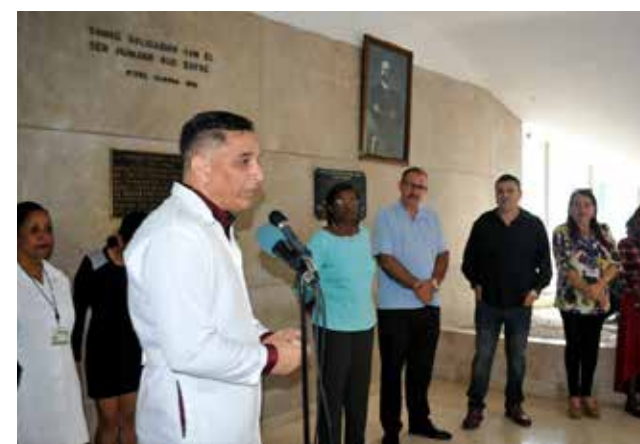
El hospital Dr. Enrique Cabrera Cosío fue la octava institución de salud favorecida este año con la entrega de medicamentos, equipos y material gastable donados como parte de la campaña Contenedores para Cuba.