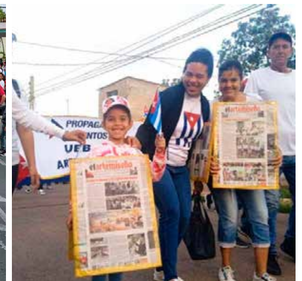
La joven generación estuvo presente durante la movilización en Artemisa.