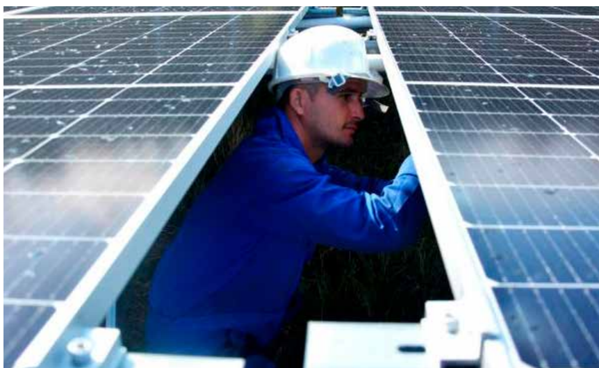
Doce parques solares fotovoltaicos han sido entregados y sincronizados al SEN entre febrero y mediados de mayo.