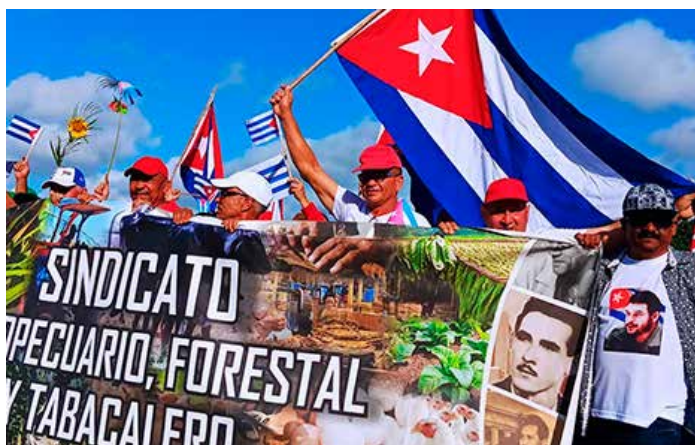
La Plaza Mayor General Vicente García González, resultó pequeña para tanto entusiasmo y compromiso de los tuneros.