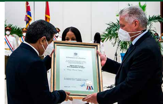
Doctor Eulogio Pimentel, vicepresidente primero de BioCubaFarma, fue condecorado en el 2021.

Héroe del Trabajo de la República de Cuba, Eulogio Pimentel Vázquez fue líder del grupo que trabajó en la creación del Interferón, producto biotecnológico utilizado con éxito durante la pandemia de la COVID-19