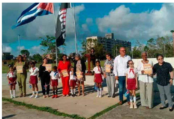
En el Mausoleo a los Mártires de Artemisa concluyó la jornada provincial de homenaje por el Día del Educador.