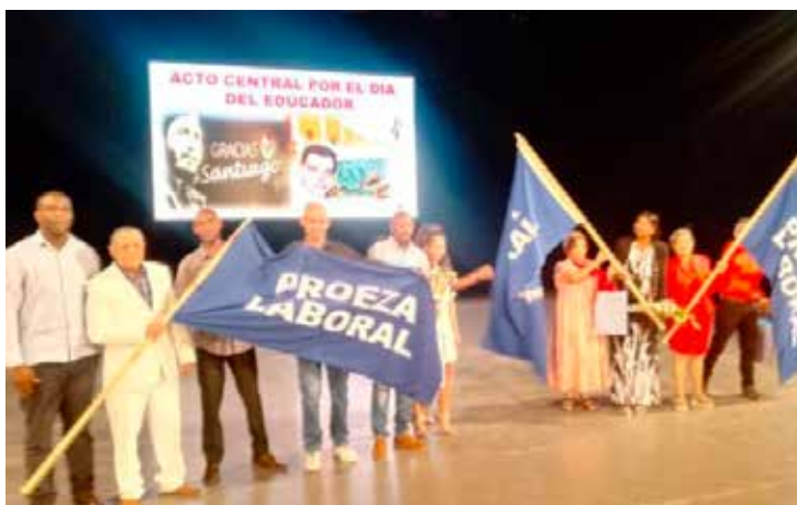
Numerosos reconocimientos fueron entregados en Santiago de Cuba, sede del acto central por el Día del Educador.

Superior fueron distinguidos en el Palacio de la Revolución, como reconocimiento a su valiosa trayectoria en la formación de los más jóvenes y por su contribución incesante al desarrollo y el perfeccionamiento del Sistema Educativo en Cuba.