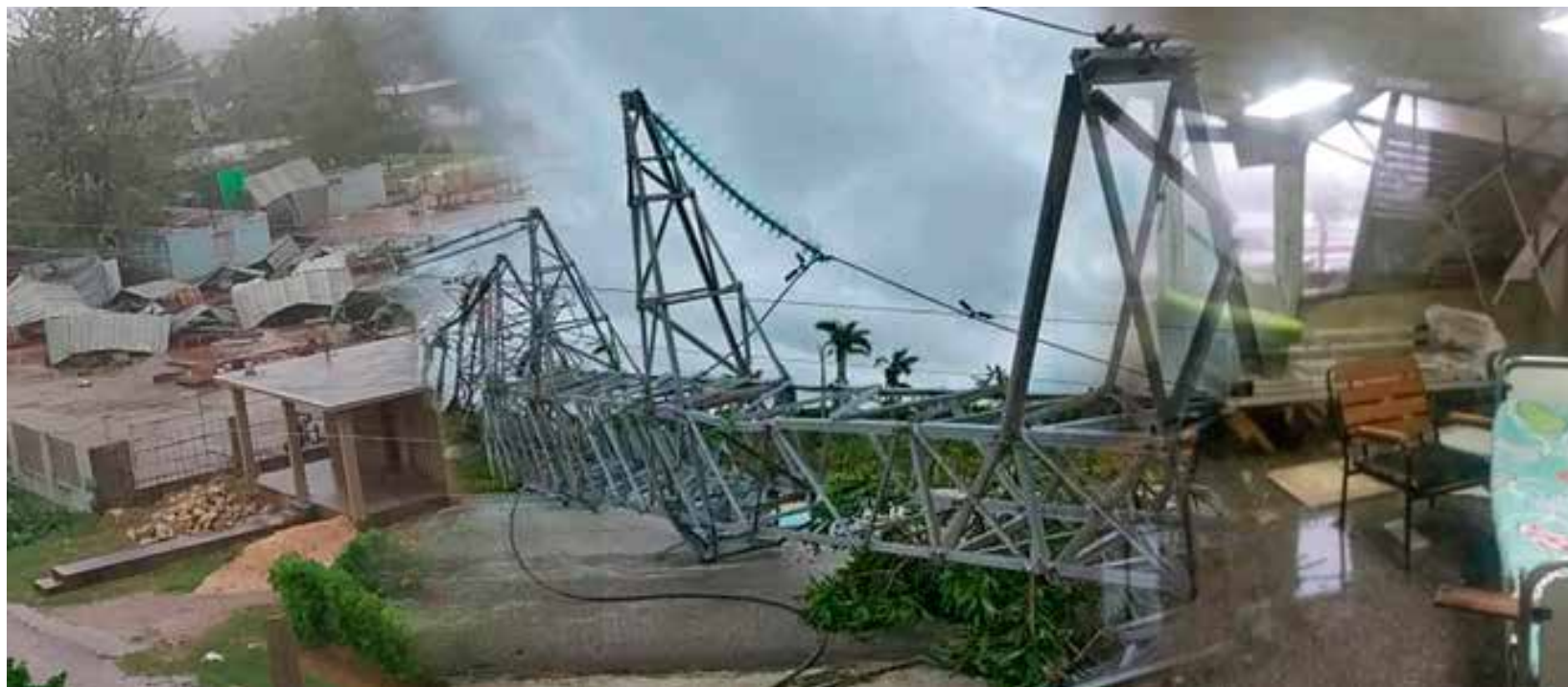
Artemisa fue la provincia occidental más afectada por el huracán Rafael. Fotos: El artemiseño