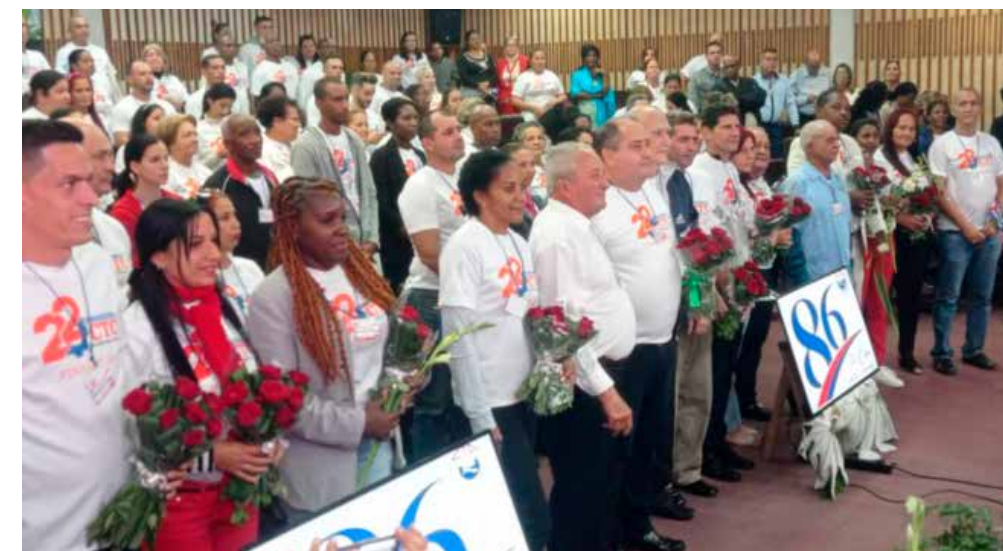
Los trabajadores pinareños recibieron una felicitación del secretario general de la CTC.

La categoría de destacadas correspondió a Pinar del Río, Matanzas, Sancti Spíritus, Santiago de Cuba y Holguín.