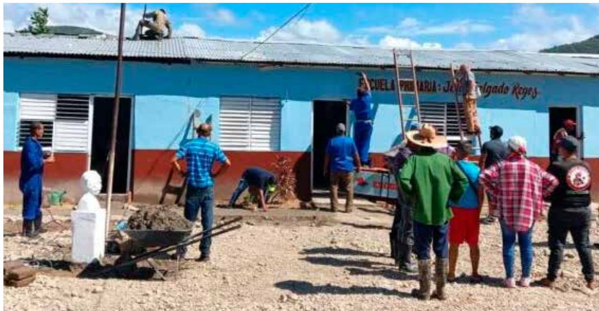
Fuerzas especializadas, maestros y la población unieron voluntades para restaurar las decenas de escuelas dañadas por los ciclones.