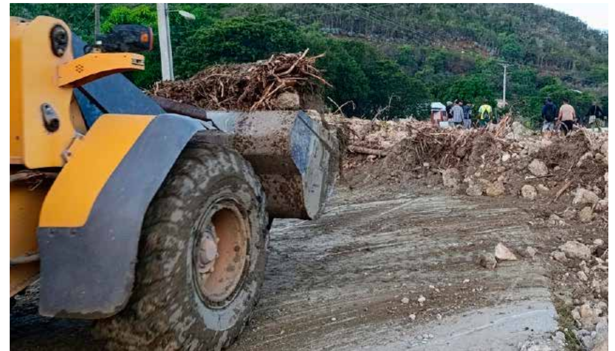
La intervención de los constructores fue decisiva para abrir paso hacia zonas incomunicadas por las inundaciones provocadas por el ciclón Oscar.