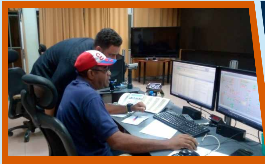
Profesionales consagrados se encuentran en todas las áreas.

lugar prominente los obreros, ingenieros, técnicos y especialistas en las centrales termoeléctricas, subestaciones y talleres de mantenimiento donde fluye el talento de los innovadores y racionalizadores en la búsqueda de soluciones como respuesta a las limitaciones y traspiés ocasionados por el bloqueo imperialista. ■