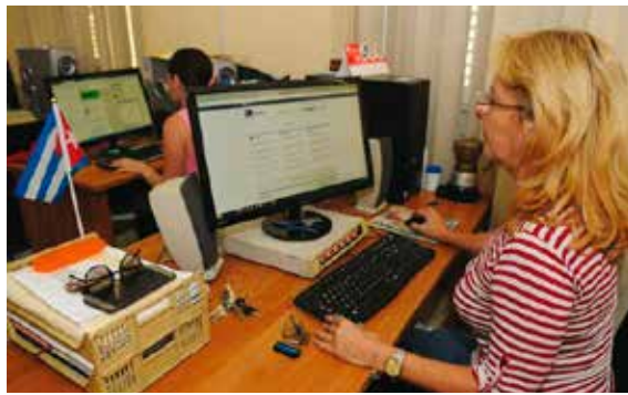
En el nuevo Código de Trabajo se incorporarán elementos relacionados con el teletrabajo y el trabajo a distancia, alternativas laborales.

Ferrer Mariño adelantó que se está trabajando en paralelo con una nueva ley de seguridad social, dado que ambas normativas están estrechamente relacionadas. “En este contexto, se abordarán elementos para la madre trabajadora”.