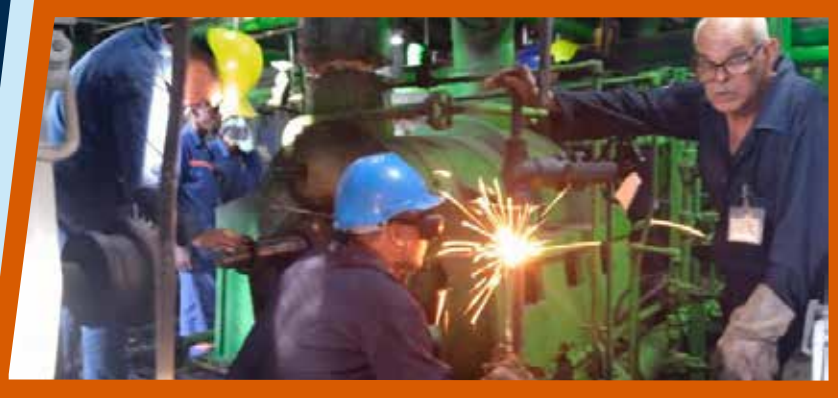
La única misión: restaurar el servicio.

Los trabajos de mantenimiento en las termoeléctricas exigen arduas jornadas de labor.