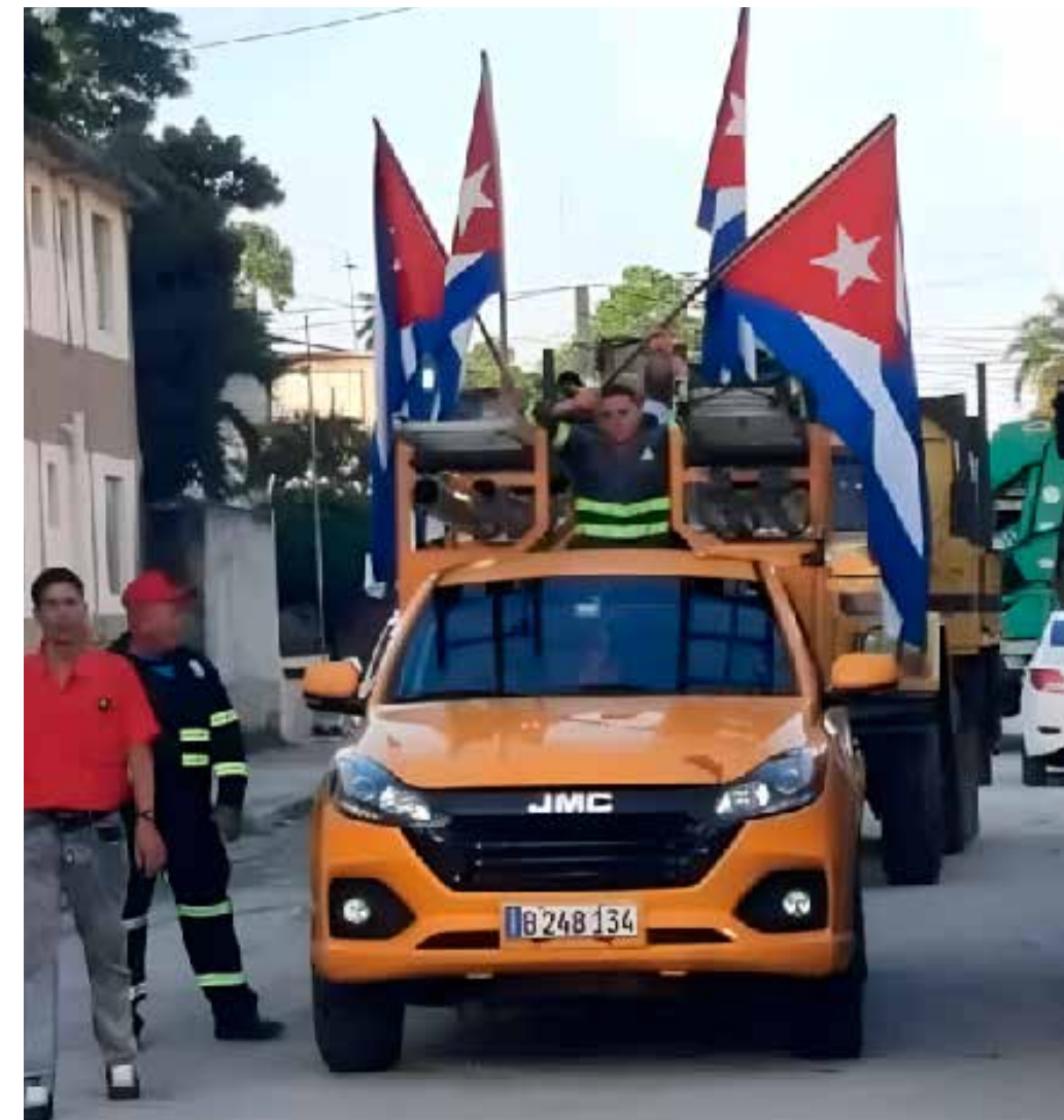
Estas imágenes se repitieron en el oriente y en el occidente cubano.