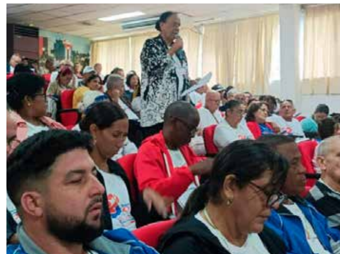
Matanzas tiene un gran potencial productivo se ratificó en los debates en su Conferencia Provincial.