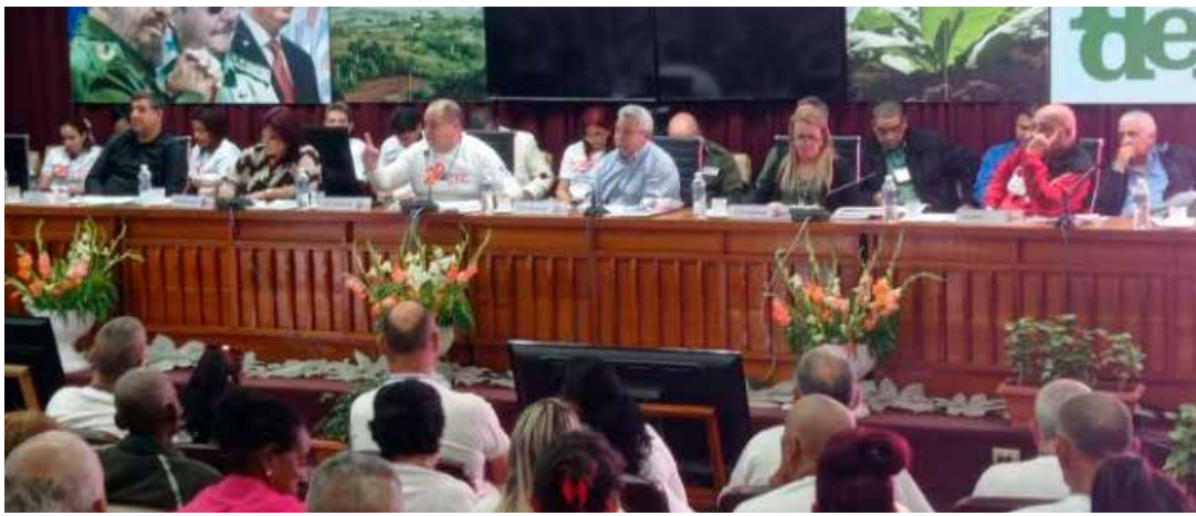
Los delegados a la conferencia en Pinar del Río subrayaron la necesidad de transformar los modos de hacer para alcanzar mejores resultados.

Si en las mismas circunstancias unas empresas prosperan, por qué otras no, preguntó Mario Sabines Lorenzo, primer secretario del Comité Provincial del Partido, para ilustrar lo perentorio de generalizar las buenas experiencias en un contexto en el que la producción de alimentos, la generación eléctrica y resolver las distorsiones de la economía, lo transversalizan todo.