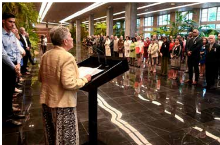
Casi medio centenar de destacados profesionales de la Enseñanza Superior fueron distinguidos.