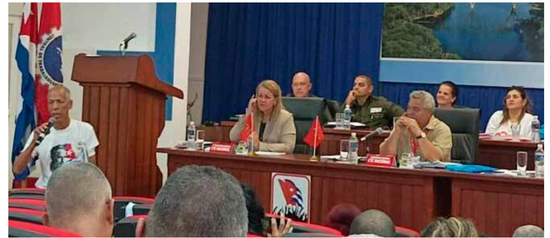
Por territorio yumurino comenzó la última fase de cara a la magna cita de los trabajadores cubanos.

Hoy, cuando estamos a las puertas de celebrar el cumpleaños 172 de nuestro Héroe Nacional José Martí y el 86 de la CTC, el Congreso entra en su recta final, con la realización de la casi totalidad de las Conferencias provinciales, en tanto por los efectos de los fenómenos naturales y las