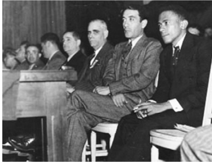
Lázaro Peña en la presidencia de la noche inaugural del Congreso, junto a Vicente Lombardo Toledano, secretario general de las Confederaciones de Trabajadores de México y de América Latina.

El 28 de enero de 1939 fue constituida la Confederación de Trabajadores de Cuba, con lo cual se cumplía uno de los deseos planteados por los delegados al Congreso Obrero de 1887, que abogaron por el nacimiento de una organización que sumara a todos los trabajadores.