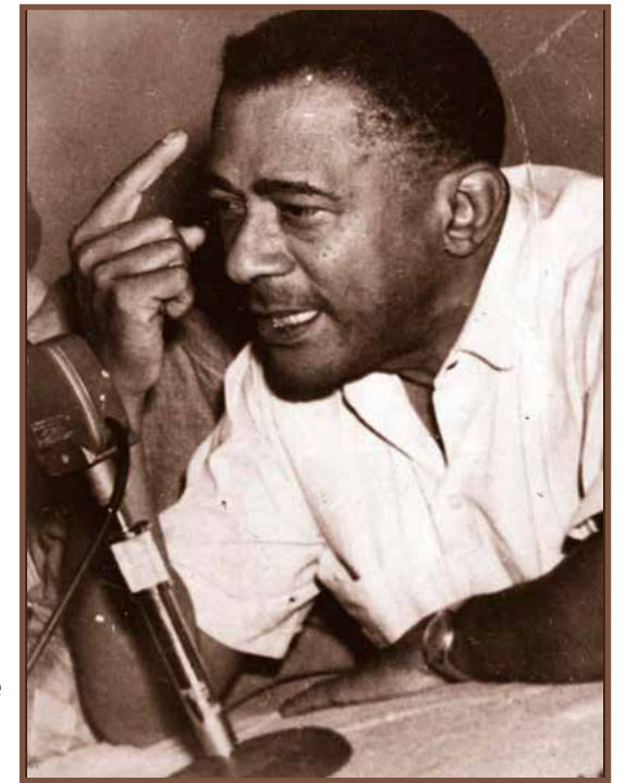
Lázaro Peña sigue siendo guía en la unidad del movimiento sindical.

Por sus grandes méritos y capacidad organizativa fue nombrado, a principios de 1973, jefe del Departamento de Organizaciones de Masas en el CC del PCC. A pesar de estar enfermo, se consagró a la preparación del histórico XIII Congreso de la CTC. Fue el centro de aquel trascendental cónclave con su participación directa en la elaboración de las Tesis sobre variados y complejos