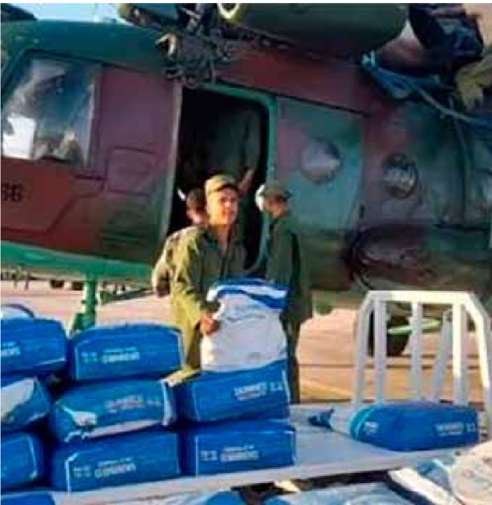
Como un reloj suizo funcionó el puente aéreo para llevar suministros hasta Imías.