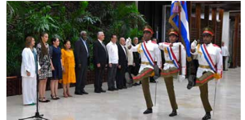
Condecoración a trabajadores destacados en la Salud.

Por la ardua labor desplegada en la recuperación tras los daños que dejó el huracán Oscar a su paso por la provincia de Guantánamo y a propuesta del Sindicato Nacional de Trabajadores de la Salud y el Secretariado Nacional de la Central de Trabajadores de Cuba obtuvieron la bandera Proeza Laboral: la Unidad