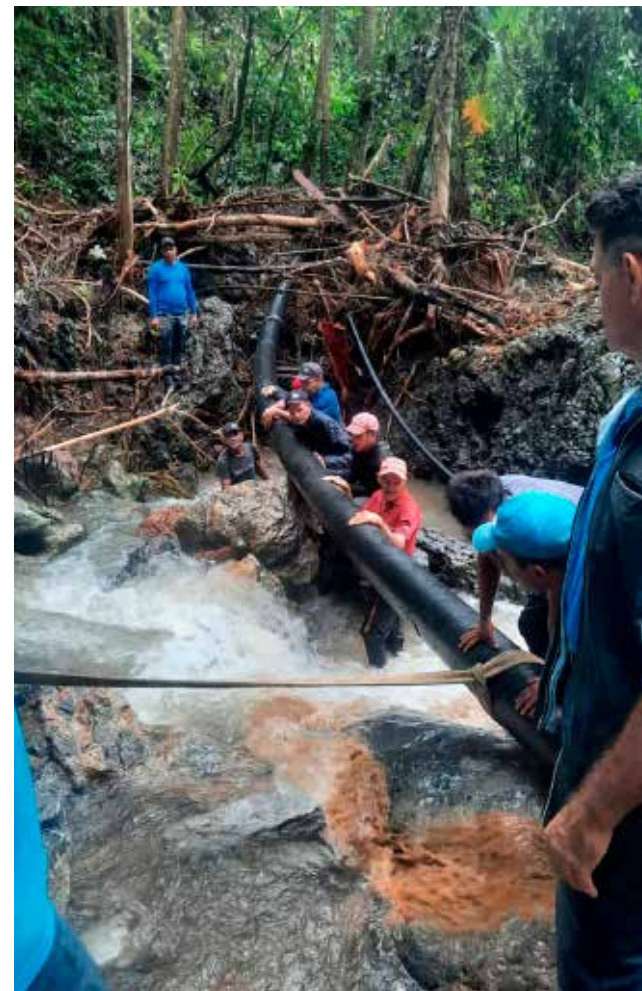
Los trabajadores hidráulicos desafiaron obstáculos para restaurar acueductos y llevar agua a las comunidades.