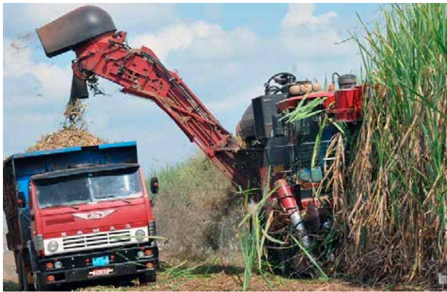
La zafra azucarera se reafirma como una de las actividades para potenciar la emulación.

facilitadas por los descontroles económicos y el actuar indolente de algunos cuadros y funcionarios. En ocasiones han estado involucrados trabajadores y agentes encargados de salvaguardar la entidad.