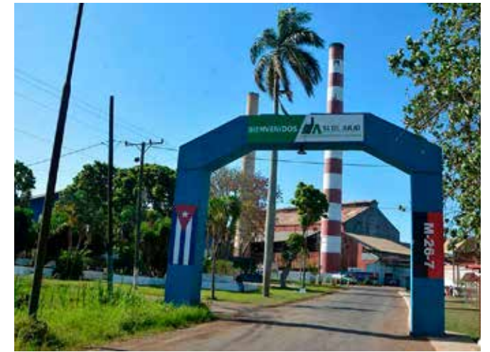
La Empresa Agroindustrial Azucarera 14 de Julio, de Cienfuegos, ha cumplido los planes en las últimas zafras y sobresale como la más integral por 10 años consecutivos.