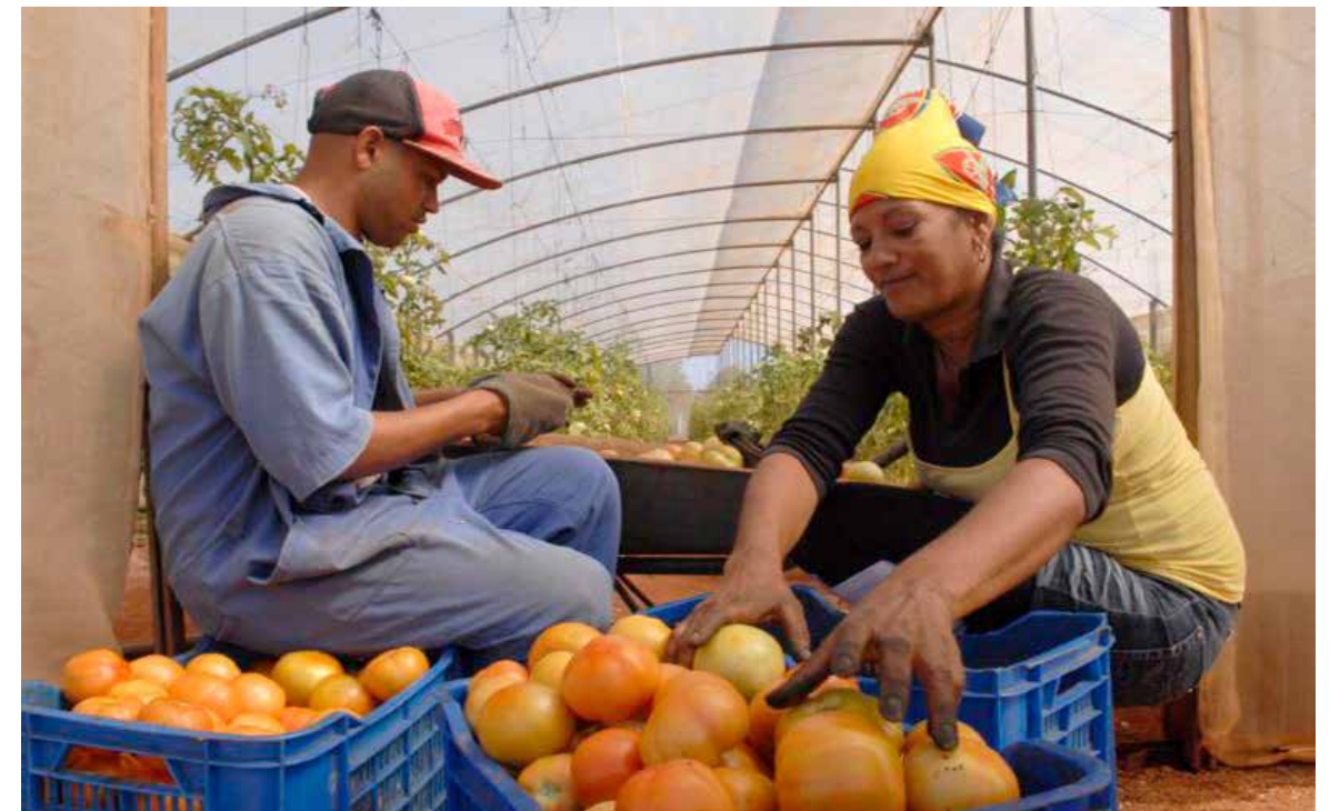
El sector agropecuario agrupa el 23 % de los trabajadores informales.

Por su parte, la Oficina Nacional de Inspección (ONIT) realizó 125 acciones de control a las micro, pequeñas y medianas empresas y cooperativas no agropecuarias de las autorizadas a la prestación de servicios en actividades de la industria, la construcción