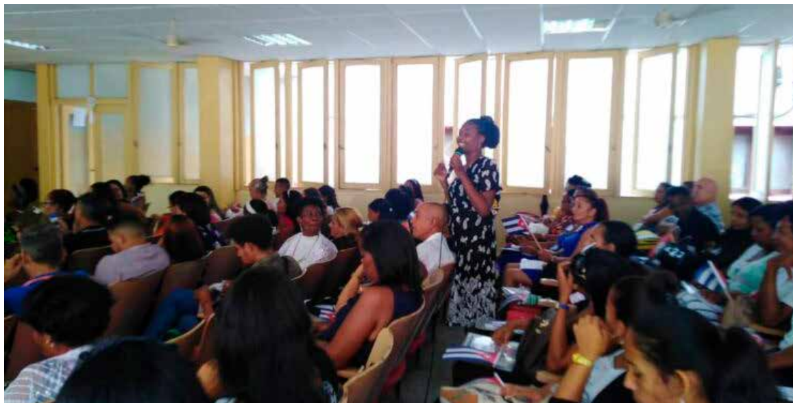
La masiva participación y el análisis de los deberes y cuestiones que afectan caracterizan cada paso del proceso orgánico hacia las sesiones finales del congreso.