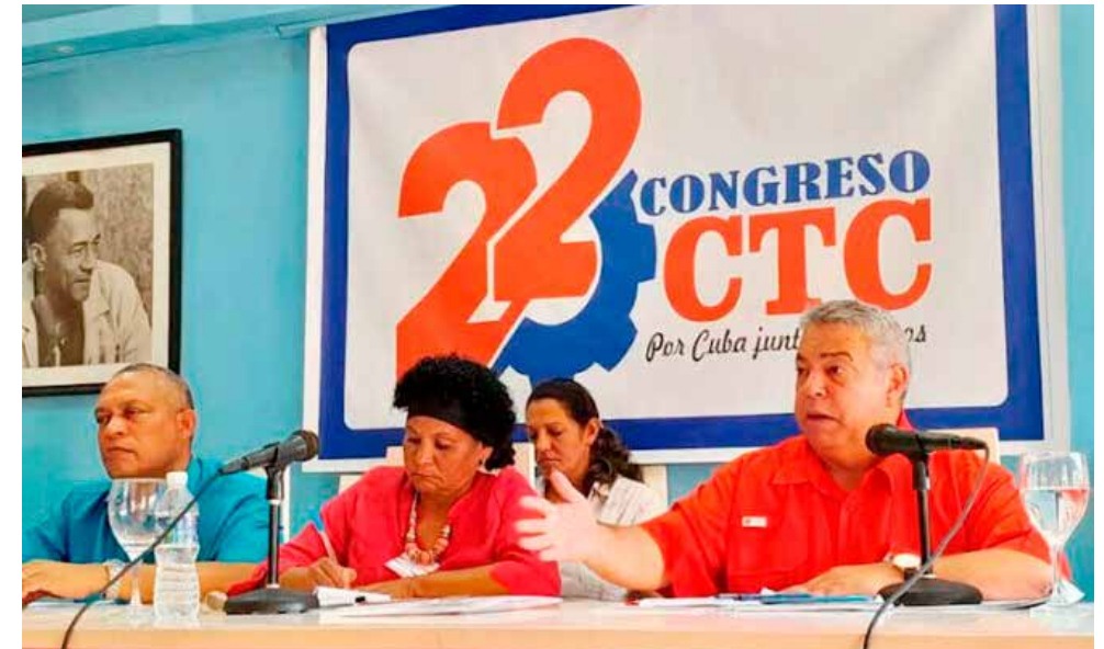
La necesidad de la capacitación sindical es uno de los temas en que ha enfatizado el secretario general de la CTC.