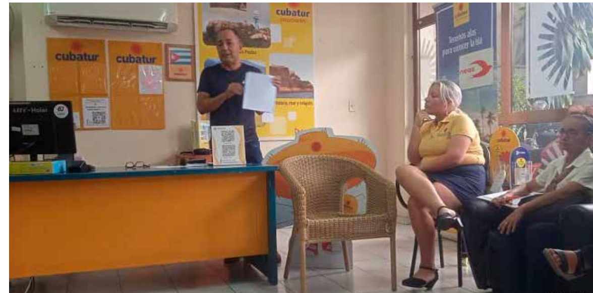
Cubatur Santiago fue de los primeros colectivos en los que se estudió y debatió el Anteproyecto de Estatutos de la CTC.

Por su importancia, ya que registró la vida de la Central de Trabajadores de Cuba (CTC) en los próximos cinco años, una de las fases del proceso orgánico del próximo congreso de la organización lo constituye el análisis del Anteproyecto de Estatutos. Al cierre de esta edición había comenzado esa fase en Santiago de Cuba, por el Sindicato Nacional de Trabajadores de la Hotelería y el Turismo (SNTHT), según reporte de la colega Betty Beatón Ruiz.