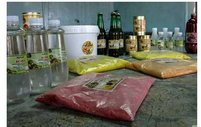
Producciones de la minindustria asociada al polo productivo Cauto-La Yaya.

ejemplos de ese impresionante avance hacia la prosperidad con las propias fuerzas, que todavía es excepción, pero un día será regla en este país de gente talentosa y emprendedora que tiene el derecho y la posibilidad de realizar sus sueños en Cuba.