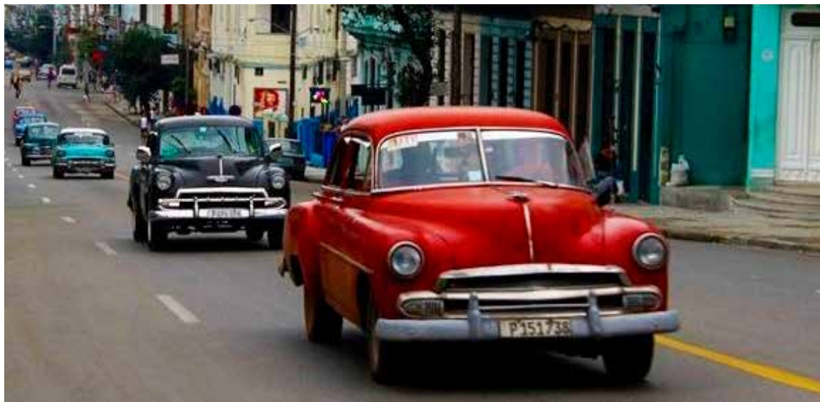
Se han adoptado medidas para enfrentar las violaciones en materia de contratación y la presencia de trabajo informal.

y la alimentación, en las cuales se detectaron 710 infracciones, asociadas fundamentalmente a incumplimientos en el proceso de contratación laboral, no tener establecido un régimen de trabajo y descanso, ni confeccionados los registros de tiempo de servicio y salario devengados, no existir evidencia de la remuneración pagada a los trabajadores, ni identificadas las medidas para la prevención de accidentes de trabajo.