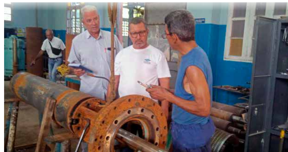
En el 2023, los innovadores y racionalizadores hidráulicos recuperaron 129 equipos de bombeo en talleres de electromecánica.