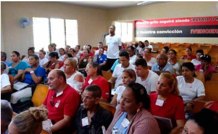
Los incontables aportes de la Anir fueron resaltados en los debates.

Un tema enfatizado en las conferencias fue la necesidad del conocimiento pleno sobre la actualización de las normas jurídicas en materia laboral y de la descentralización de facultades otorgadas a la empresa estatal socialista, actor fundamental de la economía.