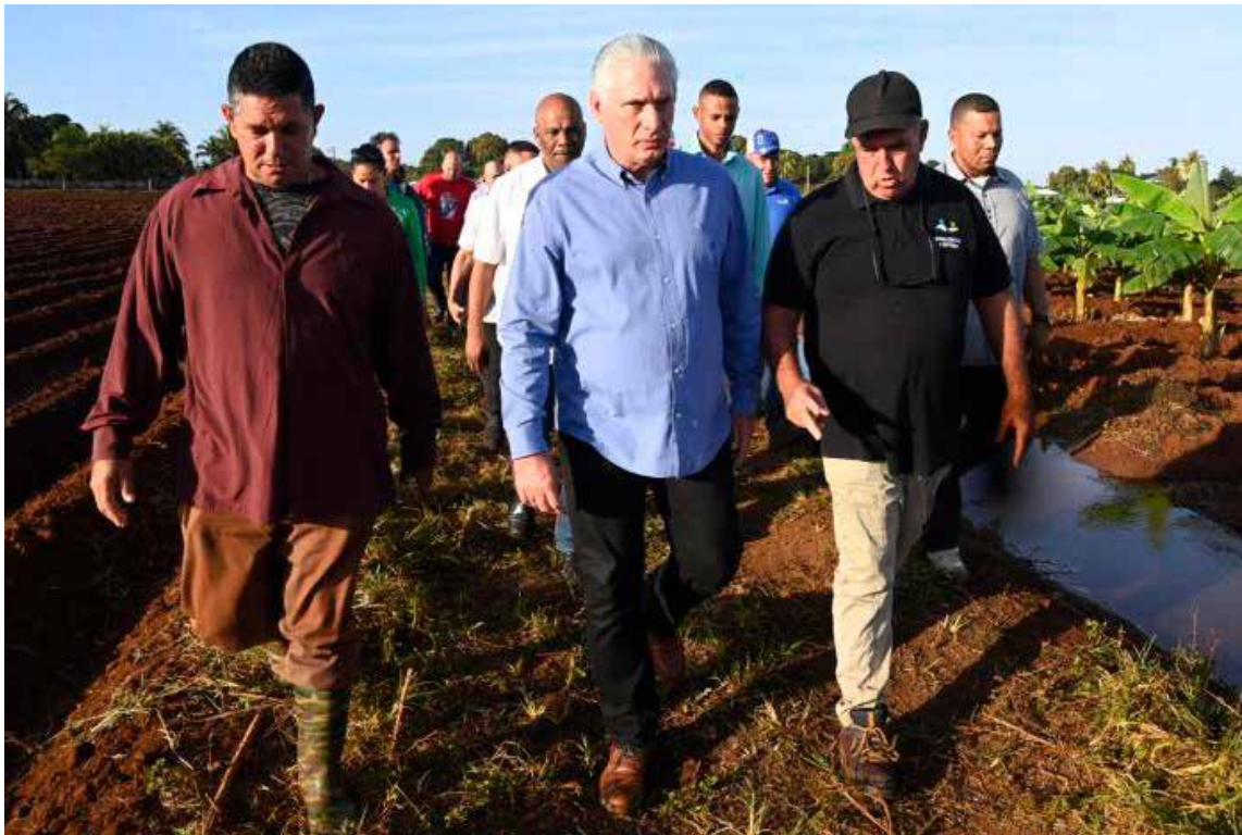
El Presidente cubano en recorrido por áreas agrícolas de Caibarién, en Villa Clara.