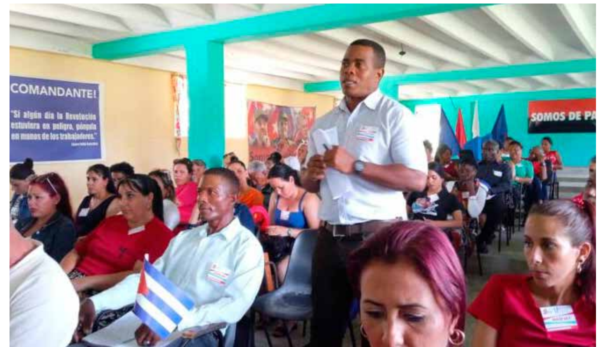
En cada encuentro se han aportado innumerables ideas para impulsar la economía.

propuestas emanadas de los debates, como la participación de los trabajadores en la regulación, gestión y control de la economía en las entidades; además de que intervengan activamente en la elaboración del proyecto del plan y el presupuesto y evalúen su ejecución.