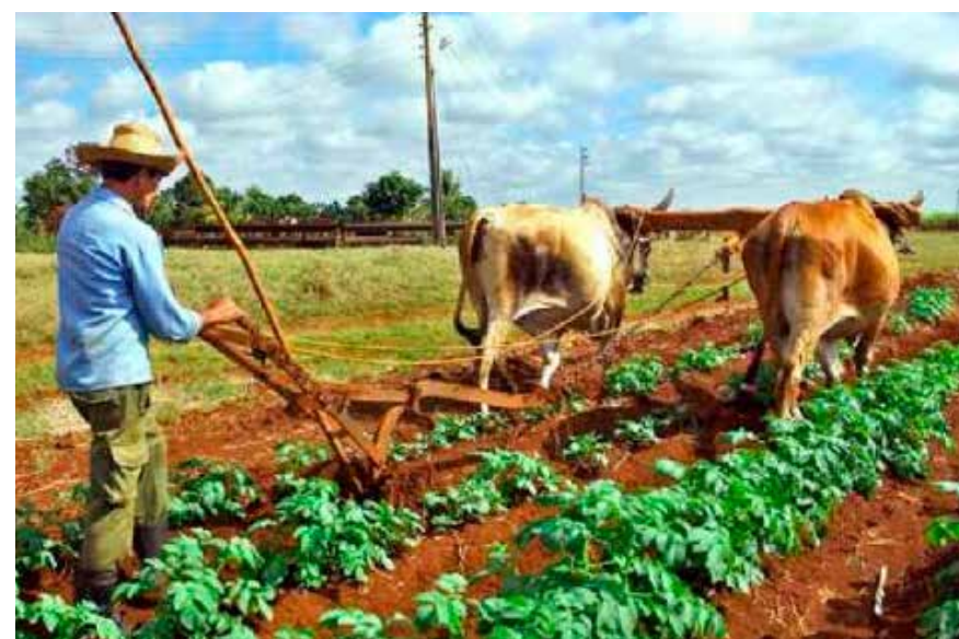
Resulta vital aumentar la producción para poder regular la oferta de bienes y servicios.

Alegó que, desde el anterior encuentro, efectuado en noviembre de 2023, la CTC y sus sindicatos desarrollaron un amplio proceso de análisis de las proyecciones del Gobierno para corregir distorsiones y reimpulsar la economía, precedido de un ejercicio de capacitación a los cuadros, que permitió centrar las evaluaciones en el papel del sindicato y los trabajadores en la solución