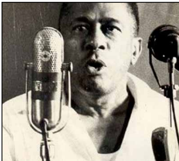
Siempre leal al Comandante en Jefe Fidel Castro Ruz y a la Revolución.

A su obra debemos acercarnos en estos tiempos de enormes desafíos, porque fue y seguirá siendo un verdadero maestro para cualquiera que aspire a ser un buen cuadro sindical. ■