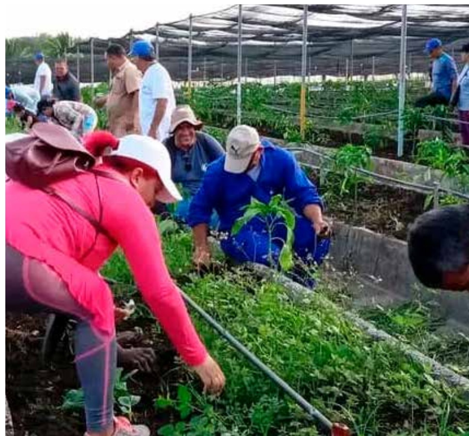
Jornada productiva en la Isla de la Juventud.