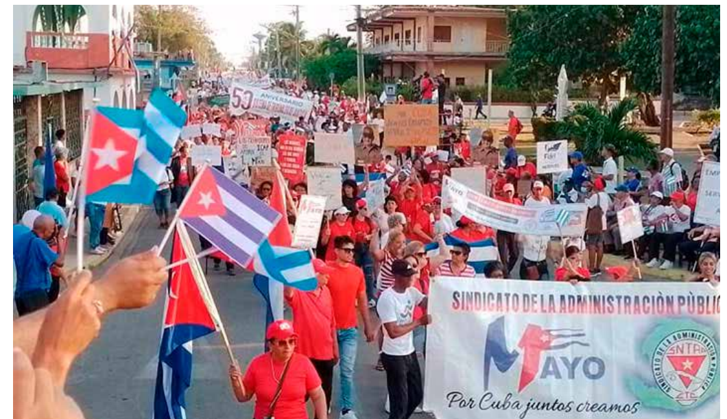
Los pineros hicieron honor al lema por la efeméride: Por Cuba juntos creamos.