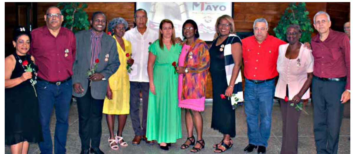
Décadas de entrega desinteresada, experiencia y amor dedicadas a la labor sindical se suman en los homenajeados.