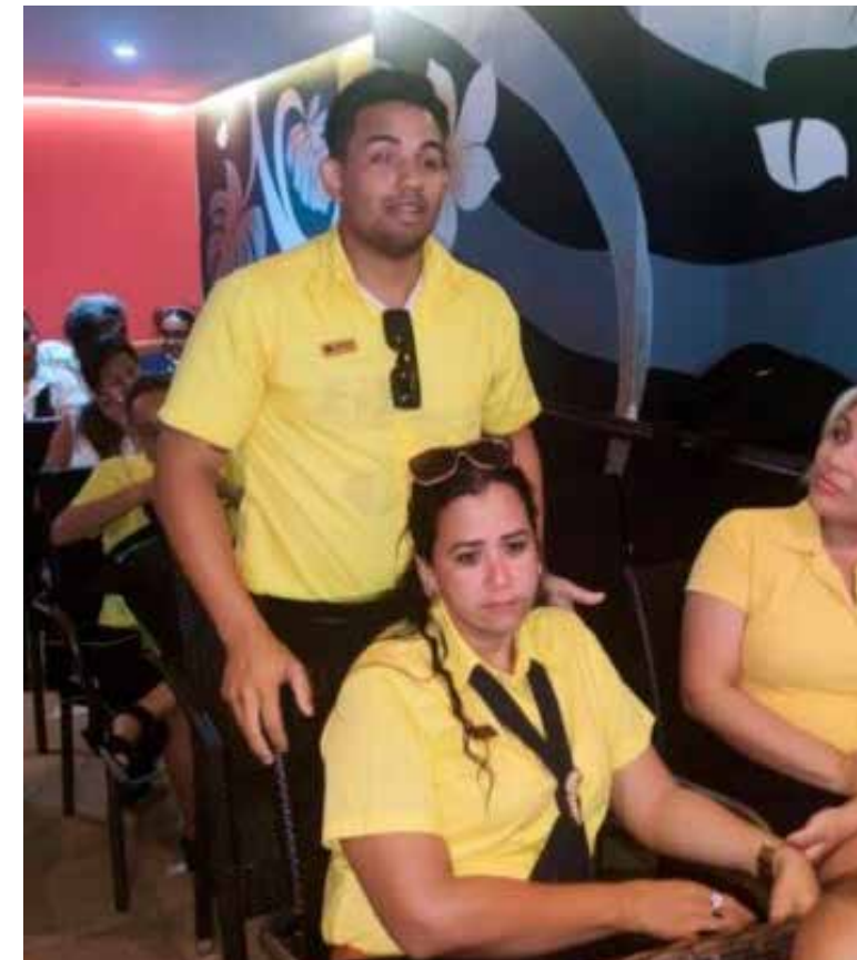
Emotivo resultó el intercambio de experiencia entre jóvenes y veteranos en Santiago de Cuba.