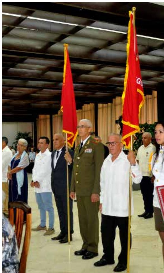
Varios colectivos laborales fueron reconocidos durante la ceremonia.