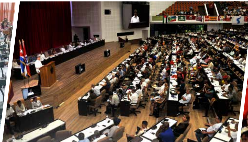
Más de mil 100 amigos de 58 países, muchos de ellos jóvenes, asistieron al Encuentro de solidaridad con Cuba y contra el imperialismo.