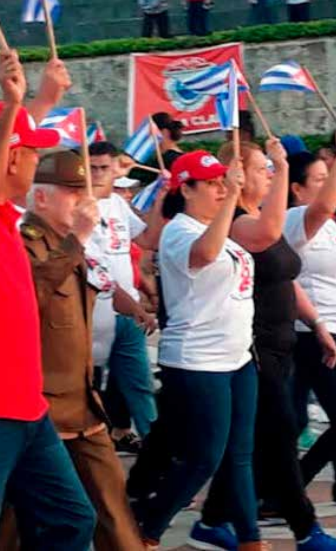
El Comandante de la Revolución Ramiro Valdés acompañó a los villaclareños en la marcha por el 1° de Mayo.