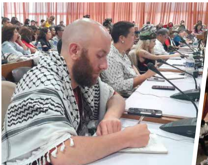
Los participantes en el evento mostraron su apoyo al pueblo palestino.

Antes de la clausura del encuentro, los activistas se reunieron en tres comisiones. En la dedicada a la lucha de las organizaciones de solidaridad, sociales y populares en defensa de la paz y la soberanía de los pueblos participó el Presidente cubano. Aquí se