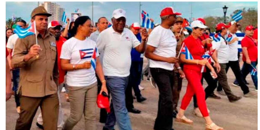
Salvador Valdés Mesa, vicepresidente de la República de Cuba presidió la marcha holguinera.