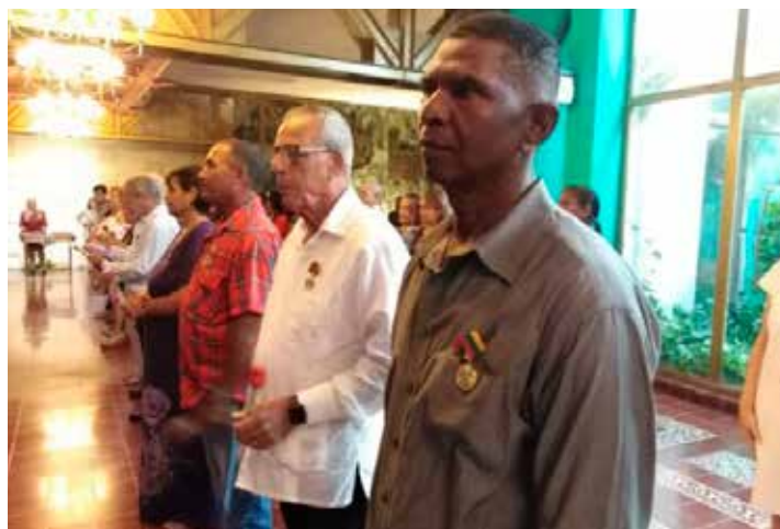
Una treintena de trabajadores e instituciones sobresalientes fueron reconocidos en el salón de protocolo de la plaza de la Revolución Mayor General Ignacio Agramonte, de Camagüey.