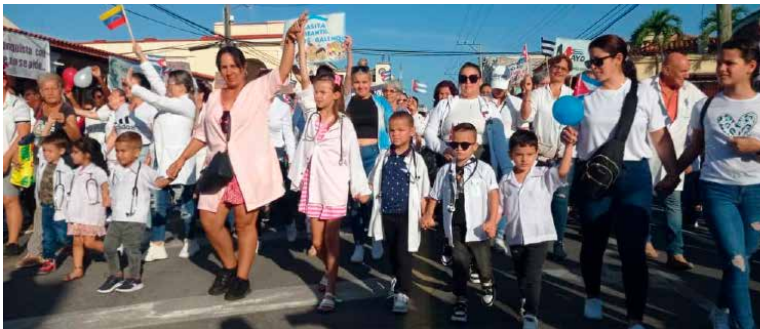
Los niños también tuvieron su protagonismo en Pinar del Río.