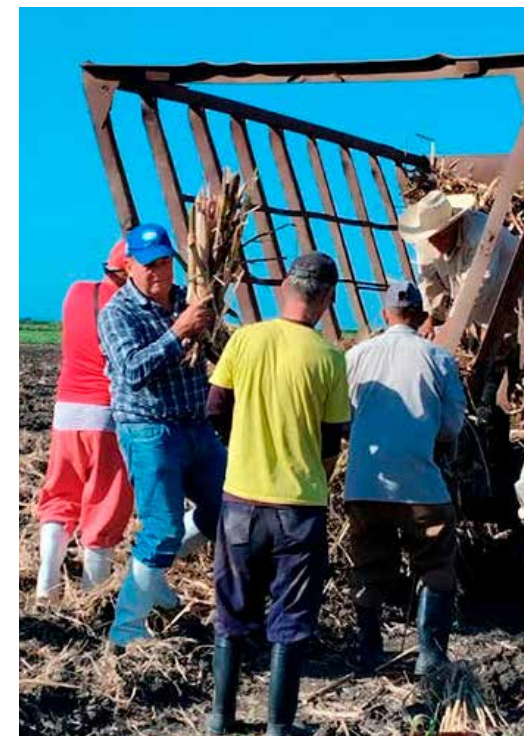
En Villa Clara, los trabajadores apoyaron la siembra de caña.