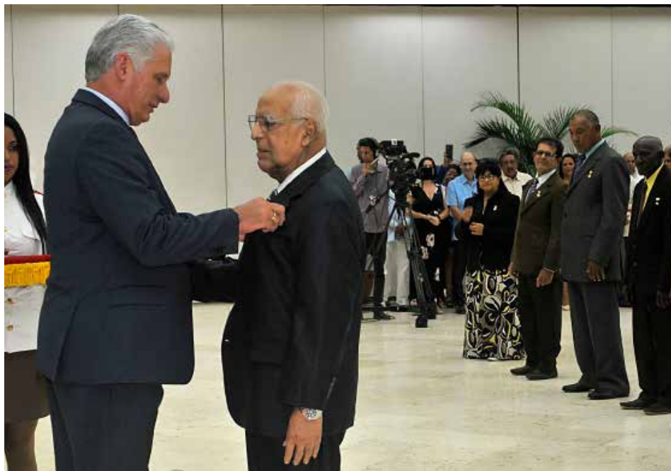
Entre los condecorados estuvo Ricardo Cabrisas Ruíz, vicepresidente y ministro del Comercio Exterior y la Inversión Extranjera.

Doctor Especialista de Primer y Segundo Grado en Ortopedia y Traumatología. Director del Hospital Militar de Matanzas.