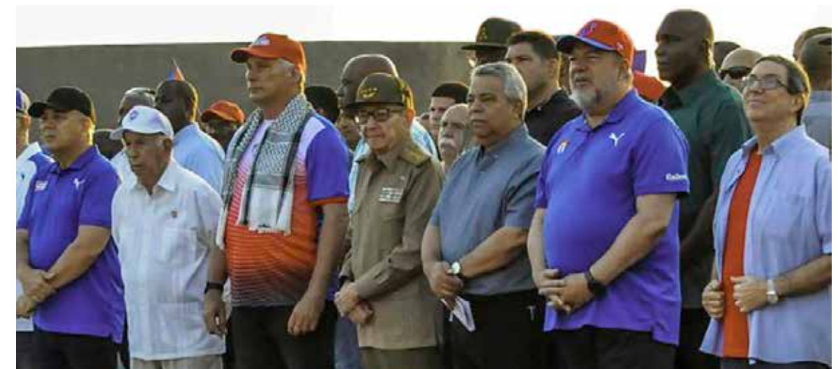
El General de Ejército Raúl Castro, líder de la Revolución, y Miguel Díaz-Canel, Primer Secretario del Comité Central del Partido Comunista de Cuba y Presidente de la República, encabezaron la concentración en la Tribuna Antiimperialista, en La Habana.

Los trabajadores cubanos, en la convicción de propietarios de los medios fundamentales de producción, debemos ir a un control y fiscalización cada vez mayor de los recursos que disponemos, así como mantener un combate incesante a la corrupción, las indisciplinas e ilegalidades.