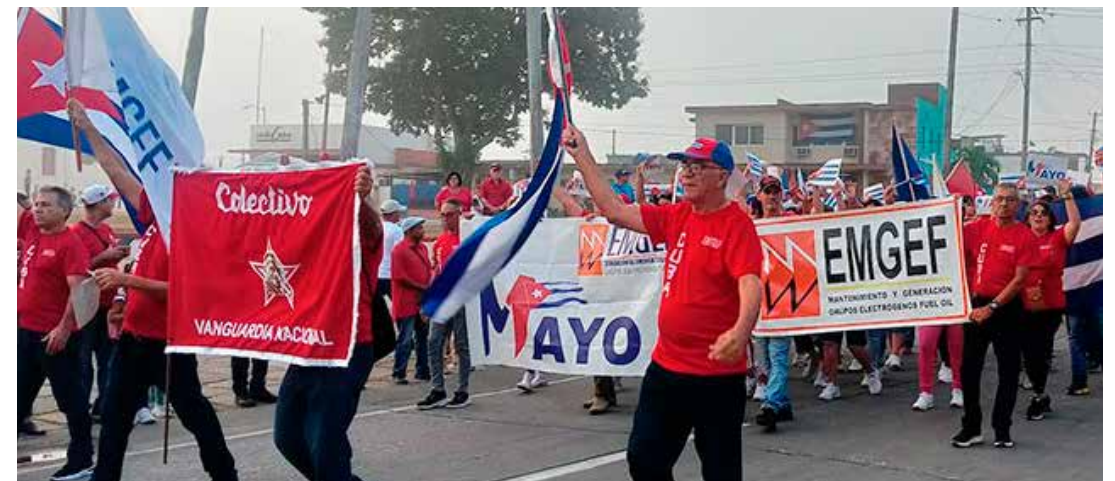
Los espirituanos patentizaron su confianza en la Revolución.