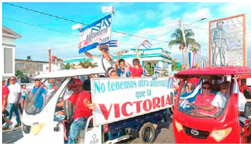
En Matanzas se alzaron las banderas por la unidad, la soberanía, la paz y en contra del bloqueo estadounidense.