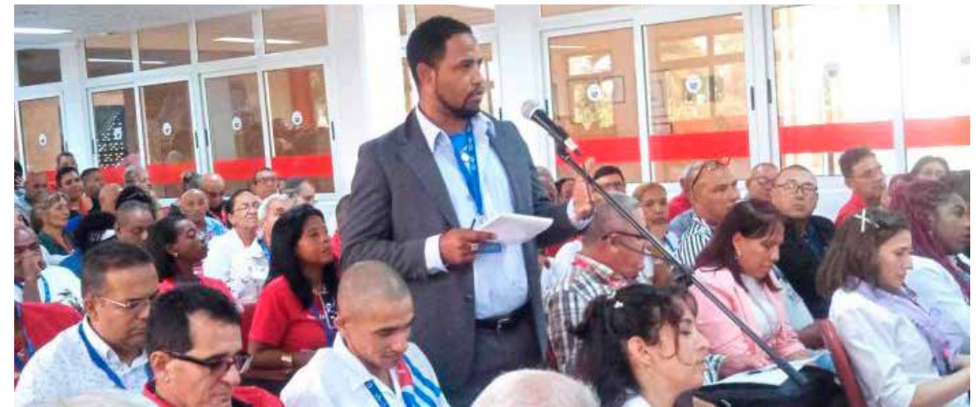
Los tiempos actuales exigen un dirigente sindical bien preparado.