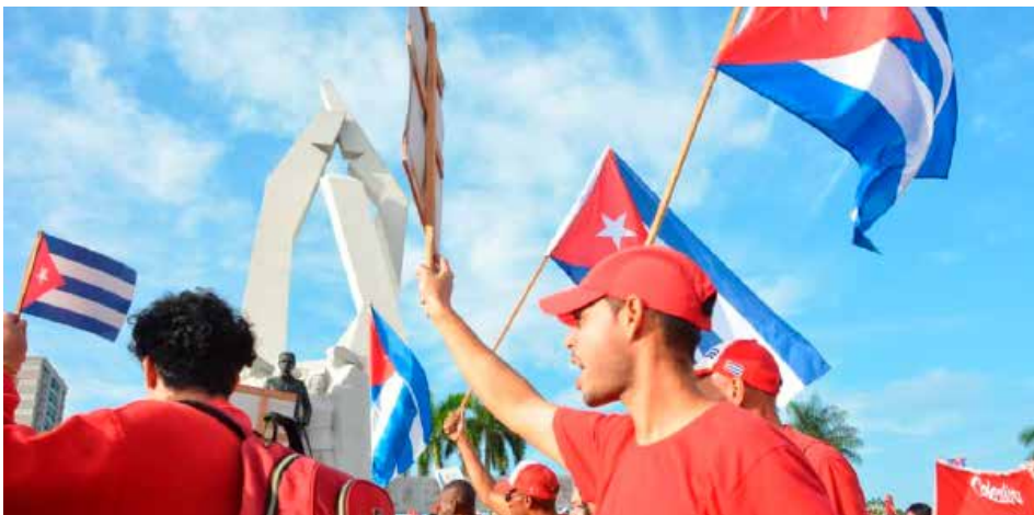
La juventud camagüeyana tuvo protagonismo en los desfiles realizados en la provincia.