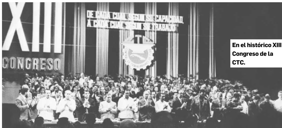
En el histórico XIII Congreso de la CTC.