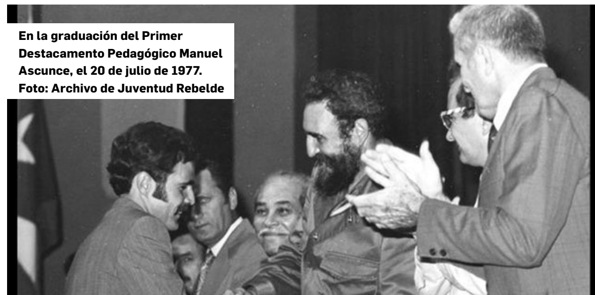
En la graduación del Primer Destacamento Pedagógico Manuel Ascunce, el 20 de julio de 1977.

Fue en 1959 cuando tuvo mayor presencia en el teatro de la CTC (en 13 oportunidades) y se dirigió, entre otros, a los empleados de la Compañía de Teléfonos para respaldar las nuevas tarifas telefónicas; a los guagüeros, gastronómicos, textiles, maestros rurales, bancarios y a los dirigentes sindicales reunidos en el X Congreso de la entonces Confederación, a quienes llamó a erradicar de raíz el mujalismo y a contar con cuadros revolucionarios que representaran los intereses de los trabajadores.