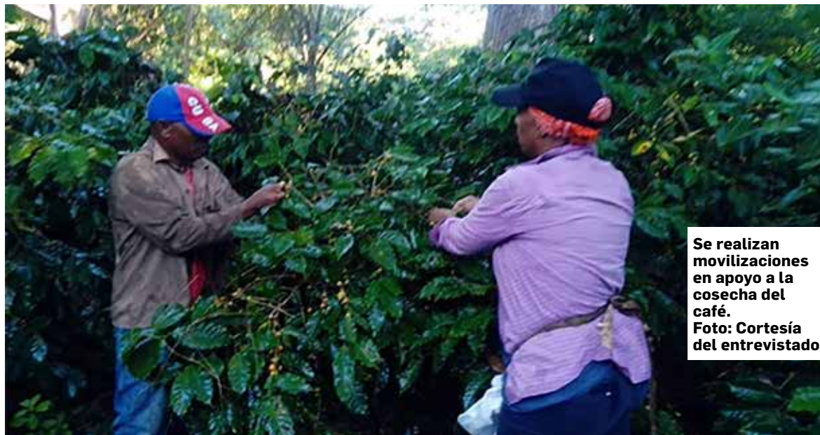
Se realizan movilizaciones en apoyo a la cosecha del café.

nueve mil están afiliados. Así que sumarlos a nuestras filas será una de nuestras urgencias en el 2024”.