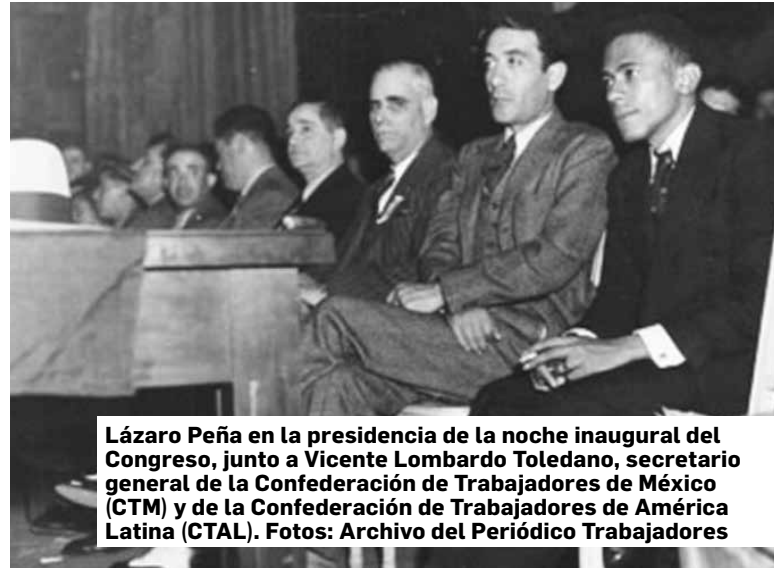
Lázaro Peña en la presidencia de la noche inaugural del Congreso, junto a Vicente Lombardo Toledano, secretario general de la Confederación de Trabajadores de México (CTM) y de la Confederación de Trabajadores de América Latina (CTAL).

Imposible enumerar todas las preocupaciones expuestas, pero vale destacar dentro de ellas la necesidad del mejoramiento y cumplimiento de la legislación social; los problemas de unidad de acción; la constitución de una