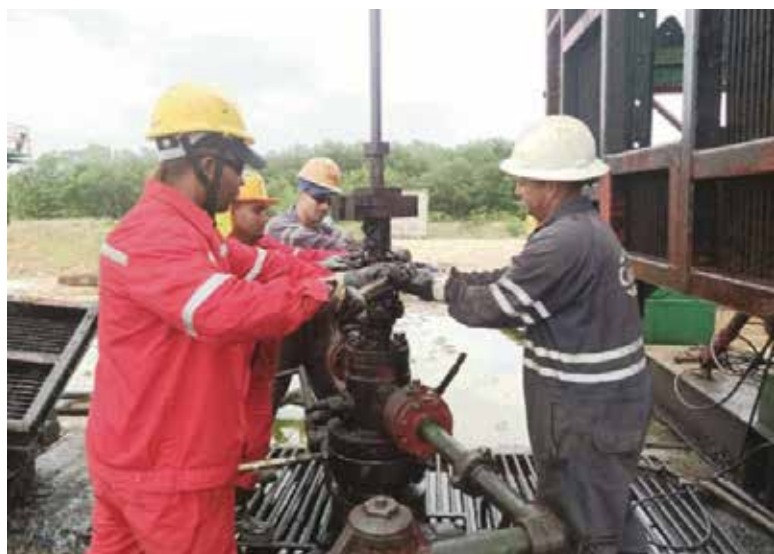
Los trabajadores del petróleo en el territorio dan un importante aporte a la economía del país.

labor desarrollada por los aniristas, quienes con sus soluciones contribuyeron de manera directa a la eficiencia de los procesos productivos y de servicios. Entre las entidades que sobresalieron por sus aportes están la Empresa de Perforación y Extracción Petróleo Centro, Energía y Minas, la Empresa de Construcción y Montaje de Obras para el Turismo, y Geocuba.