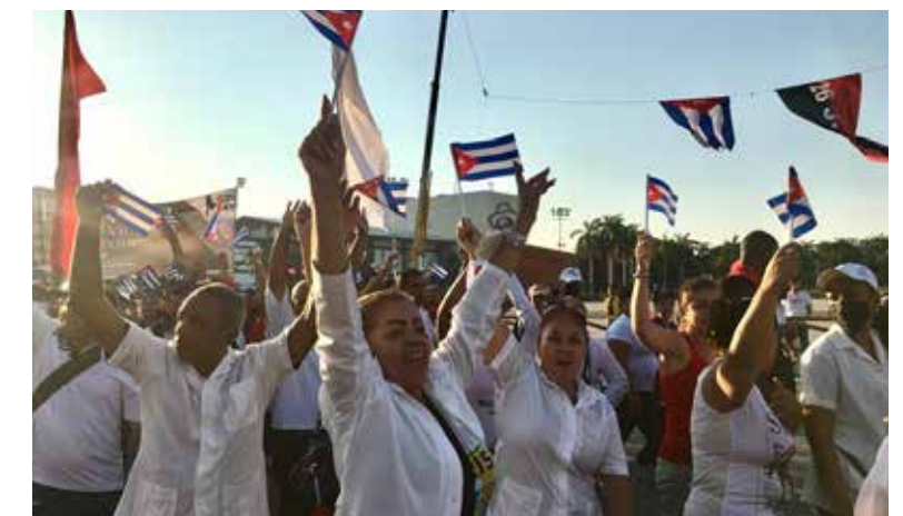
Con el mismo entusiasmo que desfilaban el 1º de mayo, los santiagueros asumen las tareas en la jornada Fieles a los principios y a nuestra historia.

Subrayó la importancia de perfeccionar el vínculo con los nuevos actores de la economía, tener en cuenta sus inquietudes y priorizar su sindicalización. “Son más de 42 mil trabajadores por cuenta propia y solamente