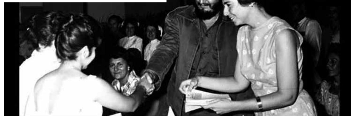
Junto a Vilma Espín, durante la constitución de la Federación de Mujeres Cubanas, el 23 de agosto de 1960.

Significativo resultó en 1960, su discurso del 23 de agosto, en el acto de fusión de todas las organizaciones femeninas revolucionarias, que dio nacimiento a la Federación de Mujeres Cubanas.