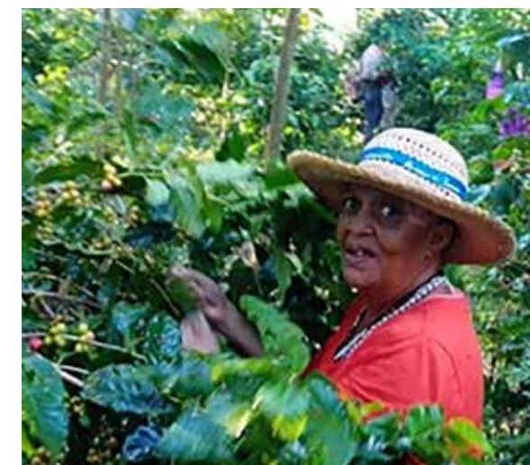
Muchos trabajadores de la región oriental se han movilizado hacia la zafra del café.