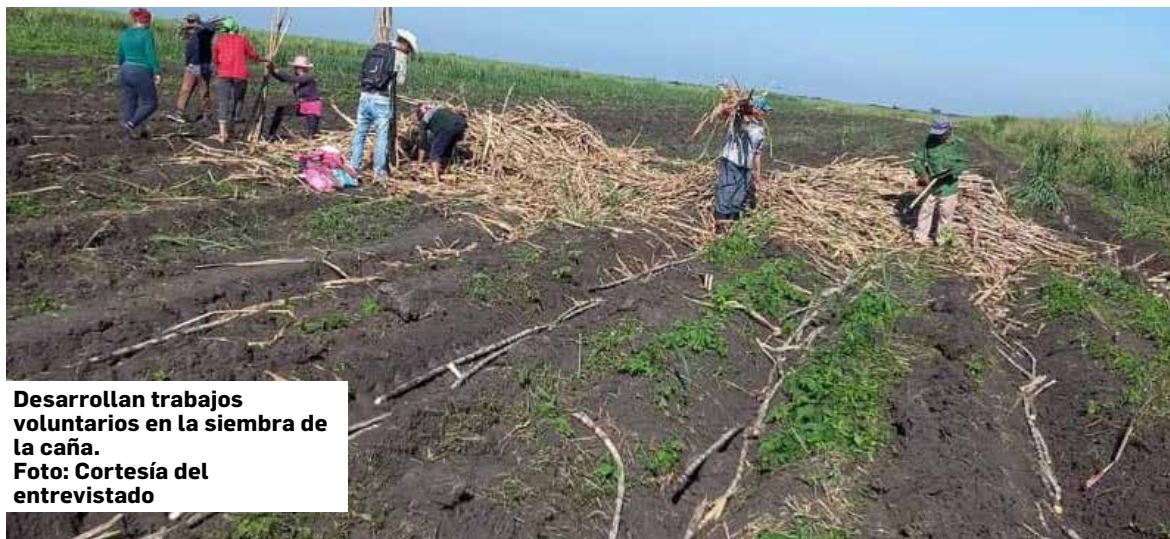
Desarrollan trabajos voluntarios en la siembra de la caña.