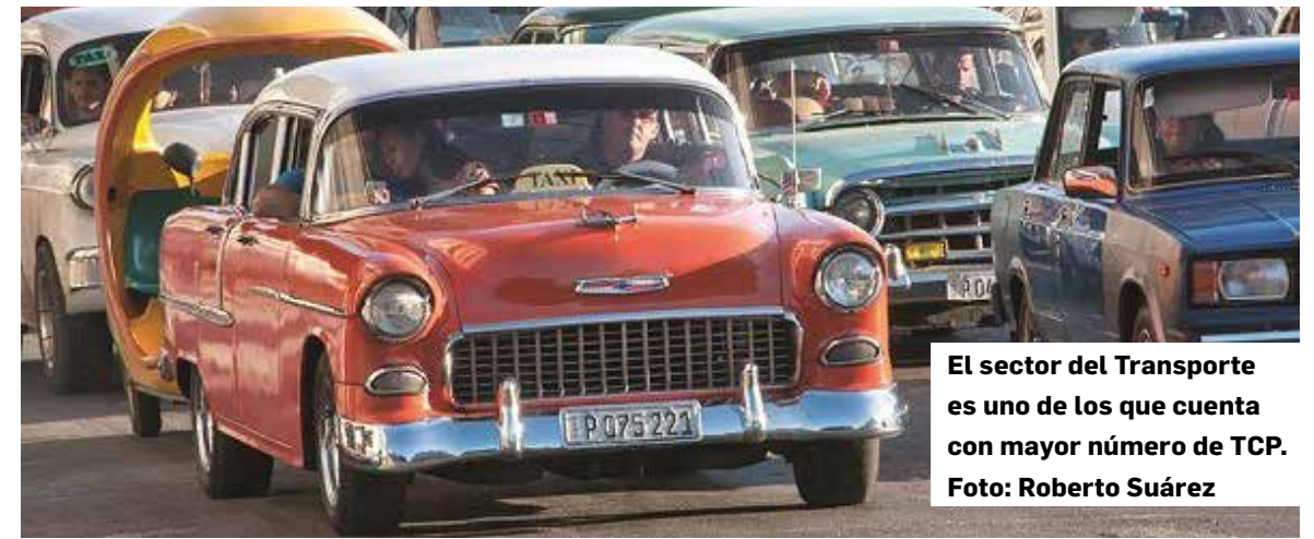
El sector del Transporte es uno de los que cuenta con mayor número de TCP.