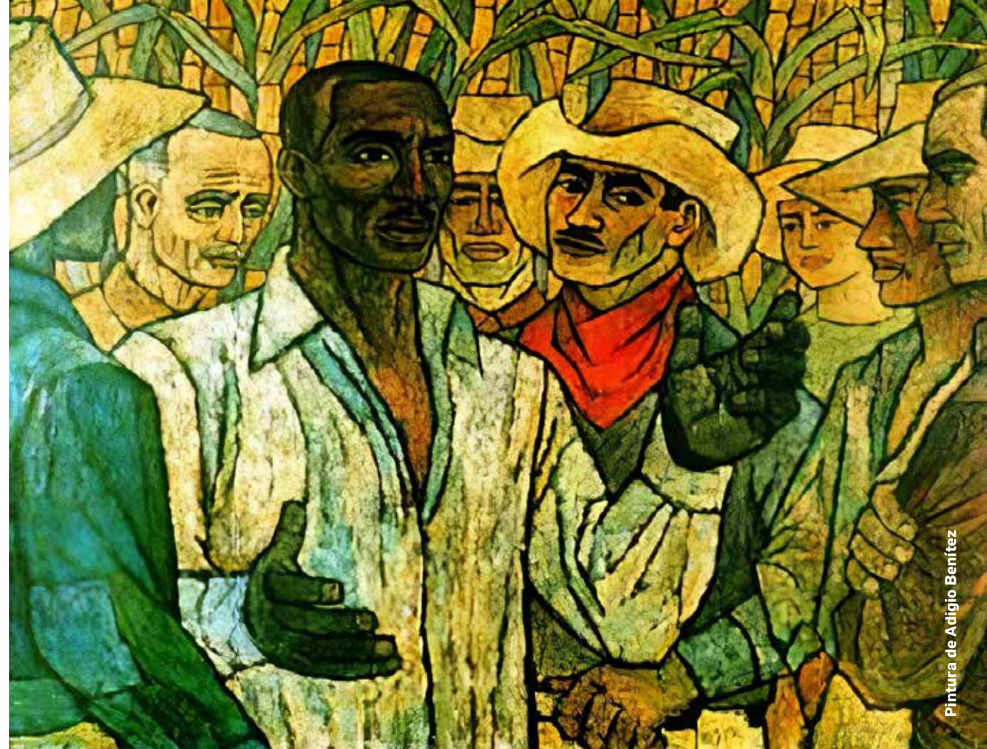
Pintura de Adigio Benítez