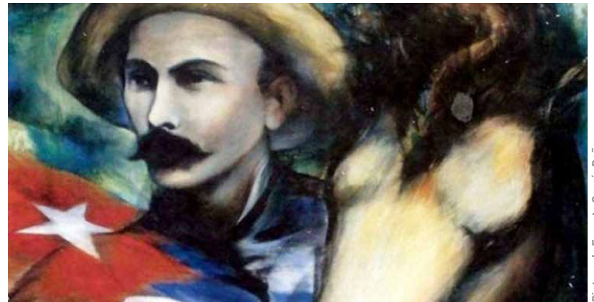
Pintura de Ernesto García Peña

“El dirigente sindical más consciente y más capaz, no es el que más contradicciones y líos tiene con su administración sino el que tiene menos, no porque permita que la administración haga lo que le da la gana, sino porque sabe actuar para que no pueda hacerlo; del mismo modo que el administrador más inteligente es aquel que menos líos tiene con la sección sindical, porque comprende mejor que, solo con la cooperación de los trabajadores puede trabajar”.