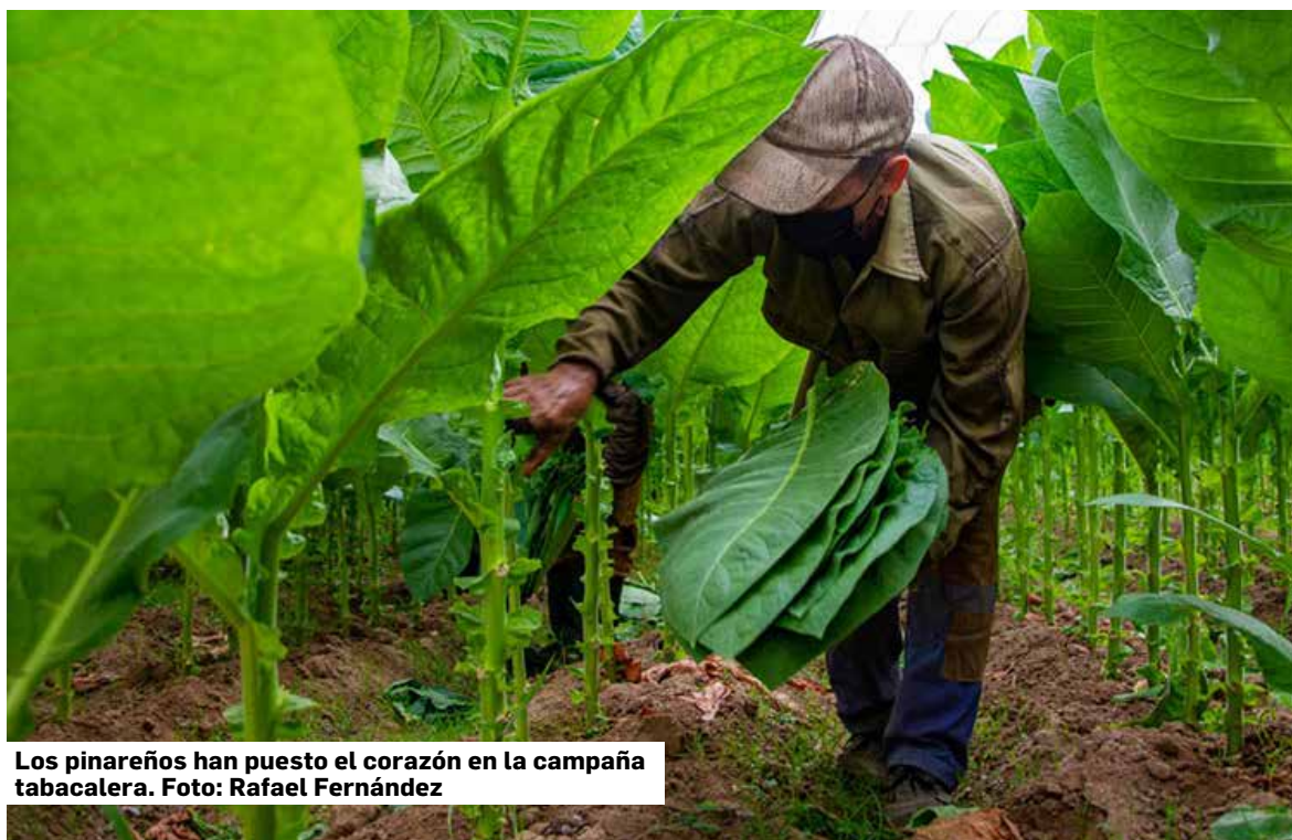
Los pinareños han puesto el corazón en la campaña tabacalera.

Grandes metas tendrá el movimiento sindical hacia el XXII Congreso. Sin lugar a dudas, la producción de alimentos para el pueblo estará en el centro de atención. Sólo así se contribuirá a que bajen los altos precios y que los salarios tengan un respaldo, tanto para los trabajadores como los pensionados. Vale recordar aquella frase expresada por el General de Ejército Raúl Castro Ruz, a raíz del llamado Período Especial: “los frijoles son tan importantes como los cañones”. Hoy también lo son.