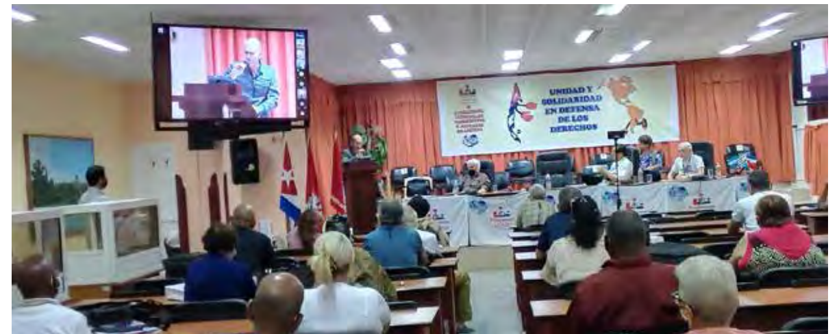
Los delegados acordaron impulsar políticas dirigidas a mejorar la seguridad social, y campañas para que se respeten los derechos de los trabajadores y pensionados.

Fue un triste panorama reiterado por algunos representantes de organizaciones en América Latina y el Caribe, denunciando de la tendencia marcada desde hace casi medio siglo con el auge de las políticas neoliberales, del repetido y deliberado retroceso de conquistas sociales, con efectos desastrosos para un sector tan vulnerable como el de