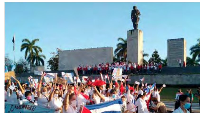
El Complejo Escultórico Comandante Ernesto Guevara, de Santa Clara, se estremeció este Primero de Mayo.