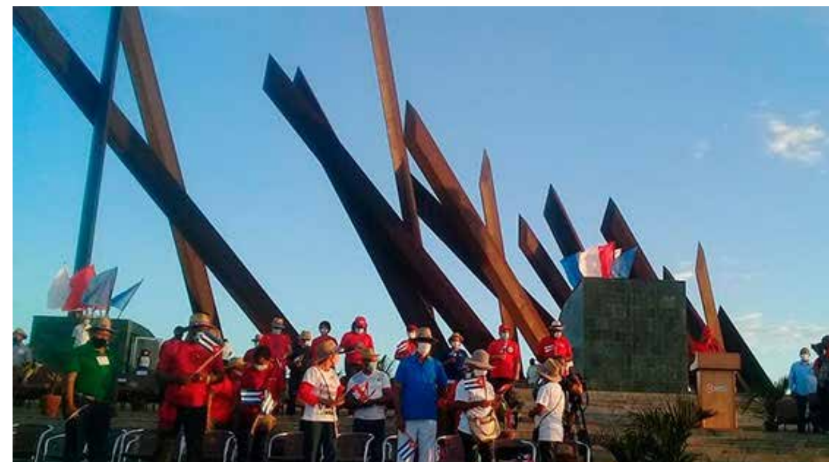
Los santiagueros protagonizaron una marcha tan alegre y patriótica como sus habitantes.