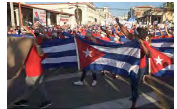
En Pinar del Río, hubo una clara respuesta de unidad.