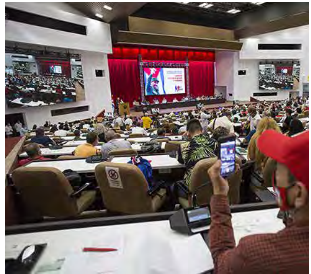
Los más de mil delegados al encuentro abogaron por el fin del bloqueo económico, comercial y financiero impuesto hace 62 años por EE. UU. a Cuba.

“El mundo ha sido solidario con Cuba y por eso Cuba se siente cada día más solidaria con el mundo”.