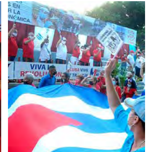
Artemisa salió con la algarabía de gente sencilla y de pueblo, que vive y trabaja por Cuba.