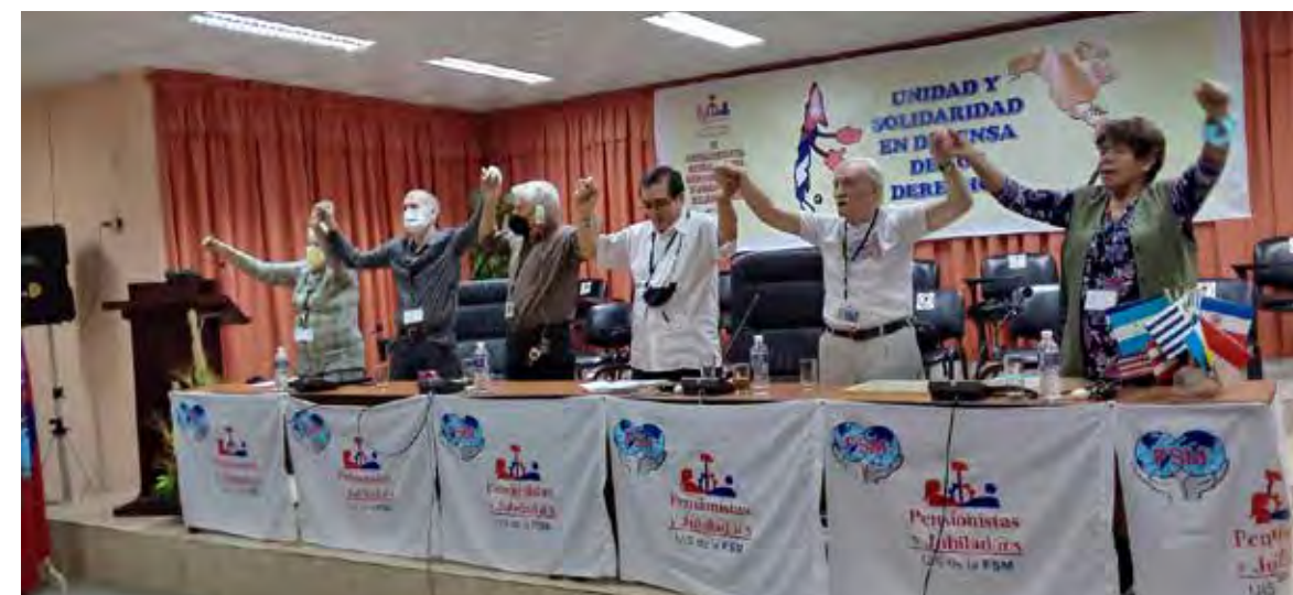
Todos entonaron el himno La Internacional reafirmando la unidad de pensamiento y acción.

porque demandamos más asistencia y ya no producimos. Pretenden acabarnos, pagándonos menos, recortando y demorando los servicios, como los de salud pública. Por eso la unidad de los trabajadores activos y pasivos, como se denomina a los jubilados, es la única solución frente a esas políticas. Y ante ese triste panorama está equidistante el ejemplo de Cuba”.