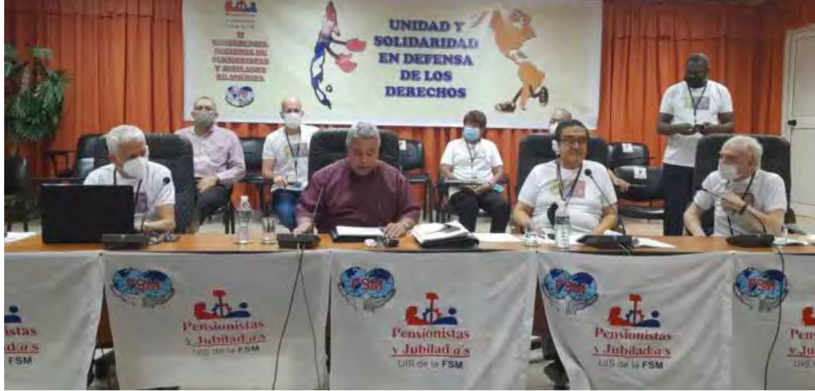
Cuba acompaña al movimiento sindical internacional en la lucha por alcanzar sus sueños y garantías, reafirmó Ulises Guilarte, secretario general de la CTC, en la jornada inaugural.