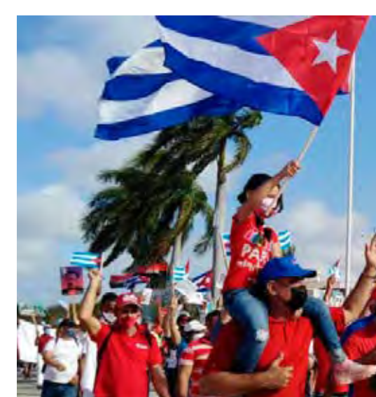
La alegría caracterizó el desfile en Ciego de Ávila.