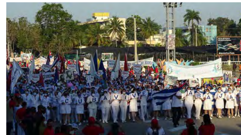
Más de 541 mil granmenses festejaron la efeméride con un desfile popular en las principales plazas de la provincia.