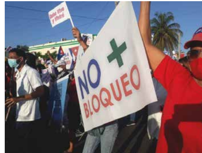
Y fue realidad el voto de los habitantes de Matanzas de realizar el mejor desfile de la historia por el Primero de Mayo.