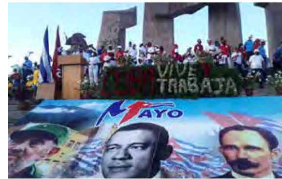
Multitudinaria y colorida fue la marcha de los guantanameros.

Este domingo millones de cubanos protagonizaron a todo lo largo del país desfiles para conmemorar la fecha del proletariado mundial, en los cuales reiteraron su respaldo al socialismo y su rechazo al bloqueo que, por más de 62 años, han mantenido contra Cuba los sucesivos gobiernos de Estados Unidos. ■ (Con información de Prensa Latina)