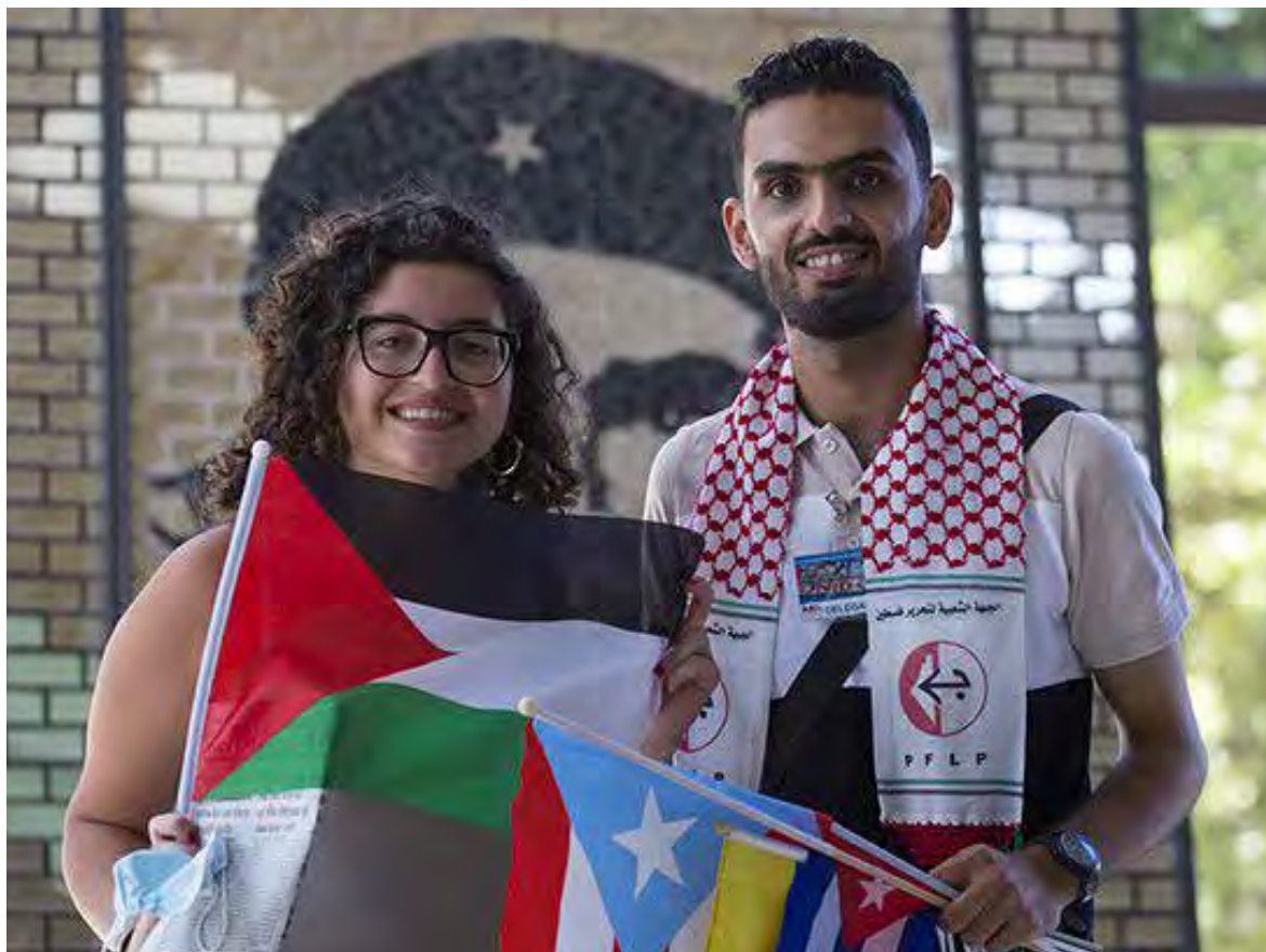
Jóvenes participantes en el Encuentro Internacional de Solidaridad con Cuba, en el Palacio de Convenciones de La Habana.

“Ayer enviamos un mensaje al mundo en todas las plazas del país: Cuba vive y trabaja”, resaltó el Presidente cubano, en la clausura del Encuentro Internacional de Solidaridad con Cuba, con el que concluyeron las actividades por el Primero de Mayo.