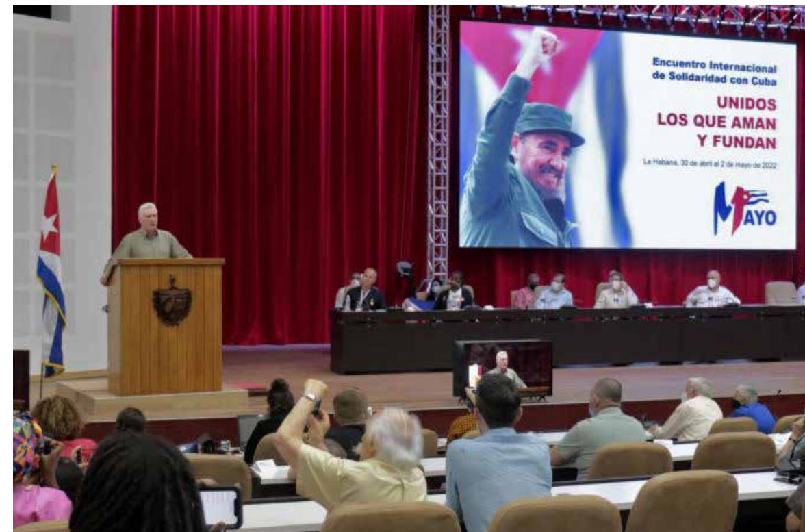
La solidaridad seguirá siendo un mensaje permanente de paz imposible de acallar, afirmó el Presidente cubano.

En relación con la situación entre Rusia y Ucrania subrayó: “Nos oponemos al uso de la