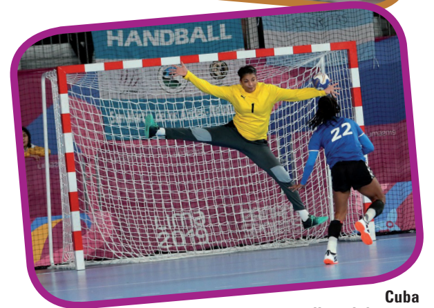
Cuba discutirá contra Argentina la semifinal. | foto: Mónica Ramírez