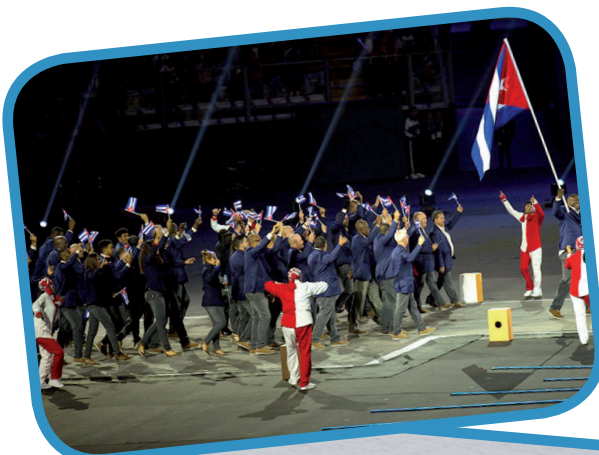
Cuba volvió a ser aplaudida en la ceremonia inaugural.