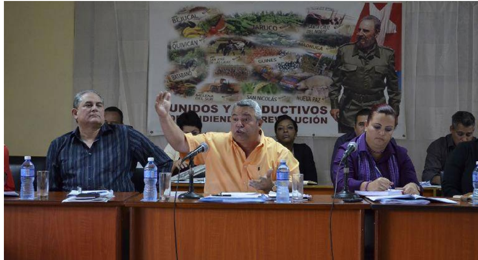
Los logros se deben a la motivación de los trabajadores, a los controles y chequeos que realizamos en cada sección sindical, reflexionó en Mayabeque Ulises Guilarte De Nacimiento, secretario general de la CTC.