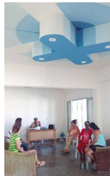
Con un diseño moderno, en el que se incluyen lámparas construidas in situ , ventanas, puertas, sistemas eléctrico e hidráulico, el acabado del inmueble es de lujo.