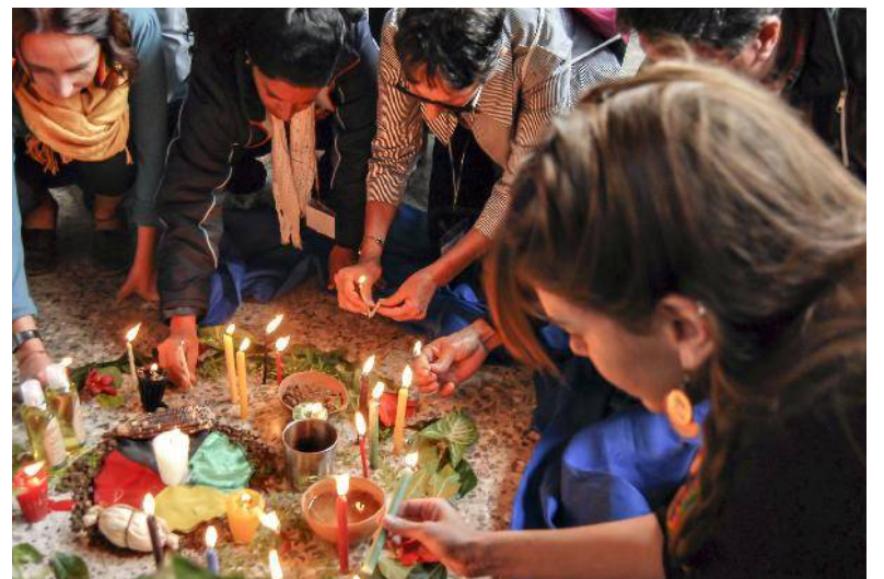
Las jornadas estuvieron dedicadas a la memoria de la luchadora hondureña Berta Cáceres, quien fuera una activa participante en ediciones anteriores del Taller de Paradigmas Emancipatorios de América Latina y el Caribe.

“Lo más importante es la solidaridad y la convergencia, además podemos comparar y ver el impacto que estamos teniendo en nuestra lucha,