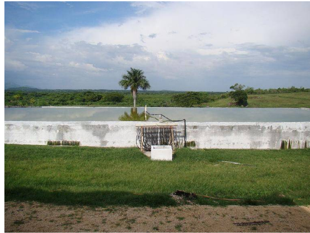
Biodigestor del Centro Porcino Pedregales, municipio de Bayamo.

“Durante las últimas décadas, en el mundo capitalista, ha existido una carrera constante para implementar el uso eficiente de la energía renovable. Si los que cuentan con desarrollo, bienes y recursos la