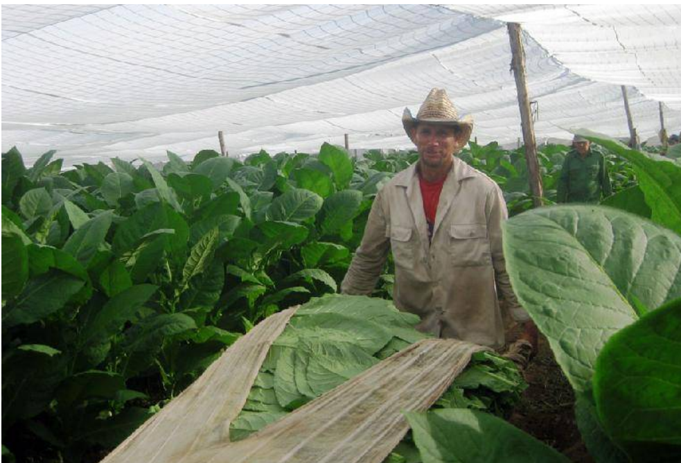
Tabaco de alta calidad, destinado fundamentalmente a la exportación, se logra en el área del productor cienfueguero.

*Abertura microscópica en la epidermis de las partes verdes de los vegetales superiores que permite el intercambio de gases y líquidos con el exterior.