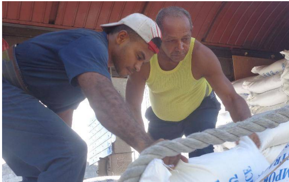
Trabajar junto a este septuagenario devine lección práctica de laboriosidad.

Nacer en Santiago de Cuba fue lo primero, aunque de chiquito hubo muchos momentos duros.