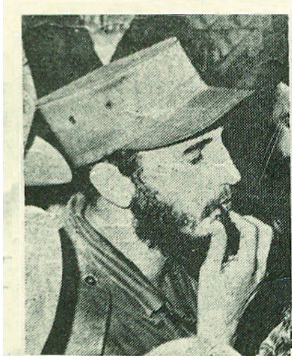
Saludo que Fidel firmara a Graupera, el cual iba dirigido a los pinareños.

Casi seis décadas después, se recuerda con emoción aquella noche de enero de 1959, cuando Fidel se dirigió al pueblo pinareño