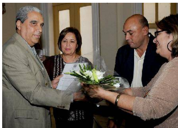
Varios trabajadores e investigadores fueron estimulados por su labor.