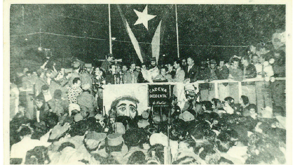
Fidel en la noche del 17 de enero de 1959, cuando entró la Caravana de la Libertad a Pinar del Río.