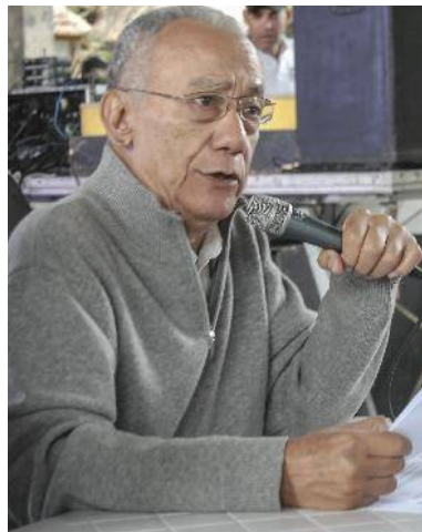
Fernando Martínez Heredia.