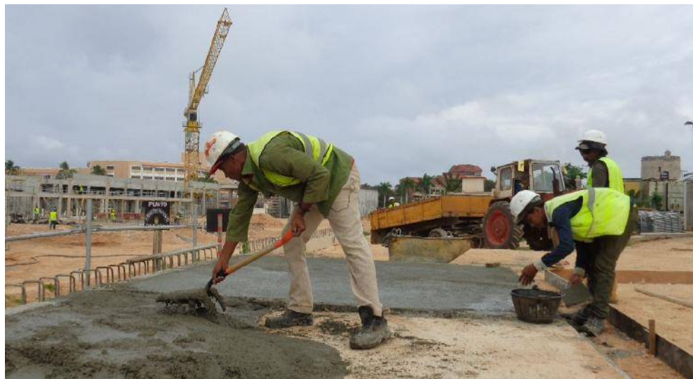
El nuevo sistema de pago aplicado en las obras constructivas de Varadero elevan productividad, eficiencia, salarios y estabilidad de la fuerza laboral.