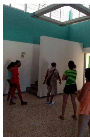
Casa de Cultura 4 de Abril, hoy entre las más hermosas del país.

diversos oficios relacionados con la construcción, la carpintería y la herrería, entre otros.