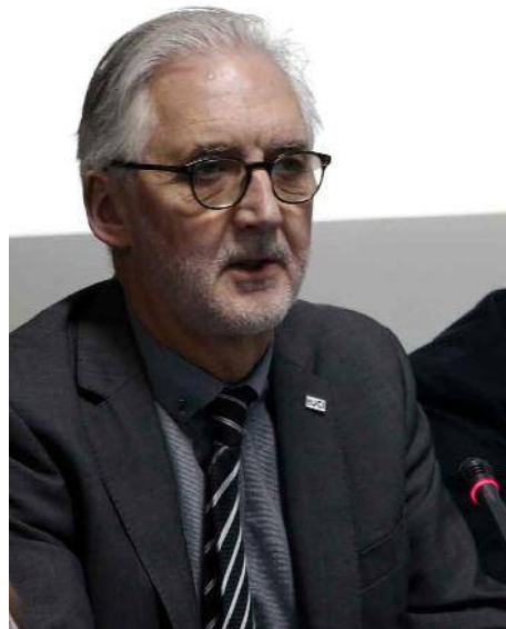
Brian Cookson.

Para el titular de la Unión Ciclista Internacional (UCI), Brian Cookson, la estrategia de la organización que dirige respecto al dopaje está muy clara y a partir del trabajo realizado concluyó que “hoy tenemos un ciclismo más limpio en todo el mundo”. Así lo expresó en exclusiva durante uno de los recesos del Congreso de la Confederación Panamericana de Ciclismo (Copaci), celebrado el fin de semana en La Habana.