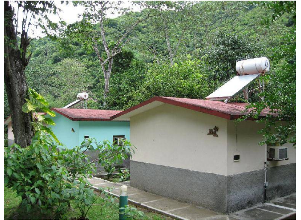
Paneles solares en la villa turística Santo Domingo, municipio de Bartolomé Masó.

En el VI Congreso del Partido existieron planteamientos relacionados con tal necesidad, como una medida más para apoyar el reordenamiento de la economía por cuanto permite el ahorro de portadores