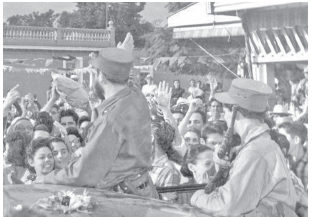
Fidel en su entrada a Pinar del Río.

Un saludo a los pinareños a través de la Revista SOL. Fidel Castro "Un saludo a los pinareños a través de la Revista SOL.—Fidel Castro". 17-1-59