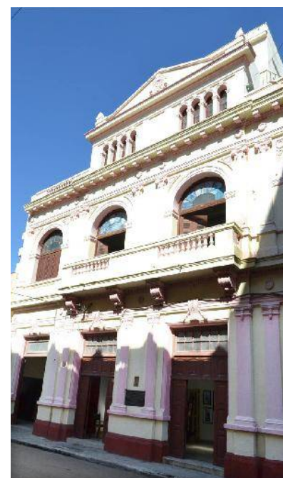
Palacio de los Torcedores, escenario de numerosos encuentros culturales y artísticos con la comunidad de Cayo Hueso.