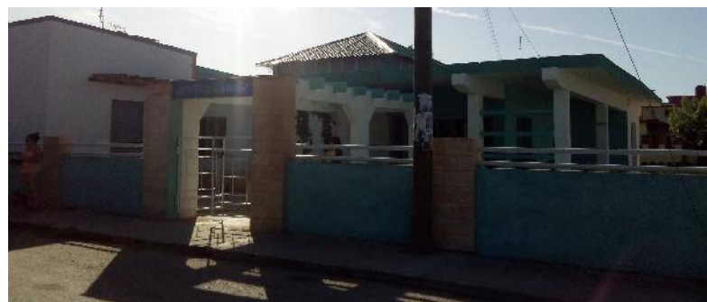
El grupo Vigía hizo posible que de entre las ruinas se levantara esta instalación para el disfrute y enriquecimiento espiritual de la comunidad.

tre las ruinas se levantara esta instalación para el disfrute y enriquecimiento espiritual de la comunidad, en tanto deviene una de las más llamativas edificaciones en el entramado arquitectónico de la ciudad.