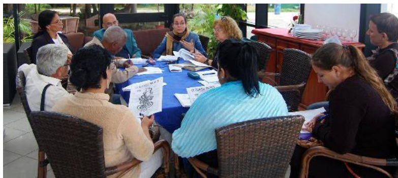
Conferencia de prensa efectuada en el hotel Jagua, de Cienfuegos, en la cual se dieron detalles de la edición 58 del Premio.