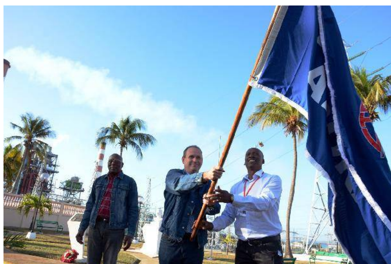
La Bandera de Proeza Laboral reconoce la labor realizada en la recuperación por los daños provocados por el huracán Matthew en la zona más oriental del país. | foto: Modesto Gutiérrez, ACN

Trabajadores con 50, 40, 30, 25 y 20 años de perma-