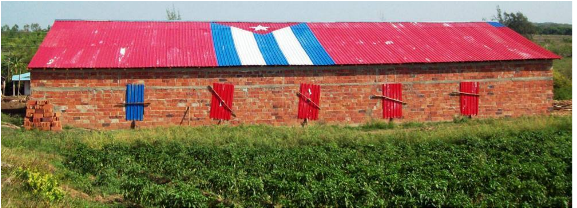
La casa nueva tiene paredes de ladrillos y cubierta de planchas acanaladas.