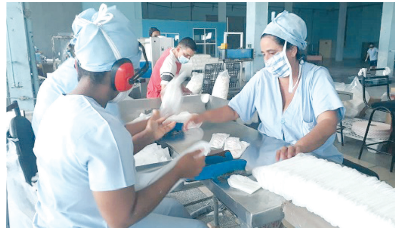
La unidad empresarial de base Mathisa Sancti Spíritus ha consolidado un colectivo con grandes habilidades en su labor y mayor aprovechamiento de las faenas productivas.

“En los últimos tres años Mathisa Sancti Spíritus ha estabilizado sus producciones. En ello influyó el consolidar un colectivo estable, la