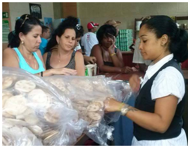
La dependienta del mercado ideal de la calle Medio apenas tiene tiempo para preparar la venta de uno de los productos más demandados en ese establecimiento.