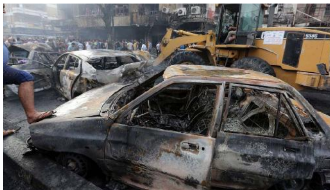
Escena del centro de Bagdad tras el atentado suicida.