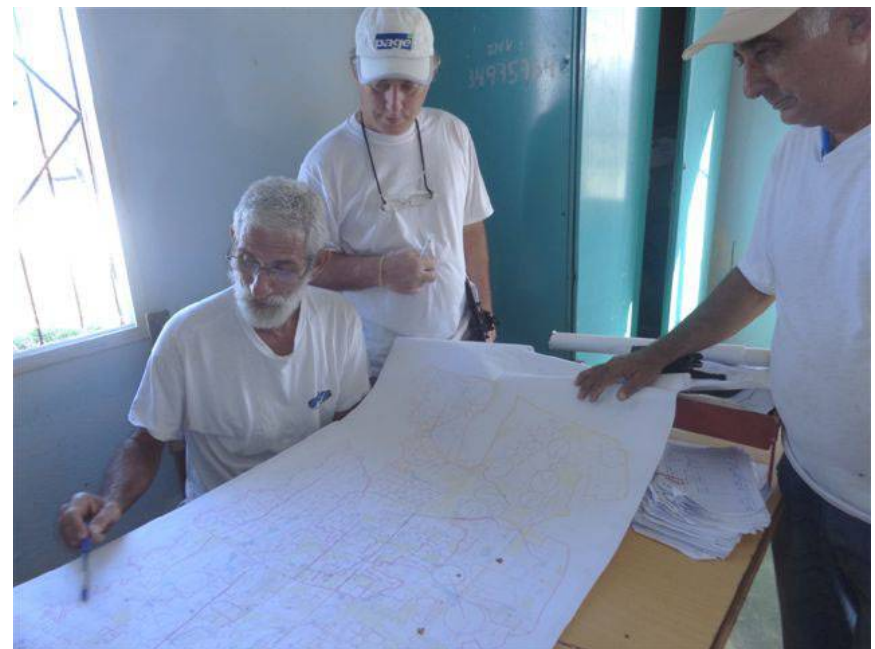
Cada detalle es estudiado por un equipo multidisciplinario.

el Valle del Yabú, que funciona solo con apretar un botón. “Aunque habrá que velar, nada puede descuidarse, porque a las plantas hay que darles lo que necesitan, ni mucho ni poco”, alertó.