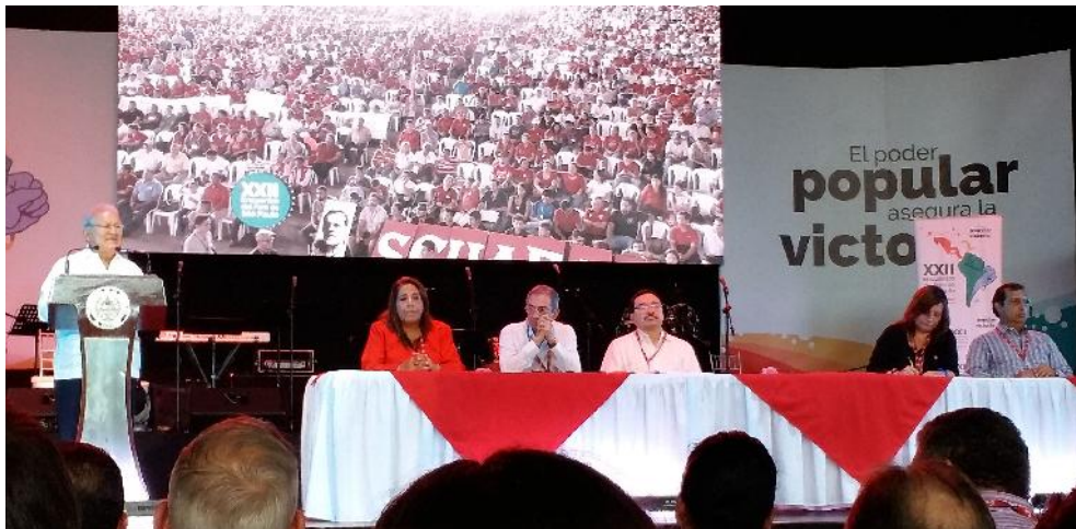
El presidente salvadoreño, Salvador Sánchez Cerén, asistió a la inauguración del XXII Encuentro del Foro de Sao Paulo.