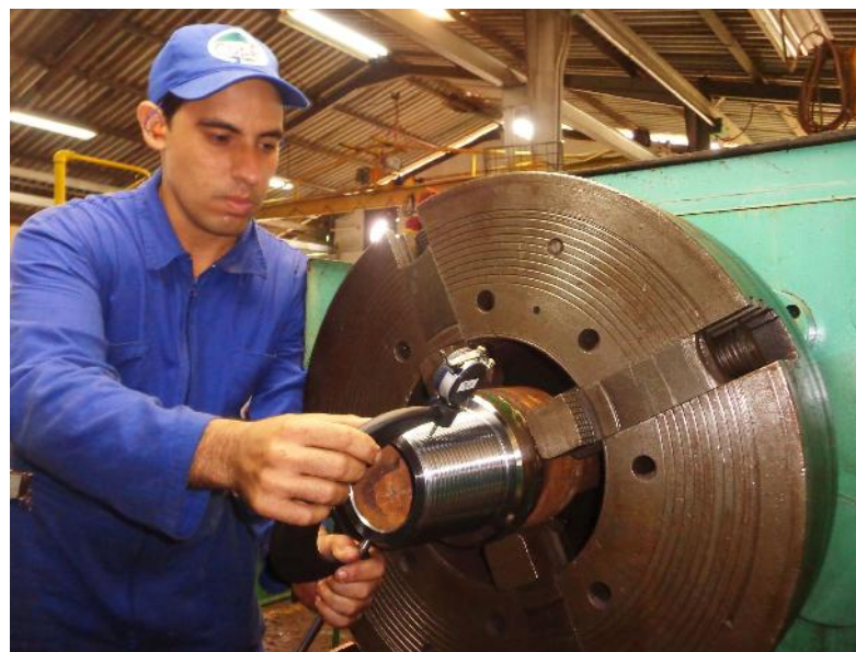
Asumen avileños rectificación de roscas de tubos para la perforación de pozos de petróleo en el país.

“Una empresa de La Habana es la encargada de repararlos de forma habitual, y también se llevan a Canadá, pero con el trabajo que les realizamos aquí en la actualidad, le ahorramos divisas al país y aportamos ingresos a nuestra empresa en el orden de los 2 millones de pesos anuales por concepto de fabri-