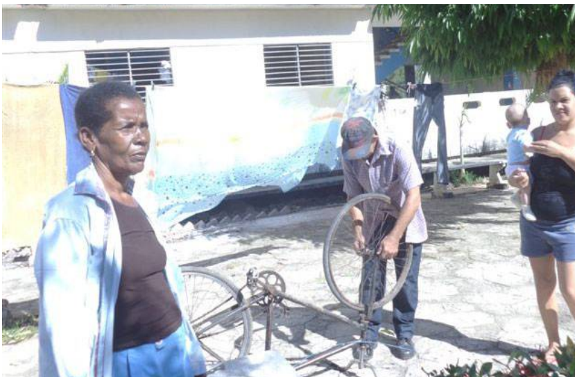
En la nueva comunidad, concebida para estabilizar la fuerza laboral, viven 80 familias.

De esta manera se logró un asentamiento poblacional que tuvo como condición que dos de sus integrantes fueran trabajadores agrícolas. Posee tienda, consultorio, círculo infantil, escuela primaria; aunque faltan muchos detalles, se va conformando la comunidad como parte de un proyecto integral.