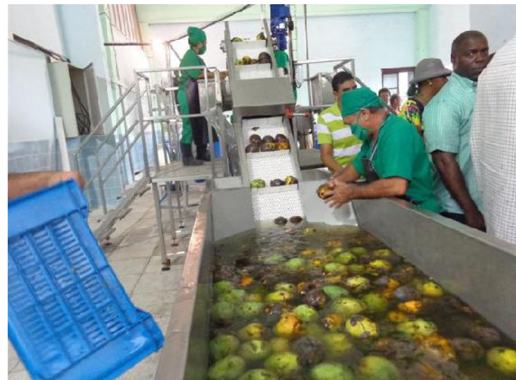
Ya funciona la minindustria para frutos carnosos.