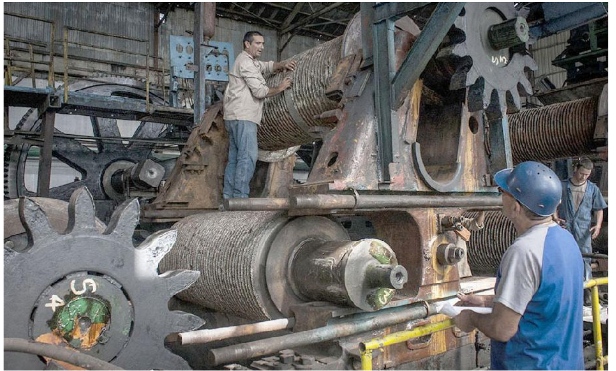
Hacer las reparaciones con calidad para lograr una próxima zafra con molidas estables es la premisa de los trabajadores del Melanio Hernández.

“He logrado premios relevantes con mis innovaciones, pero este año no fue posible, hubo una fuerte competencia y otros colegas hicieron aportes que obtuvieron los premios; sin embargo, puse en marcha un ‘tomamuestras’ que tiene un solo brazo, a diferencia de los que se emplean en los otros centrales que poseen dos”.