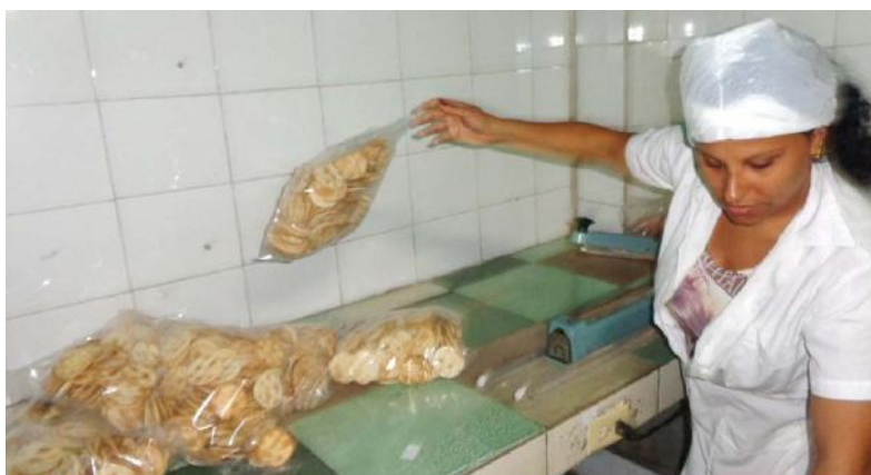
Casi manualmente cientos de paquetes son sellados en cada turno de trabajo.