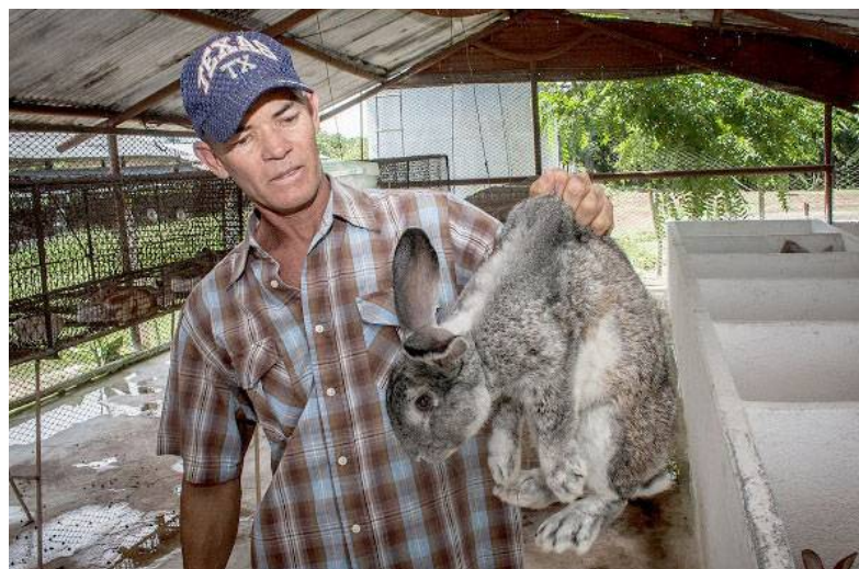
Higiene, adecuada alimentación y buen manejo son elementales para que en Arroyo Grande se sostenga la crianza de conejos.