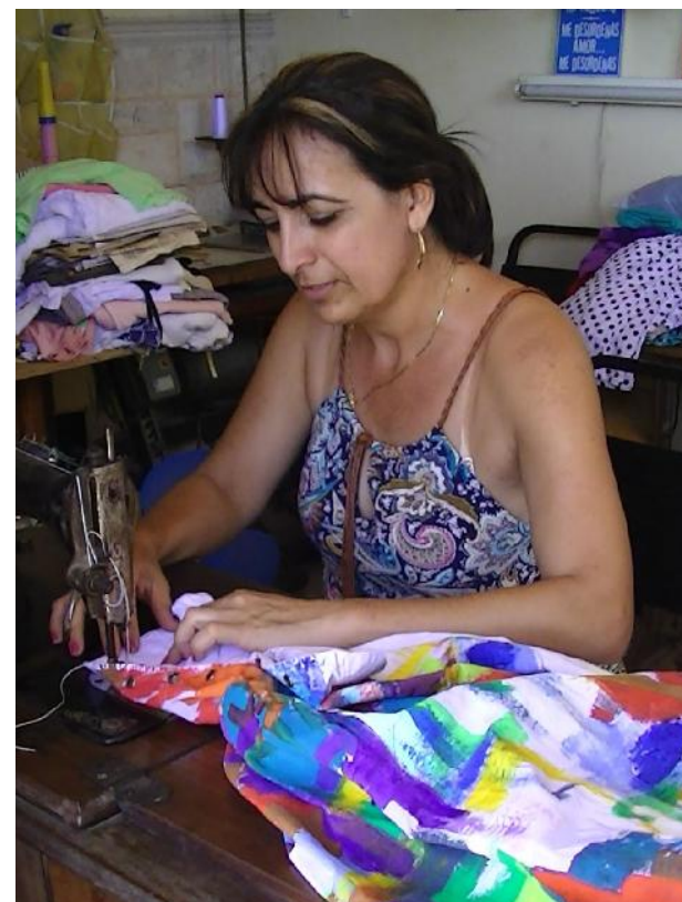
En el estrecho taller, de su antigua y preferida máquina Singer surgen la mayoría de los bellos y cubanísimos vestidos hechos por esta amigable y hermosa creadora.

ya la alegría que le proporcionan su perrita Peque y otros dos canes de la calle tiernamente atendidos por ella. En el estrecho taller, situado en una de las habitaciones, de su antigua máquina Singer —junto a otras más modernas que allí posee— surgen la mayoría de los vestidos, blusas, carteras y otros artículos hechos con dóciles telas escogidas por ella, de acuerdo con las particulares del cálido clima insular.