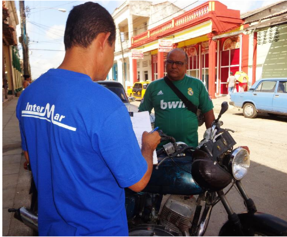
Incrementar las líneas de servicios a personas naturales constituye una estrategia de la UEB Ciego de Ávila-Sancti Spiritus, de la empresa InterMar.

No obstante, el trabajo rinde frutos en las relaciones con las personas naturales en diversas prestaciones, especialmente en la del Seguro de vida. El funcionario Manuel