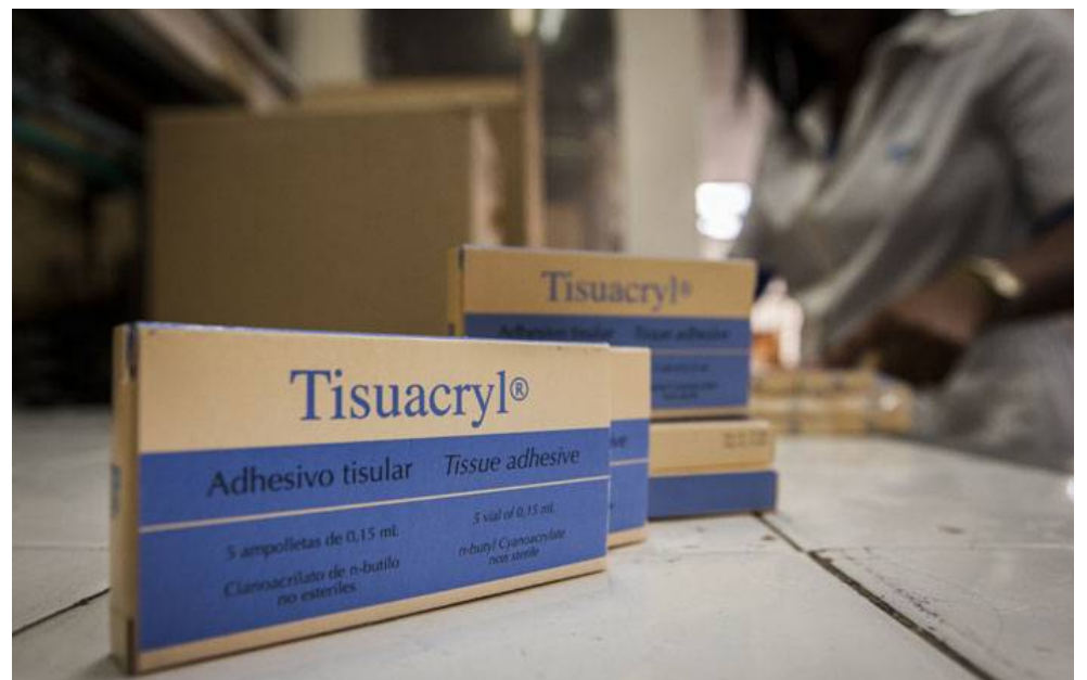
Múltiples usos médicos tiene este biomaterial, cuya materia prima esencial resulta muy difícil de adquirir por causa del bloqueo.

El tisuacryl se envasa en ampolletas de polipropileno con características muy específicas. “Estas —dijo— se importan desde Italia y en ocasiones se complica no solo su envío, sino además el pago, por lo cual nos vemos en la necesidad de acudir a terceros países y a otras vías alternativas”.