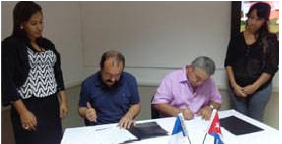
En la sede de la AEI Arcos-BBI fue firmado el protocolo de intención.