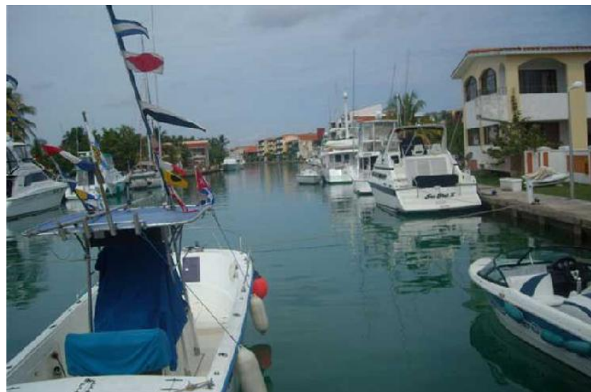
Marina Hemingway.

Autorizar la entrada y salida a Cuba de ciudadanos cubanos residentes en el exterior en embarcaciones de recreo, a través de las Marinas Turísticas Internacionales Hemingway y Gaviota-Varadero. Una vez que estén