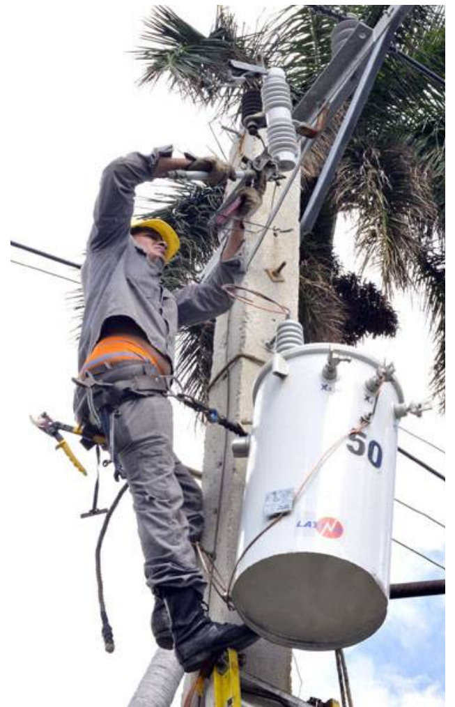
Lograr una cultura eficiente del trabajo depende de todos.

Junto con los accidentes en la vía, los golpeados por objetos o equipos, las caídas a di-