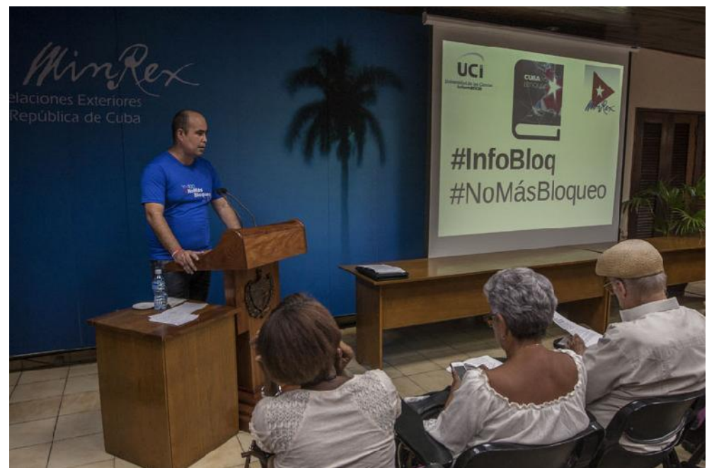
La aplicación fue presentada recientemente durante el XIV Foro de organizaciones de la sociedad civil cubana contra el bloqueo, efectuado en La Habana.

La principal motivación es divulgar la verdad de Cuba. Sabemos que se hace un gran trabajo desde las redes sociales y el pueblo cubano postea mucho en ellas. Los medios de prensa también desempeñan su papel, pero creímos importante aprovechar las prestaciones de los dispositivos móviles, pues hoy bastantes personas tienen un teléfono inteligente o un tablet, y es una vía alternativa para llegar a la gente.