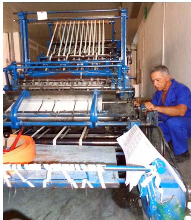
La Will es un reto que asumen con satisfacción muchos de los 25 aniristas de la unidad.

A pesar de su obsolescencia y gracias a los cuidados y la intervención de los aniristas, “esta máquina desde el punto de vista productivo es