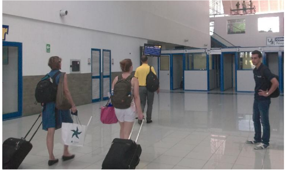
Las primeras visitas luego de Irma corroboran que la terminal Jardines del Rey ya es funcional.