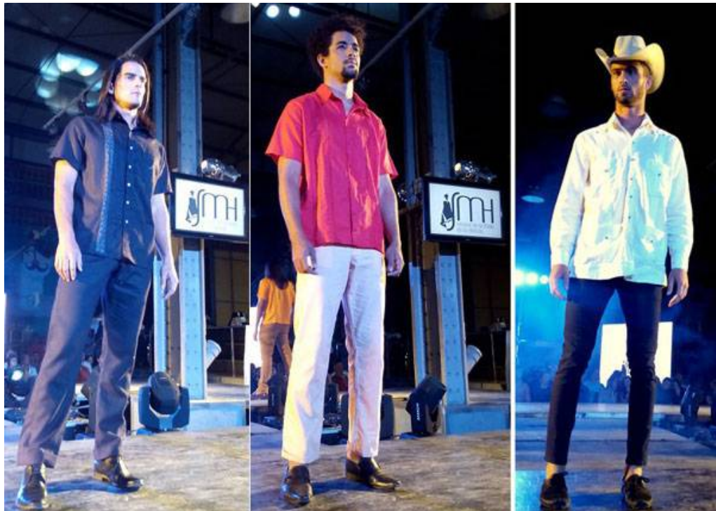
De Trinidad, herencia y tradición en las piezas con deshilados de Triel.