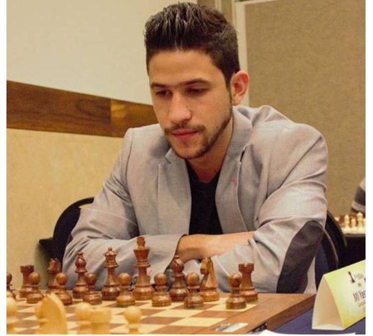
Yasser Quesada es el octavo GM de Villa Clara, lo que reafirma a la provincia como potencia ajedrecística.