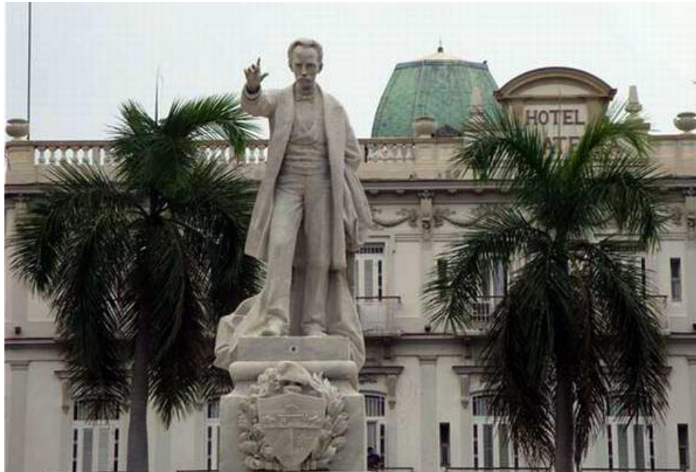
La primera estatua erigida en Cuba a José Martí se levantó en el Parque Central de La Habana y fue develada el 24 de febrero de 1905 en un acto presidido por el Generalísimo Máximo Gómez y el entonces presidente de la República Tomás Estrada Palma.