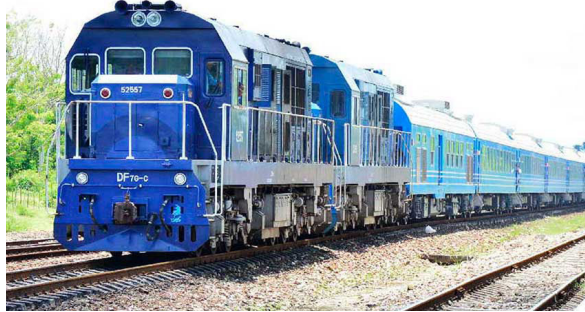
Con coches chinos se rehabilita la transportación de pasajeros por ferrocarril.

Cuba se ha quedado rezagada en los ferrocarriles, “un transporte insustituible”, como lo calificara Fidel Castro Ruz en la inauguración del primer tramo de la Vía Central Oliver-Calabaza, cerca de Placetas, el 29 de enero de 1975, cuando argumentó: “Dadas las características de nuestra isla, larga y estrecha, con una longitud superior a los mil kilómetros, económicamente no hay en grandes distancias por tierra ningún sistema de transporte superior a él, tanto para cargas como para pasaje”.