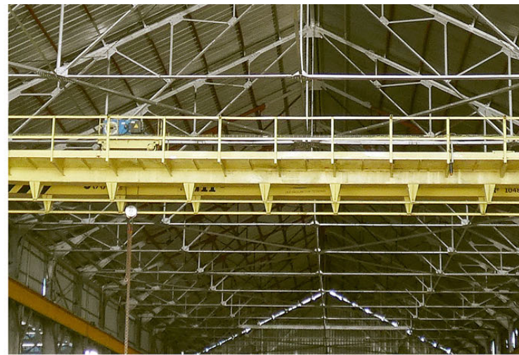
Cubana de Acero. | fotos: Heriberto González Brito