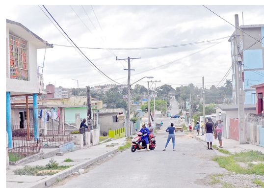
Municipio de Regla.