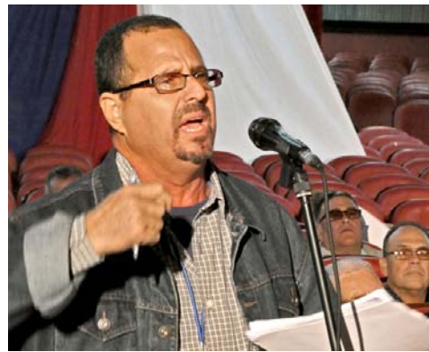
Alto y fuerte se escuchó en la Conferencia el sentir de los más de 202 mil miembros de la Anir.

más para contribuir al crecimiento de la economía y la materialización de las prioridades definidas para el presente año y de qué forma fortalecer el ahorro.