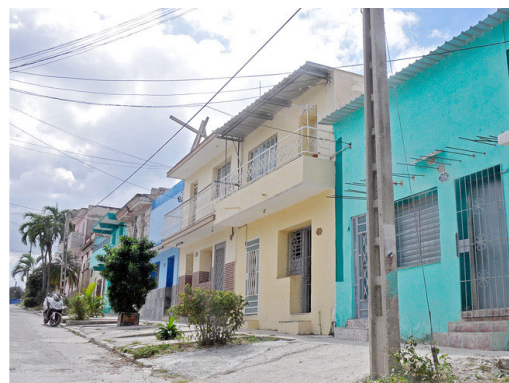
Municipio Diez de Octubre.