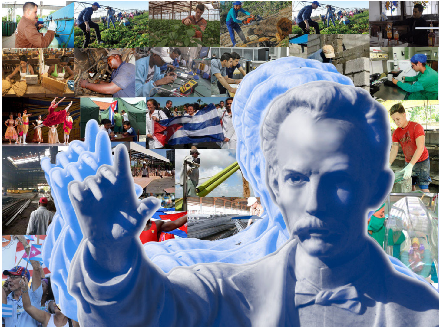
| cartel: Malagón