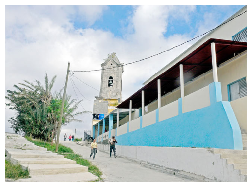
Municipio Diez de Octubre.