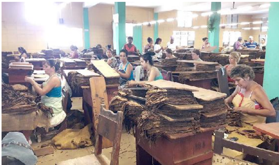
Taller de despallido VD2 del municipio de San Juan y Martínez, de Pinar del Río.

La elaboración del plan de producción, el sistema de pago y el Convenio Colectivo de Trabajo centraron el debate de los trabajadores del taller de despallido VD2 del municipio de San Juan y Martínez, de Pinar del Río.