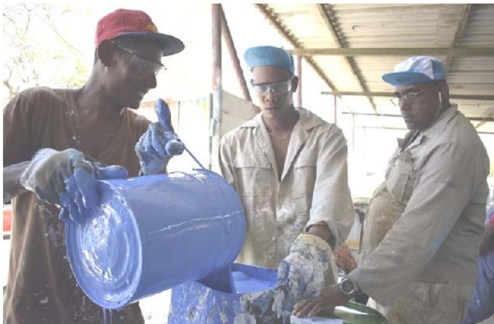
Más de 15 tonalidades de pinturas de marmolina, vinil y aceite comercializa Corona.

Para los Tonys el futuro es seguir produciendo con más calidad y nuevas formulaciones para suplir las necesidades de la población y de las empresas, con mejor precio, más organización, legalidad y con un colectivo que sea siempre como una familia.