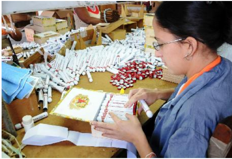
Previo a la elaboración de las normas es indispensable realizar estudios de organización del trabajo.

“Al establecer la normación se pueden balancear procesos y recursos, elaborar las bases de costos, además de programar mejor la producción. Por eso debemos enfatizar en que haya una mejor comprensión al respecto”.