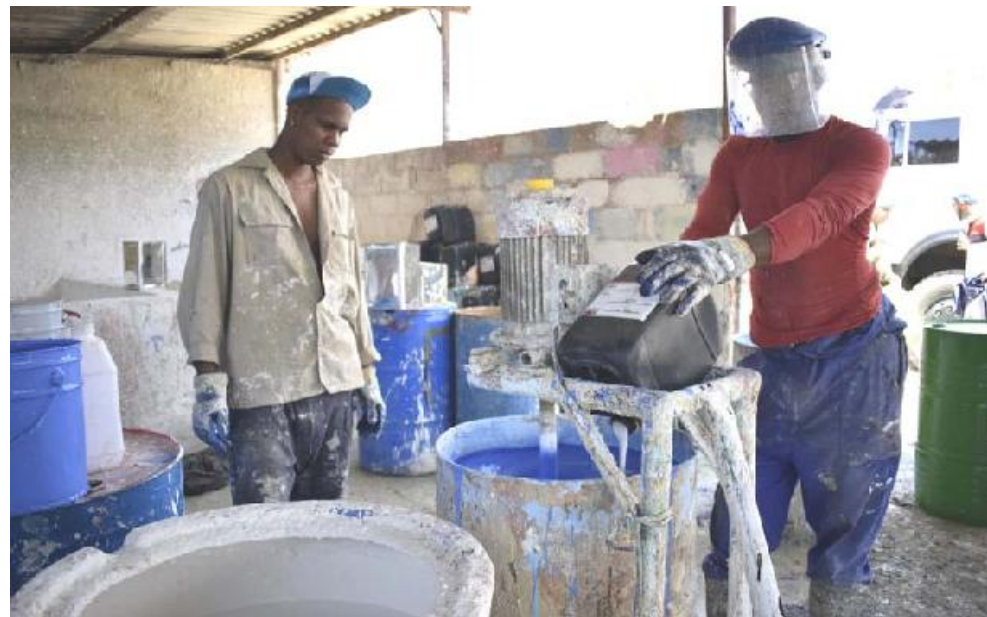
Corona exige el uso de medios de protección para garantizar la salud de los trabajadores.

“El vinil se comercializa con las empresas que están en esfuerzo decisivo por el aniversario 500 de la ciudad, de esta sí obtenemos por