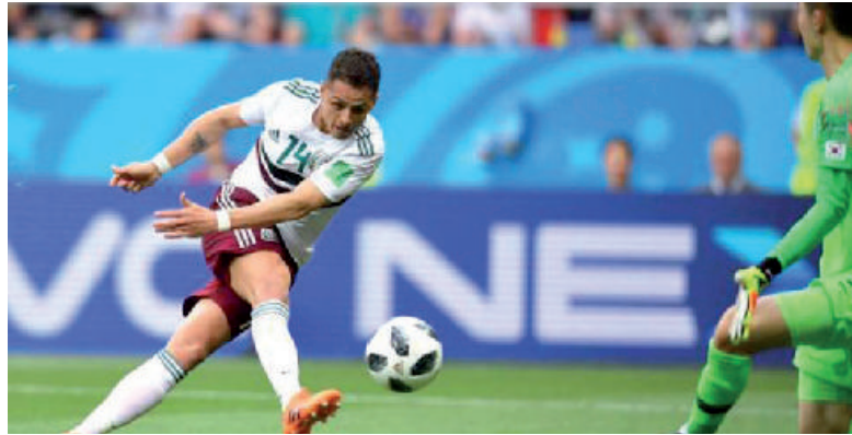
El Chicharito Hernández.

Otro de los jugadores de Les Bleus, Kylian Mbappé , es ya el goleador más joven en citas universales en la historia de su conjunto,