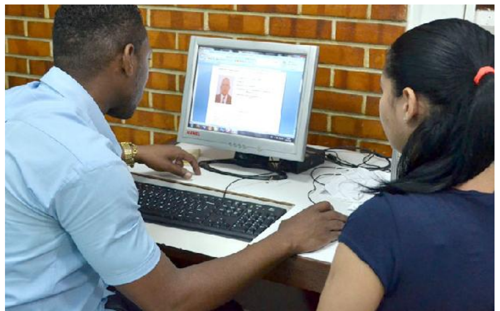
El trabajo informático garantiza la calidad del proceso.

Más del 60 % de los que integran las comisiones de candidatura en el país no habían participado con anterioridad en procesos de elecciones generales. La práctica de trabajo ha llevado a la capacitación, al estudio y al apoyo en la experiencia de quienes sí lo han hecho, teniendo como referente principal lo establecido en la Ley Electoral (No. 72) y en las normas complementarias sobre cómo actuar ante cada situación.