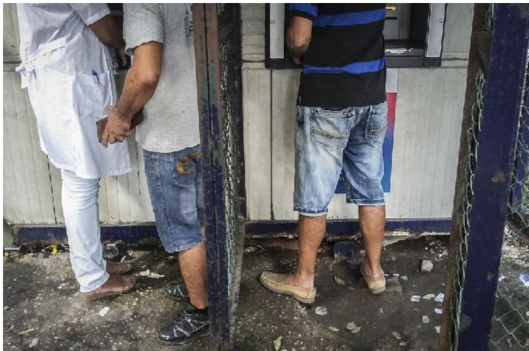
Los cajeros automáticos llegaron para bien y comodidad de la población, y sus áreas deben mantener un adecuado estado constructivo. Sin embargo, el piso de los situados en la esquina de las calles San Pedro y Ayestarán, donde colindan los municipios capitalinos de Plaza de la Revolución y Cerro, hace algún tiempo necesita que se le pase la mano. | Texto y foto: René Pérez Massola