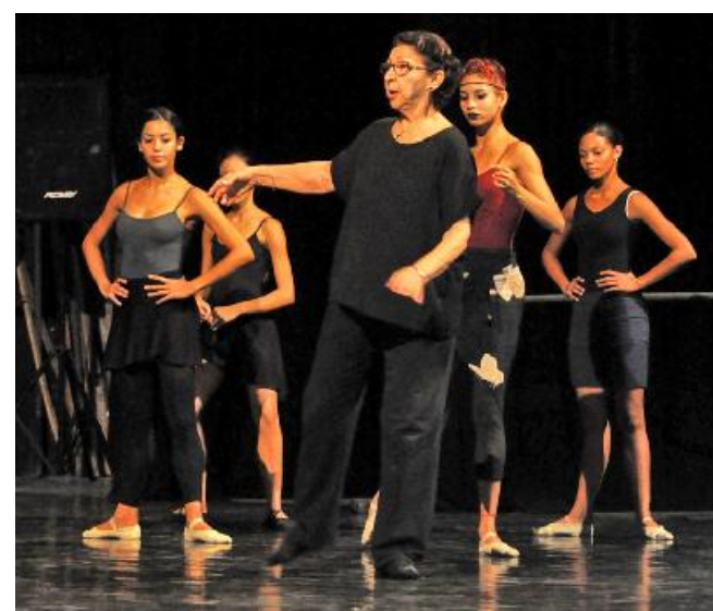
Durante la temporada de celebraciones, los bailarines tomaron clases de una de las grandes del ballet cubano: Aurora Bosch.