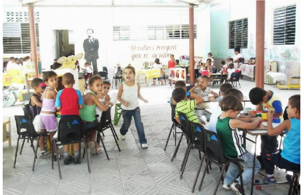
Hoy, vida plena y feliz.