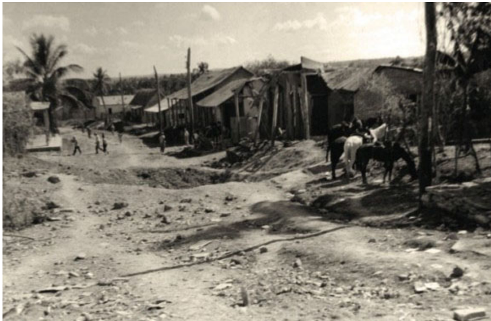
Ayer, destrucción total tras los bombardeos de diciembre de 1958.