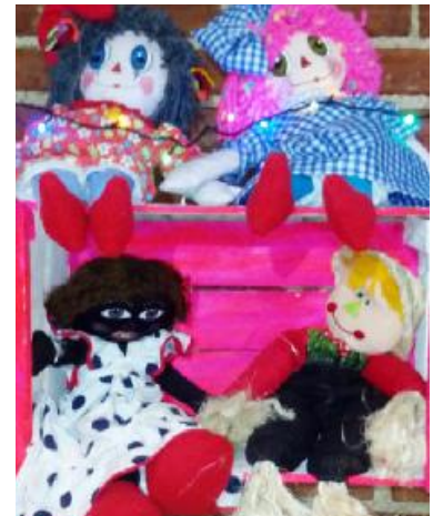
En el bazar Artes Cheelí podemos encontrar diversidad de manufacturas con calidad artística.