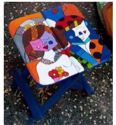
Útiles sillas plegables decoradas con obras plásticas de Isis.

buen regalo para familiares y amigos en las festividades de fin de año. Allí seguramente admirarán el arte de una mujer en cuyas confecciones también trasciende lo auténticamente cubano.