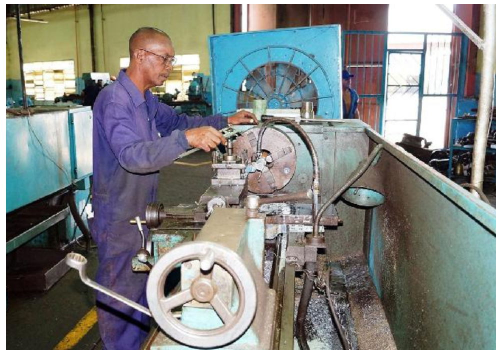
El Movimiento Vanguardista de los Trabajadores de la Maquinaria incluye a los trabajadores de la “retaguardia”: mecánicos, electricistas, torneros...

En cualquier sector, el ser humano es lo más esencial, pero los equipos son el primer complemento. Eso bien lo saben los constructores.