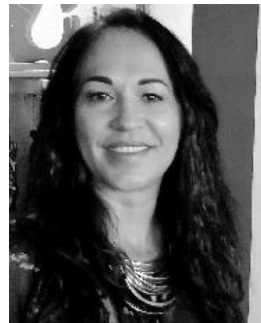
“Que las personas creen en sus hogares ambientes portadores de arte, espiritualidad y belleza”, afirmó Isis.