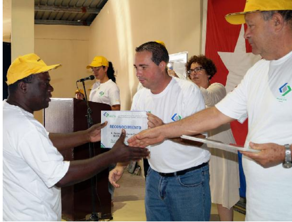
La estimulación a los más destacados resulta esencial para la fortaleza del Movimiento. La foto corresponde al acto efectuado recientemente en la UBS Equivar, de Varadero.

En esa UBS 97 trabajadores ostentan la condición de Insignia y 103 la de Vanguardistas, categorías consideradas en el Movimiento para quienes mantienen un quehacer sistemático eficiente en sus puestos de trabajo y se caracterizan por ser ejemplos.