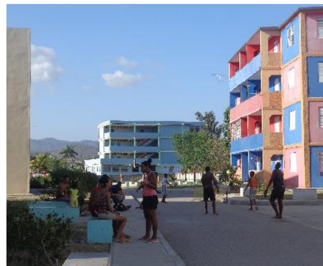
Lazo aseguró que la construcción de viviendas y el desarrollo de la producción local de materiales constituyen prioridad en todo el país.

Al cierre del encuentro y en nombre del pueblo santiaguero —que tuvo el privilegio de contar con su presencia aquí durante los más duros años del período especial, cuando se desempeñó como primer secretario del Partido en la provincia— Juan Esteban Lazo Hernández fue reconocido por su entrega incondicional a la patria y al socialismo.