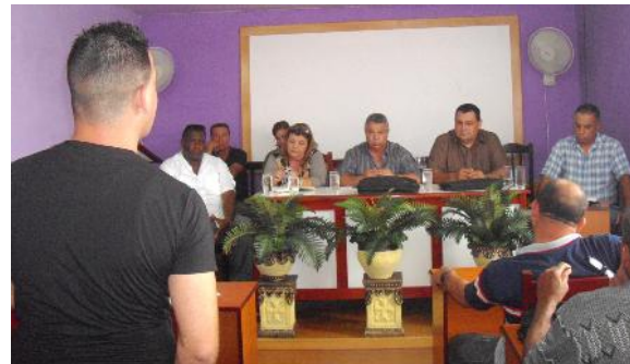
Hubo consenso en el Pleno que la tarea estratégica del movimiento sindical avileño consiste en fortalecer la política de cuadros.

El también miembro del Buró Político, recalcó que el completamiento de los cuadros de dirección del movimiento sindical constituye