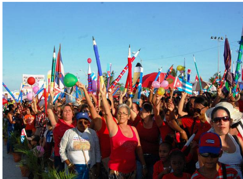
Los desfiles y actos tendrán unidas varias generaciones de cubanos.