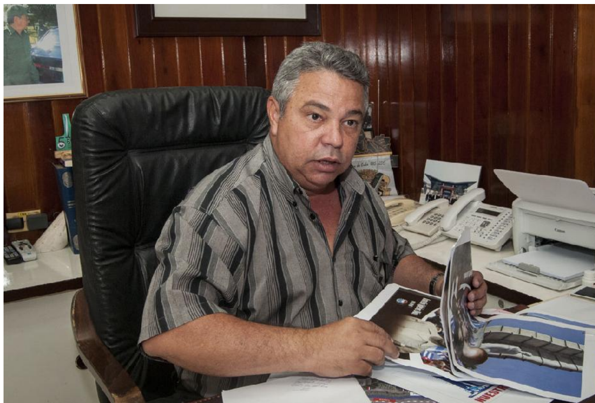
Ahora estamos en la etapa de recogida de los compromisos para participar y en la realización de la propaganda popular que los colectivos de trabajadores llevarán al desfile.

Entre esas nuevas circunstancias el dirigente sindical destacó el desarrollo de las tecnologías de la