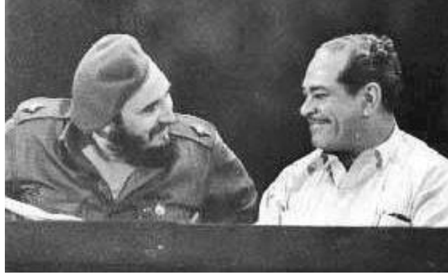
Blas Roca junto a Fidel.

Fue a partir de ese momento que realmente inició su carrera de educador, no en las aulas sino en la vida, y teniendo como discípulos a los trabajadores y el pueblo, Primero en el sindicato de zapateros de Manzanillo, del que llegó a ser secretario general, más tarde al frente del Partido Comunista y de la Federación Regional Obrera, hasta llegar a convertirse con solo 26 años, en el máximo dirigente de los comunistas cubanos por