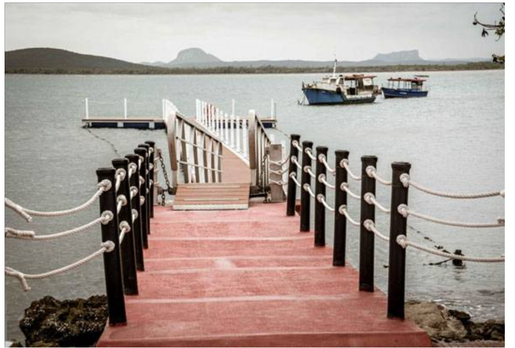
Club náutico de Gibara, una de las novedades para la Feria Internacional de Turismo.

entre las que se encuentran el Hotel Plaza Colón, con 14 habitaciones, un club náutico en la marina con una gastronomía de alto estándar.