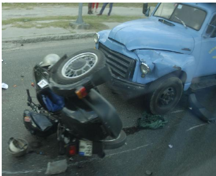
Es alarmante el aumento de los accidentes en la vía, así como del número de fallecidos por esa causa.

“Para ello, además de las acciones ya apuntadas, de conjunto con la Oficina Nacional de Inspección Estatal y otras instituciones se impartirán cursos de capacitación —fueron 9 entre el 2015 y el 2016—. Será riguroso el principio de selección del alumnado, en especial los años de experiencia de los jefes directos, los procesos productivos bajo su responsabilidad, así como su nivel de escolaridad”.