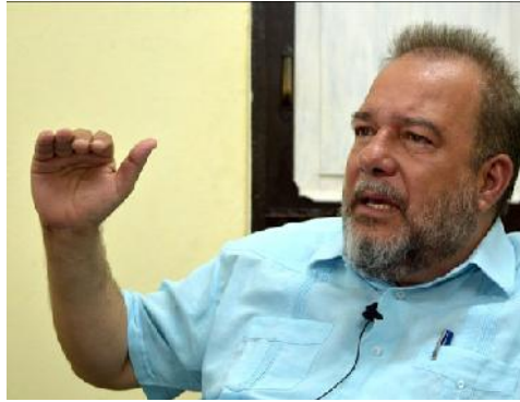
Manuel Marrero Cruz, ministro de Turismo.

Entonces, comenzamos a identificar instalaciones patrimoniales, algunas abandonadas y otras en uso, que en un momento determinado pudiesen convertirse en turísticas, y de igual forma dar respuesta a una demanda insatisfecha: la necesidad de hoteles patrimoniales en ciudades como