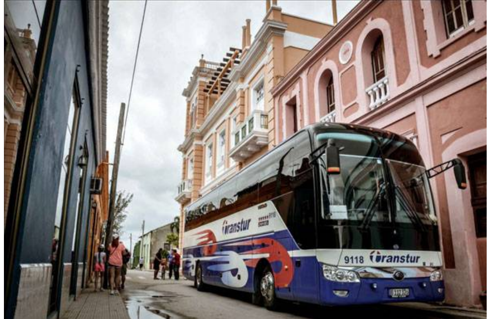
El rescate de instalaciones con valor patrimonial ha sido clave en el desarrollo turístico de Gibara.

Se decidió que este año la Feria Internacional del Turismo tuviera como sede la provincia de Holguín, y luego de haber estado desarrollando estas instalaciones en Gibara, acordamos que la primera actividad de la feria, este 2 de mayo, sea el lanzamiento oficial de Gibara como un destino turístico. Para ello nos propusimos inaugurar una serie de obras,