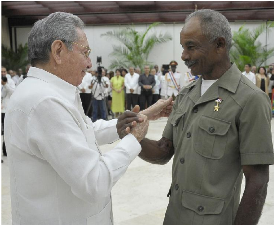
Un momento inolvidable.

“Por necesidad aprendí a hacer monocapa, que era una labor que hacían en Cuba los extranjeros y nadie se atrevía a ejecutar. Pero, ¡mire lo que son las cosas!, trabajaba una vez en Varadero y el jefe de obra me dijo que al día siguiente tenía que poner tejas. Como nunca lo había hecho fui hasta el lugar donde estaba