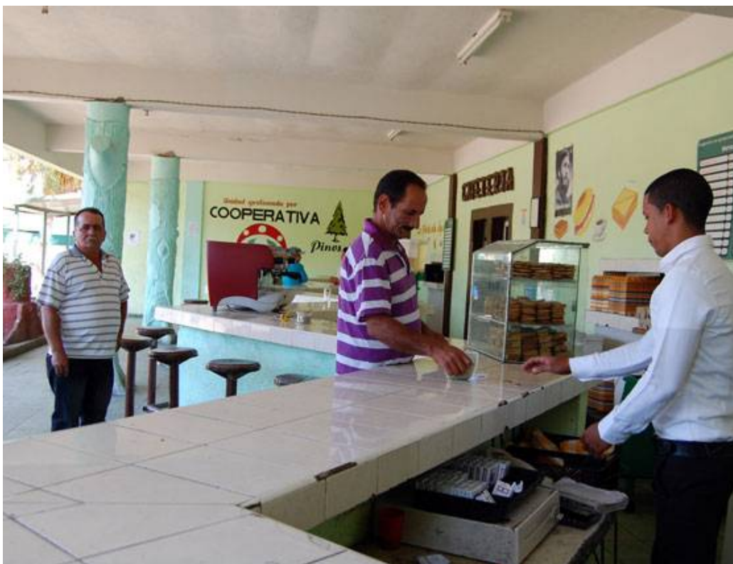
Cooperativa no agropecuaria Pinos Altos, de Cienfuegos. | foto: Ramón Barreras Ferrán