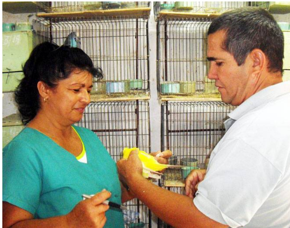
Resulta riguroso el chequeo del estado de salud de aves que serán destinadas a la exportación.