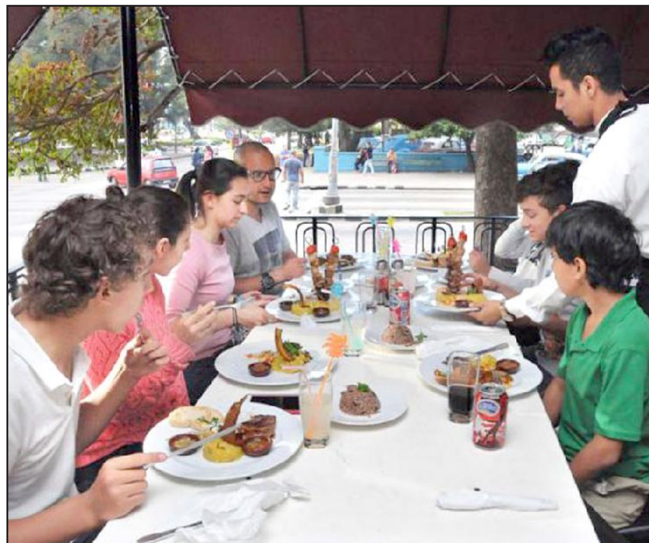
El 62 % de las CNA están vinculadas al sector del comercio, la gastronomía y los servicios.