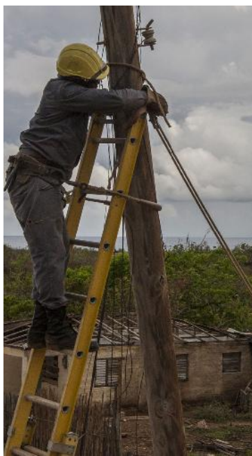
El contacto con la electricidad clasifica entre las causas principales de accidentes laborales.