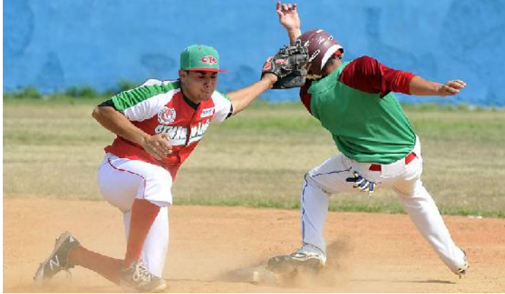
Los Ferrocarrileros de Nuevo León ganaron la edición pasada.

La Copa Internacional de Béisbol Primero de Mayo se jugará a siete entradas y la final a nue-