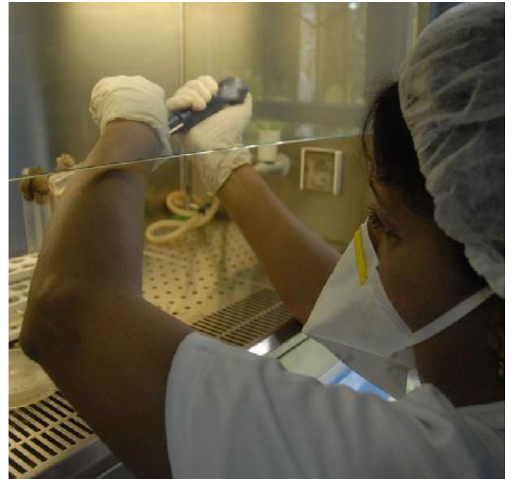
La ley establece que el empleador cumpla las medidas higiénico sanitarias y de control del ambiente laboral para prevenir enfermedades de tipo profesional.

Preservar la salud de los trabajadores es una máxima contenida en la Ley 116, Código de Trabajo, y su Reglamento, así como en dos resoluciones del Ministerio de Salud Pública, que junto a otras conforman la legislación complementaria de aquel cuerpo legal.