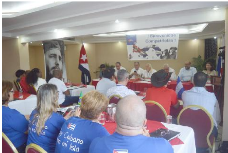
El III Encuentro de Cubanos Residentes en América Latina y el Caribe tuvo lugar en la ciudad de Panamá.

También se reúnen cubanos residentes en nuestra región Un centenar de cubanos procedentes de más de 15 países de América Latina y el Caribe se dieron cita