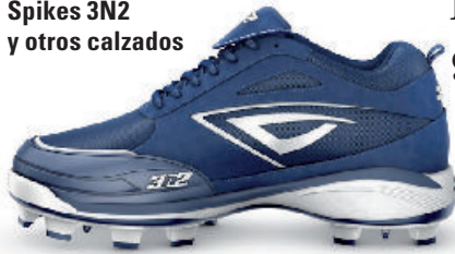
Spikes 3N2 y otros calzados

No se adquirió esta embarcación pues costaría 18 350.50 USD desde España.