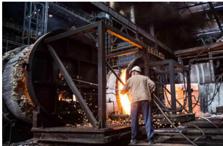
El Estado garantiza el derecho a la protección, seguridad e higiene del trabajo.

fumar. La última es la forma dérmica, que solo puede ocurrir por contacto con algunos compuestos orgánicos.