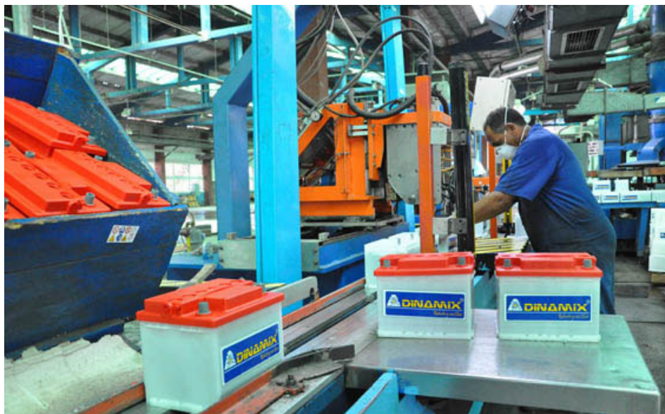
Entre los métodos establecidos para evitarlo se destaca la reglamentación para el empleo y uso de materiales manufacturados con plomo, precisó el doctor Castellanos.

Lo esencial es que el trabajador conozca que, una vez diagnosticada la enfermedad profesional, estará protegido por numerosas legislaciones referentes al bienestar en el ámbito laboral