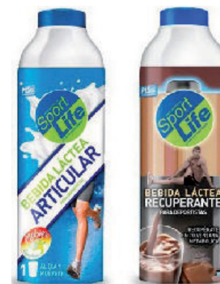
Nutrientes y recuperantes

Se compraron 32 sets a 389 USD cada uno.