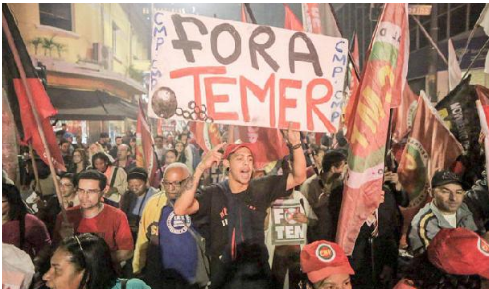
El rechazo a Temer en las calles ha sido reiterado. Según Datafolha, uno de los institutos de investigación más renombrados de Brasil, la impopularidad del mandatario es de un 93 por ciento.