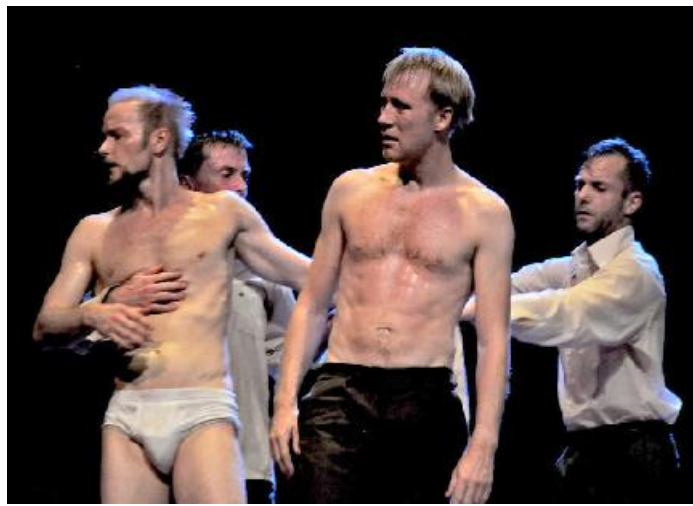
Nadie entendió lo que dijeron sobre el escenario los actores de Jo Strømgren Kompani, de Noruega. No había manera, porque es un lenguaje sin sentido, que evoca sonoridades "soviéticas". There , sin embargo, dice mucho: poderosas metáforas (tragicómicas, si se quiere) sobre la incertidumbre por el futuro.