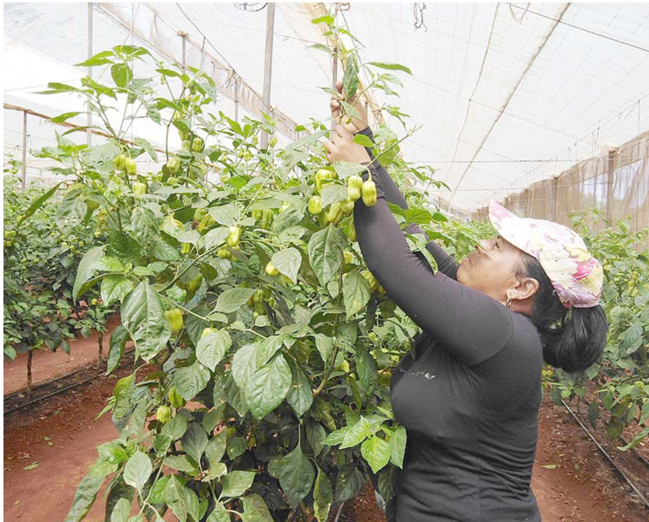
El ají pica y se extiende con más de 30 toneladas cosechadas este año.

“Nuestra entidad tiene tradición en las entregas al exterior de frutas frescas, jugos