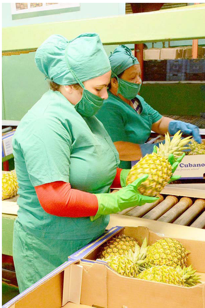
Concretar el paquete de desarrollo de la piña constituye una de las prioridades del polo exportador para el 2020.

Los precios de los rubros exportables en el mercado mundial son variables, según argumentó Escalante Pérez. Puso como ejemplos que una tonelada de jugo concentrado congelado de toronja es cotizada a 3 mil dólares; el ají picante a 2 mil 300; la piña fresca MD-2 entre 700 y 950; el mango fresco y el puré de mango a 900 y 580, respectivamente; el carbón vegetal a 360, y la papaya sulfitada a 200.