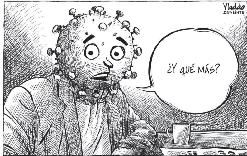
Tema contagioso. Vladdo 20 Veinte.