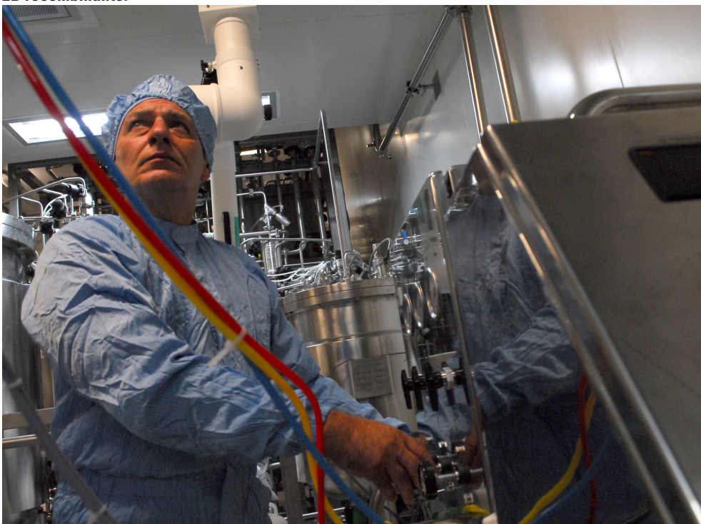
En el CIGB se produce el ingrediente farmacéutico activo de este medicamento. El proceso comprende varias etapas: multiplicación, fermentación y purificación.

Y así en otros momentos se han empleado en el tratamiento de enfermedades virales dadas las aplicaciones y los usos que tiene.