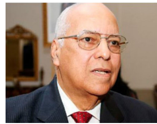
Ricardo Cabrisas Ruiz