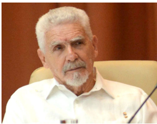
Ramiro Valdés Menéndez