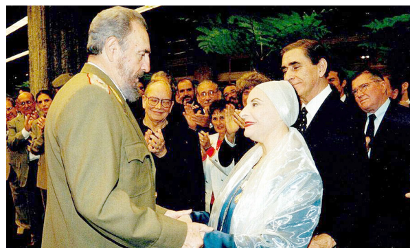
El Comandante en Jefe Fidel Castro Ruz le impone la Orden José Martí.