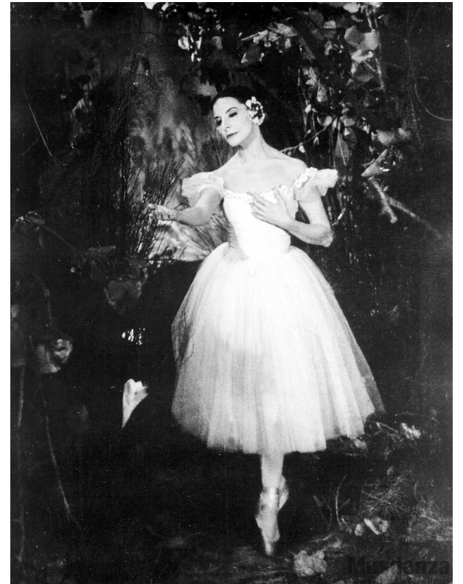
Ella nació para que Giselle no muriera, dijo Arnold Haskell.

“Cuando yo enseño un clásico a las bailarinas, les doy opciones, les digo: dentro de este clásico ustedes pueden mover las manos así, así, o de esta otra manera; más rápido o más demorado; o combinando tal y tal movimiento... A veces les sugiero: esta forma te viene mejor. O les pregunto: ¿con cuál te sien-