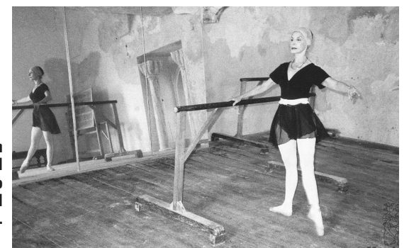
Para un bailarín, el entrenamiento personal es vital.