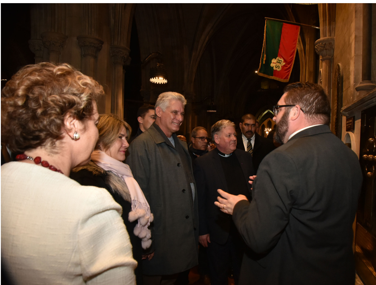
En la catedral de San Patricio, el mandatario cubano significó los sentimientos nacionalistas y libertarios de los pueblos cubano e irlandés.

También subrayó el interés de Dublín por acompañar a La Habana en el ámbito económico, en el contexto del proceso de Actualización. Glynn significó además el encuentro previsto para este lunes entre Díaz-Canel y el Presidente irlandés, Michael D. Higgins,