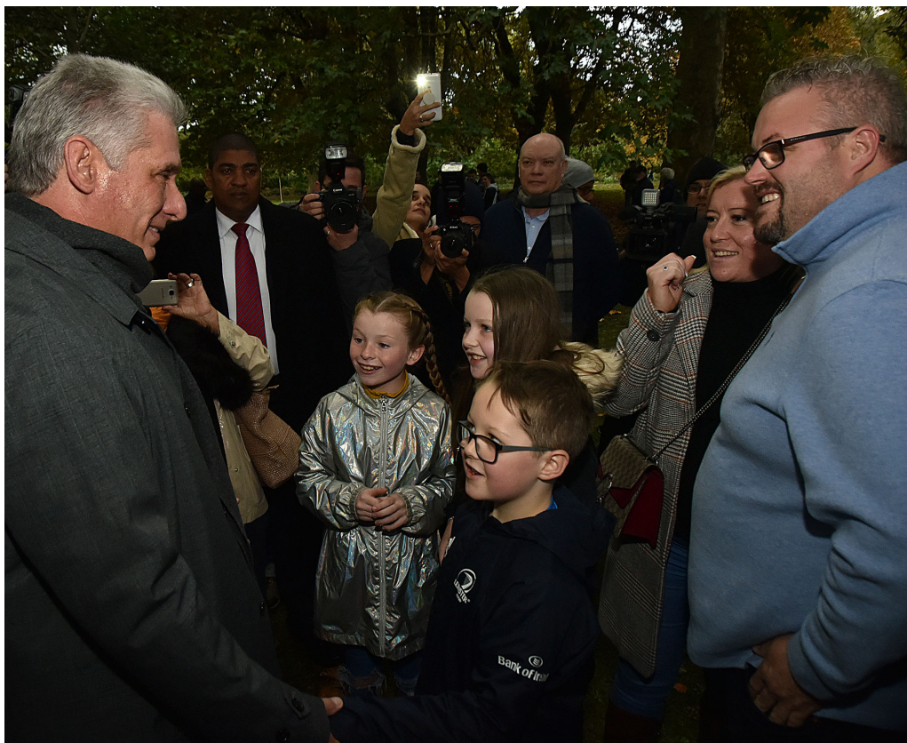
En el Parque Saint Stephen Green, casi en el centro de Dublín, Díaz-Canel reverenció los sentimientos de lucha y libertad del pueblo irlandés.