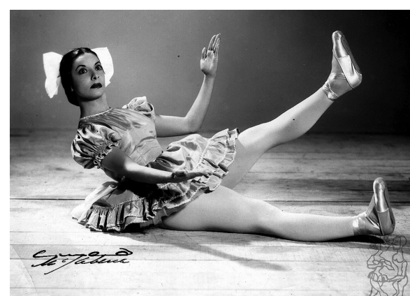
Fue una gran bailarina, pero también una actriz. En uno de sus personajes más recordados: Swanilda, de Coppelia .