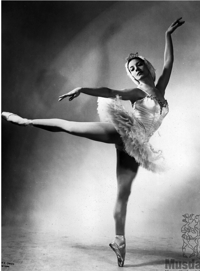
Como Odette, de El lago de los cisnes .

Los consejos y las enseñanzas de la gran artista cubana podrían ser guía inspiradora para los bailarines y maestros de ahora mismo