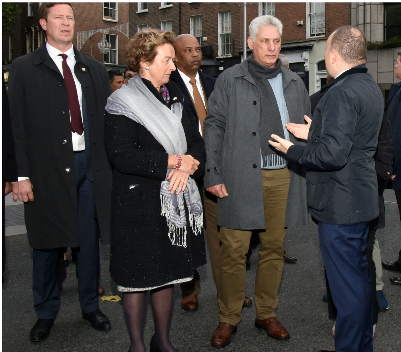
Al caminar por la vía Dowson Street como uno más del barrio, el Jefe de Estado causó simpatías.

Al filo de las diez de la mañana de este domingo, en un viaje turbulento por las condiciones climáticas que predominan en estos días desde el Caribe hasta el norte del Atlántico, llegó el Presidente cubano a Dublín.