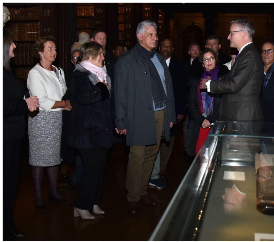
Durante la visita a la biblioteca del Trinity College, el Presidente cubano conoció y observó algunos títulos incunables de la literatura religiosa irlandesa.