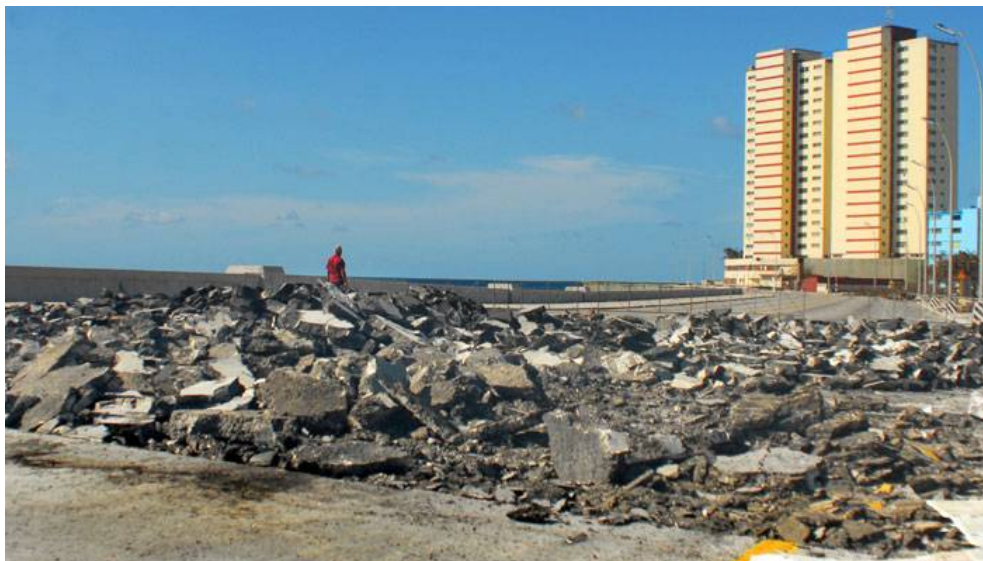
El mar socavó los accesos del puente de La Chorrera. La empresa de viales levantó el pavimento como fase previa a los estudios para determinar la magnitud de las afectaciones.

ral del CNV, en quien también han hecho estragos las horas dejadas de dormir, en una de las épicas lides del hombre frente a la naturaleza.