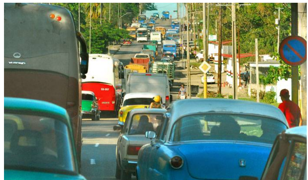
Vía Blanca se congestiona cuando cierra el túnel de la bahía de La Habana.