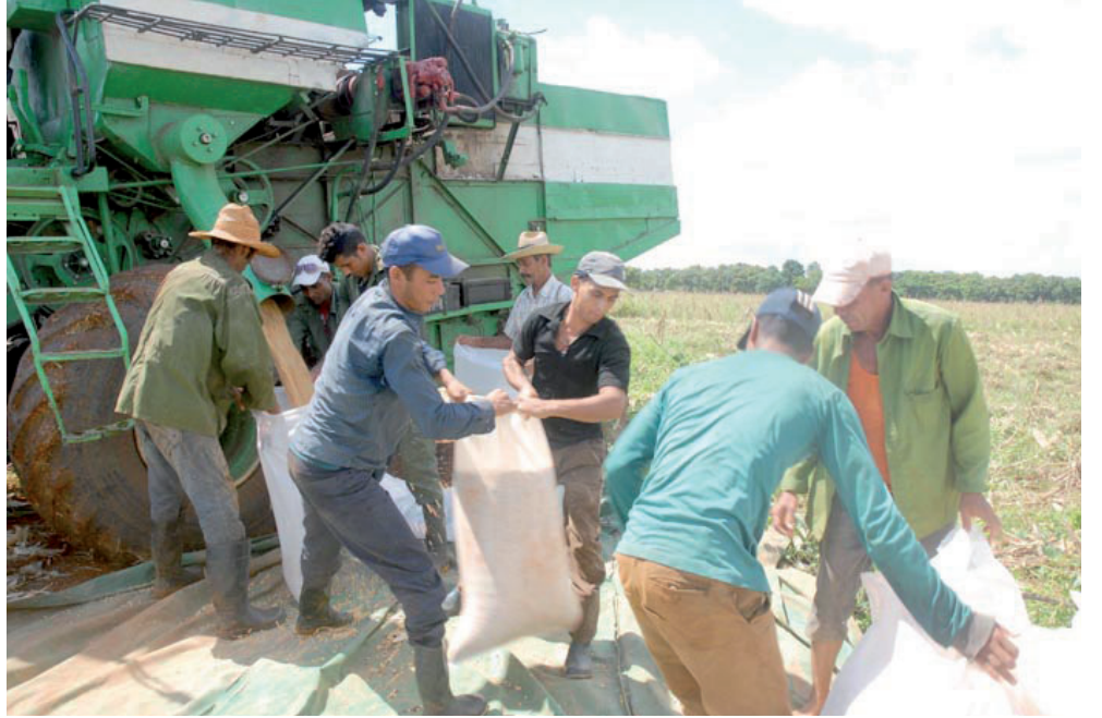
Las máquinas son insuficientes para recoger todo el maíz seco derribado por Irma; hacerlo a mano es una tarea titánica por la magnitud del área perjudicada.

Otra actividad que corresponde al sindicato es el reconocimiento a quienes más se destaquen en las la-