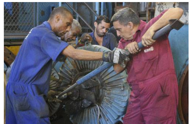
La tarea es difícil; requiere profesionalidad —algo que distingue a los afiliados al Sindicato de Energía y Minas en el taller Juan Ronda—.

La urgencia que demandan los trabajos relacionados con la Guiteras no menoscaba el rigor que le corresponden, toda vez que, según expresó Pedro, el colectivo tiene certificado su sistema de gestión de la calidad con las normas NC ISO 9001.