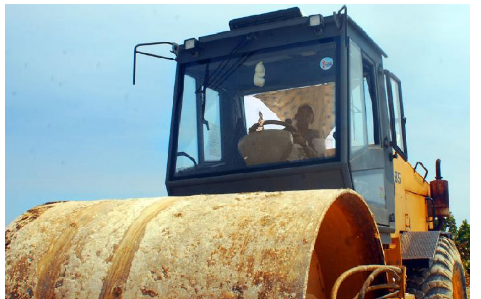
Un curso al terminar la enseñanza tecnológica bastó a Daniel para encontrar lo que parece oficio hecho para él: operador de equipos pesados.