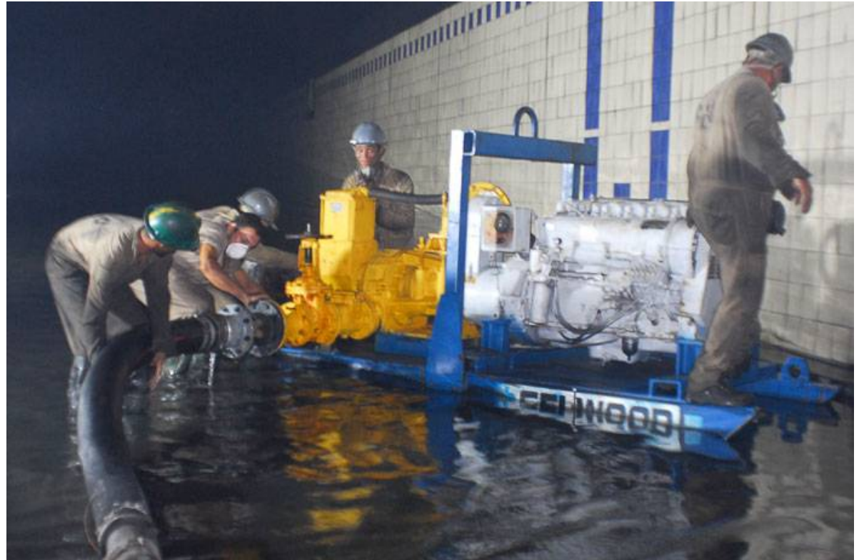
Colocación de bomba para extraer agua en el túnel de la bahía.