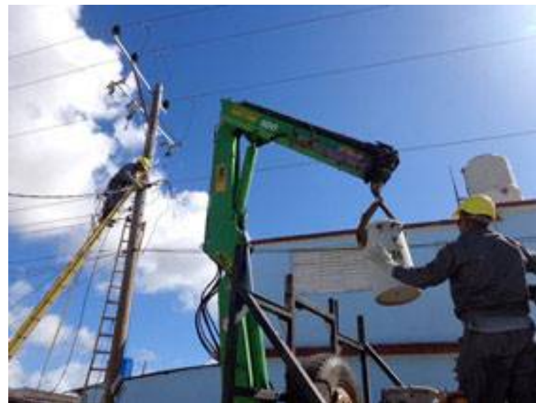
Los trabajadores del sector eléctrico restauraron los daños del huracán Irma en Las Tunas y ahora colaboran en tierras avileñas.