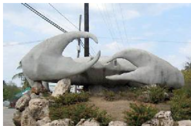
El cangrejo de Gelabert.

| Lourdes Rey Veitia | fotos: De la autora