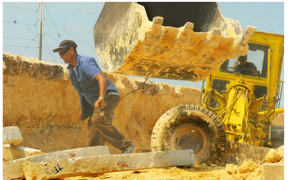
Nótese la altura en la que el mar horadó el talud de la vía.