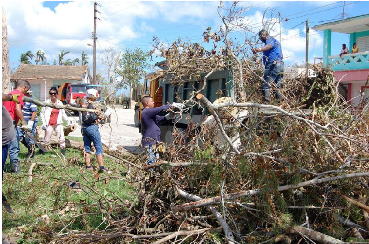
Intenso fue el trabajo de los constructores en la desobstaculización y limpieza del poblado espirituario de Mayajigua.

“El sol cuarteja las baldosas. Como la nave se quedó sin techo y no sabemos cuándo lo tendremos de nuevo, nos propusimos comenzar a trabajar a las cinco de la tarde y hasta las doce de la noche o la una de la madrugada; lo importante es