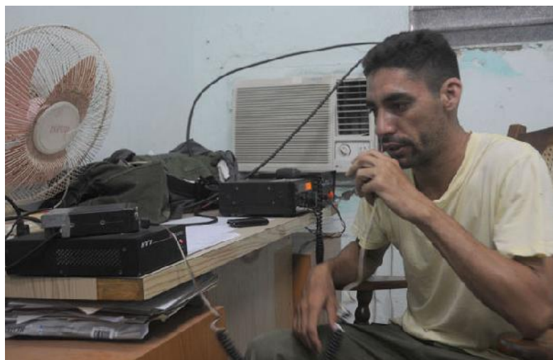
Los radioaficionados contribuyen con algo más que con las comunicaciones.

“A mi mamá no le agrada mucho que esté tan cerca del peligro, pero es lo que me gusta y con ello auxilio a otras personas”, asegura Mongo, como le dicen sus amigos.