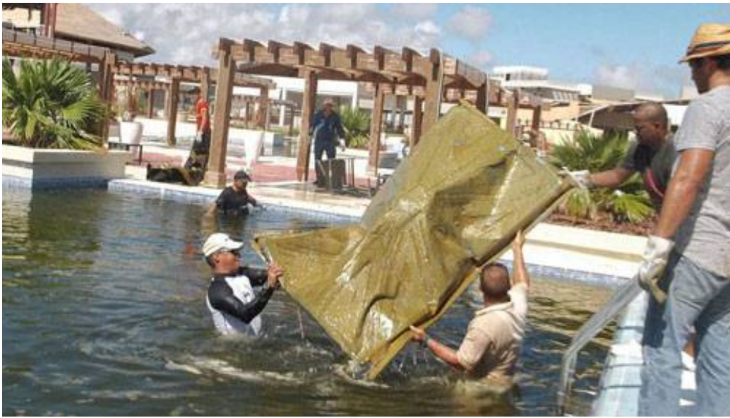
En cada instalación de la cayería se rescata lo que el viento se llevó.