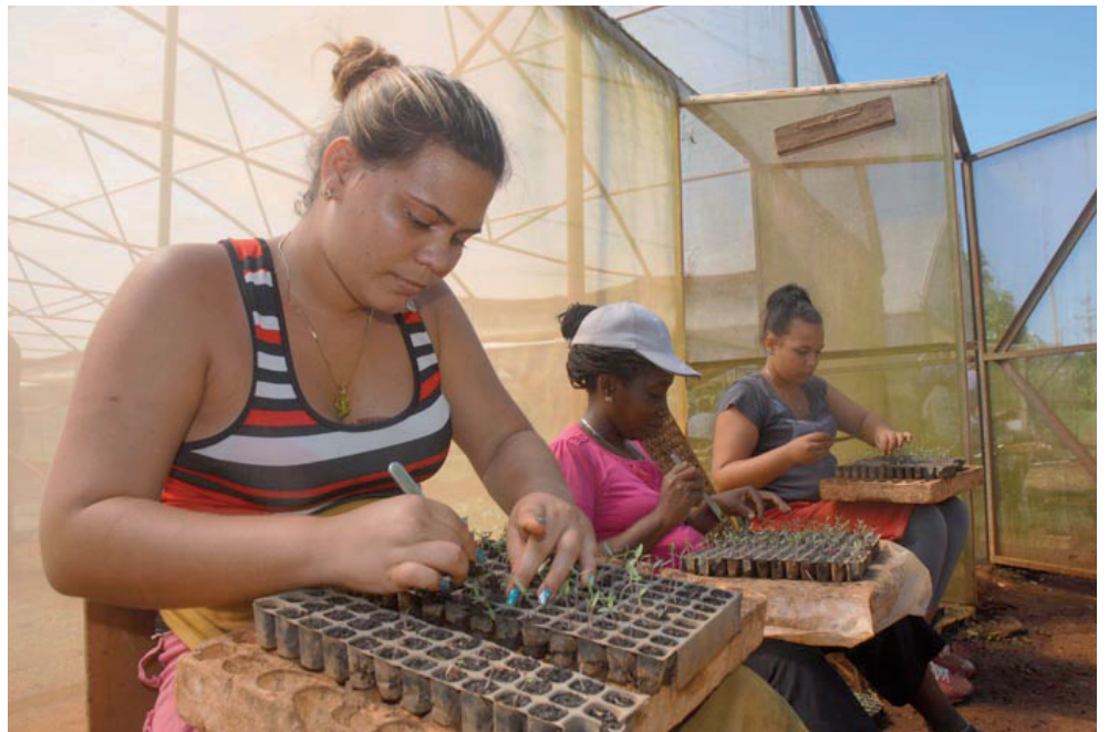
Garantizar posturas para intensificar las siembras es vital en estos momentos.