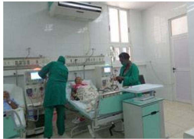
La atención hospitalaria se restablece.

ños de los primeros en llegar. "Nos toca pagar con amor y esta es la hora", puntualizó.