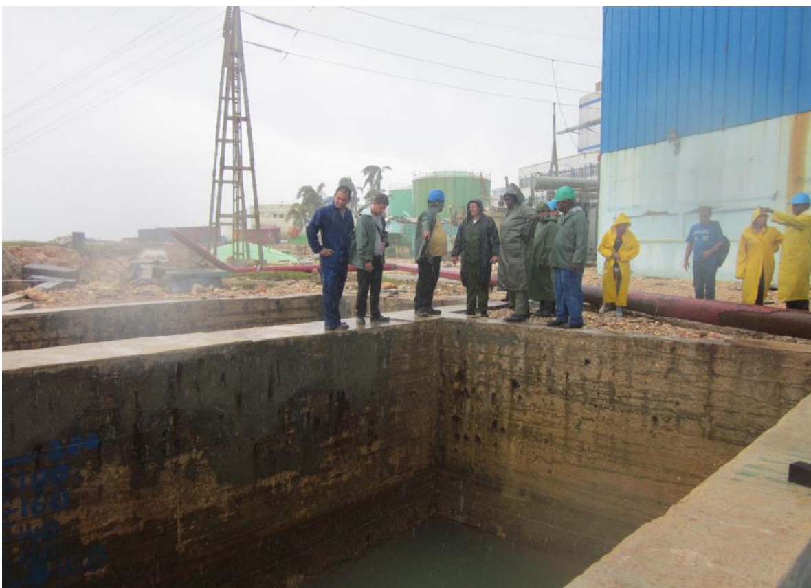
Canal de entrada. Debajo están los cuatro conductos que los buzos deben desobstruir.

Para devolverle la vida a la CT, se echó manos a todo y a todos los que po-