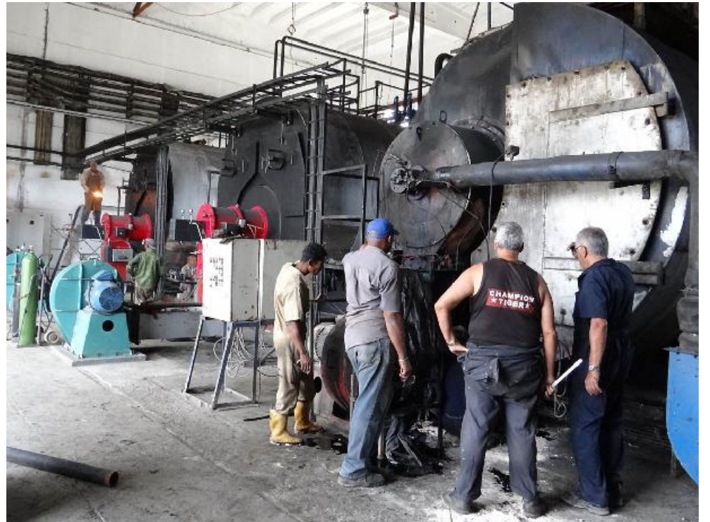
El montaje de las dos calderas fue lo más notorio entre las acciones acometidas por los trabajadores del Complejo. La de la derecha es la vieja con 43 años de explotación, y que mantuvo con vida la producción de esta entidad.

Por ello el Complejo Lácteo tocó fondo, y los niños capitalinos reciben desde octubre pasado la llamada mezcla para batido —con menor aceptación y más caro de producir, aunque con iguales índices nutritivos—, mientras que para la merienda escolar en la provincia se deben ejecutar diversas estrategias con otras fábricas, incluso de otros territorios.