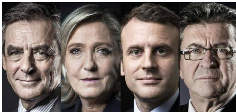
Fillon, Le Pen, Macron y Mélenchon: los favoritos a las presidenciales de Francia.

Un tercio de los 44,8 millones de votantes inscriptos reconoce que aún no tomó una decisión definitiva; mientras que otro 35 % ha admitido su intención de abstenerse.