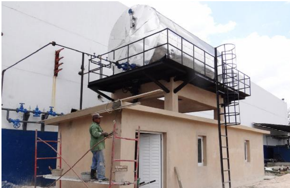
La planta de tratamiento de agua deberá estar concluida a fines de abril. Ello es imprescindible para la puesta en marcha de las calderas ya montadas.

nes de prevención e inestabilidad de la materia prima. Asimismo dificultades con los equipos para el mantenimiento del producto, incumplimientos de los planes de inversión y poca liquidez financiera.