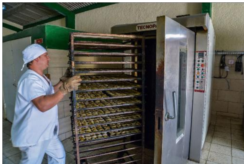
En la panadería-dulcería Armando Mestre se producen 17 tipos de renglones y panes.

Garbo mantiene una estrategia para producir alimentos, dirigida a la disminución de los gastos, pero sobre todo a diversificar el menú que le llega al constructor a pie de obra.