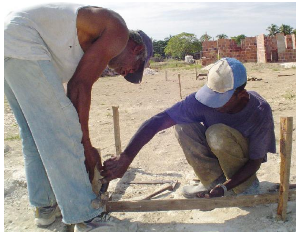
Las provincias con mayor cantidad de viviendas para terminar por esfuerzo propio son Las Tunas, Santiago de Cuba, Sancti Spiritus, Granma y Ciego de Ávila.

Su aplicación está sustentada por el acuerdo No. 8089, del CM, y la Re-