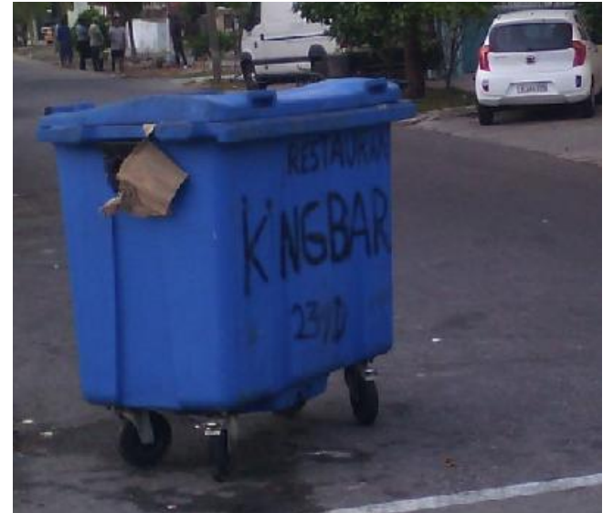
Contenedor de basura en una de las zonas más céntricas de La Habana que un bar ha etiquetado como suyo.

“A medida que el sector no estatal se ha desarrollado, se ha vuelto cada vez más claro que las empresas privadas relativamente ineficientes han sido capaces de prosperar dentro de la economía nacional ya que sus costos en pesos cubanos, incluyendo la mano de obra, están infravalorados en la tasa CADECA/CUC que utilizan para sus transacciones. En efecto, el Estado cubano está subsidiando el nuevo sector no estatal a través de la tasa infravalorada de CADECA. Mientras tanto, las empresas estatales tienen que utilizar el tipo de cambio oficial sobrevaluado, una grave desventaja en términos de su competitividad. Una forma de ‘ilusión monetaria’ que significa que las empresas estatales eficientes reportan pérdidas por lo que no pueden obtener capital para la inversión, mientras que los empresarios privados que operan a niveles muy bajos de productividad disfrutaban de fuertes subsidios estatales ocultos pero se quejan de impuestos excesivamente altos”.