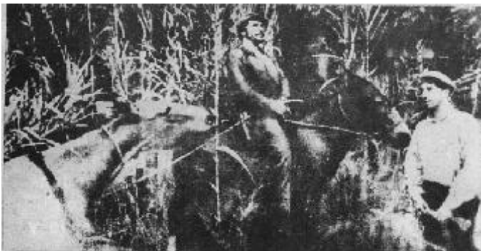
El Loro junto al Che en la guerrilla.

El Che anotó en su diario el 4 de mayo: “La radio dio la noticia del arresto del Loro, herido en una pierna, sus declaraciones son buenas hasta ahora. Según todo parece indicar, no fue herido en la casa sino en otro lado, presumiblemente tratando de escapar”. Y así había sido.