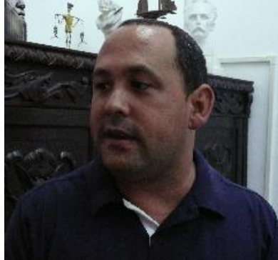
El Primero de Mayo nos uniremos a la marcha del pueblo matancero, enfatizó Tony.

“Como ya se ha hecho tradicional —agregó—, una de las obras realizadas por cada creador en el curso de la Bienal formará parte de la exposición anunciada al término