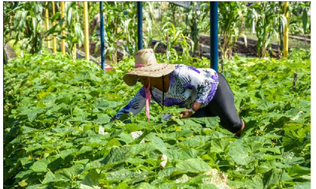
En este organopónico con 2 mil 100 metros cuadrados garantizamos la ensalada diaria para 800 trabajadores.