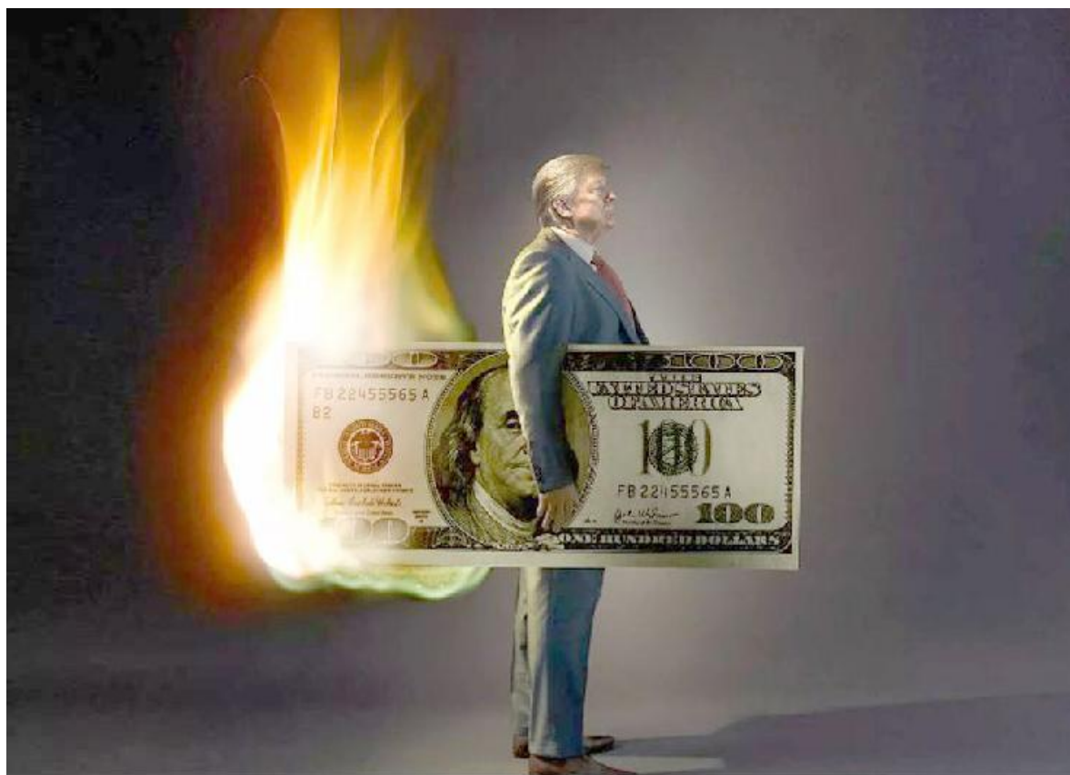
No son pocos los economistas en Estados Unidos que no descartan el inicio de la recesión a finales del 2019 o comienzos del 2020, en pleno año electoral.

El desempleo presentado en la estadística oficial se debe ajustar para incluir el denominado subempleo o empleo marginal, que lo elevaría en aproximadamente el doble. Es decir, el desempleo real de Estados Unidos en enero del 2019 sería 8.1 por ciento. Asimismo debe recordarse la gran desigualdad en todos los indicadores socioeconómicos de Estados Unidos, no solamente por estados, regiones, industrias; sino por sexo, raza u origen étnico y edad. En el pasado mes de enero los adolescentes registraron un 12.9 % de desempleo, los negros 6.8 % y los latinos 4.9 %; por lo que al incluir el empleo marginal sería 25.8 % los adolescentes, 13.6 % los negros y 9.8 % los latinos, un cuadro más objetivo.