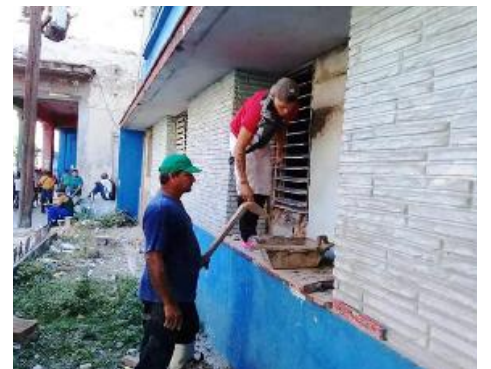
Cada detalle resulta atendido para que las casas queden aún más bellas y confortables.

resanaron, dieron el llamado “fino” a paredes y pintaron. “El aporte, aunque breve, resultó significativo. Trabajamos de ocho de la mañana a seis y media o siete de la noche”, precisó Vázquez Cejas.