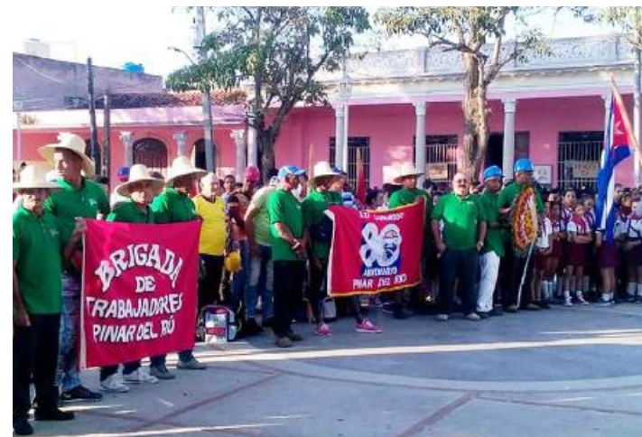
Acto de abanderamiento y despedida efectuado en la ciudad de Pinar del Río.

En este caso la ayuda llegó de Vueltabajo y fue muy bien recibida. El enfrentamiento a los daños ocasionados por el tornado ha hermanado de nuevo a los cubanos de diferentes regiones y ha multiplicado el valor de solidaridad que nos caracteriza, desde la Punta de Maisí al Cabo de San Antonio.