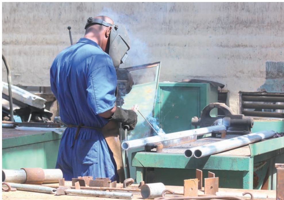
Ya reiniciaron varias producciones alternativas para incrementar sus ventas.