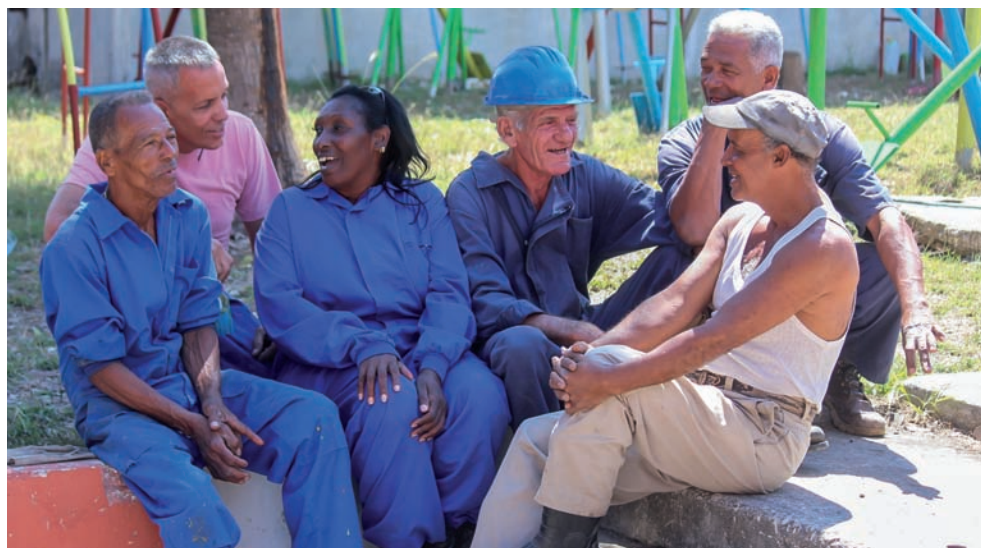
Lo que pudo parecerles el fin de su fábrica, comienza a ser nueva esperanza.

te 80 constructores, provenientes de empresas de Ciego de Ávila, Santiago de Cuba, Las Tunas y Cienfuegos, así como integrantes de dos cooperativas, que prevén terminar todas las cubiertas en abril.