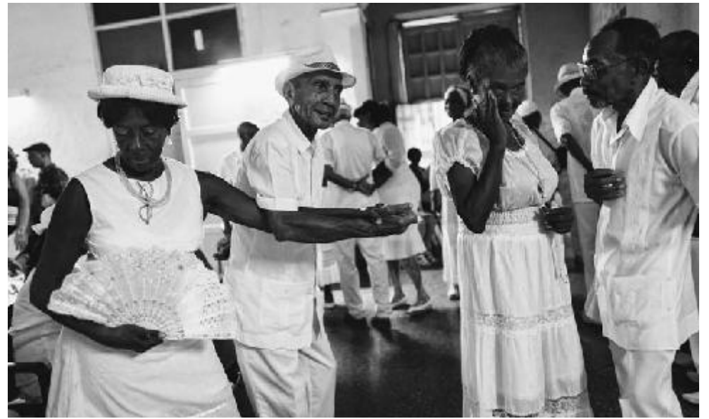
en un baile de danzón en la Casa de Cultura de la barriada de Los Sitios, en la capital.

El danzón, como ninguna otra expresión musical, posee un lenguaje de comunicación íntimo y único entre los bailarines. Se trata de códigos de expresividad en los