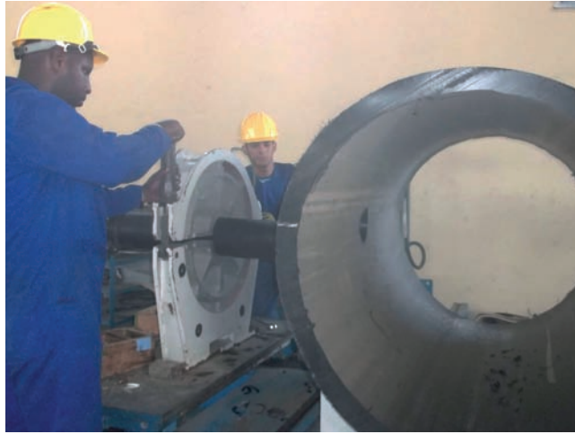
En proceso una de las piezas especiales en forma de T reducida que será utilizada en la nueva conductora que abastecerá de agua potable a La Habana Vieja. | fotos: Del autor

La primera fábrica de su tipo inaugurada en el país –las otras dos se encuentran enclavadas en la capital y Holguín–, no ha desviado su rumbo en la producción y comercialización desde su