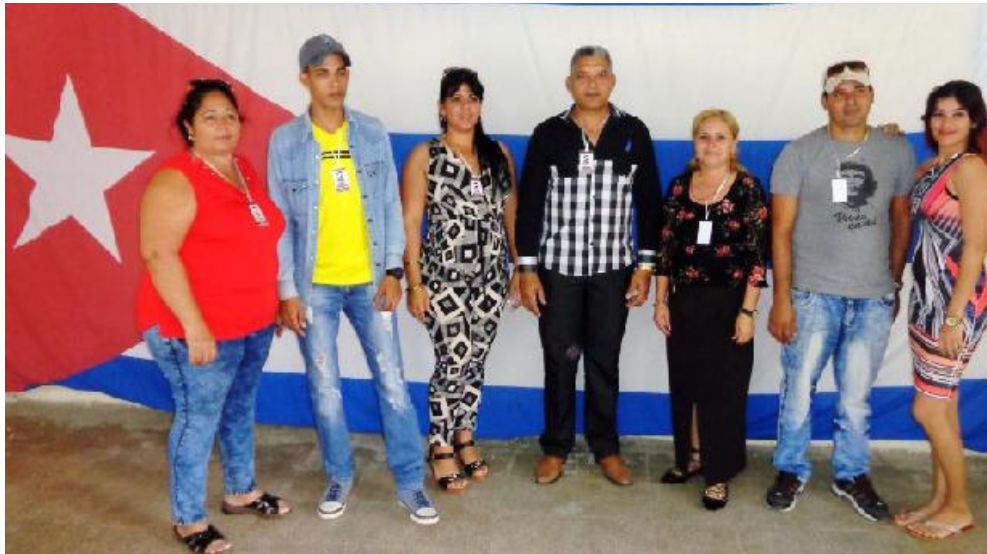
El nuevo buró municipal electo.