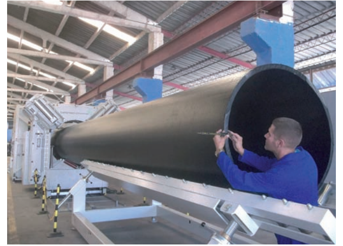
La recién estrenada y única línea en el país que produce tuberías de polietileno de alta densidad de hasta mil 200 milímetros de diámetro, con gran demanda en inversiones hidráulicas.

“Con las otras dos líneas industriales, el taller nacional de piezas por termofusión radicado en nuestra unidad, y tres máquinas para elaborar conexiones de polietileno por la técnica de inyección, contribuimos el pasado año con el programa hidráulico en Las Tunas, Camagüey, La Habana y la Zona Especial de Desarrollo Maríel”, destaca el especialista.