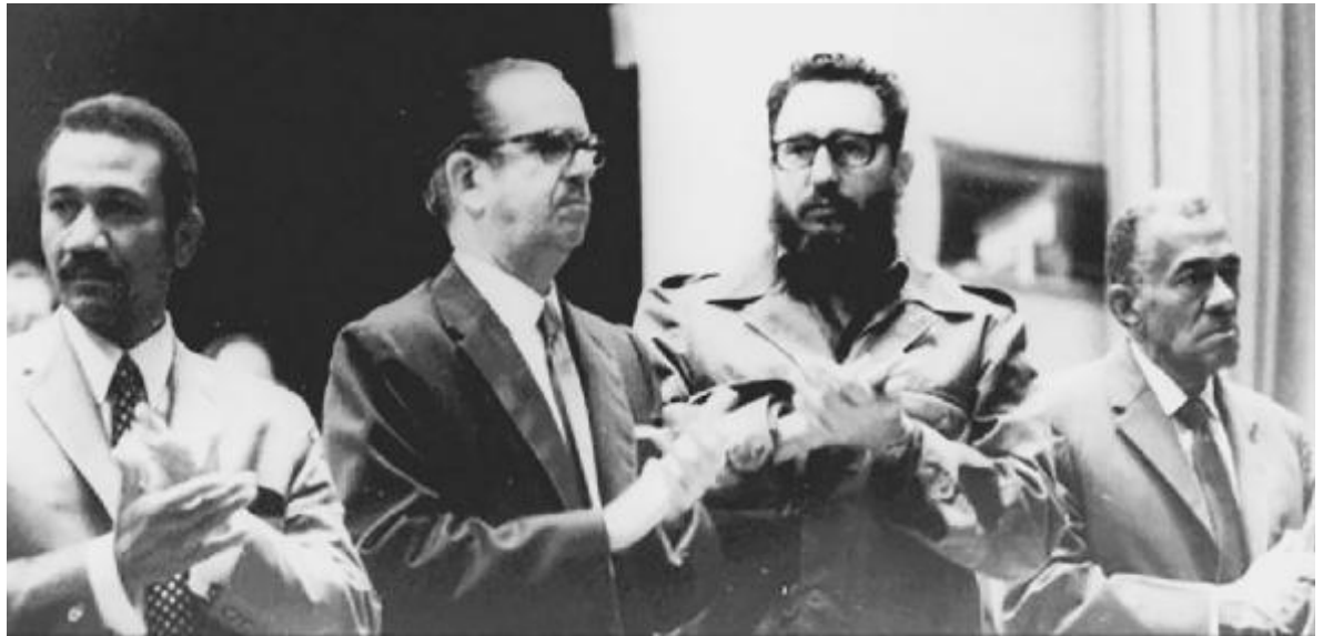
En la presidencia del XIII Congreso de la CTC, de izquierda a derecha, Almeida, Osvaldo Dorticós, Fidel y Lázaro.