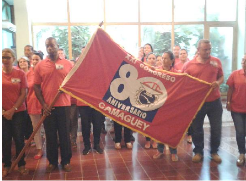
Miembros de la delegación camagüeyana portan su estandarte.

“Ser elegidos delegados al Congreso nos hace portadores de res-