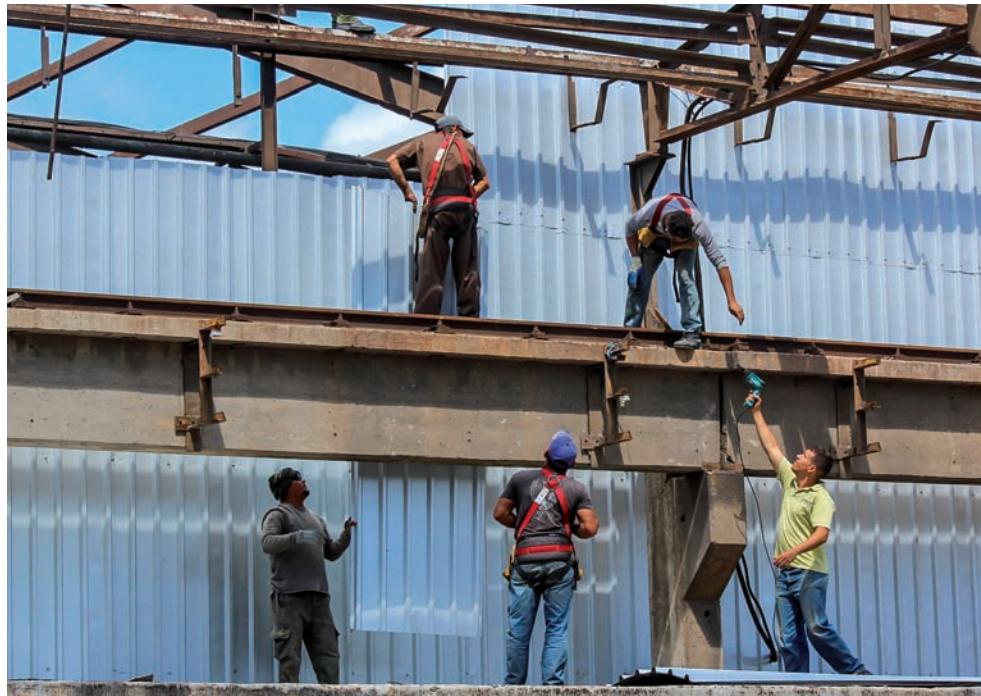
Es un trabajo complejo, lento y peligroso, a 12 metros de altura como promedio.

Ya disponen, por ejemplo, de los 35 mil metros cuadrados de tejas que requieren los techos y laterales de sus grandes talleres, de los cuales ya montaron unos 10 mil 500, alrededor del 30 por ciento. Laboran en esta tarea ocho brigadas con aproximadamen-