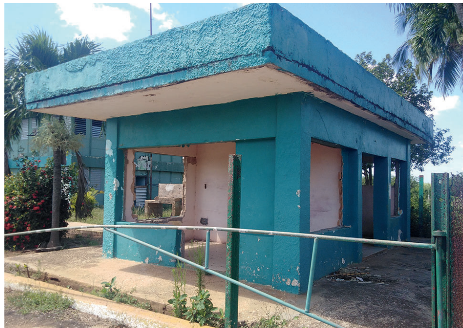
Cuando no hay agente de seguridad el delincuente arrasa, como sucedió en esta garita desmantelada en el centro nombrado Agrobiocentro, de la Empresa Azumat, en Ciro Redondo, una de las entidades a las que Seproc le retiró el servicio de vigilancia.

De vuelta al hecho de la injusticia laboral es evidente que el TMP de Morón dicta sentencia el 24 de mayo del 2024. Queda inconclusa para obediencia la actitud de la dirección de la UEB Seproc, violatoria de la ley que protege y aboga por un ambiente laboral justo, inclusivo y respetuoso.