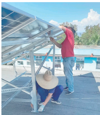
Las brigadas de Copextel en Sancti Spíritus laboran en el montaje de kits fotovoltaicos en instituciones vitales de la provincia.

Un vistazo a la tierra del Yayabo entre paneles solares, microbuses eléctricos y su presa