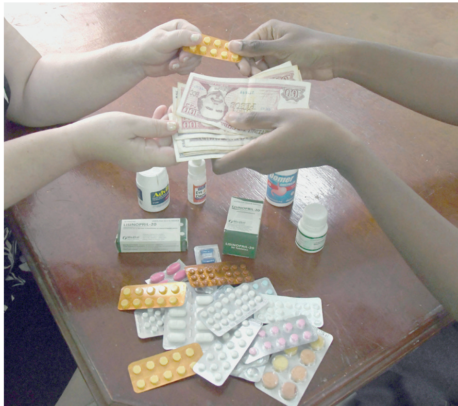
El desabastecimiento de medicamentos en las farmacias ha obligado a las personas a recurrir al mercado ilegal.

Ante este panorama el vicepresidente de BioCubaFarma precisó que adoptaron alternativas como las colaboraciones internacionales, que permiten producir en el extranjero medicamentos o ingredientes farmacéuticos como la aspirina y traerlos a Cuba. “Esta medida nos facilitó importar interferón desde China durante la COVID-19”.