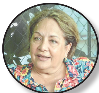
Premio Nacional de Periodismo José Martí (2024)

Será la mejor manera que tendremos para cumplir la parte que nos toca en este inédito escenario y salir nuevamente airosos.