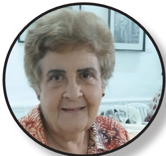
Premio Nacional de Periodismo José Martí (2025)

En ese ecosistema irrespirable por su toxicidad, ajeno al papel cultural y social del periodismo cubano, corresponde a la prensa y sus periodistas responder con la profesionalidad en que se formaron y se desempeñan.