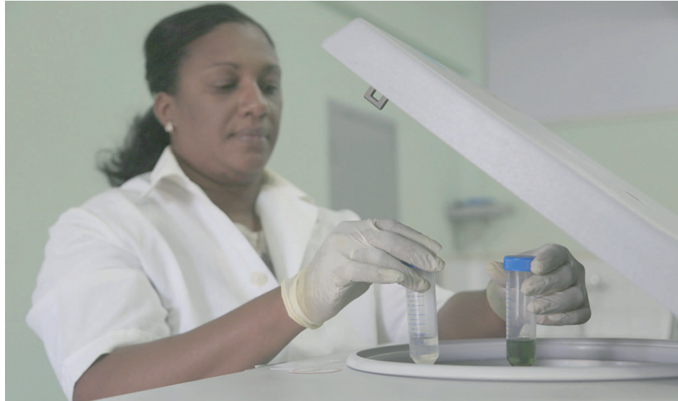
El Centro de Biotecnología Industrial desarrolla un proyecto para optimizar el proceso de producción de semillas de setas comestibles en el cual también participa la Sociedad Interfaz Cintro S.A.