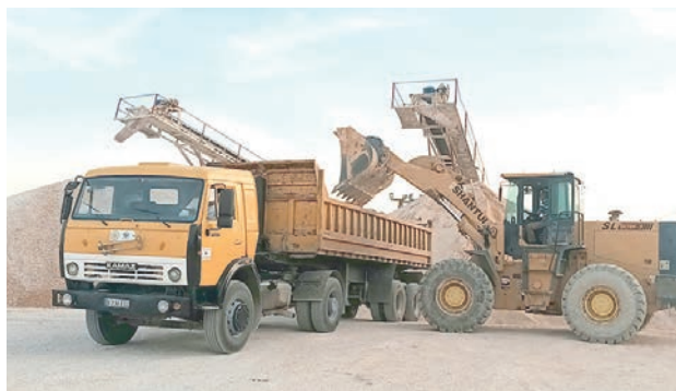
Diversificar, incrementar la eficiencia y la calidad constituyen este año prioridades del colectivo de Avilmat.

Para mantener la calidad y cubrir las demandas de los clientes, de los programas constructivos locales y del país, la entidad cuenta como fortaleza con los resultados del eficiente ejercicio económico del 2025, durante el cual no solo se alcanzaron crecimientos en la mayoría de las producciones y las ventas, sino también en las entregas de materiales para la construcción de los parques solares fotovoltaicos; las inversiones de los polos turísticos de Villa Clara, Camagüey y Ciego de Ávila; los viales de los aeropuertos de estas tres provincias entre otras prioridades.