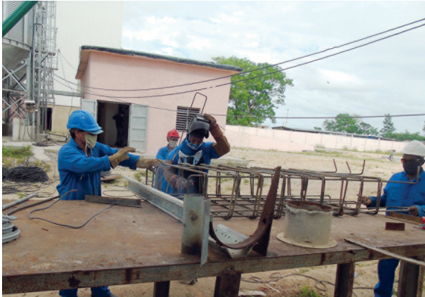
La construcción y el montaje de secaderos de arroz, como parte del programa alimentario, formó parte de las obras que fueron impulsadas en el pasado año.

Los colectivos laborales del Grupo Empresarial de Construcción y Montaje (Cubacons), del Ministerio de la Construcción (Micons), proseguirán este año numerosas obras y comenzarán otras, todas de marcada significación para el desarrollo económico y social del país.