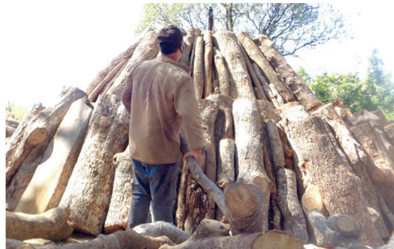
En la Empresa Agroforestal Holguín se hace carbón de mezcla a partir de maderas duras, que se destinan sobre todo para el mercado europeo.

“Tenemos déficit en algunos municipios, sobre todo en Antilla, Gibara y Calixto García, aunque en estos momentos con el incremento salarial esos territorios se han ido recuperando. Y en la medida que la atendamos