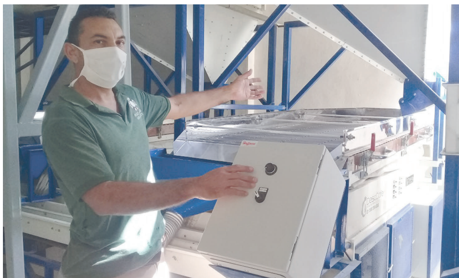
El jefe de la línea de procesamiento de frijol confirma que la prueba técnica de la industria resultó satisfactoria.

santiagoense municipio de Palma Soriano demostró su pertinencia al procesar las primeras producciones dedicadas al consumo humano y animal.