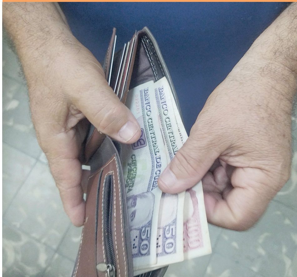
El no pago de los salarios en tiempo afecta el bolsillo de los trabajadores cubanos.

Atrasar el pago del salario, después de haber dado el aporte, es una violación de la ley que desmotiva y priva al trabajador de lo necesario para el sustento familiar. Trabajadores se acerca al tema en varios territorios del país