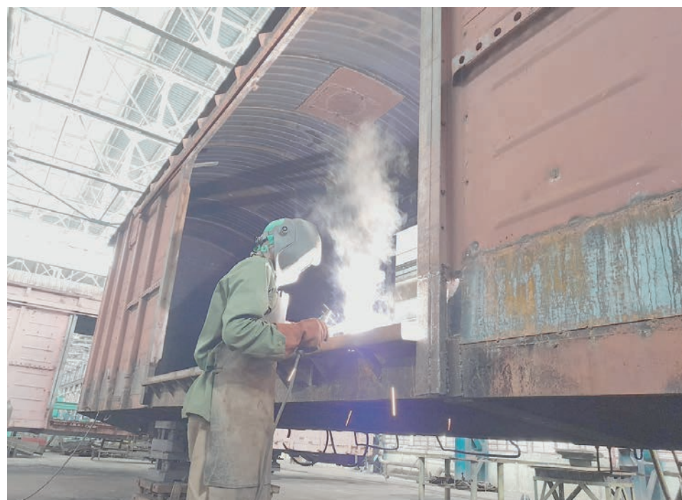
Sin darle la espalda a su cliente histórico, AzCuba, la KTP se vincula a proyectos de envergadura como la reparación de casillas ferroviarias, que le ahorran combustible al país por el traslado de la canasta básica.

Igualmente se esfuerzan en recomponer cajas de ampliroll y