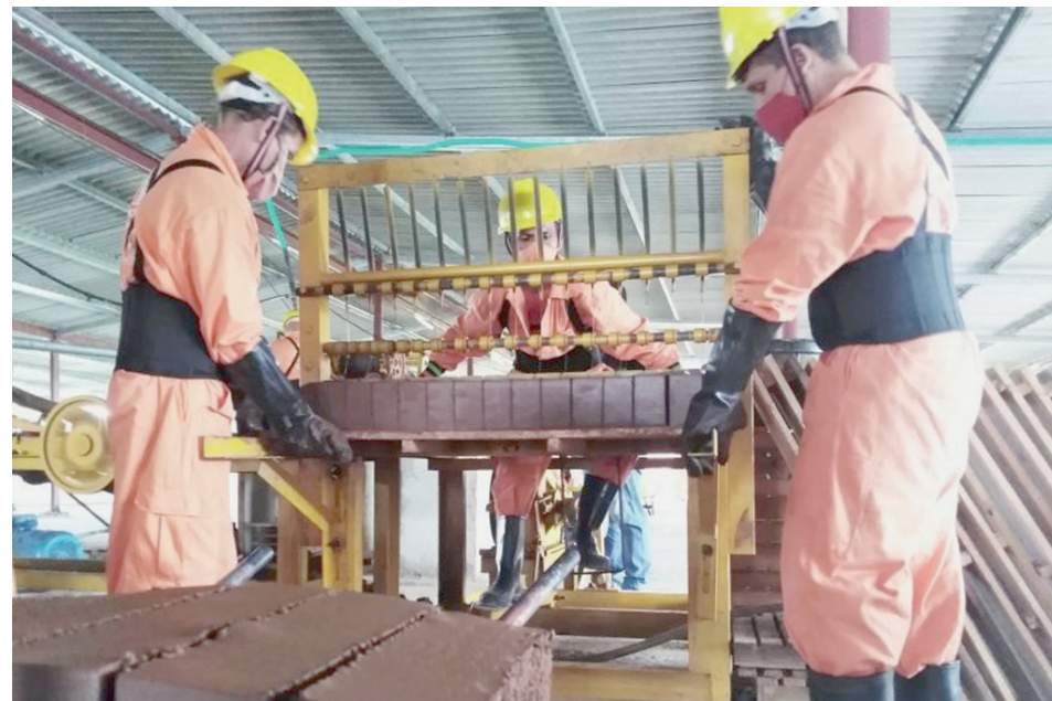
Las minindustrias para la fabricación de productos derivados de la arcilla, con tecnología china, que fueron donadas a Camagüey por las agencias de Rumanía y Suiza para el Desarrollo y la Cooperación (Cosude) a través del proyecto Reconstruyendo Mejor Post Irma, muy poco trabajaron, los problemas energéticos lo impiden, y esperan por mejores tiempos.

El dirigente recordó que el Código de Trabajo, en su artículo 114, establece que “el salario se paga en pesos cubanos al menos una vez al mes por períodos vencidos”. Cualquier modi-