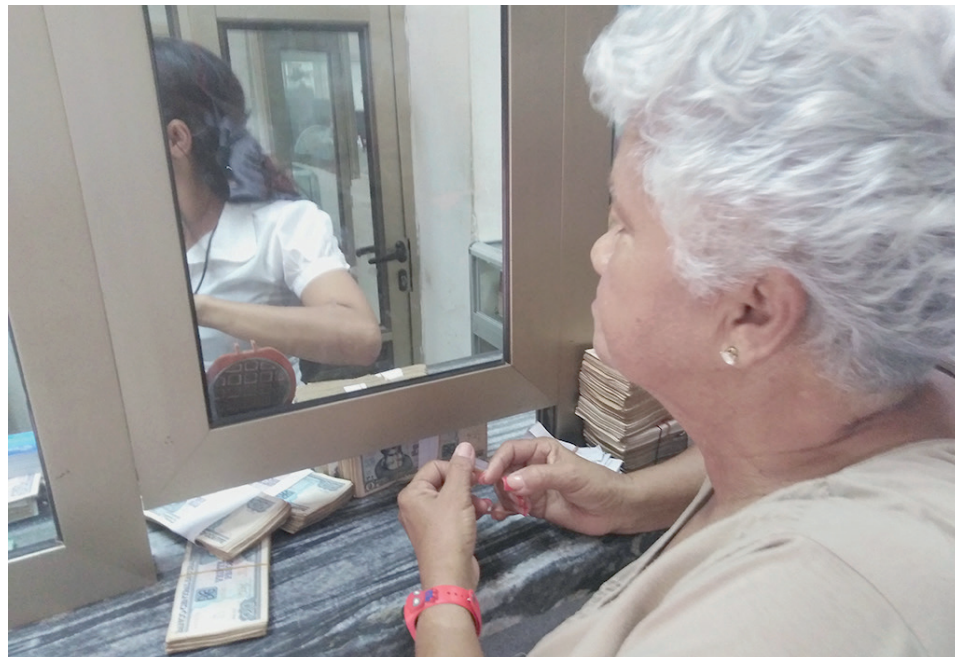
Por inexistencia de efectivo no es el atraso, máxime si el ciento por ciento de las entidades estatales y presupuestadas están bancarizadas, al menos en el Banco de Crédito y Comercio de Isla de la Juventud.