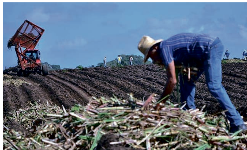
El colectivo de trabajadores de la empresa agroindustrial 14 de Julio, de Cienfuegos, es el primero del país en cumplir el plan de producción.