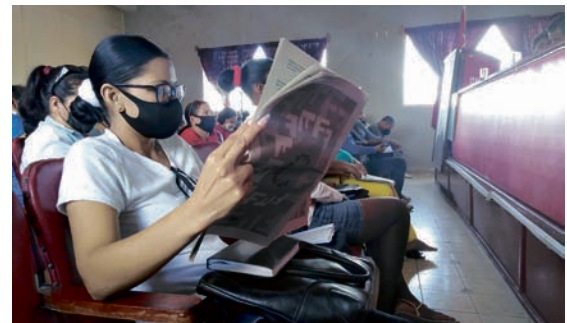
Camagüey se prepara para apoyar los procesos de consulta del proyecto del Código de las Familias. | foto: De la autora

El proyecto del Código, concluyó León Rondón, “es de las familias, es un documento actualizado y atemperado; es el Código de la Revolución, el cual garantizará el futuro de la nación”. | Greltel Díaz Montalvo