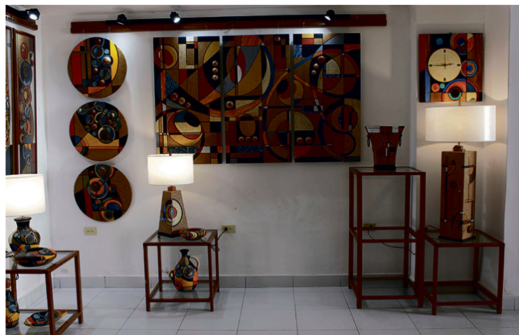
Vista parcial de la exposición.

Aunque buena parte de los espectadores no comprenden las múltiples y complejas simbologías de los colores, no es menos cierto que la mayoría experimenta disímiles respuestas emocionales ante ciertas combinaciones de estos; suerte interpretativa de la que se vale la artista para conformar sus discursos plásticos, en los que la abstracción geométrica, como forma del arte abstracto, invade espacios en variados soportes —cerámica, madera, papel, cartón...—, para combinarse en composiciones con extraordinarias armonías ópticas, en las que interactúan las formas con numerosas ilusiones derivadas del peso y la solidez de las estructuras gráficas influidas, además, por la luz y el espacio.