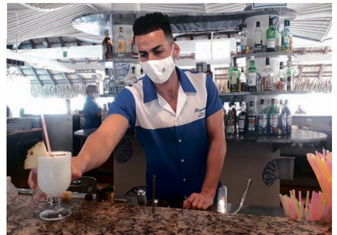
En el 2021 el colectivo del Royalton trascendió por sus 219 donaciones de sangre, el apoyo con recursos a instituciones sanitarias y la atención esmerada a la fuerza laboral.

El 4 de marzo, Día del Trabajador de la Hotelería y el Turismo, en el Royalton Hicacos se inició la jornada por los 20 años de su entrada en operaciones el 19 de octubre del 2002. En sus casi dos décadas de existencia en el hotel se ha forjado una admirable cultura de óptimo que hacer, de la que se considera