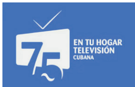
Imagen y sonido para un país mejor