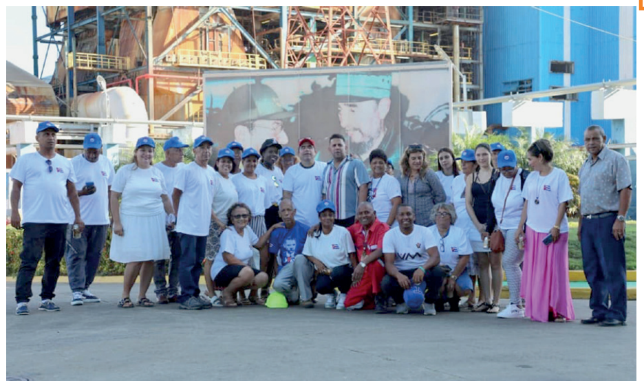
Parte del colectivo del periódico Trabajadores en la CTE Guiteras.

Resultó esa la penúltima actividad en la apretada y fructífera agenda del encuentro nacional de corresponsales de este rotativo, muy bien acogido por la Central de Trabajadores de Cuba en la Ciudad de los Puertos, a la cual agradecemos no solo las atenciones y la exquisita organización sino también haber podido sesionar en entidades como la Empresa de Proyectos de Arquitectura e Ingeniería, ejemplo de consagración y resiliencia. | RN