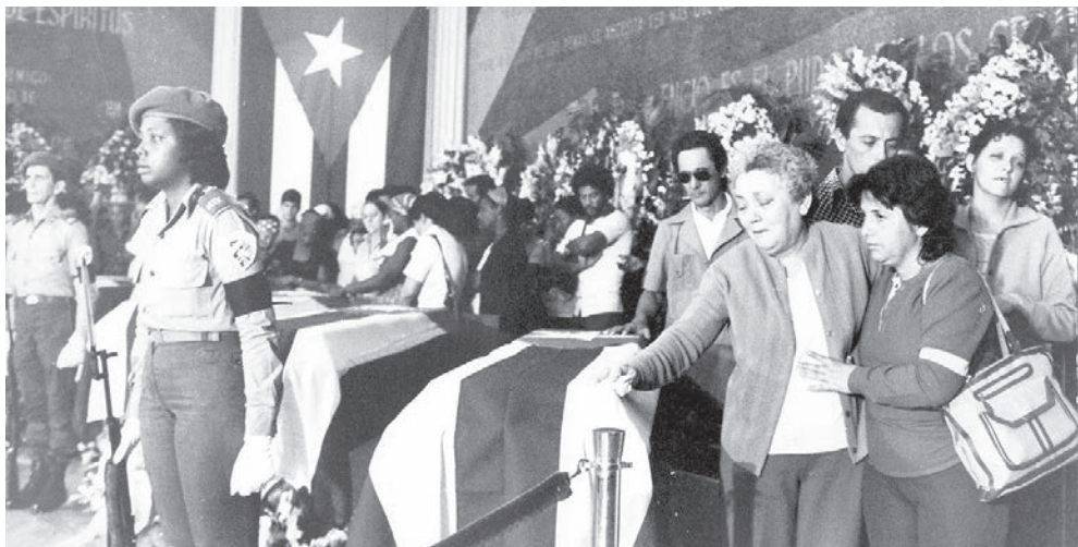
Duelo de despedida a las víctimas del atentado al avión de Barbados.

Frente a esa lógica perversa, la memoria, la justicia y la solidaridad son formas de resistencia. Recordar el 6 de octubre de 1976 es honrar a quienes murieron e impedir que la historia se repita.