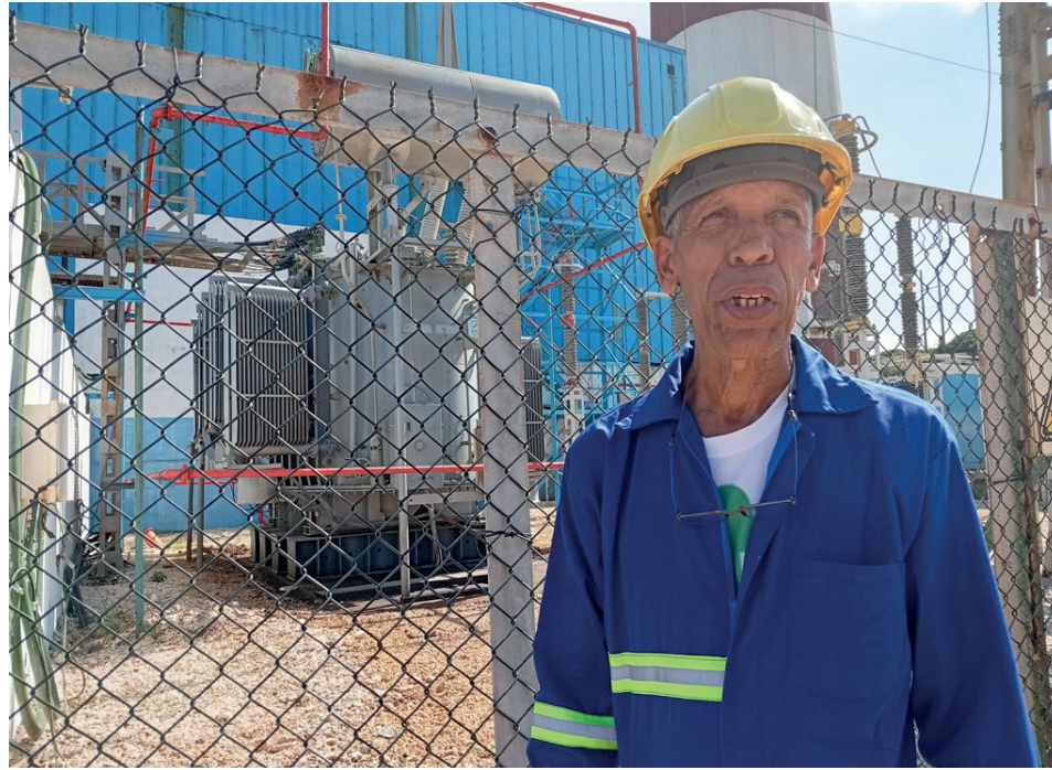
La innovación del transformador de arranque está considerada por la Unión Eléctrica como una de las más relevantes de la CTE Guiteras.

“El equipo convierte la energía de 110 mil a 6 mil voltios de entrada para que el bloque pueda iniciar el arranque, y luego se queda en standby . Si ocurriera un disparo, entra para alimentar moto-