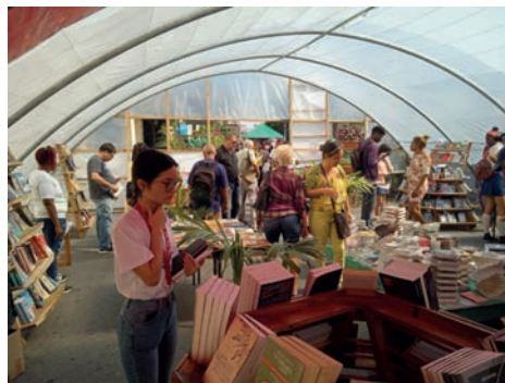
Una vez más se ratifica la Feria como el evento cultural de mayor convocatoria en Cuba.

Ese espíritu permeó la edición vueltabajera del evento, en la que hubo lugar para diferentes manifestaciones artísticas, en varios espacios creados en la red de ins-