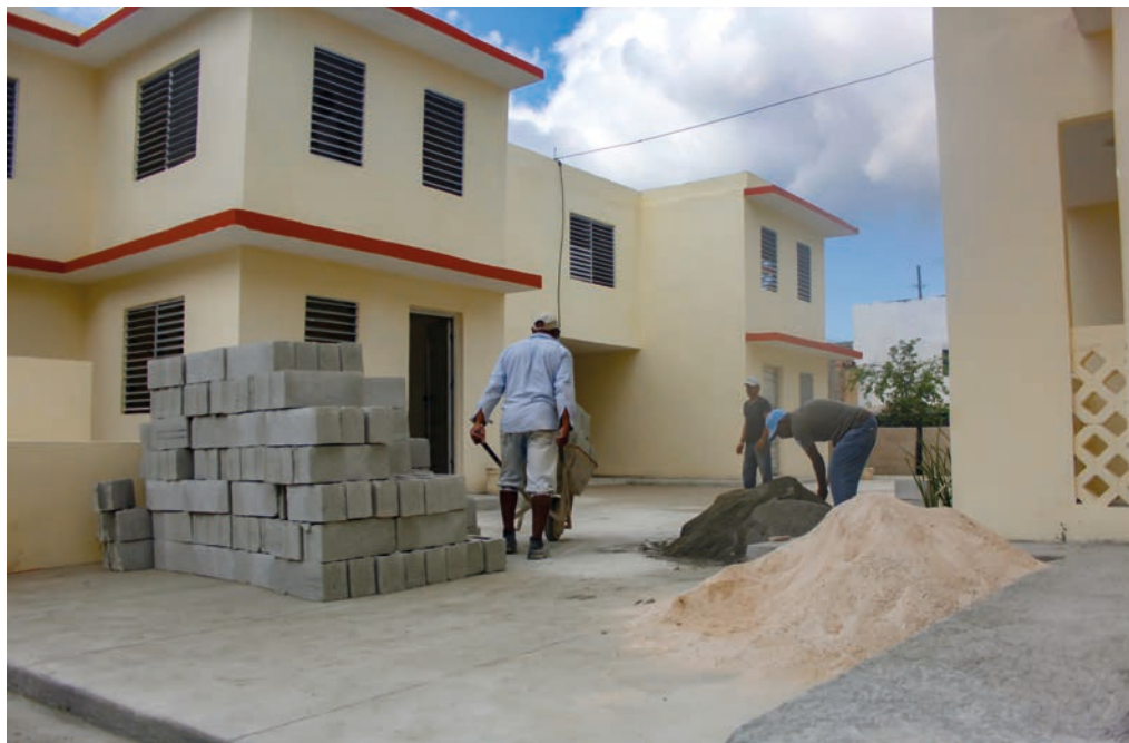
Los constructores fueron los mismos que rehabilitaron la escuela Concepción Arenal.