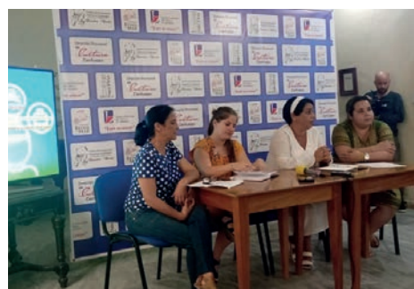
Conferencia de prensa inicial, en la que se informó el programa de la fiesta de los libros y la literatura en Cienfuegos.