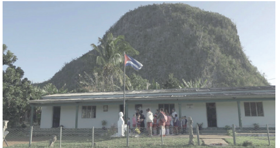
Mantener el proceso educativo fue un logro de todos.

Como mujer, directiva, madre, esposa y residente en una de las localidades ubicadas en las carreteras de acceso a la ciudad, Yaritza asegura que es una experiencia bonita, pero compleja para estos tiempos: “Es un municipio bien grande, priorizamos el servicio de los 19 círculos infantiles y cuatro escuelas especiales. A veces uno tiene en la cabeza qué dejé en la casa para elaborar y con qué cocinamos los alimentos. Si estamos en una etapa lluviosa, ¿cómo prendemos ese carbón? Pero al final todo sale y tengo mucho apoyo familiar”.