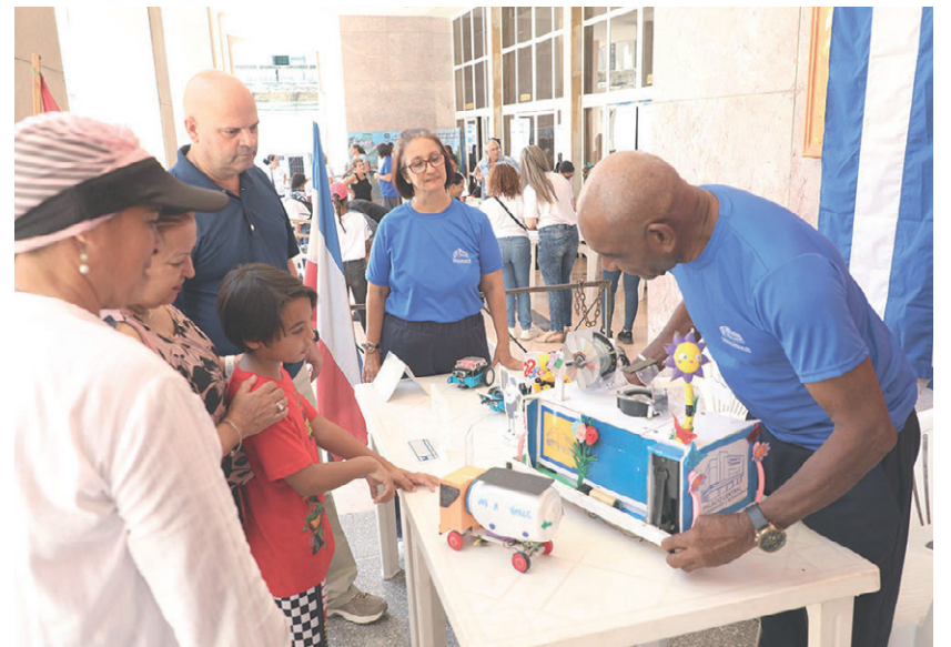
Variados proyectos tecnológicos e innovaciones fueron presentados, un ejemplo de que la creatividad también nace en el barrio.