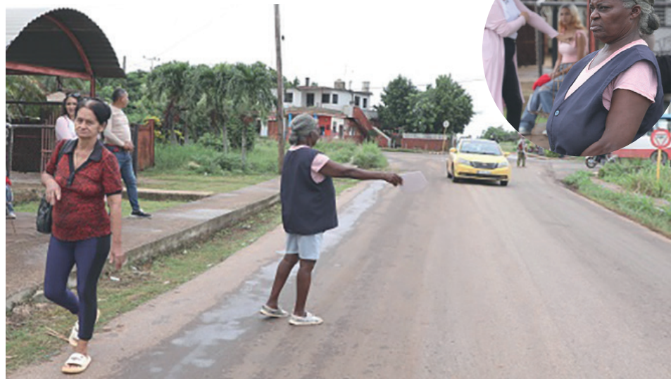
“Sin mirar la chapa paro a todos, lo que importa es el corazón”.

“Estuve infartada, y no sabes la cantidad de choferes que pasaron por mi casa con un jugueto o una