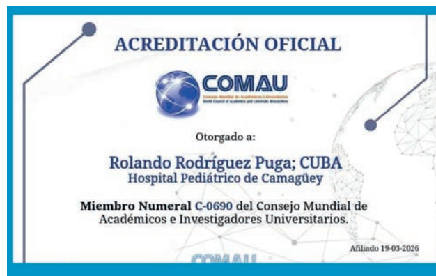
Otro de sus reconocimientos.

Dice Rolando que le tomó por sorpresa: “Ellos radican en Estados Unidos y cuentan con científicos ilustres y personalidades del mundo.