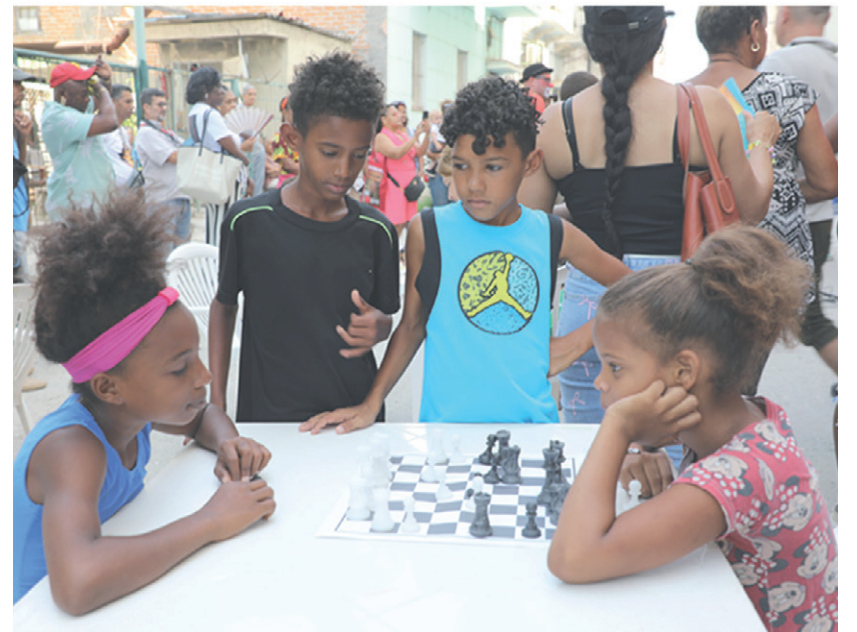
Juegos de mesa y otros entretenimientos pudieron disfrutar los niños de la localidad de Pueblo Nuevo.