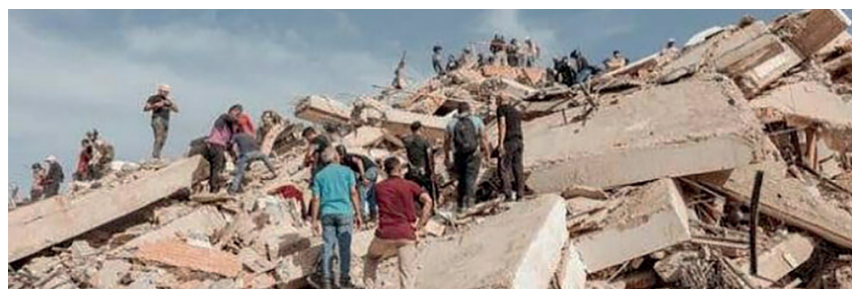
En Venezuela continúan las labores de rescate. Se estima que el recuento final de las víctimas tardará y podría alcanzar las 60 mil personas.

Los cuartos de final de la Copa Mundial comenzarán el jueves y finalizarán el sábado. De aquí y hasta el próximo lunes habrá tiempo para seguir disfrutando y sufriendo, pues esos son también dos ingredientes que nos regala y hacen grande al fútbol. ¿No lo cree? ¡Suerte!