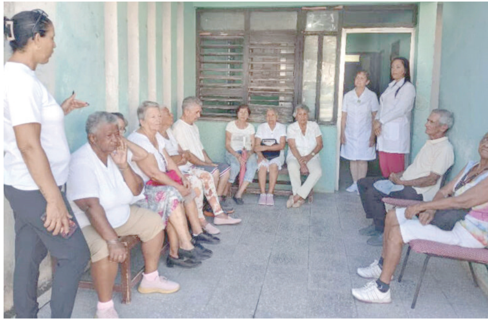
Se promueven conversatorios de salud con personas de la tercera edad.

“Hemos priorizado la atención a dos grandes grupos de pacientes: los que requieren hemodiálisis y los oncológicos para recibir quimio o radioterapia. En situaciones nor-