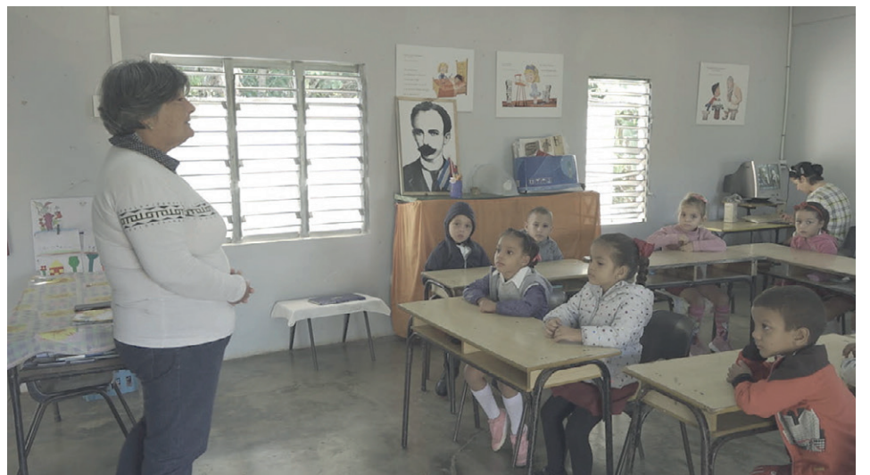
La reincorporación de jubilados es una de las alternativas con la que garantizaron una cobertura docente, así como la contratación por horas y el pago por exceso de carga.