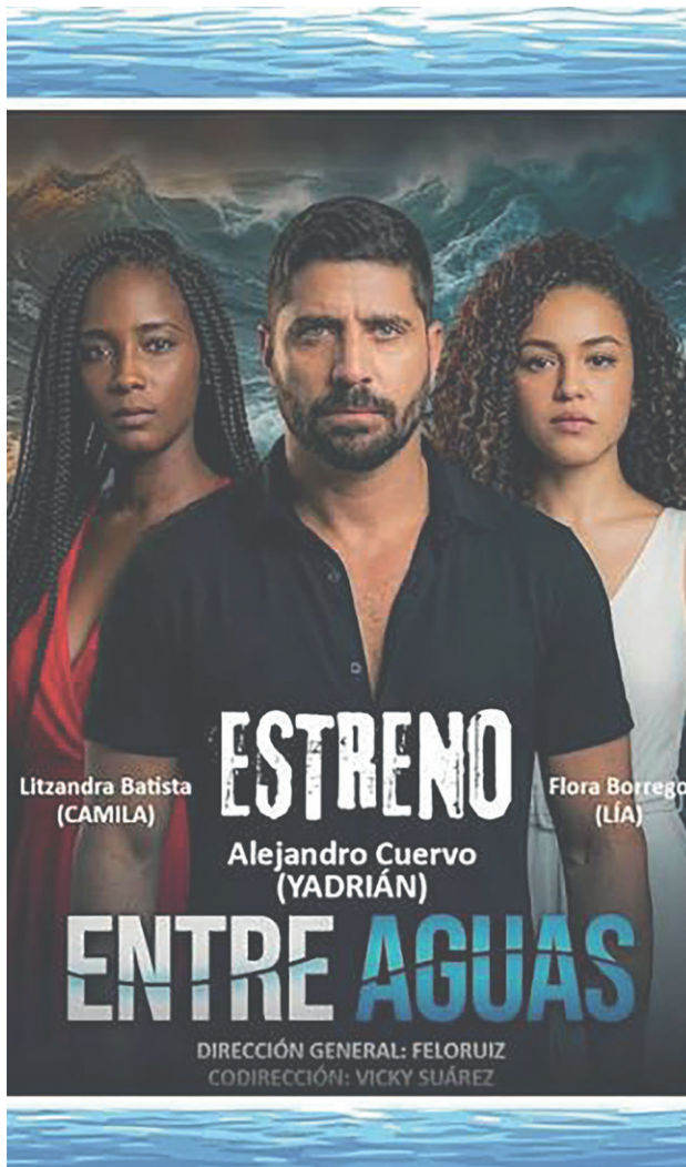
| foto: Cartel promocional de la telenovela

Ese debate conduce a una pregunta más amplia: ¿qué telenovela necesita hoy la Televisión Cubana? La respuesta difícilmente será única. Lo que sí parece indispensable es avanzar hacia estándares de calidad, tanto formales como conceptuales, que otorguen mayor coherencia a ese espacio de ficción.