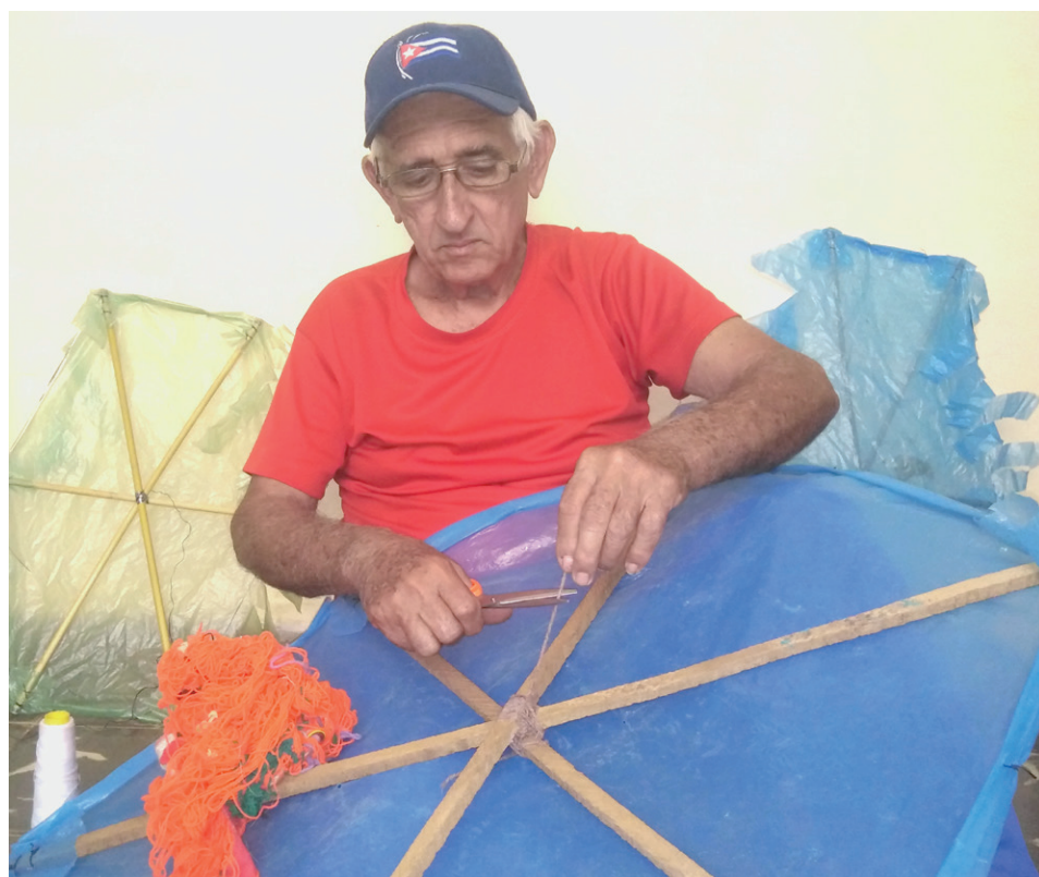
Preparándose para el venidero Festival del Papalote.