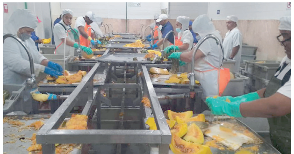
El procesamiento de vegetales posibilita que los trabajadores mantengan el vínculo laboral y se empleen las capacidades instaladas de la línea para pescado. | fotos: Cortesía de Yamilé Cabrera García

La producción industrial decayó en las especies de escamas y bonito, pero alcanzaron los volúmenes pre-