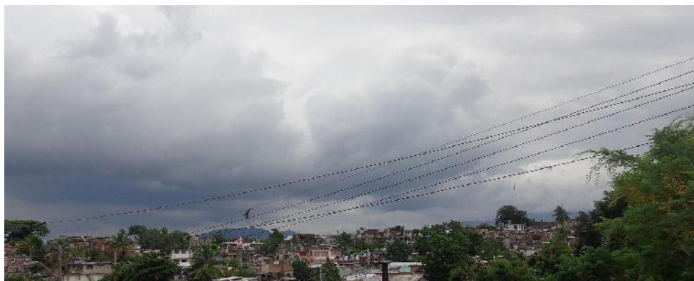
Un cielo encapotado, poco común en Santiago de Cuba.

Tal situación con la disponibilidad de agua embalsada mantiene tensa la entrega del líquido a la población y a las entidades estatales, con la aplicación de medidas emergentes entre ellas ciclos de distribución alargados, algunos en más de los 15 días; el abasto con pipas a varias comunidades y la perforación de pozos en zonas donde resulta factible. | Betty Beatón Ruiz