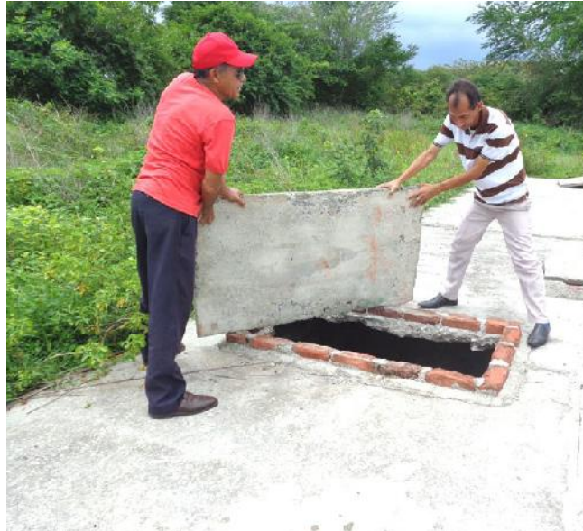
Este tanque séptico es parte de la inversión inconclusa.

La directiva reconoce las razones que motivan la insatisfacción, asociada a la incapacidad del sistema instalado para evacuar eficazmente las llamadas aguas negras y nosotros agregamos que