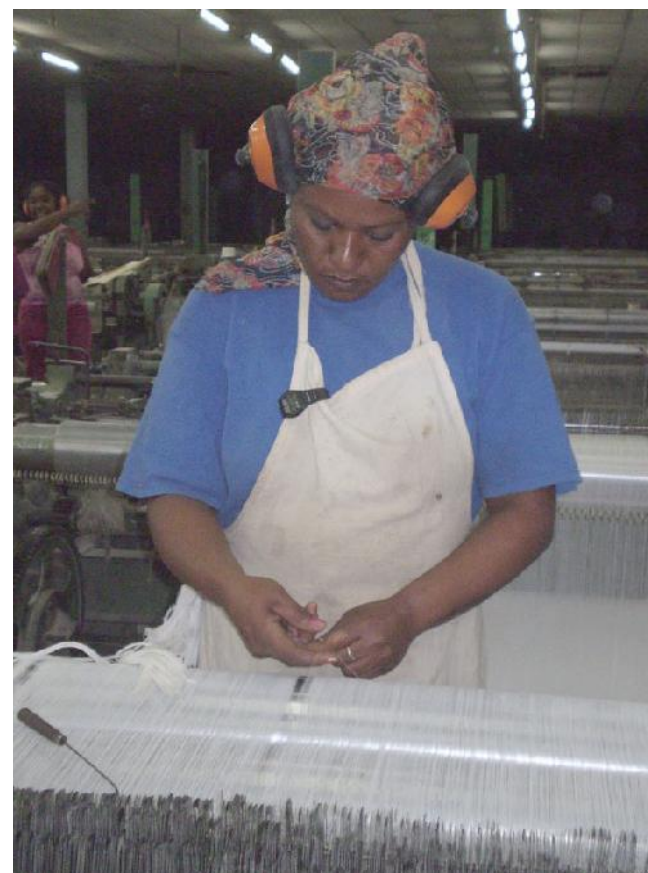
Los trabajadores de la matancera textilera Bellotex no se sienten suficientemente atendidos por la empresa villaclareña Sarex.

En el Pleno de la CTC se reconoció que Matanzas debe seguir concediendo elevada prioridad a los empleados del sector no estatal y al completamiento de sus cuadros, dos asuntos que hoy entorpecen un mejor desempeño de sus direcciones.