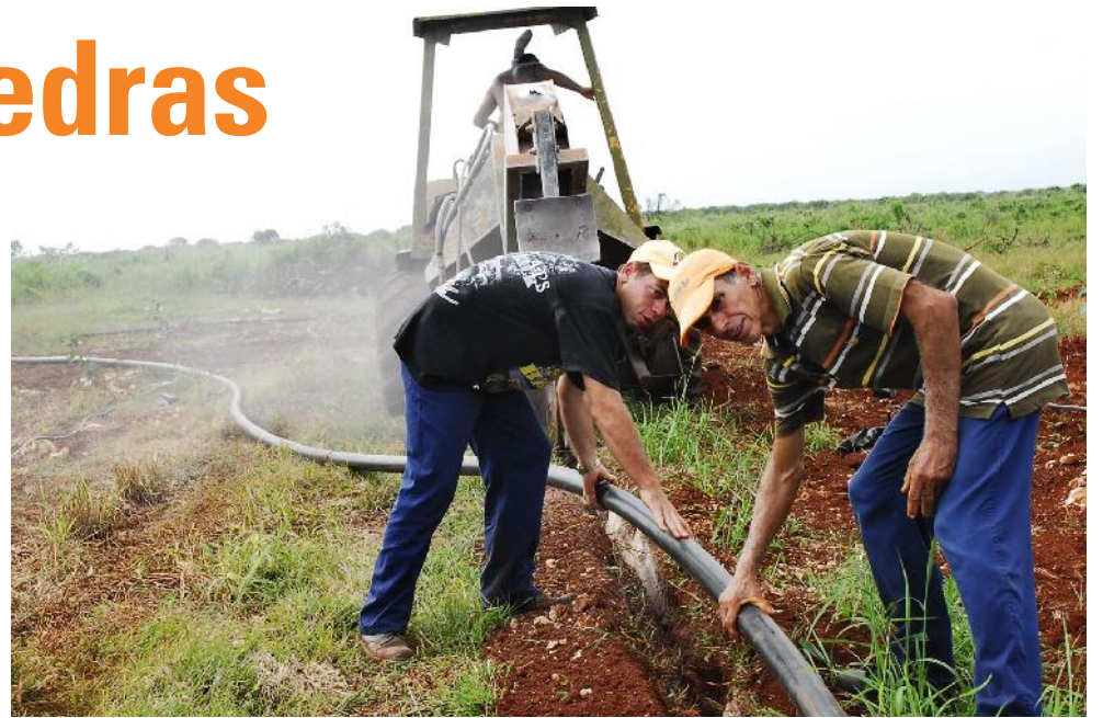
La brigada de riego localizado es clave para que las plantaciones crezcan vigorosamente.