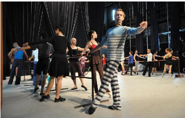
El bailarín ucraniano Vladimir Malakhov ofrece una de sus clases a los bailarines participantes en el concurso.

La historia del Concurso de Danza del Atlántico Norte Grand Prix Vladimir Malakhov se ha contado varias veces. Lo cierto es que la segunda edición de la cita, que concluyó este fin de semana, ha reunido a bailarines y compañías de todo el país, con la participación de invitados de otras naciones.