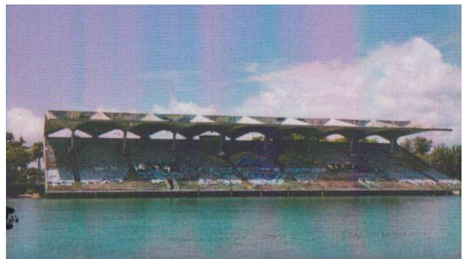
Estadio y nube, 2015 (Miami Marine Stadium).

imaginarnos. El horizonte es corregido en el detalle porque para Flor es imprescindible diferenciar la relación que puede haber entre el ver y el mirar y entender las gradaciones de luz, difíciles de domesticar tanto en Cuba como en Miami”.