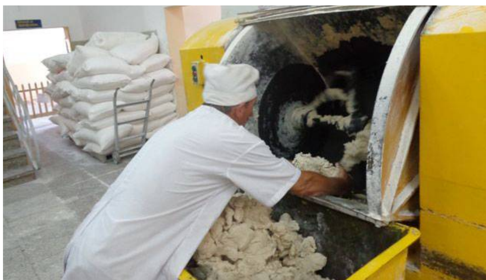
Más de tres décadas en su oficio de preparador de masas de harina.