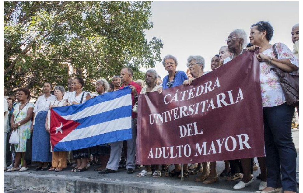
La Cátedra del Adulto Mayor debate sobre temas como sexualidad en esta etapa de la vida, desarrollo humano, prevención de enfermedades como la hipertensión, artritis, diabetes, entre otras.

Con relación a cómo se reflejan estos espacios educativos en la sociedad civil, la psicóloga Orosa explicó que se han ido posicionando efectivamente. “Creo que el principal factor que ha posibilitado esto