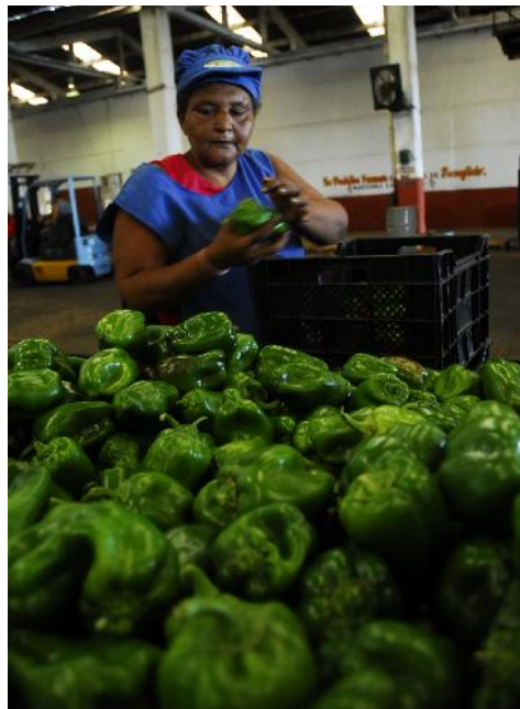
Todos los productos agrícolas se benefician y empaquetan; y por etapas las cosechas son insuficientes para cubrir la demanda.