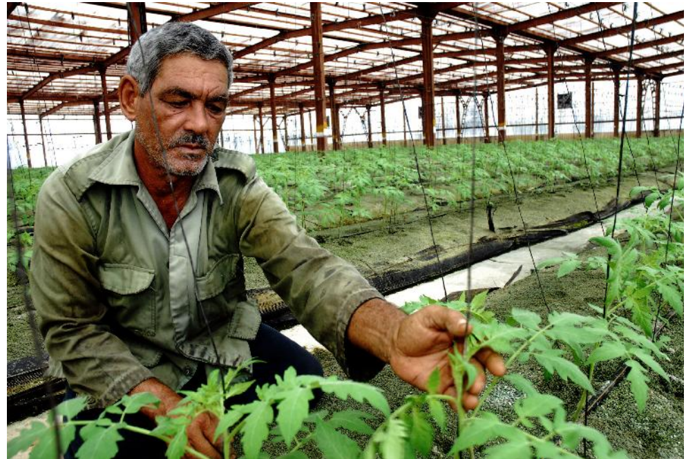
El trabajo es arduo bajo el sol inclemente o el calor extremo en las casas de cultivo, pero los hombres tienen muchas recompensas.