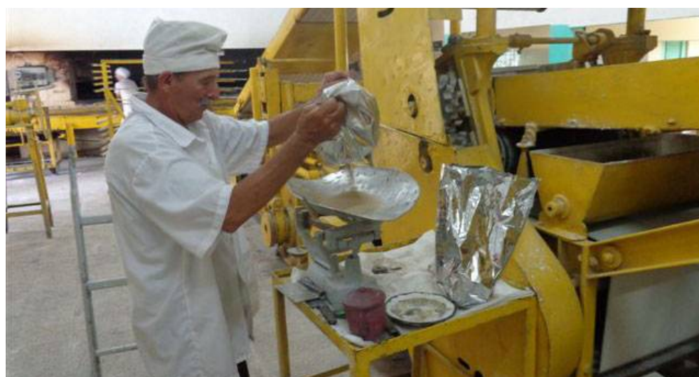
Siempre atento a la correcta dosificación de las materias primas.

Nacional en 20 ocasiones, medallas de Hazaña Laboral y Jesús Menéndez, Orden Lázaro Peña de primer, segundo y tercer grados y la máxima distinción laboral, el título de héroe.