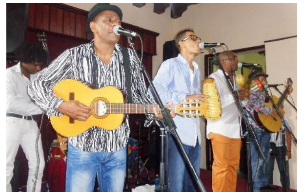
En la Casa de la Trova de Santiago de Cuba el Septeto Santiaguero celebró la nominación al Grammy junto a músicos que intervinieron en Tributo a Los Compadres-No quiero llanto.

Tributo... , del Septeto Santiaguero y José Alberto el Canario —con la participación de músicos como Oscar D'León, Andy Montañez, Tiburón Morales, Eliades Ochoa, la Conga de Los Hoyos, el Orfeón Santiago y otros— llega a la postulación con un bien ganado reconocimiento del público y la crítica, gracias, entre otras cosas, a que se torna “revitalizador de la música tradicional”, según The New York Times.