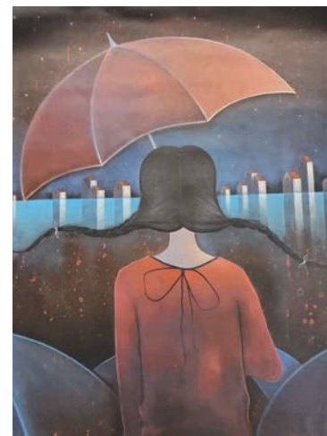
Dos de la obras donadas por Erik Varela Ciudad sumergida y Pensamientos cruzados .

Cada pincelada suya es un gesto bien calculado. A medida que las manchas y las líneas adquieren formas, en una suerte de entretejido con perfiles figurativos, sus cuadros devienen paisajes interiores, cuya morfología se