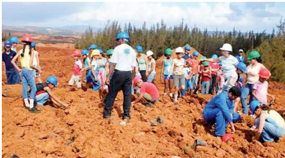
Desde edades tempranas se fomenta en Cuba la educación y cultura por la protección del Medio Ambiente.

Estudios científicos ratifican que el clima en Cuba es cada vez