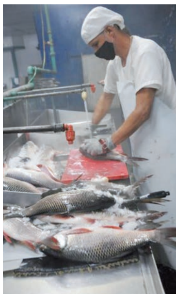
Hoy la Empresa Pesquera de Cienfuegos vive un mejor momento, tras dos años de pérdidas económicas.

La directora de la Empresa Pesquera de la Perla del Sur destacó que actualmente trabajan en cerca de 65 productos establecidos, mientras otros se encuentran en desarrollo, a la espera del registro sanitario y del estudio de mercado.