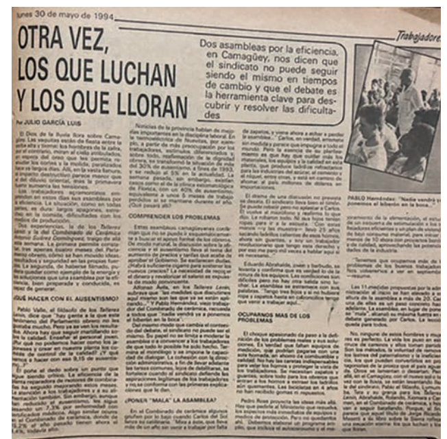
| fotocopia del texto impreso