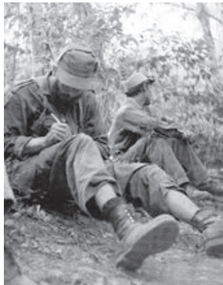
Fidel escribiendo en la Sierra Maestra.

De las primeras acciones de esa contienda, escribió en 1961: “La Revolución cubana tenía que chocar, necesariamente con el imperio poderoso. ¿Hay algún ingenuo en este mundo que se crea que se podía hacer una reforma agraria, privar de la tierra a las grandes compañías imperialistas sin chocar con el imperialismo? ¿Había