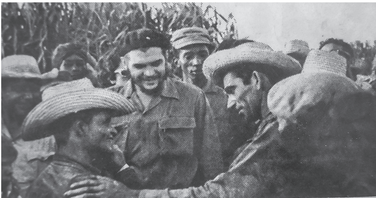
Junto al Che, su gran admirador. Reinaldo aparece a la derecha en la imagen de perfil.

“Ese día promedí 300 arrobas por hora y en la última corté 460. Allí estaba el Che y me preguntó si estaba cansado, le dije que si me ponían