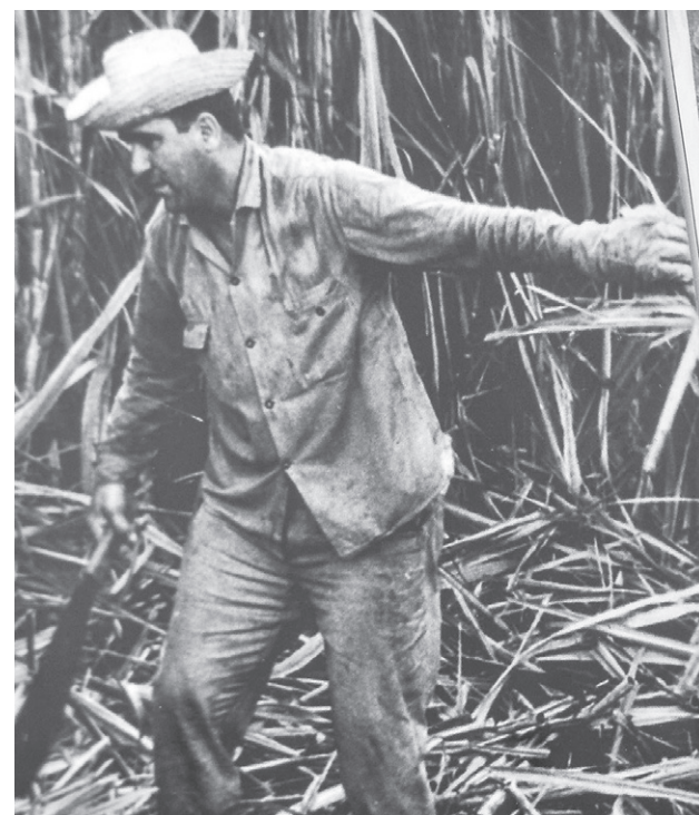
En una competencia nacional llegó a cortar 2 mil 308 arrobas de caña.

Solo camina apoyado en muletas o con la ayuda de la nuera que lo cuida. “Paso la mayor parte del tiempo acostado. Le exigí mucho al cuerpo como machetero, y ese esfuerzo tan grande ahora me está pasando la cuenta. Todo se me ha complicado mucho.