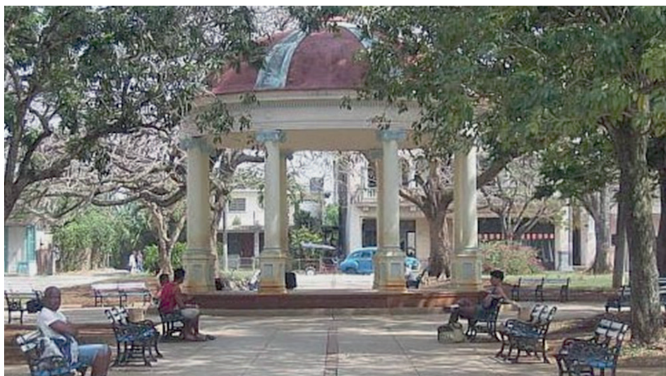
Parque Camilo Cienfuegos, en San José de las Lajas.

En el territorio estuvo el primer sitio fundacional de la Villa de San Cristóbal de La Habana, que luego pasó a la costa norte, al puerto de Carenas. Y si bien existen discrepancias entre los historiadores respecto al lugar exacto de su ubicación, se cree que uno de los sitios más probables sea el centro del antiguo Hato de San Pedro de Mayabeque, actualmente borde entre los municipios de Melena del Sur y Güines.