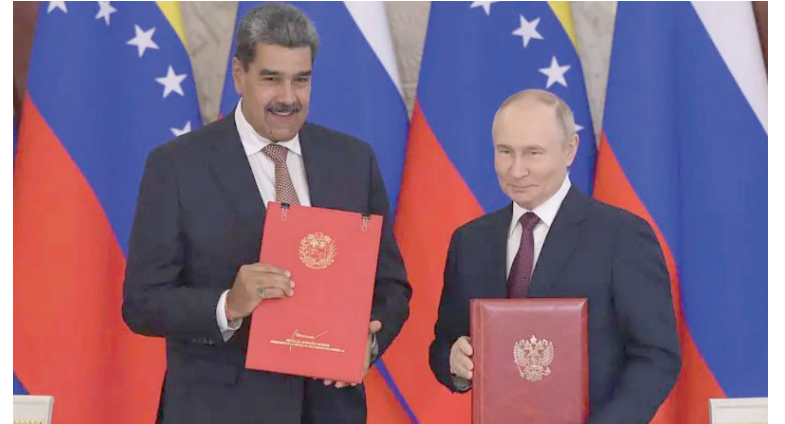
Nicolás Maduro y Vladimir Putin firmaron en el 2024 un acuerdo de asociación estratégica que selló la relación bilateral entre la República Bolivariana de Venezuela y la Federación de Rusia.

La declaración oficial de la cancillería rusa reconoce que el hecho “es profundamente preocupante y condenable. La hostilidad ideológica triunfó sobre el pragmatismo de negocios y la voluntad de construir relaciones basadas en la confianza”.