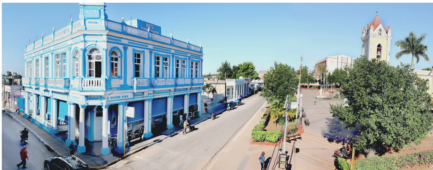
Un nuevo bulevar, el hotel Campoamor y el parque Libertad confluyen con armonía en el centro de la ciudad.

El 9 de enero del 2011 nacieron estas dos provincias, con identidades construidas a base de sus propias riquezas económicas y culturales