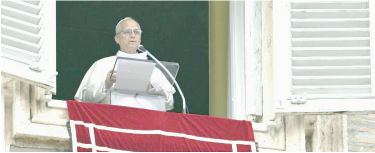
Papa León XIV durante la oración Mariana del Ángelus del domingo 4 de enero del 2026.

“El bien del amado pueblo venezolano —dijo el Santo Padre León XIV este domingo 4 de enero del 2026 en la Plaza de San Pedro— debe prevalecer por encima de cualquier otra consideración y llevar a eliminar la violencia y emprender caminos de justicia y paz, garantizando la soberanía del país, asegurando el estado de derecho inscrito en la Constitución, respetando los derechos humanos y civiles de todos y cada uno, y trabajando para construir juntos un futuro sereno de colaboración, estabilidad y concordia, con especial atención a los más pobres que sufren a causa de la difícil situación económica”.