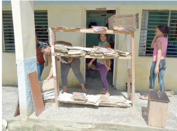
Entre episodios de lluvia, todavía predominantes en el oriente del país, los pobladores de las zonas afectadas ponen a secar las pertenencias dañadas, desde colchones y vestimentas hasta equipos domésticos, libros y expedientes laborales.

Lo que está se sacó del fango y se lavó en el río y ahora se ordena, se clasifica, se pone al sol que sale un rato y luego no, porque la llovizna —en ese sitio que normalmente luce agreste, y que de hecho integra la