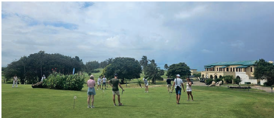
La generación de nuevas experiencias como el Torneo de Golf Swing y Sabor, distinguen los servicios de un referente turístico como Meliá Las Américas.

Y eso hace Meliá Las Américas. Cuando factores como la COVID-19 disminuyeron los visitantes canadienses, principal emisor, rusos y alemanes pasaron a liderar los segmentos de mercados, y “tuvi-