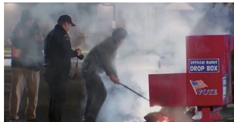
Incendio de un buzón electoral en Vancouver, Washington, el 28 de octubre del 2024.

El cronograma electoral precisa que el Colegio Electoral votará en diciembre. En enero el Congreso certificará el resultado y el día 6 hará el anuncio oficial de quien ascenderá al "olimpio imperial" el Día de la Inauguración Presidencial, previsto para el 20 de enero del 2025.