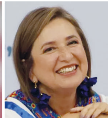
Una de estas dos mujeres, Claudia Sheinbaum (izquierda) o Xóchitl Gálvez, presidirán México en el mandato que se extenderá hasta el año 2030.

del Partido Morena, candidata por la coalición Seguimos Haciendo Historia. Su principal contrincante es Xóchitl Gálvez, quien se presenta por el Frente Amplio por México, integrado por los partidos tradicionales PAN, PRI y PRD.