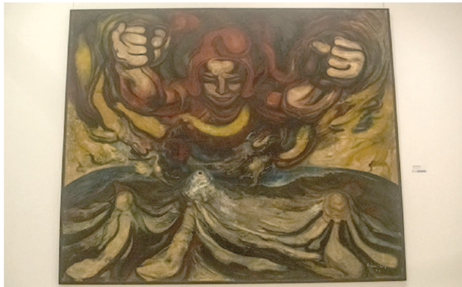
Día de la nueva democracia, de José David Alfaro Siqueiros (1898-1974). Duco sobre masonite; 244 x 294,5 cm