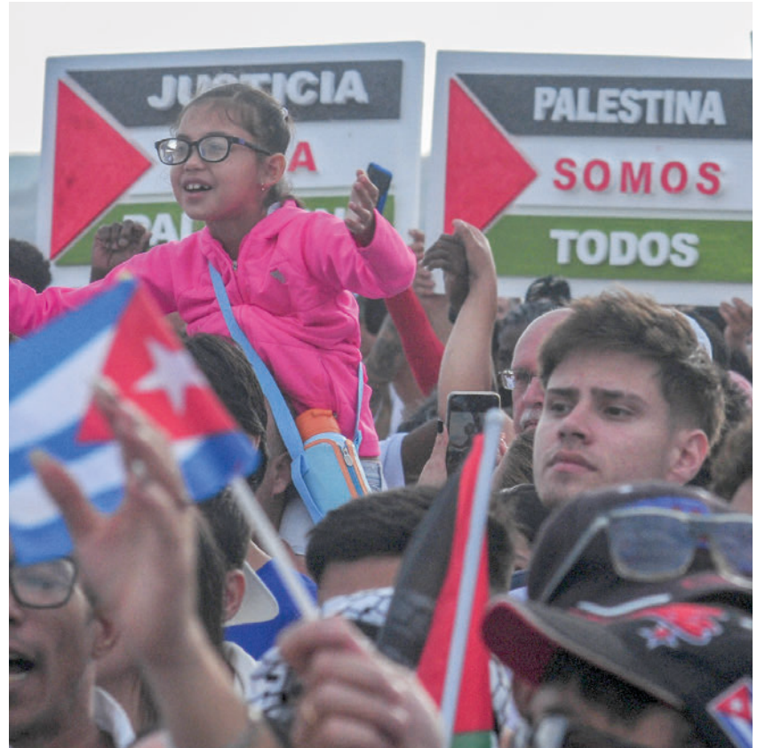
Miles y miles de cubanos se movilaron el pasado sábado a lo largo de nuestro archipiélago para denunciar y condenar el genocidio sionista, y abrazar con mucha sensibilidad la justa causa del pueblo palestino. Los trabajadores y familiares exigieron en cada plaza el fin de los actos de barbarie que tienen como principales víctimas a las mujeres y los niños.