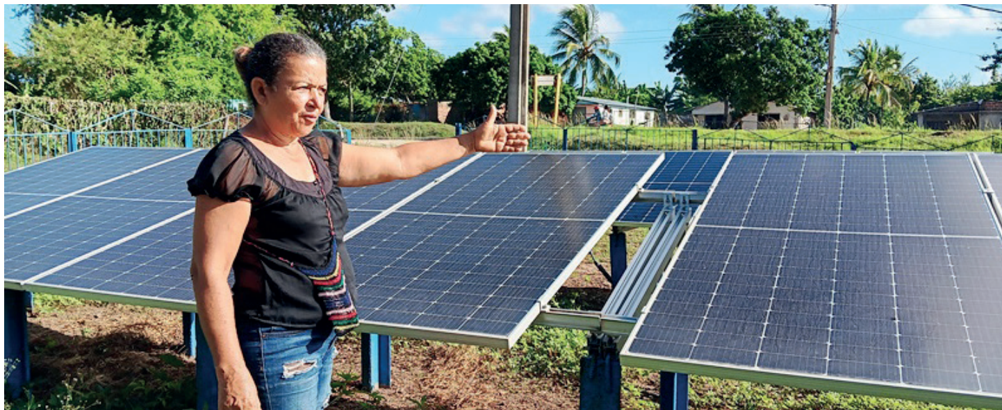
Para Claudia el cambio es como de la noche a la mañana.

Y aunque en la actualidad asociamos su funcionamiento a la indisponibilidad de combustible para la generación eléctrica y específica-