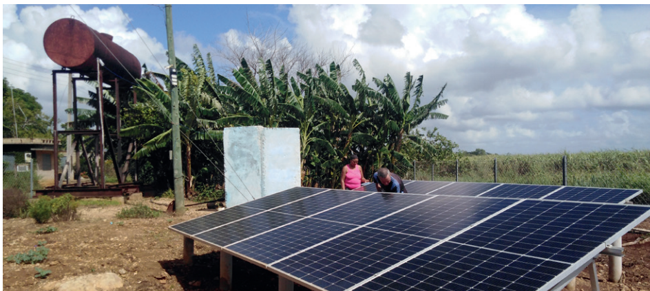
Estación de bombeo en La Juanita, una de las 87 con paneles solares en Ciego de Ávila, por lo que son favorecidos más de 22 mil habitantes.

Población a beneficiarse con los mil 312 equipos de bombeo: alrededor de 793 mil 290.