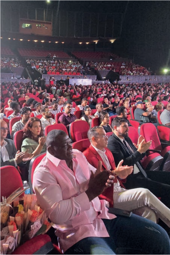
El documental Mijain forma parte de las opciones relacionadas con el séptimo arte estrenado este fin de semana.

El eterno sol de este archipiélago lanza sus rayos más fuertes en julio y agosto. La temporada estival es también de vacaciones masivas, en las que son bien recibidas opciones recreativas variadas. Excursiones, visitas a museos, zoológicos, cine, ballet, playas, juegos para los más pequeños... en función del disfrute y el esparcimiento de un pueblo que lo merece