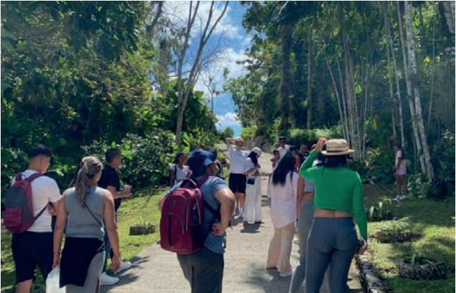
El Orquideario de Soroa es una de esas maravillas de nuestra naturaleza.