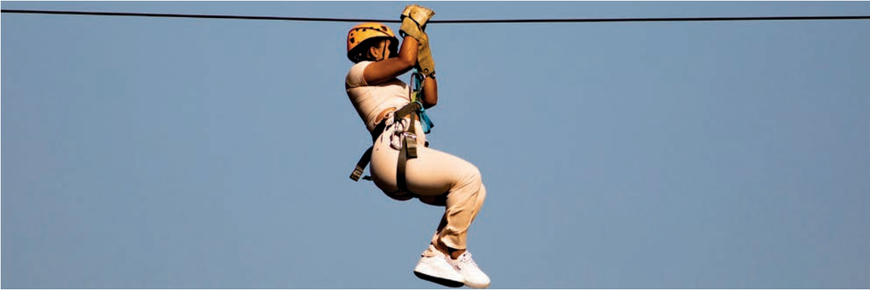
Canopy en Las Terrazas, como parte de las visitas guiadas que promueven el turismo nacional en la provincia de Pinar del Río.