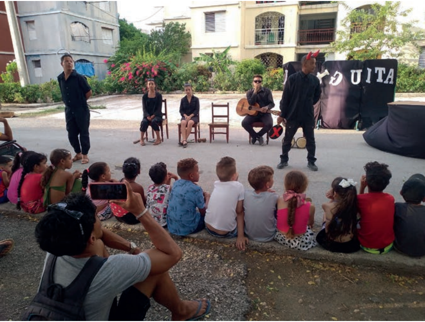
La Uneac de Granma ha diseñado un programa de actividades para las comunidades urbanas y rurales.