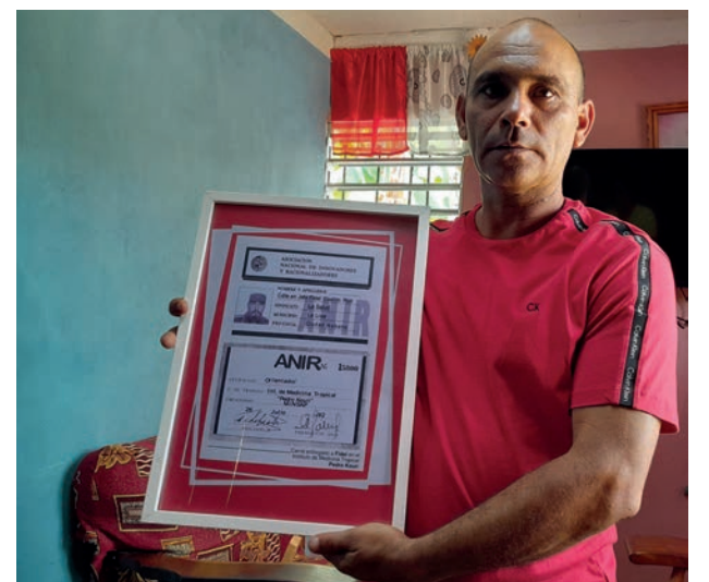
Yanier guarda orgulloso un cuadro con la reproducción del carné de anirista del Comandante en Jefe Fidel Castro Ruz, el Innovador Mayor.

Los beneficios vistos hasta aquí surten efecto desde finales del año 2023, por suerte no se limitaron al territorio holguinero, pues se han implementado también en el Lácteo de Las Tunas y en los frigoríficos de Granma e Isla de la Juventud.