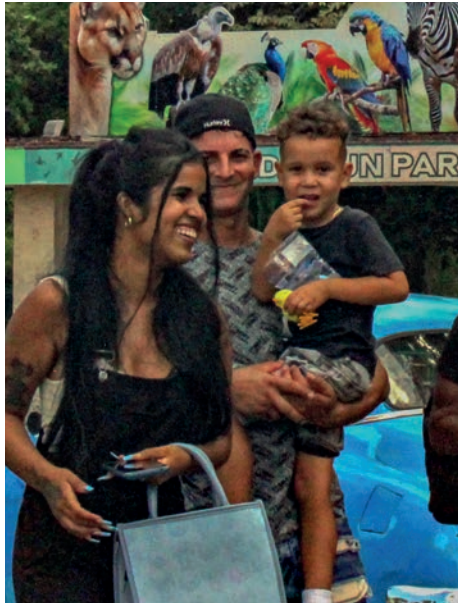
El Zoológico de 26 continúa siendo una opción recreativa.