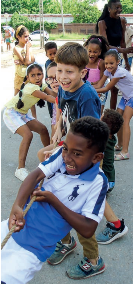
Los juegos infantiles en la comunidad se agradecen.