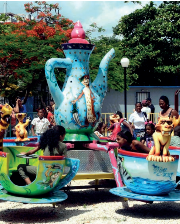
El parque de La Maestranza ofrece a los más pequeños nuevas atracciones.