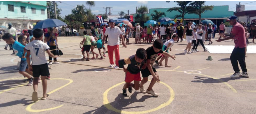
Deporte y recreación: preferencia con muchos adeptos en Ciego de Ávila.