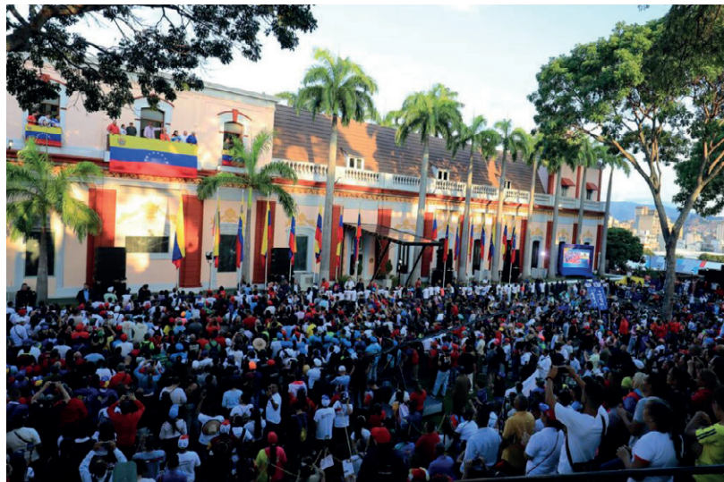
“Somos una fuerza de verdad. Somos los hijos y las hijas de Chávez, destinados a gobernar esta patria”, dijo el presidente Nicolás Maduro ante el pueblo reunido en Miraflores el pasado 28 de julio.

Venezuela ha sido paciente. En los últimos años ha demostrado que puede avanzar en la construcción de un modelo democrático propio con una arquitectura de poder que resiste y se actualiza según sea necesario.