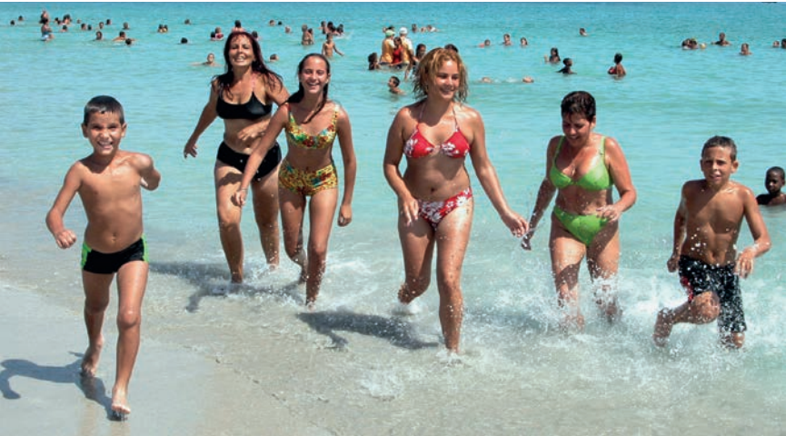
Alegría bajo el sol.