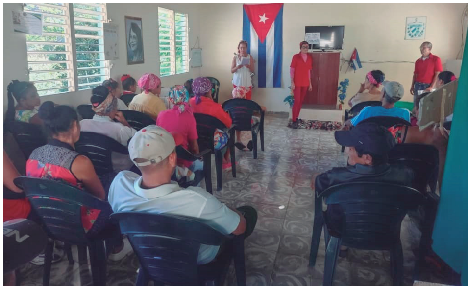
Sala de televisión Comunidad La Escondida, en Guisa.

Mucho ha luchado para incluirse y mantenerse entre las banderas del deporte cubano. El presente ciclo olímpico se presenta como otra prueba en la que habrá que retar metas espinosas y casi imposibles. Sin embargo, para ellos quizás sea otro capítulo más de esa eterna pelea por seguir aportando triunfos y grandeza.