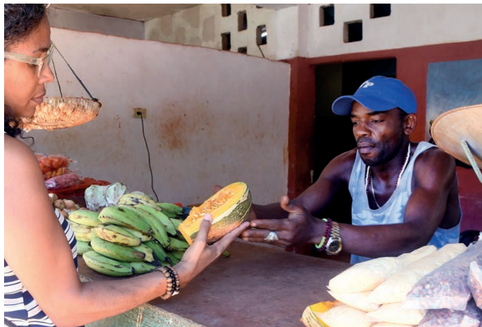
El acceso a los alimentos constituye una de las principales preocupaciones de la población.

Un dato curioso, la Oficina Nacional de Estadística e Información (Onei), al evaluar el comportamiento de precios máximos para los mercados agropecuario y no estatal, publicó que, por ejemplo, un huevo fresco de gallina costó en mayo pasado en Pinar del Río un máximo de 85