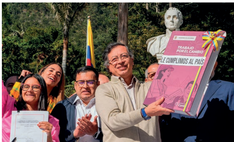
Presidente Gustavo Petro durante la Ley laboral.

En marzo del 2025, el proyecto volvió a hundirse en el Senado, en el cual la oposición lo rechazó sin