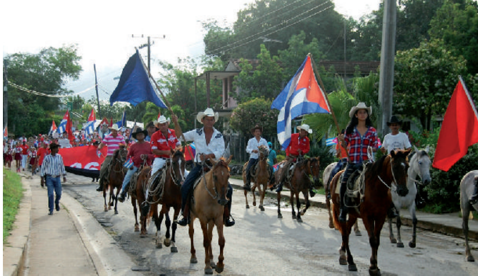
El acto en La Sierrita se caracterizó por el entusiasmo y el colorido.

Como otra forma de respaldo al proyecto social que se construye en nuestro país fue valorado el acto ce-