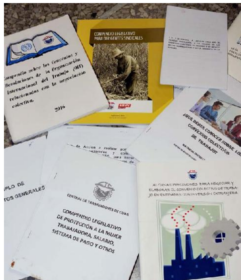
La Esfera de Asuntos Laborales y Sociales de la CTC ha elaborado materiales instructivos sobre los Convenios Colectivos de Trabajo.

• En el 40 % de las entidades revisadas el contenido del Convenio no es objeto de aprobación y chequeo en el consejo de dirección, reunión del buró o de la sección sindical ni en la asamblea de afiliados y trabajadores.