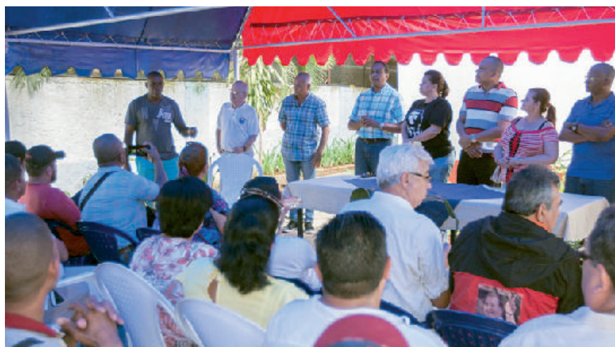
Representantes de organizaciones afiliadas a la FSM se reunieron este sábado en su sede regional, en La Habana, y ratificaron el compromiso con el movimiento sindical cubano.