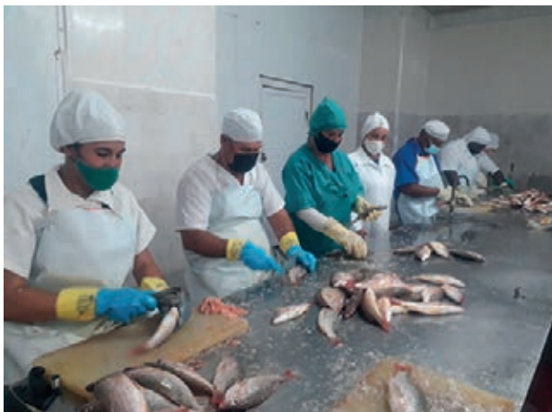
En la industria el trabajo es duro, pero se realiza con interés.

“Las ideas se generan y desarrollan con la participación de los trabajadores, especialistas y directivos. En este proceso se destaca el vínculo con centros científicos de la Universidad Central Marta Abreu de Las Villas (UCLV), en particular por estudiar las posibilidades de las algas y el aceite de tiburón para la elaboración de medicamentos”, aclaró.