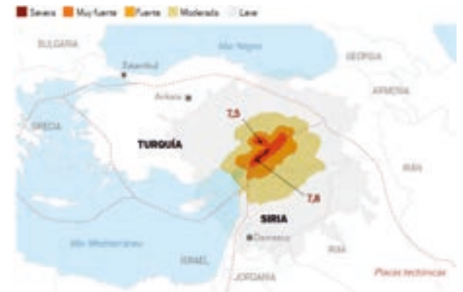
Mapa que describe la intensidad del terremoto ocurrido el pasado 6 de febrero.

La ONU, la comunidad internacional y el mundo libre deberían condenar estos hechos, como hizo el Gobierno cubano de manera enérgica, pero han guardado un silencio cómplice.