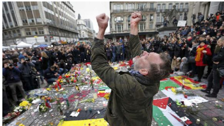
Fuentes europeas aseguran que la investigación sobre los atentados de Bruselas podría durar meses o años enteros. Cinco días después de la masacre las autoridades no tienen la certeza absoluta de poder identificar a todas las víctimas.

Mientras el terror se expande por otras ciudades del mundo, las investigaciones realizadas en Europa refuerzan la tesis de que los atentados del 13 de noviembre (13N) del pasado año en París, y los del 22 de marzo