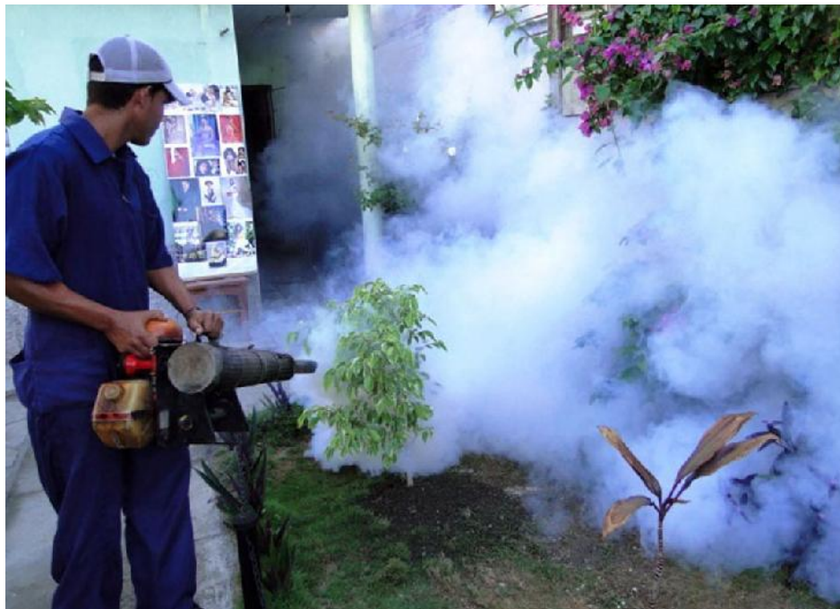
Con el saneamiento ambiental se ha logrado disminuir a nueve los centros de trabajo que esta semana detectan focos de mosquitos.

Comienza este lunes, segunda fase de la campaña intensiva de lucha antivectorial. La batalla tiene que seguir siendo contra el mosquito