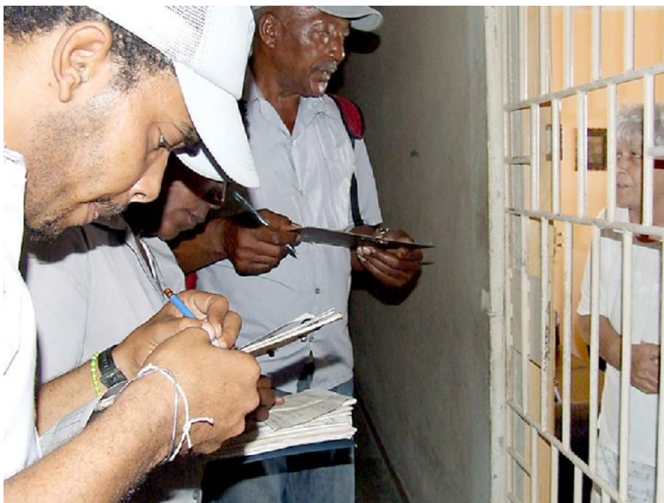
Hay que elevar la calidad técnica de la lucha antivectorial: abrir casas y locales a la fumigación, avisar a tiempo a la población, e integrar el operario de la campaña al equipo básico de salud de cada área.

de zika ni de chikungunya en lo que va de año.