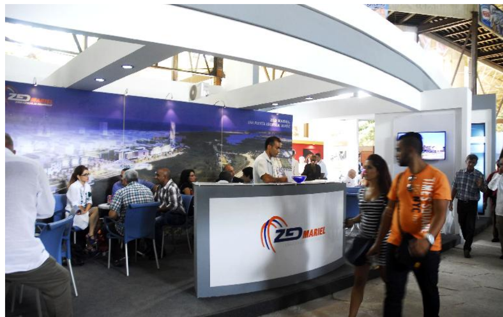
En la XXXIII Feria Internacional de La Habana fueron presentados los primeros ocho usuarios de la Zona Especial de Desarrollo Mariel.

Es decir, que la estrategia financiera del país debe garantizar la sustentabilidad de la reproducción de la economía cubana con sus propios recursos y en el menor tiempo posible para un mayor nivel de vida de los ciudadanos.