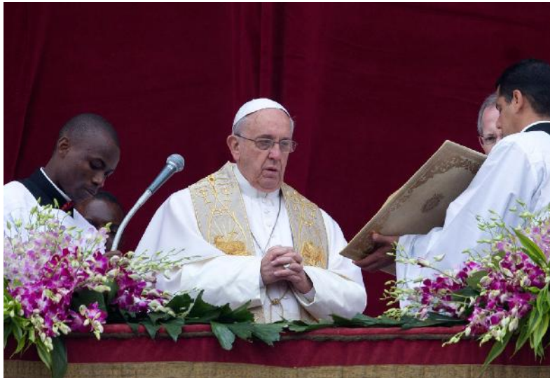
El Papa Francisco presidió este domingo la Misa de la Pascua de Resurrección en la Plaza de San Pedro. El Pontífice no tuvo homilía, sino que leyó su Mensaje Pascual e impartió la tradicional bendición Urbi et Orbi (a la ciudad y al mundo) desde el balcón central de la Basílica. El Santo Padre manifestó que "solo Dios puede llenar con su amor este vacío, estas fosas, y hacer que no nos hundamos, y que podamos seguir avanzando juntos hacia la tierra de la libertad y de la vida". El Pontífice expresó su cercanía a las víctimas del terrorismo, "esa forma ciega y brutal de violencia que no cesa de derramar sangre inocente en diferentes partes del mundo, como ha ocurrido en los recientes atentados en Bélgica, Turquía, Nigeria, Chad, Camerún y Costa de Marfil".