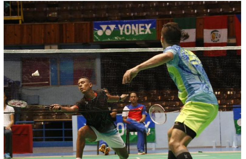
Osleni podría convertirse en el primer clasificado cubano de este deporte en Juegos Olímpicos.

El oro en individual femenino fue para Elisabeth Baldauf, de Austria, primera cabeza de serie. En las duplas de mujeres vencieron las peruanas Daniela Macías y Luz