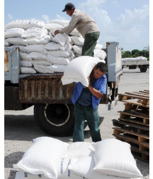
Scenius centra su labor en la búsqueda de fórmulas para el mejor uso de los recursos, un asunto en el que se define el futuro de cualquier entidad.

Y todo ello sin trascender los límites del escenario local, pues asegura