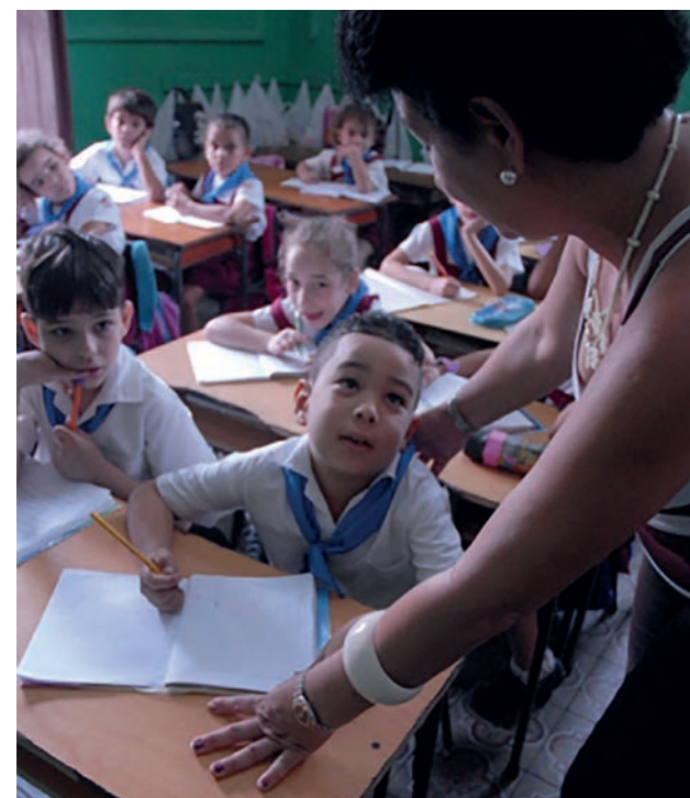
Las mujeres son mayoría entre las personas ocupadas laboralmente en la educación, entre otros sectores. | foto: Agustín Borrego Torres

Ello acentúa la idea de que las vías fundamentales para el incremento de los resultados productivos se encuentran en el aumento de la