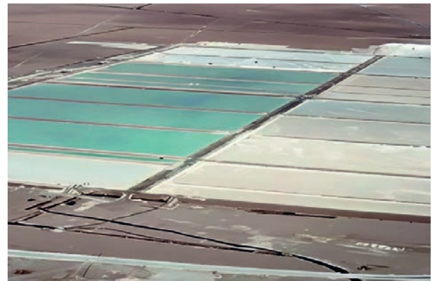
La extracción de litio implica bombear salmuera desde debajo de los salares chilenos hasta piscinas de evaporación.

Esta alianza podrá extraer, hasta el 2060, unas 2,5 millones