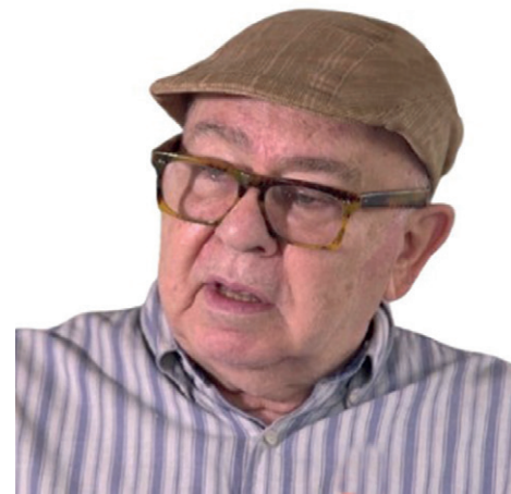
Premio Nacional de Literatura, Miguel Barnet es uno de los más prestigiosos y laureados autores cubanos.

Pero siempre estoy creando. Incluso cuando descanso. Nunca me desvinculo de la poesía. Siempre estoy organizando ideas para mis ensayos, para mis artículos. La mañana en que me levanto y no hago nada me siento incómodo. Creo que hasta soy un mal ejemplo, porque a mí no me gustan las vacaciones. Es más: no entiendo las vacaciones. Mi familia me lleva a la playa y termino aburriéndome soberanamente. Y al final acabo leyendo, escribiendo,