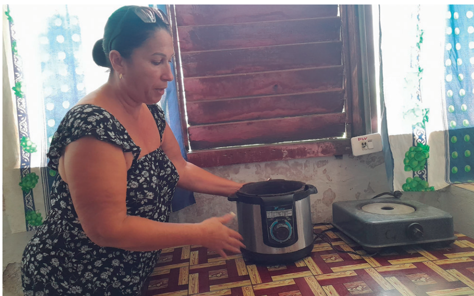
En el Taller Especial para Personas con Discapacidad de Holguín existe precariedad en los implementos para la elaboración de la comida.