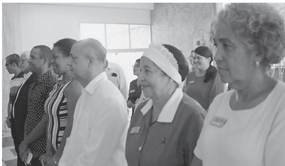
Los trabajadores del hotel reafirman su disposición de continuar ofreciendo un servicio de calidad.