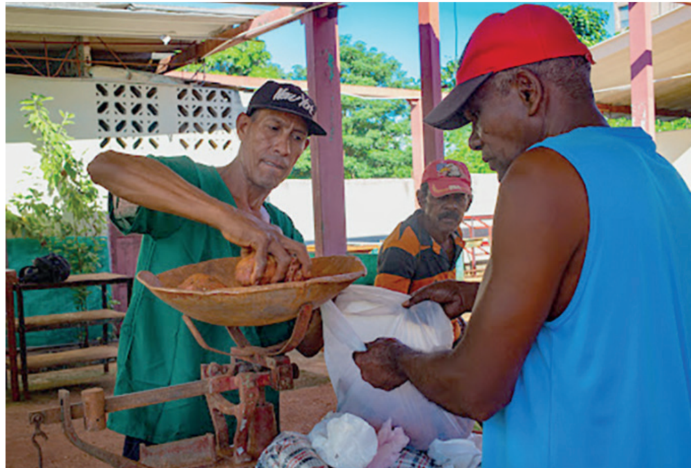
El cliente debe exigir sus derechos.

Algunas personas consideran que poner el tope de los precios no resuelve el problema, y lo que hace es desabastecer el mercado. Al final, los productos se desvían al mercado negro y son más caros.