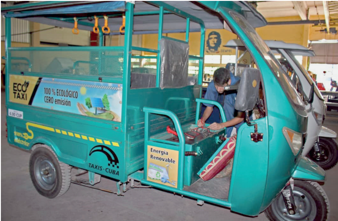
Uno de los productos estrella de la Empresa Roselló.

| Gabino Manguela Díaz