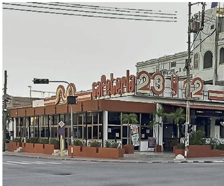
Con el arrendamiento se han recuperado numerosos locales que siguen dando servicio.

Es así que expone las cuotas mínimas mensuales a pagar en pesos cubanos por metro cuadrado de área