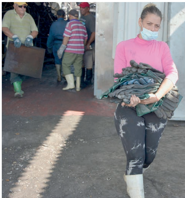
El uso de medios de protección es exigido con rigor.