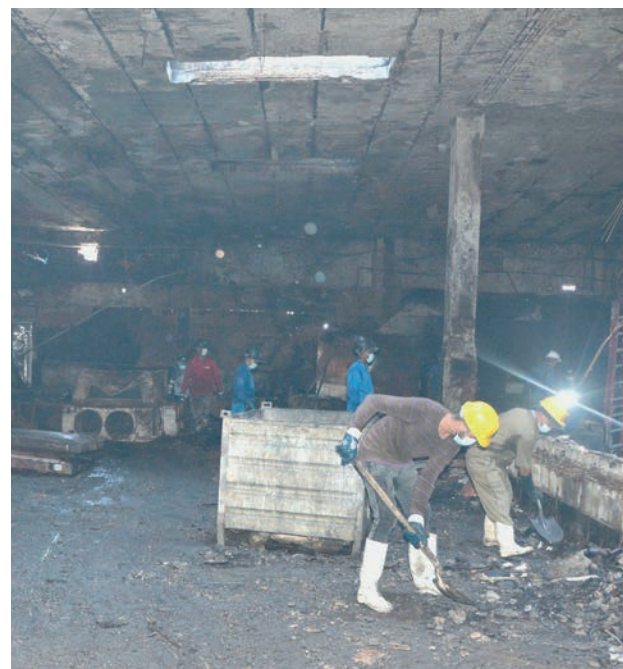
Donde antes hubo industria, hoy solo hay cenizas, pero prima la esperanza de resurgir.

Igualmente avanzan con la Empresa de Refrigeración y Calderas (Alastor) en la concertación de ofertas que posibiliten la sustitución de la red de tuberías por las que circula el amoníaco.