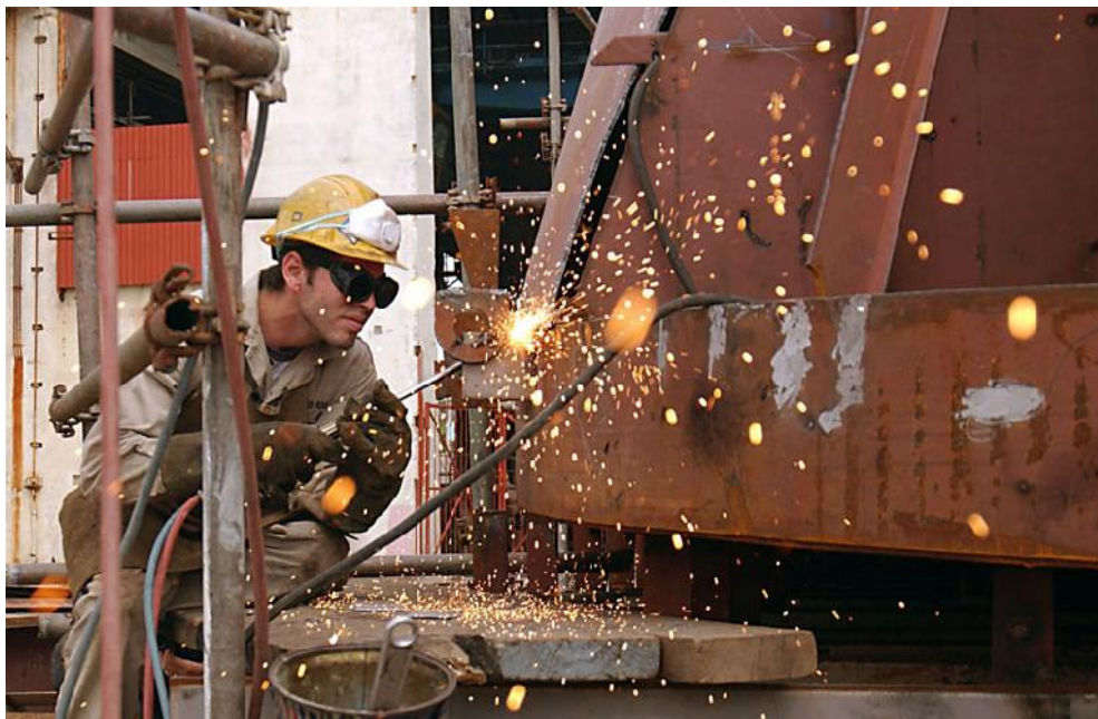
Con una fuerza altamente calificada, el astillero de Casablanca ve limitados sus servicios en la región debido al bloqueo.

La afectación económica provocada por el bloqueo al sector del transporte, desde abril del 2013 al mismo mes del 2014, es de 540 millones de dólares