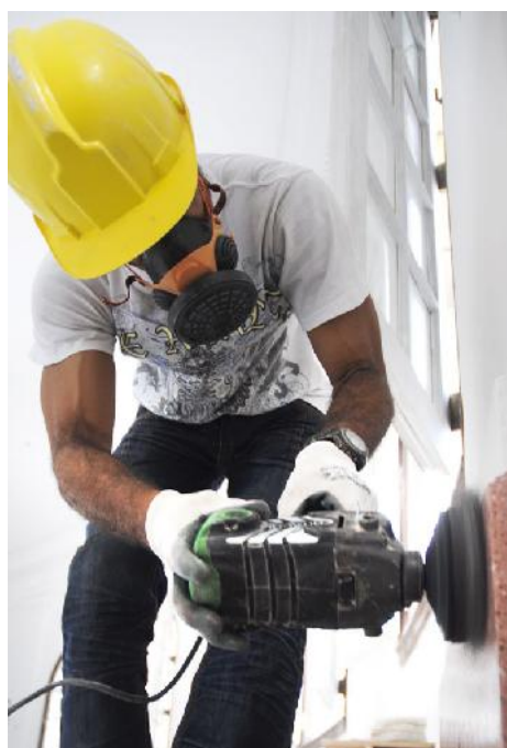
En las labores que levanten polvo —como son la manipulación del cemento a granel y el pulido de paredes y pisos—, así como al trabajar con productos químicos o biológicos, es necesario emplear caretas o nasobucos.