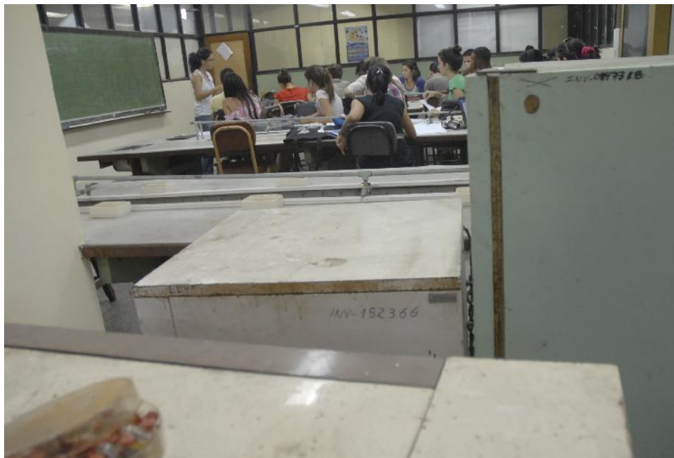
Laboratorio docente de microbiología en la facultad de Biología. En primer plano parte del equipamiento obsoleto y deteriorado que impide realizar las prácticas.

Educación no escapa a los efectos del bloqueo, aun cuando la población cubana no tiene toda la percepción de ello y cuenta con niveles adecuados de este servicio