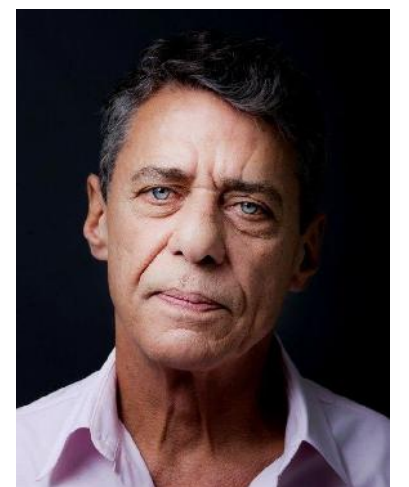
Chico Buarque, escritor y músico brasileño.

Leche derramada se lee paladeando. Son tan vivas las imágenes, es tan fino el humor, tan singulares los episodios, que el lector puede vislumbrar el mundo de un hombre, con sus luces y sombras. | Yuris Nórido