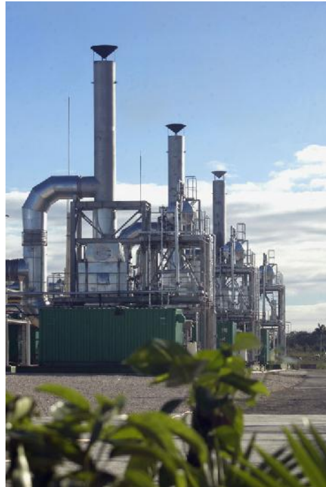
Las piezas de repuesto para grupos electrógenos también son bloqueadas.

En la industria eléctrica también crecen los impactos, pues, es públicamente reconocido que varias plantas generadoras han sobrepasado el tiempo de recibir