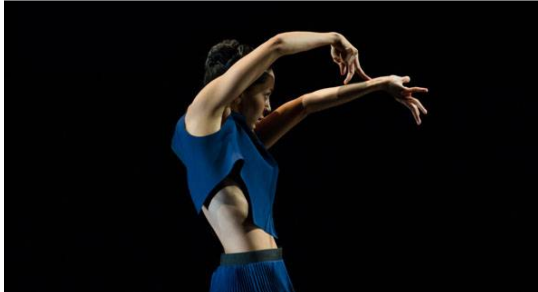
El beso , de Gustavo Ramírez Sansano, una de las propuestas del Ballet Hispánico de Nueva York.