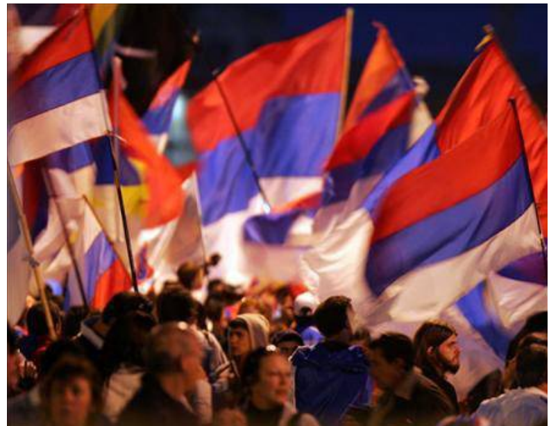
Los partidarios del Frente Amplio apoyaron a sus candidatos.

Tabaré Vázquez y Lacalle volverán a enfrentarse el próximo 30 de noviembre.