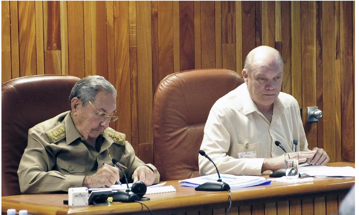
El General de Ejército Raúl Castro Ruz presidió la reunión. A su lado en la foto, Rodrigo Malmierca, ministro de Comercio Exterior y la Inversión Extranjera.

Otro de los temas debatidos en la reunión estuvo relacionado con la