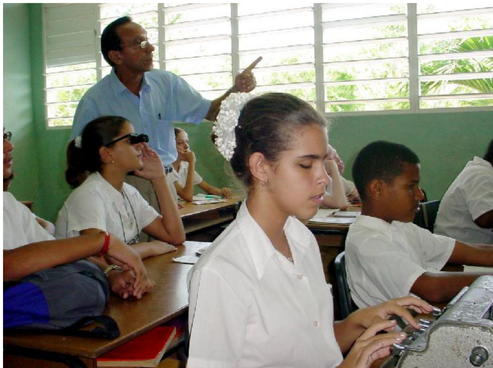
La Educación Especial es de las más afectadas a causa del bloqueo imperialista.

cos se ve limitada en la actualidad, se encarece notablemente su costo o su envío a Cuba (aun siendo bajados de Internet). La afectación se estima en más de mil 500 dólares.