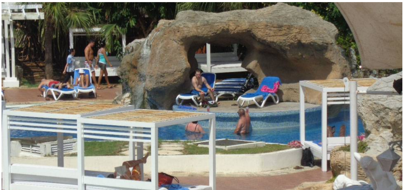
El turismo, oportunidad de negocios.

Las palabras de Marrero Cruz, pronunciadas el pasado 7 de octubre, respondieron a la inquietud de aniristas reclamantes de que en los hoteles de administración mixta no se remunera a los innovadores, un problema que aún no encuentra solución en Varadero, tampoco en el resto del país. Quizás el único derecho por años violado en este tipo de instalación. Resolverlo de inmediato sería inteligente manera de seguir demostrando que el turismo “extranjero” se hace a lo cubano.