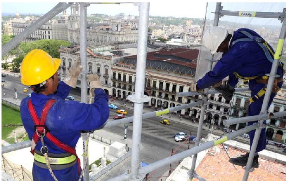
En las alturas es imprescindible usar cinturones, cascos, guantes y los arneses de seguridad para garantizar la debida protección del trabajador.

La búsqueda de ambientes laborales sanos y seguros, y la ejecución de los presupuestos para adquirir los insumos que protegen a los trabajadores deben ser una constante