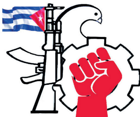
| Ilustración: Malagón

Se impone una vez más denunciar al verdadero culpable y a su política de bloqueo, agresividad y amenaza militar. Al mismo tiempo, ratificamos nuestra vocación humanista, la aspiración de vivir en paz y construir la sociedad con todos y para el bien de todos que soñó José Martí y Fidel Castro