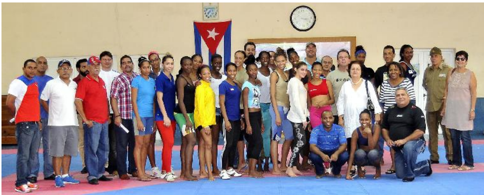
Los premiados se reunieron con los equipos nacionales de taekwondo. | fotos: José Raúl Rodríguez Robledo