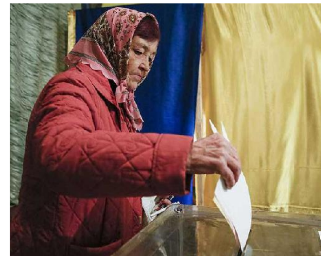
Tensa calma en las elecciones en Ucrania.

Un sondeo a pie de urna dio al Bloque Solidaridad, de Petró Poroshenko, la victoria en las elecciones a la Asamblea Legislativa efectuadas ayer en casi todo el territorio de Ucrania. Según reportes de prensa primó la calma y la baja participación, pues según la plataforma cívica Opora, solo el 36,2 % de los votantes acudieron a las urnas.