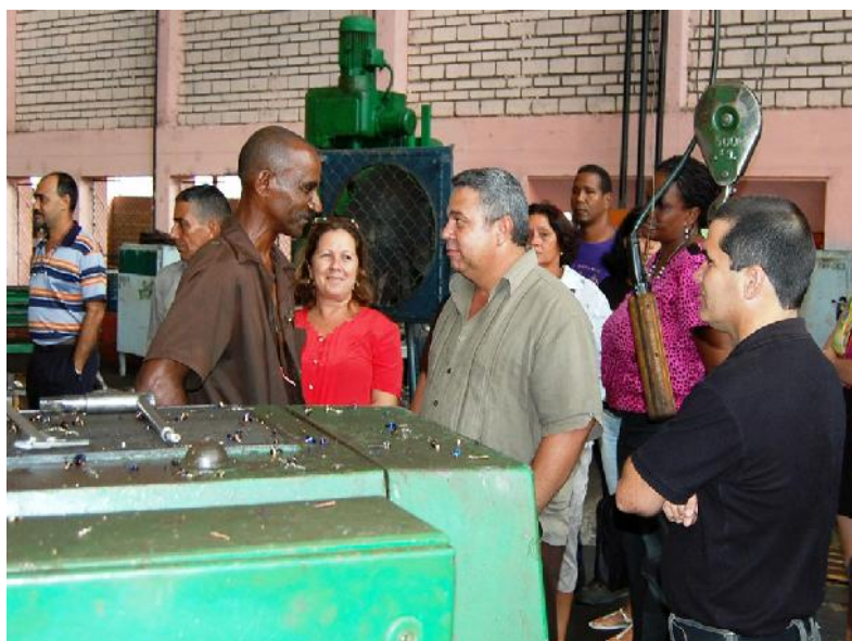
Ulises Guilarte, al dialogar con trabajadores y directivos en la Empresa Oleohidráulica José Gregorio Martínez, insistió en la necesidad de explotar más las reservas potenciales de las industrias cubanas.

El Secretario General de la CTC visitó y dialogó con trabajadores y directivos de la empresa oleohidráulica, dedicada a producciones y servicios básicos para múltiples sectores productivos y de servicios del país, y del hospital provincial donde conoció de la marcha de las inversiones y reparaciones que allí se ejecutan para mejorar las condiciones de estancia para los pacientes y sus familiares y los trabajadores del centro.