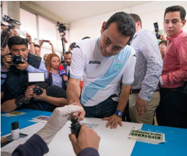
Jimmy Morales, del Frente de Convergencia Nacional-Nación ganó las presidenciales de Guatemala.

Datos preliminares ofrecidos por el Tribunal Supremo Electoral (TSE) en la noche del domingo, poco después de cerrar los centros de votación, dieron por vencedor en el balotaje a Jimmy Morales, del Frente de Convergencia Nacional-Nación, reportó Prensa Latina.