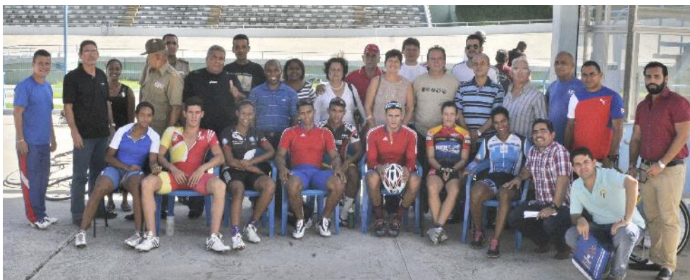
En el velódromo nacional Reinaldo Paseiro compartieron con los equipos de velocidad.