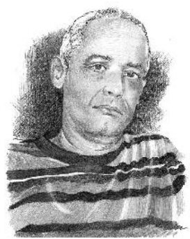
Heriberto Rosabal Ilustraciones: Malagón