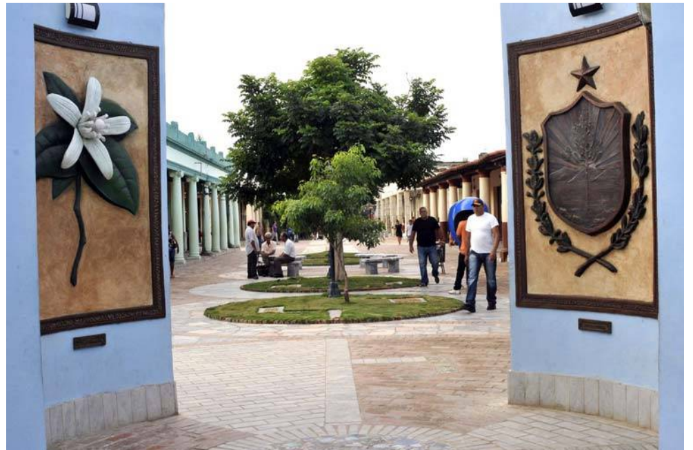
El bulvar engalanado con el tradicional mármol isleño muestra a los visitantes sus símbolos identitarios.

No obstante, se aprecian otras acciones inmediatas como la recuperación del emblemático hotel Colony y uno de sus eventos más llamativos: Fotosub; en tanto continúa pendiente la explotación de la zona sur como atractivo turístico, un entorno casi virgen y de incontables valores naturales.