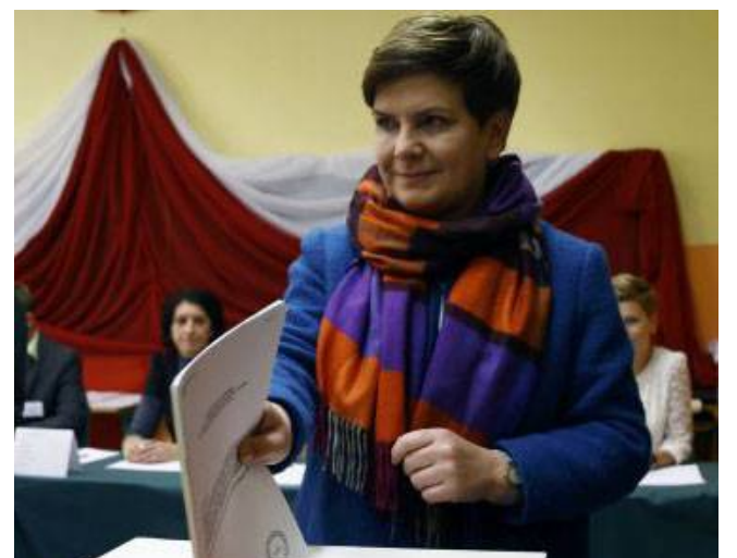
Beata Szydlo, de PiS, virtual ganadora en Polonia.

Esta votación frustró las intenciones de reelección de la actual primera ministra, Ewa Kopacz, cargo para el cual el PiS propone a la antropóloga Beata Szydlo, defensora del catolicismo y contraria a seguir las normativas dictadas desde Bruselas.