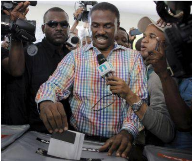
Jude Celestin, uno de los candidatos a la presidencia de Haití.

Al menos 10 mil agentes de la Policía Nacional de Haití resguardaron la tranquila marcha de estos comicios y contaron con el apoyo de mil 502 miembros de la Misión de Verificación de Naciones Unidas en Haití, de ellos, 800 militares y el resto auxiliares.