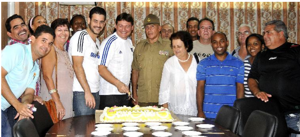
Los primeros lugares picaron el cake durante la celebración.