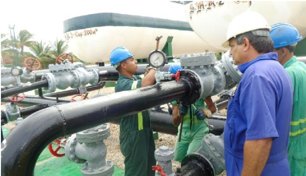
El bloqueo obliga a sustituir 30 de estas bombas.