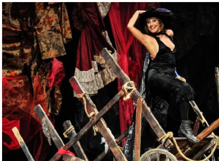
Con la presentación de Charenton , el Festival rindió homenaje a uno de los más emblemáticos colectivos teatrales cubanos: Teatro Buendía, que está celebrando su aniversario 30.