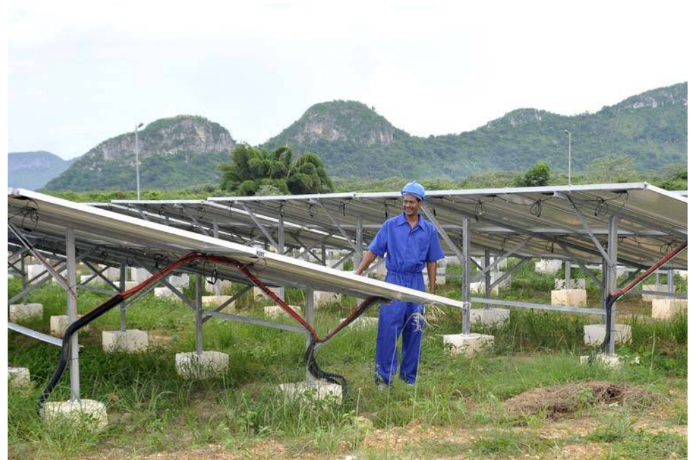
Un nuevo parque fotovoltaico aporta energía para todo el territorio.