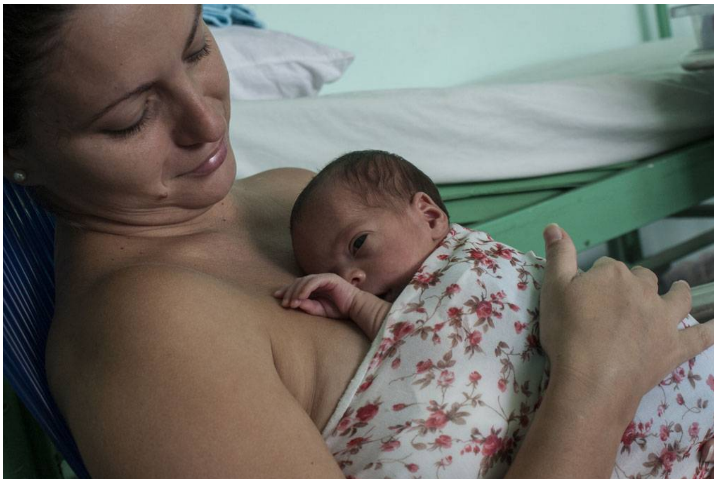
El contacto temprano piel a piel es probablemente uno de los períodos más sensibles que experimenta la madre del bebé prematuro.