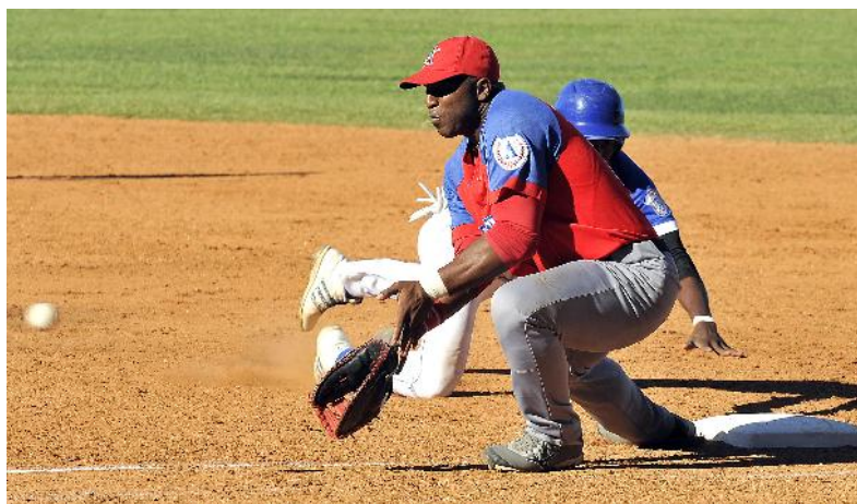
La defensa aún tiene mucho que mejorar.