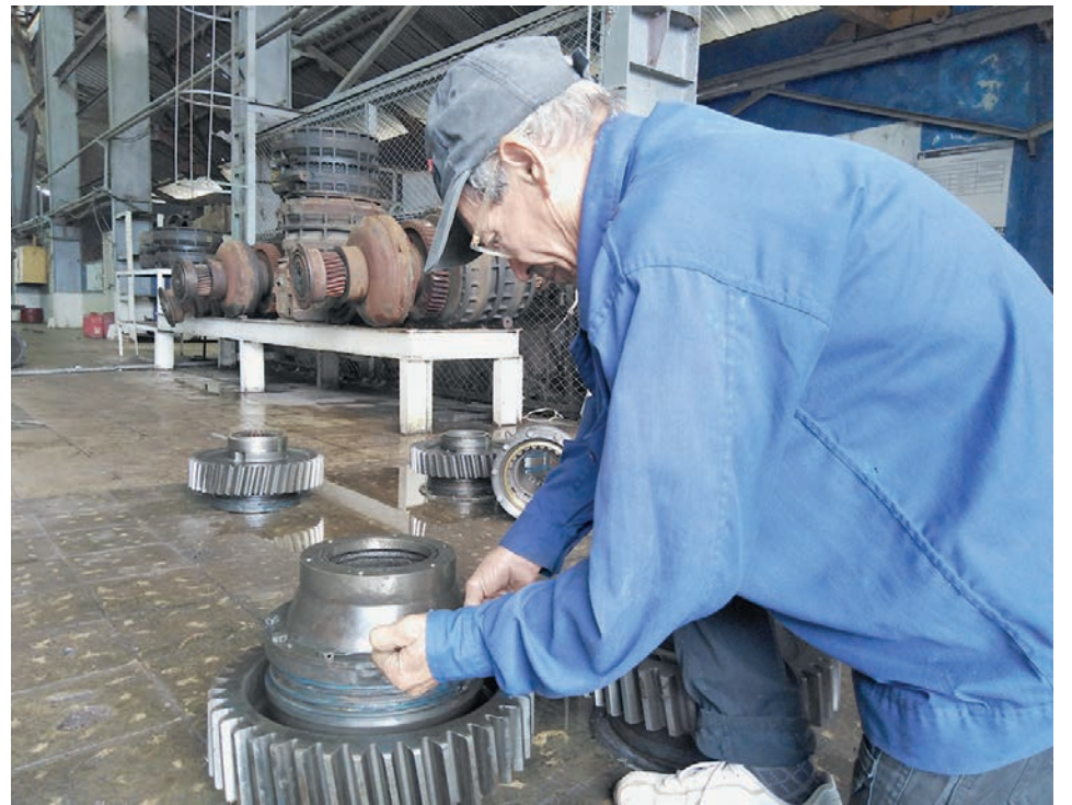
La vitalidad de la técnica ferroviaria en manos de los innovadores.

“Debemos llevar 195 carros jaula a la contienda para la transportación de caña, están listos 184; y seis locomotoras preparadas para arrancar, de las 10 previstas. Lo que falta por hacer no será impedimento porque, además, tenemos el personal calificado para lograr con eficiencia