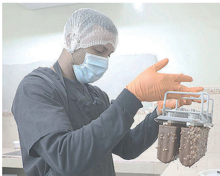
En plena producción la planta de helados, sin duda, el corazón de esta mipyme.

“Ahora hay más madurez, una base económica fuerte y muchos deseos de crecer en el negocio de productos lácteos, básicamente helados y yogur. Estamos muy satisfechos, y eso se siente al máximo, tanto que a veces no dormimos, pues siempre estamos enfocados